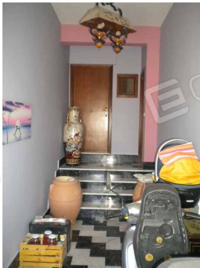
Foto n.4 – Ingresso/Corridoio e porta di accesso al terrazzo superiore