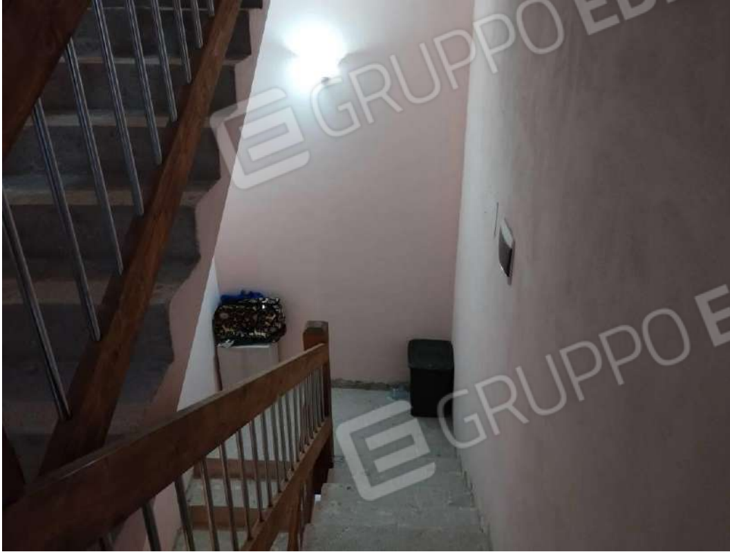
IMG 25_Vano scala