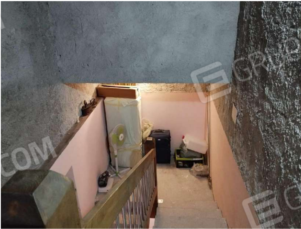
IMG 32_Vano scala