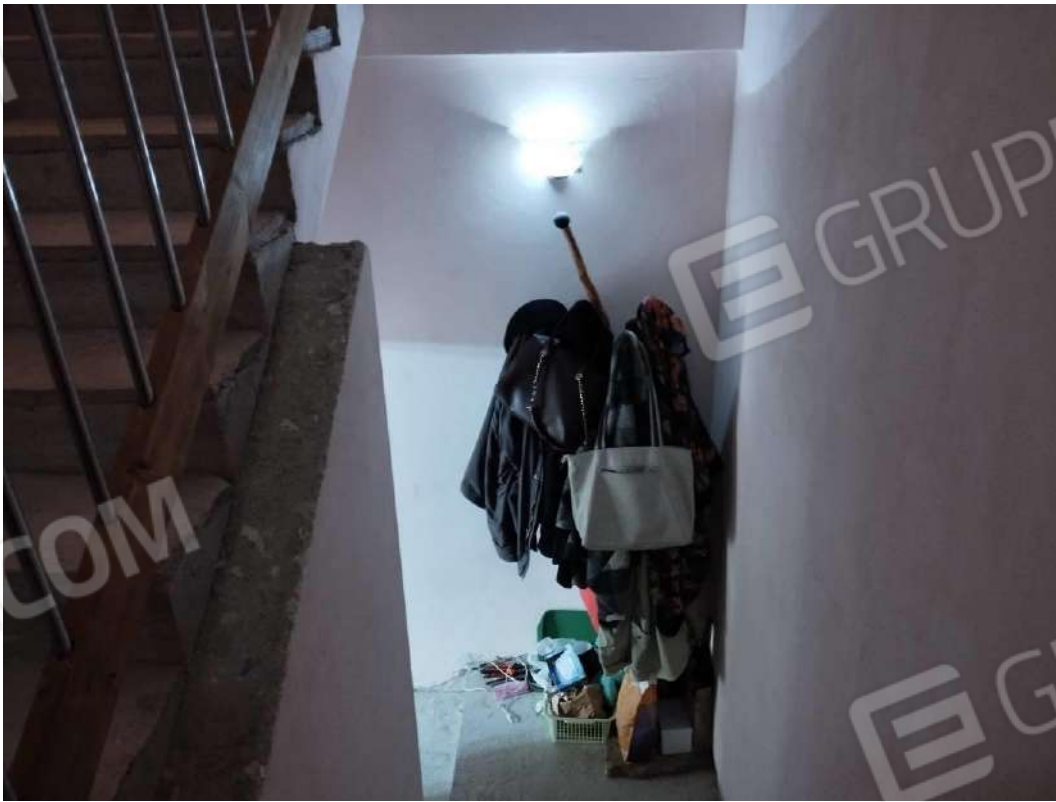
IMG 10_Vano scala