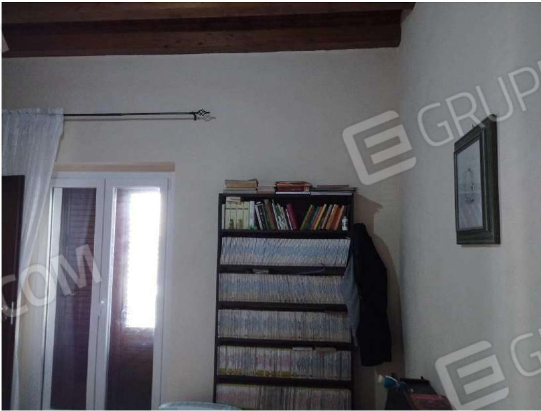
IMG 12_Camera da letto