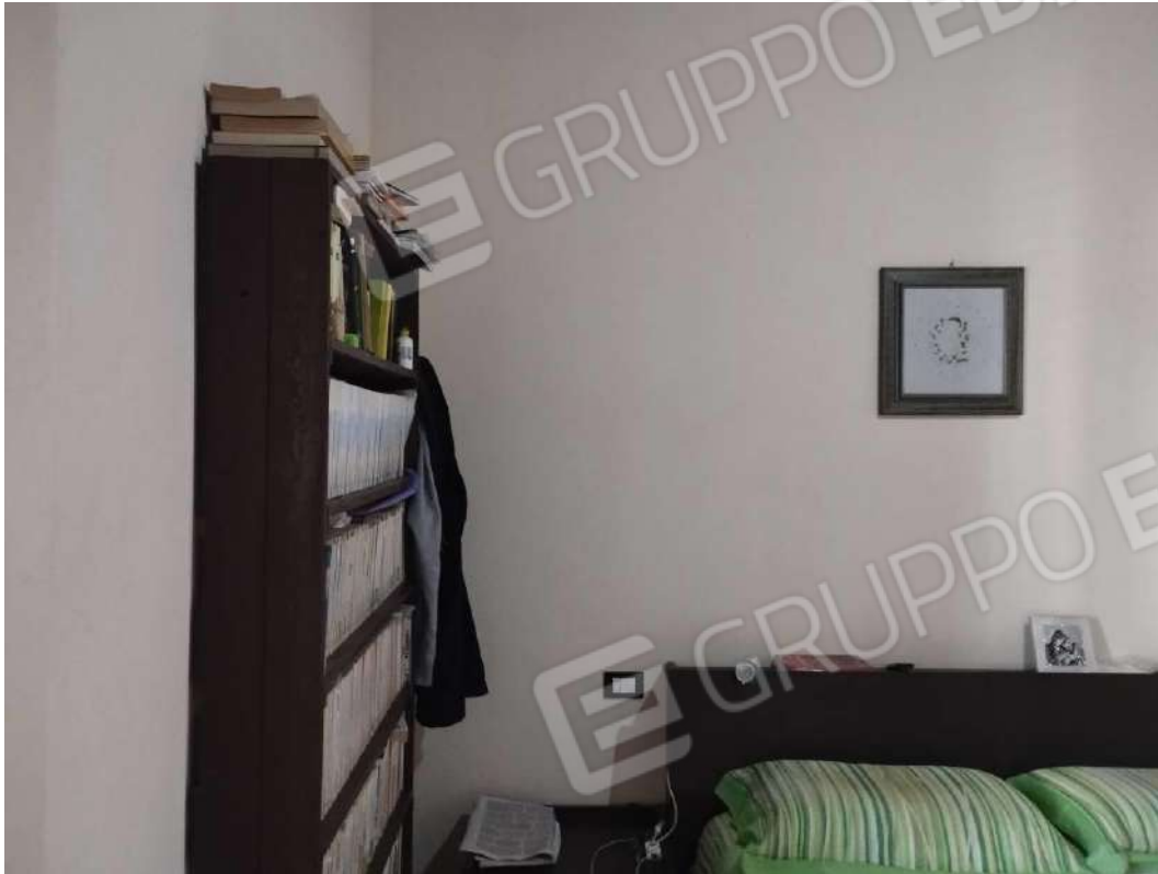
IMG 13_Camera da letto