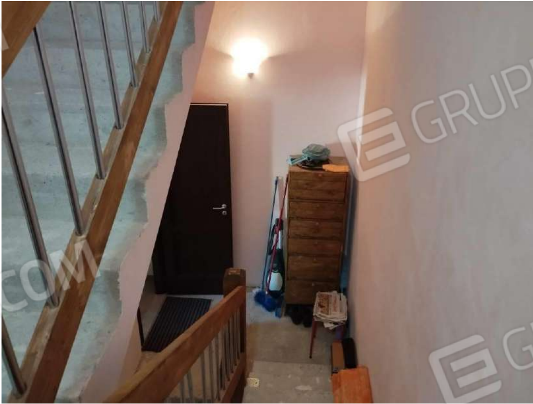
IMG 26_Vano scala