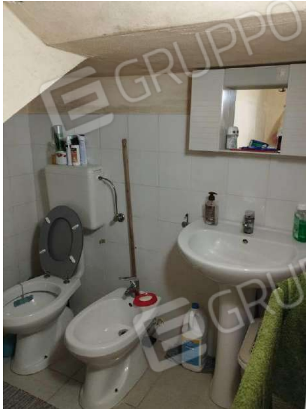
IMG 7_W.C. sottoscala