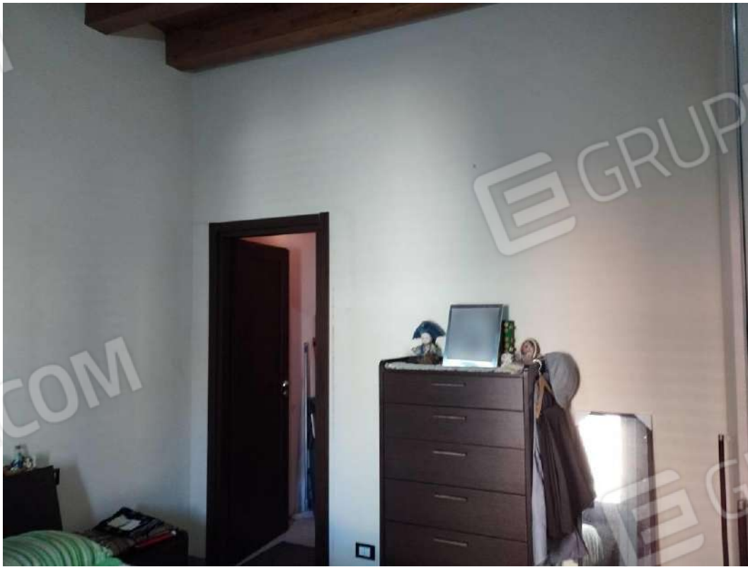
IMG 14_Camera da letto