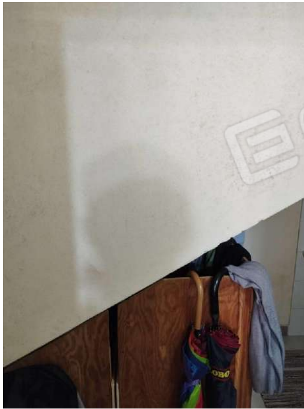
IMG 8_W.C. sottoscala