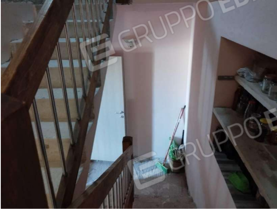
IMG 31_Vano scala