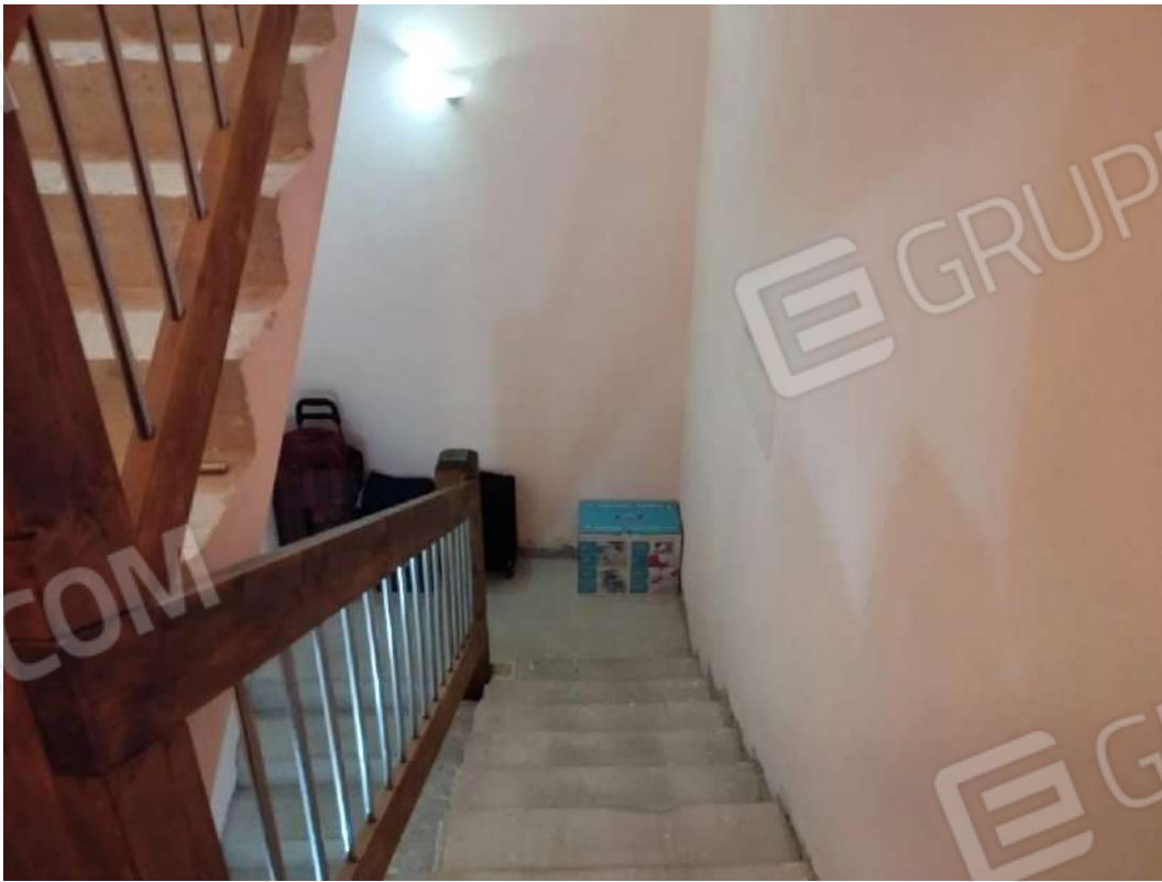
IMG 18_Vano scala