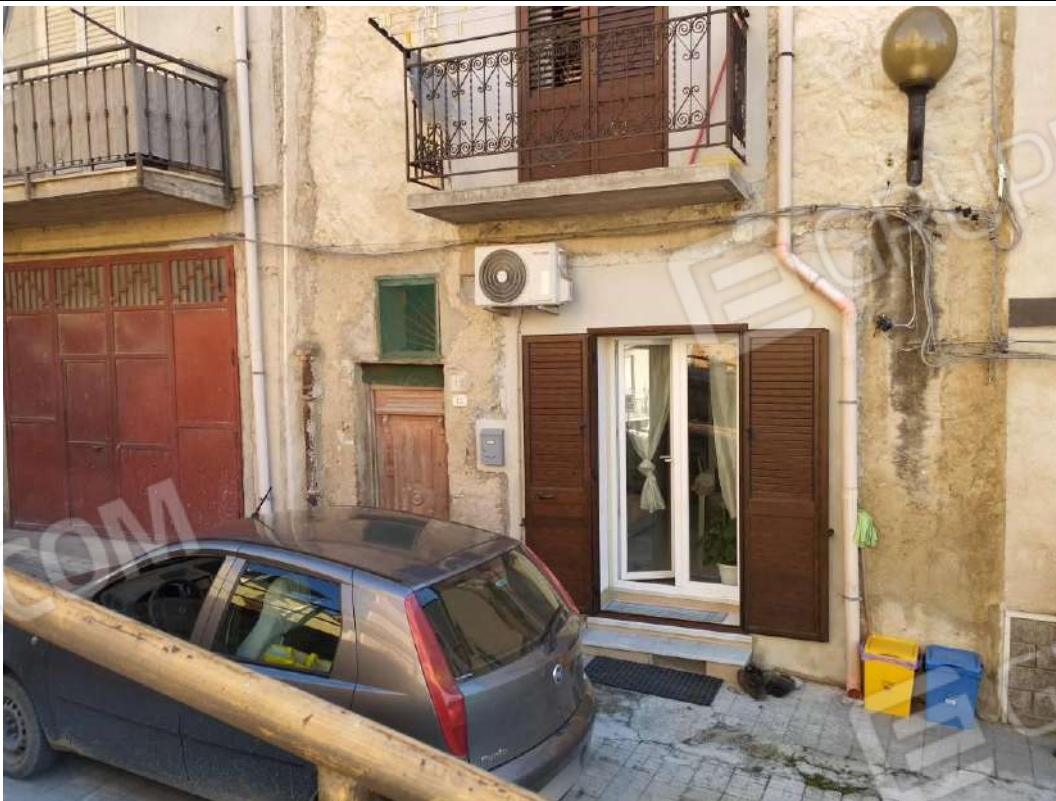
IMG 2_Prospetto Nord