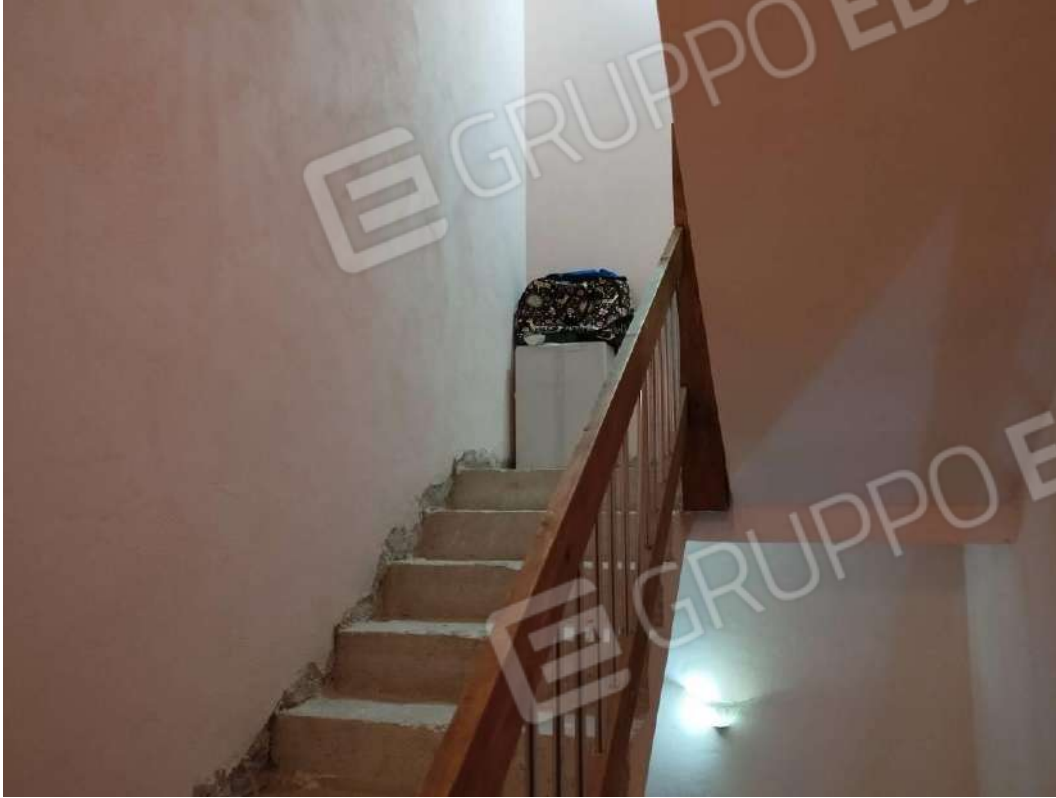
IMG 17_Vano scala