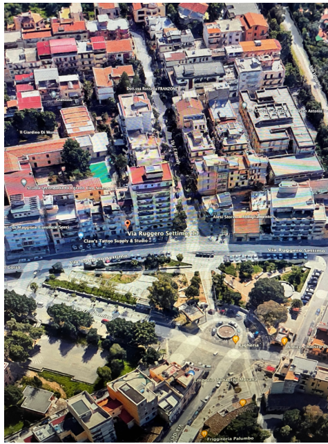
immagine n. 3 fotografia aerea aggiornata

QUESITO 2: elencare ed individuare i beni componenti ciascun lotto e procedere alla descrizione materiale di ciascun lotto