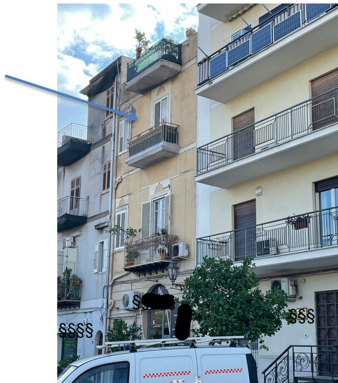
Immagine 4 – prospetto dell'edificio

QUESITO 2: elencare ed individuare i beni componenti ciascun lotto e procedere alla descrizione materiale di ciascun lotto