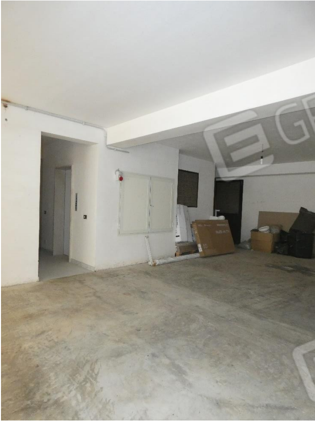
FOTO 32 e 33: LOCALE A PIANO TERRA ADIBITO A POSTI AUTO E INGRESSO