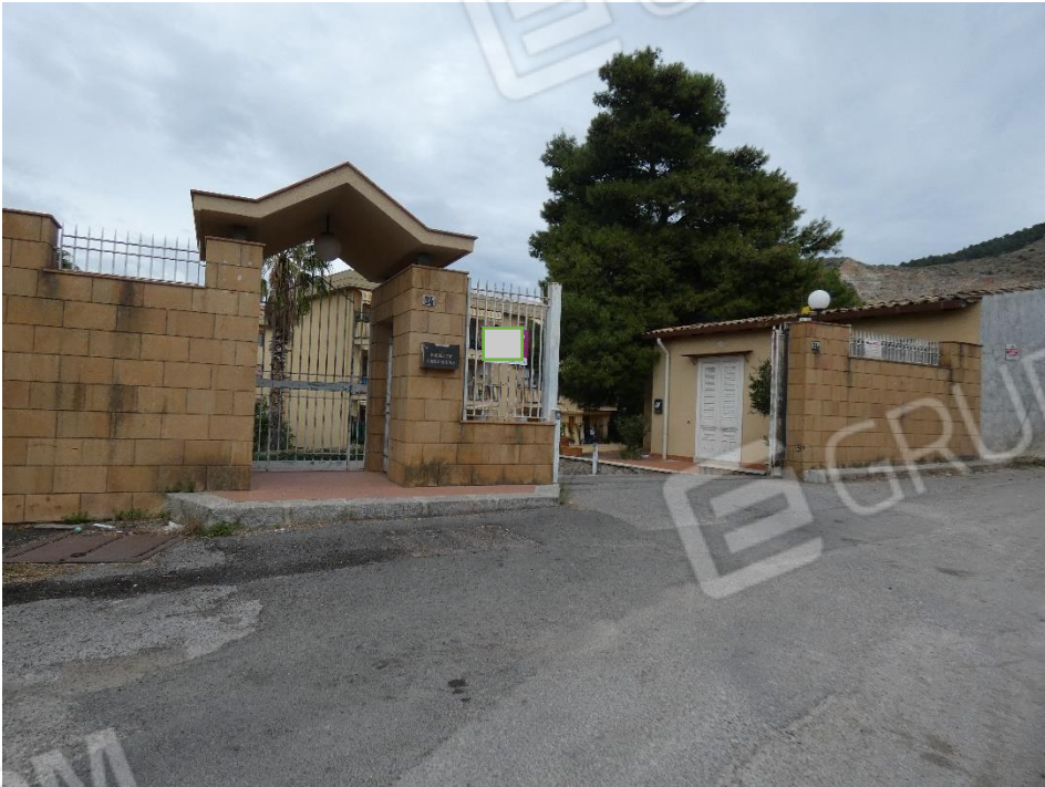
FOTO 1 e 2: CANCELLO D'INGRESSO AL COMPLESSO RESIDENZIALE, VIALE D'INGRESSO