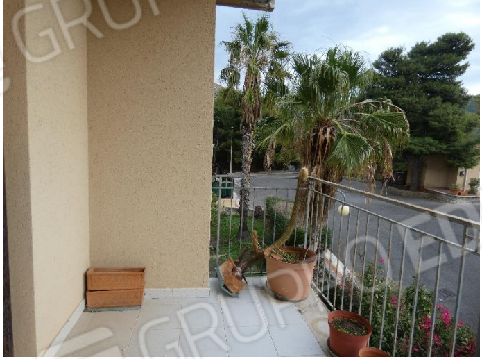
FOTO 22 23 24 e 25: BALCONE DEL VANO CUCINA E BALCONE VANO LATO NORD-EST