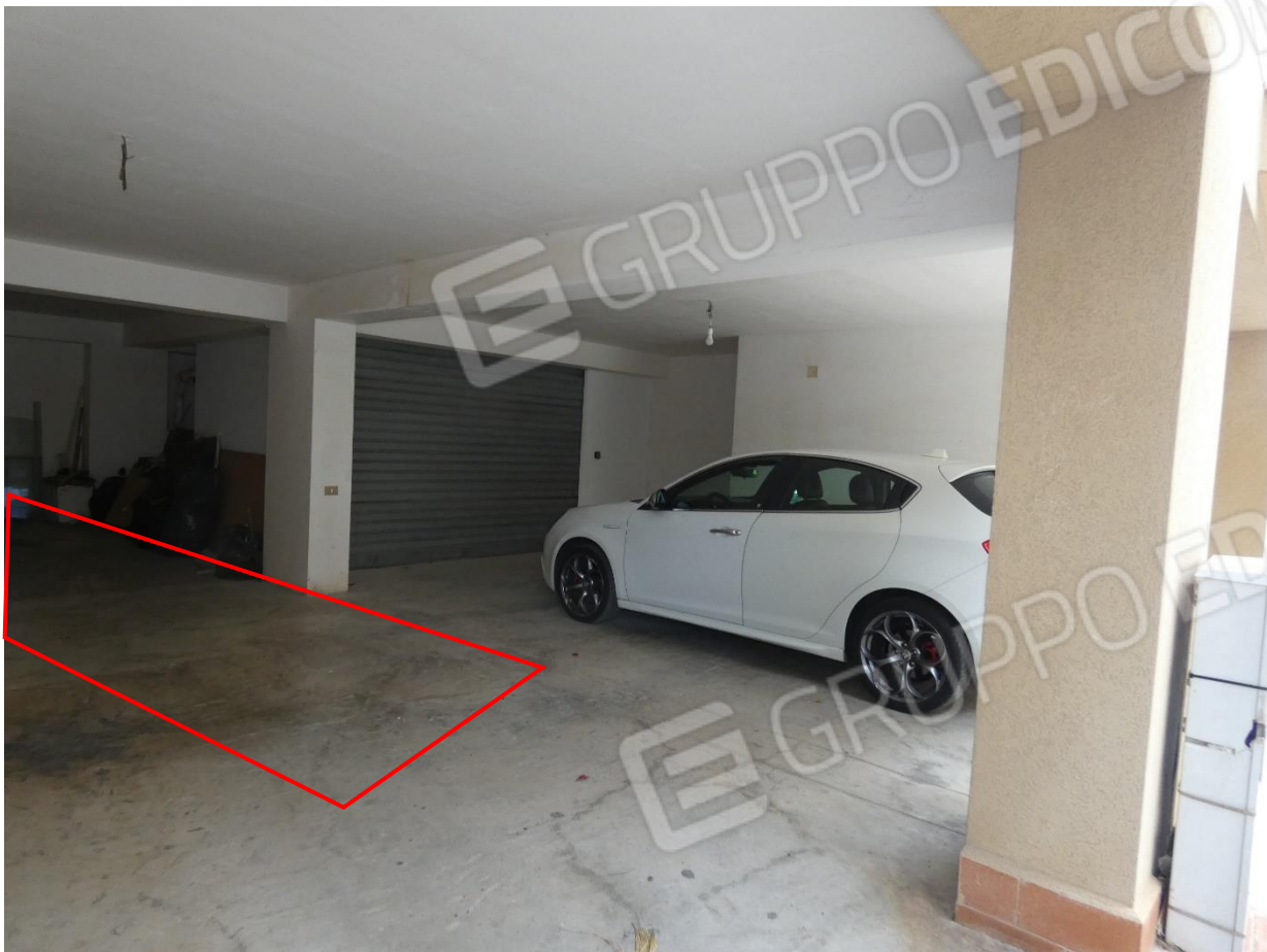
30 e 31: POSTO AUTO (LINEA ROSSA CHE DELIMITA LO SPAZIO CORRISPONDENTE IN MANIERA MERAMENTE INDICATIVA E NON IN SCALA)