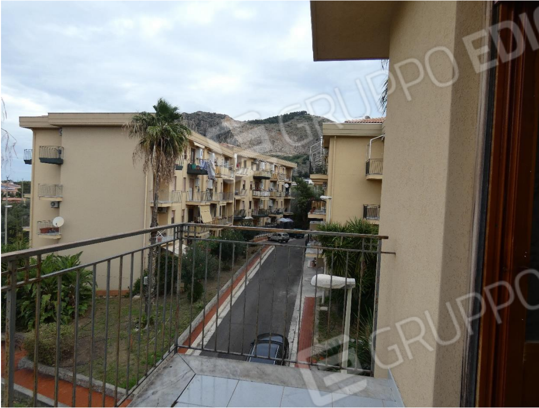
FOTO 26 e 27: BALCONE LATO SUD-OVEST E VISTA LATO NORD-EST DAL BALCONE LATO CUCINA