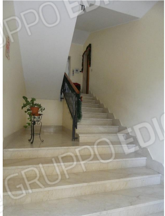
FOTO 7, 8 9 e 10: PROSPETTO LATO VIALE, SCALA CONDOMINIALE E PORTA DI INGRESSO DELL'APPARTAMENTO