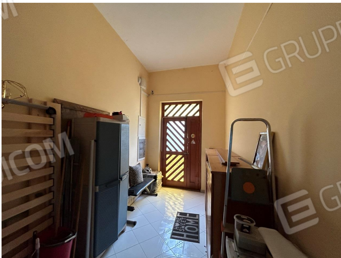
INGRESSO VANO SCALA - COMUNE ALL'APPARTAMENTO ED AL LASTRICO SOLARE