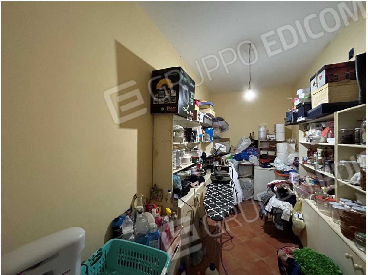
RIPOSTIGLIO – DISPENSA