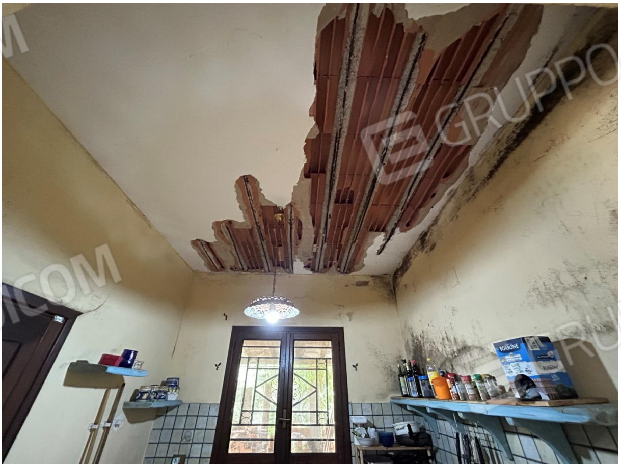
SOLAIO DELLA CUCINA CON SFONDELLAMENTO DELLE PIGNATTE