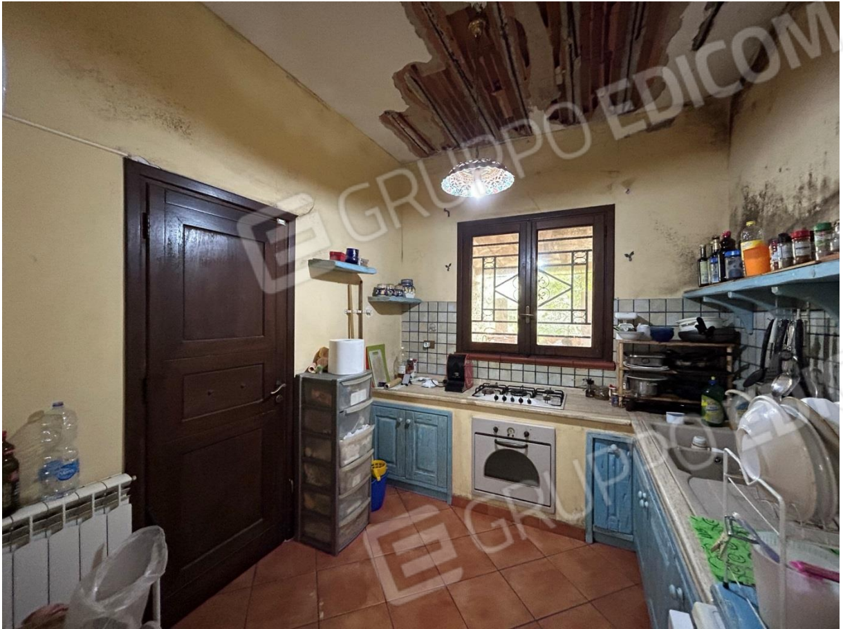
CUCINA CON PORTONCINO DI INGRESSO