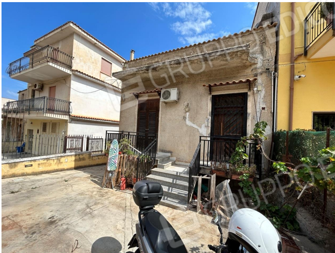
AREA ESTERNA DI INGRESSO COMUNE AI DUE APPARTAMENTI