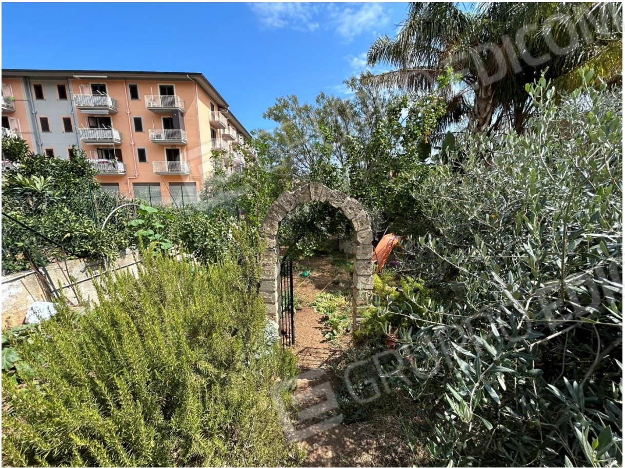
GIARDINO ESTERNO DI PERTINENZA