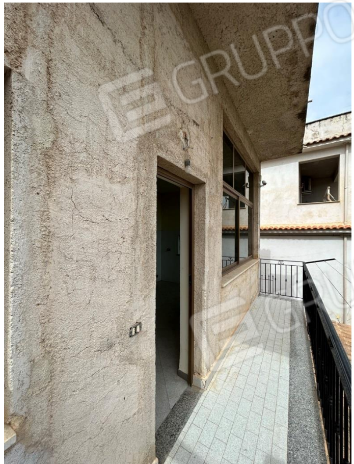
BALCONE FRONTE GIARDINO