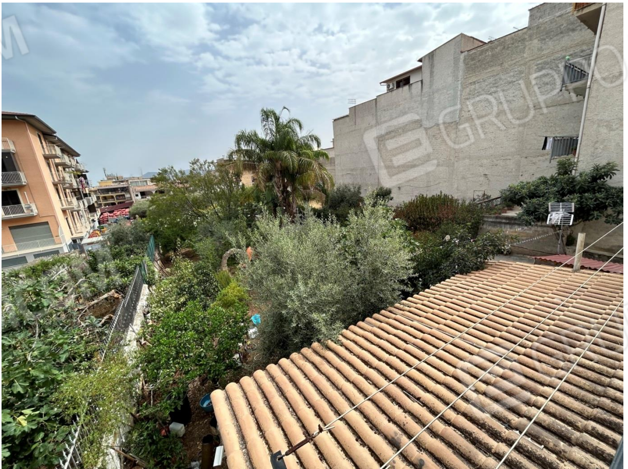
AFFACCIO VERSO IL GIARDINO INTERNO