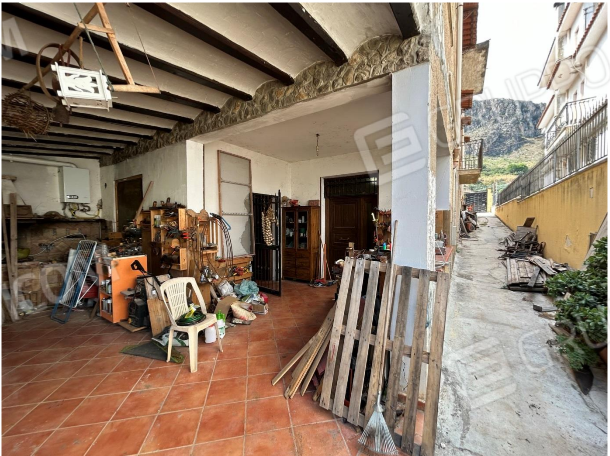
TETTOIA DA DEMOLIRE