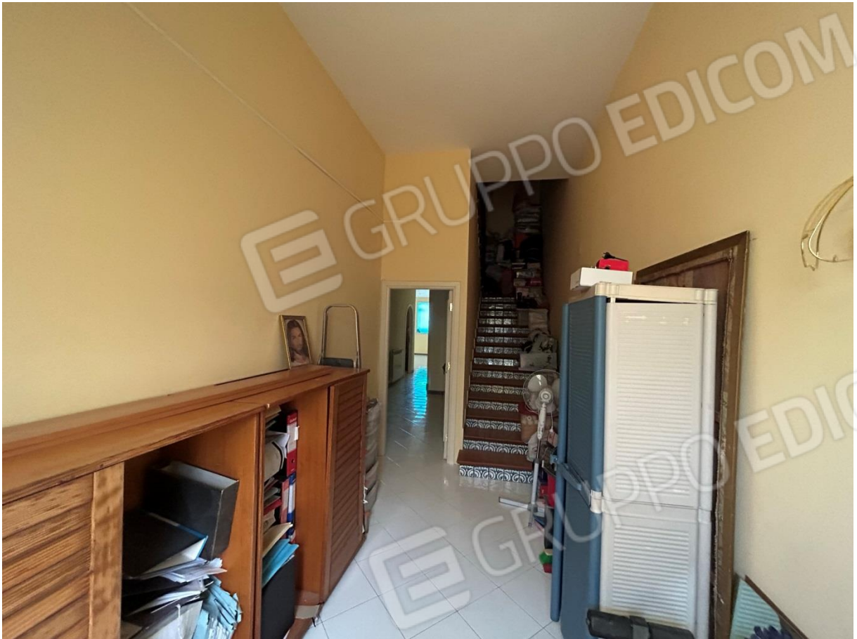
INGRESSO APPARTAMENTO AL PIANO TERRA RIALZATO