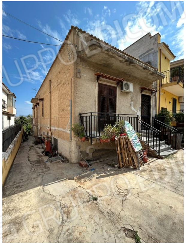
CORRIDOIO DI ACCESSO AL PIANO SEMINTERRATO