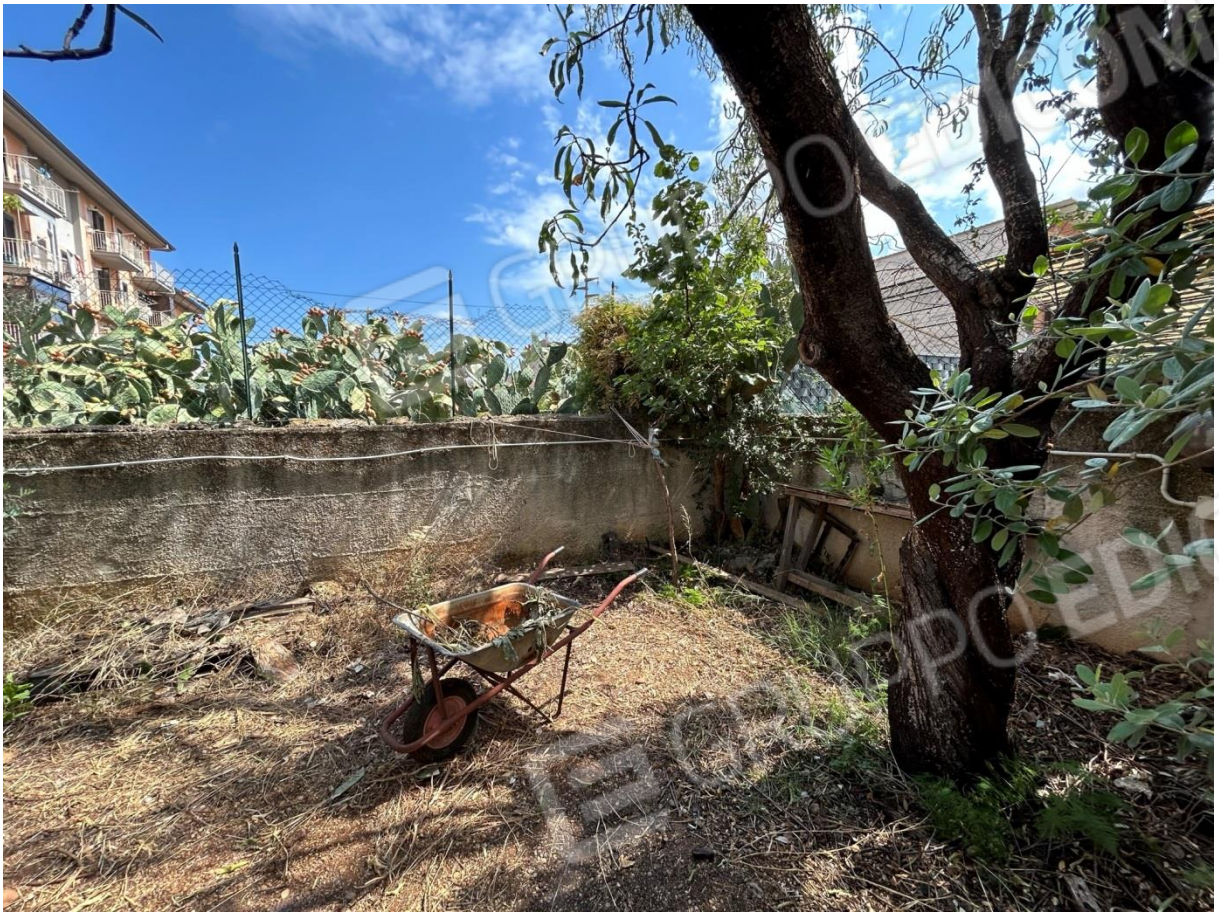
GIARDINO ESTERNO DI PERTINENZA