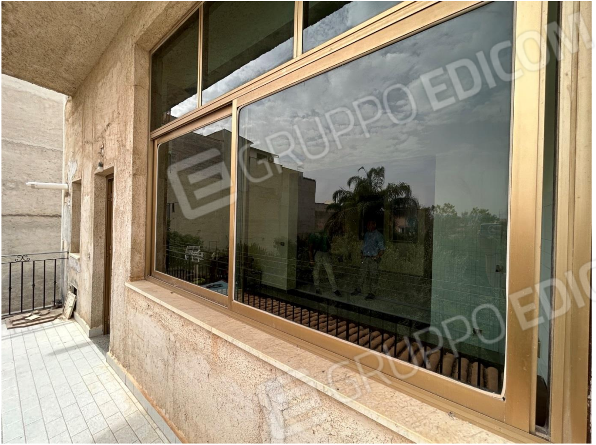
BALCONE FRONTE GIARDINO