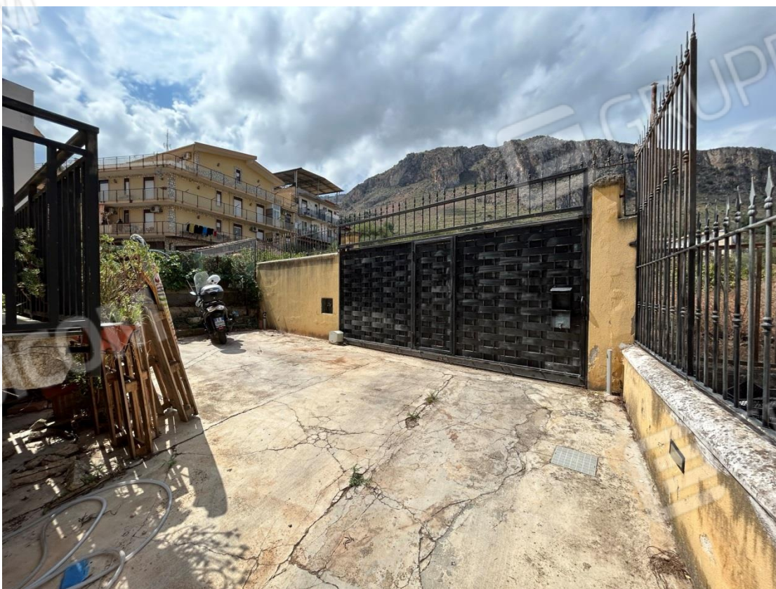
AREA ESTERNA COMUNE AI DUE APPARTAMENTI