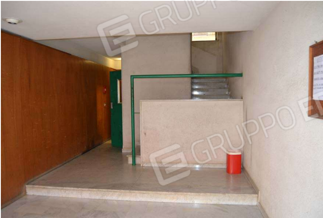
Fotografia 5 – Ingresso interno via G. Prestisimone n. 21

Lotto Tre – Immobile identif. al N.C.E.U. del Comune di Cefalù (PA), fg. n. 1, part. n. 278 – sub. n. 26.