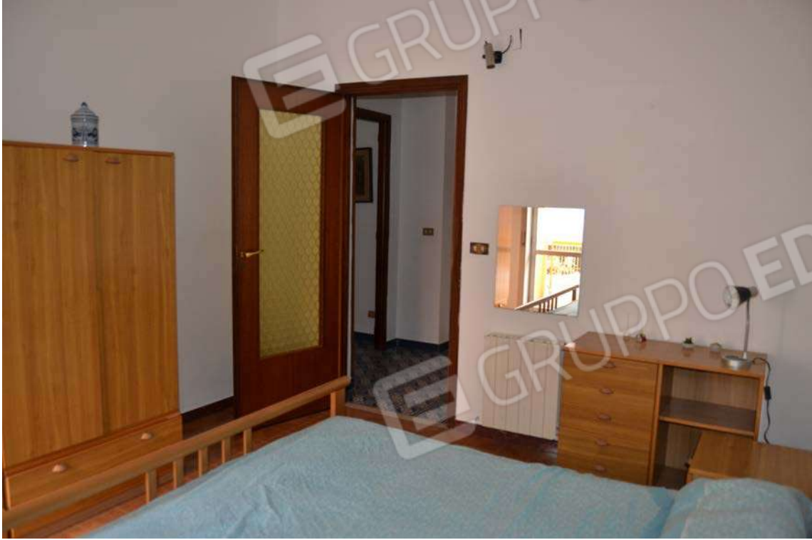
Fotografia 17 – letto 2

Lotto Tre – Immobile identif. al N.C.E.U. del Comune di Cefalù (PA), fg. n. 1, part. n. 278 – sub. n. 26.