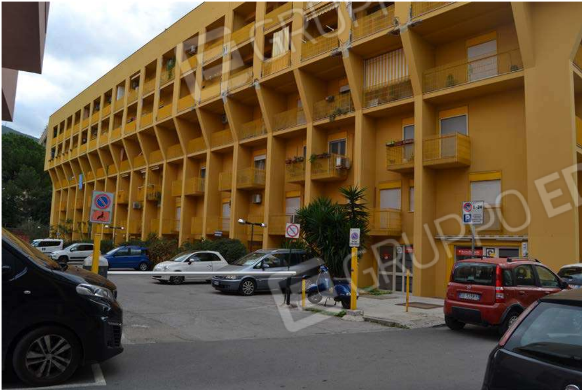
Fotografia 3 – Prospetto via G. Prestisimone n. 21

Lotto Tre – Immobile identif. al N.C.E.U. del Comune di Cefalù (PA), fg. n. 1, part. n. 278 – sub. n. 26.