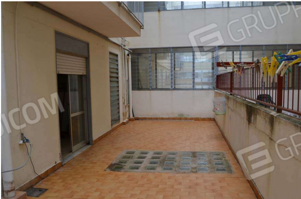
Fotografia 10 – terrazzo

Lotto Tre – Immobile identif. al N.C.E.U. del Comune di Cefalù (PA), fg. n. 1, part. n. 278 – sub. n. 26.