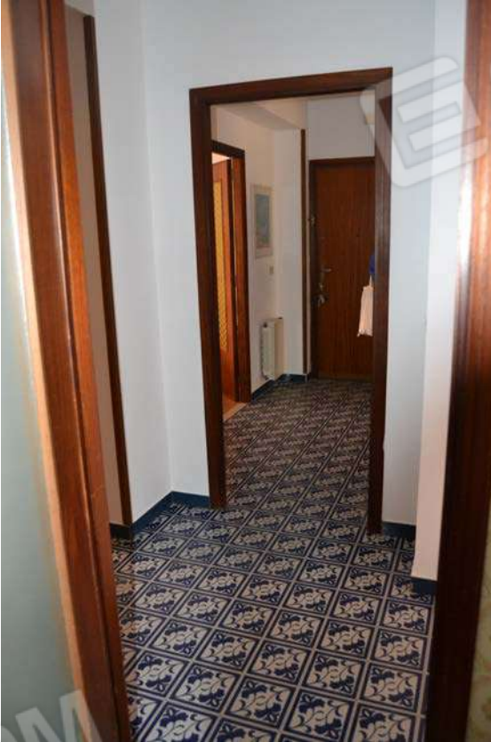
Fotografia 11 – ingresso - disimpegno Lotto Tre – Immobile identif. al N.C.E.U. del Comune di Cefalù (PA), fg. n. 1, part. n. 278 – sub. n. 26.