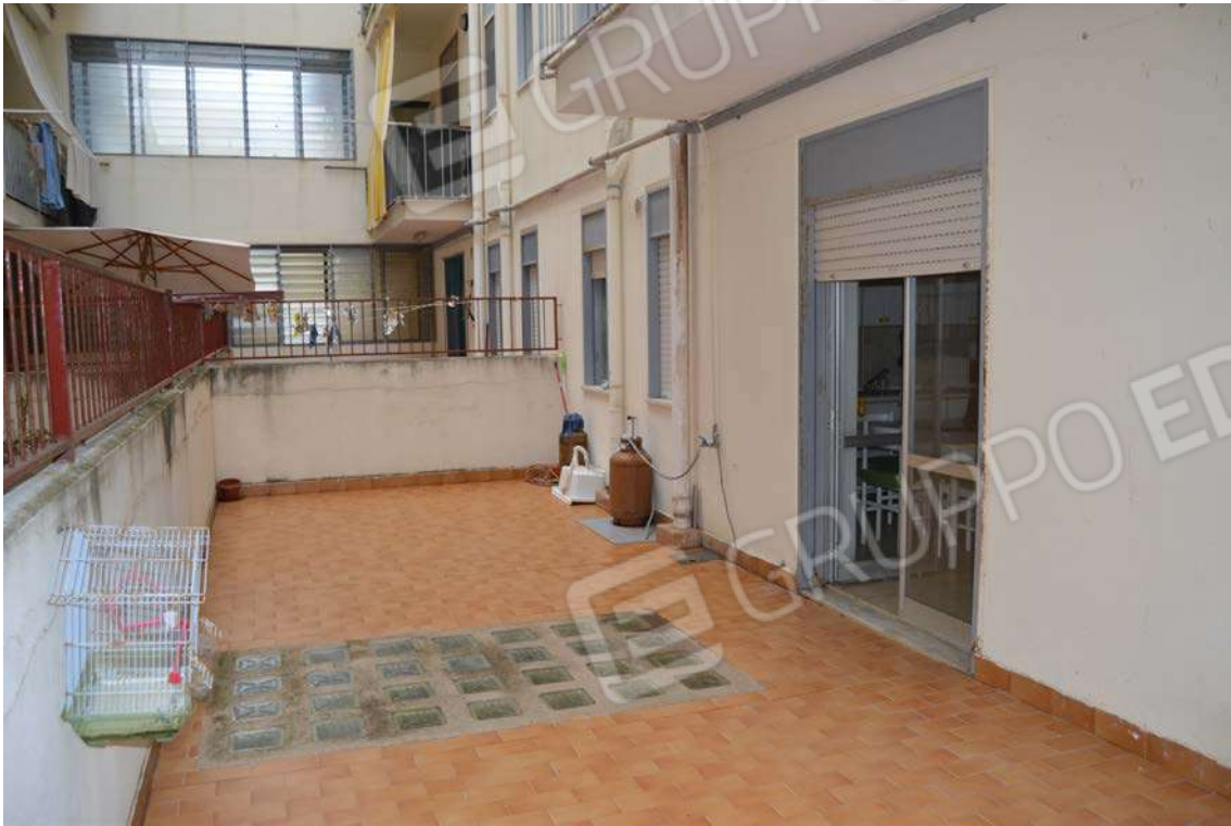
Fotografia 9 – terrazzo

Lotto Tre – Immobile identif. al N.C.E.U. del Comune di Cefalù (PA), fg. n. 1, part. n. 278 – sub. n. 26.