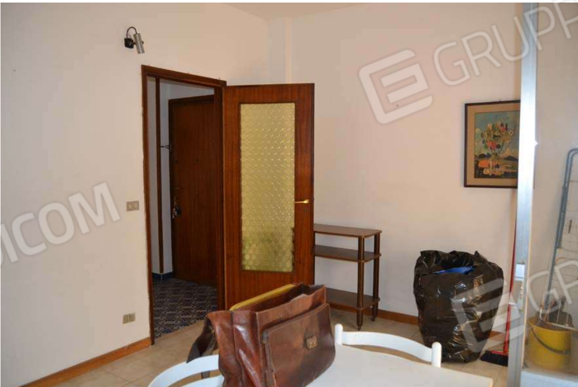
Fotografia 8 – Cucina

Lotto Tre – Immobile identif. al N.C.E.U. del Comune di Cefalù (PA), fg. n. 1, part. n. 278 – sub. n. 26.