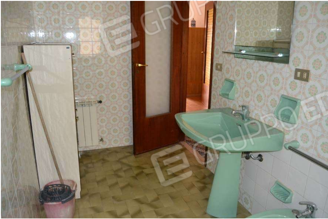
Fotografia 13 – w.c.

Lotto Tre – Immobile identif. al N.C.E.U. del Comune di Cefalù (PA), fg. n. 1, part. n. 278 – sub. n. 26.