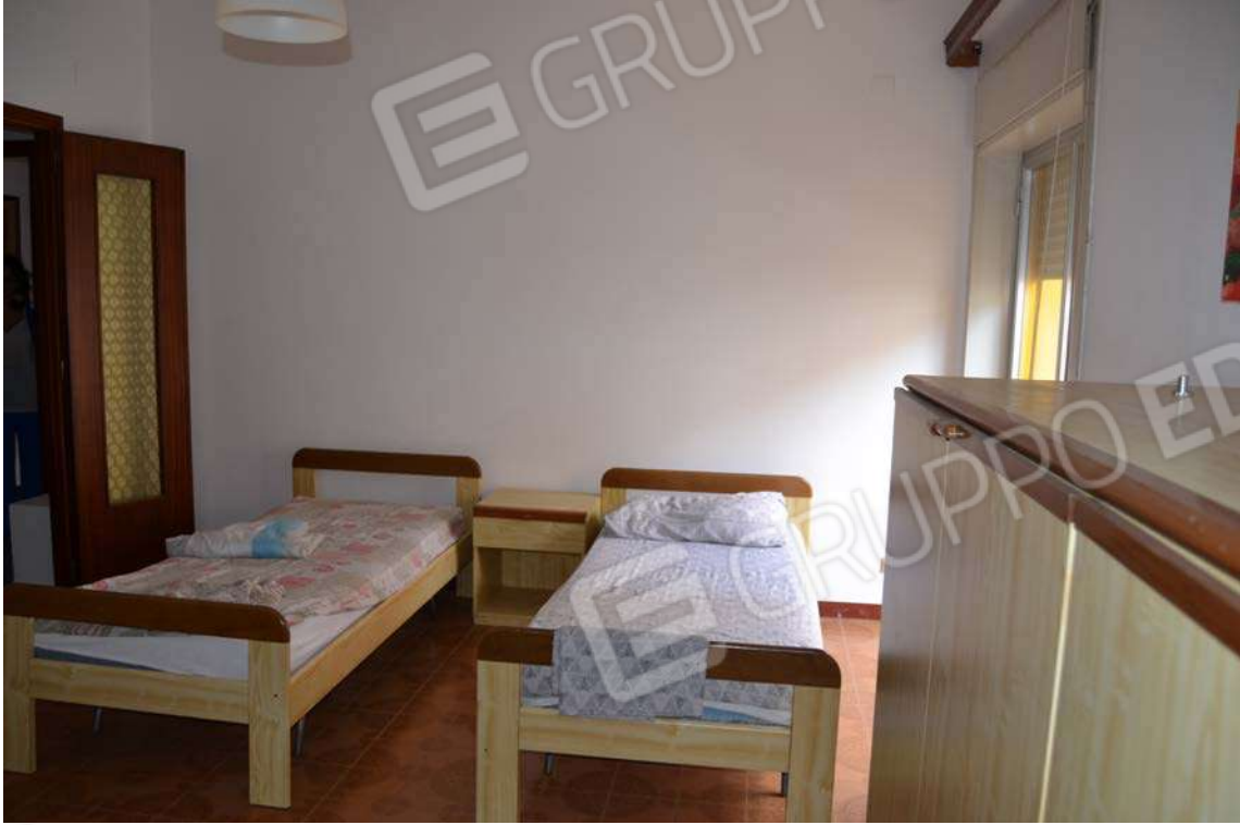
Fotografia 15 – letto 1

Lotto Tre – Immobile identif. al N.C.E.U. del Comune di Cefalù (PA), fg. n. 1, part. n. 278 – sub. n. 26.