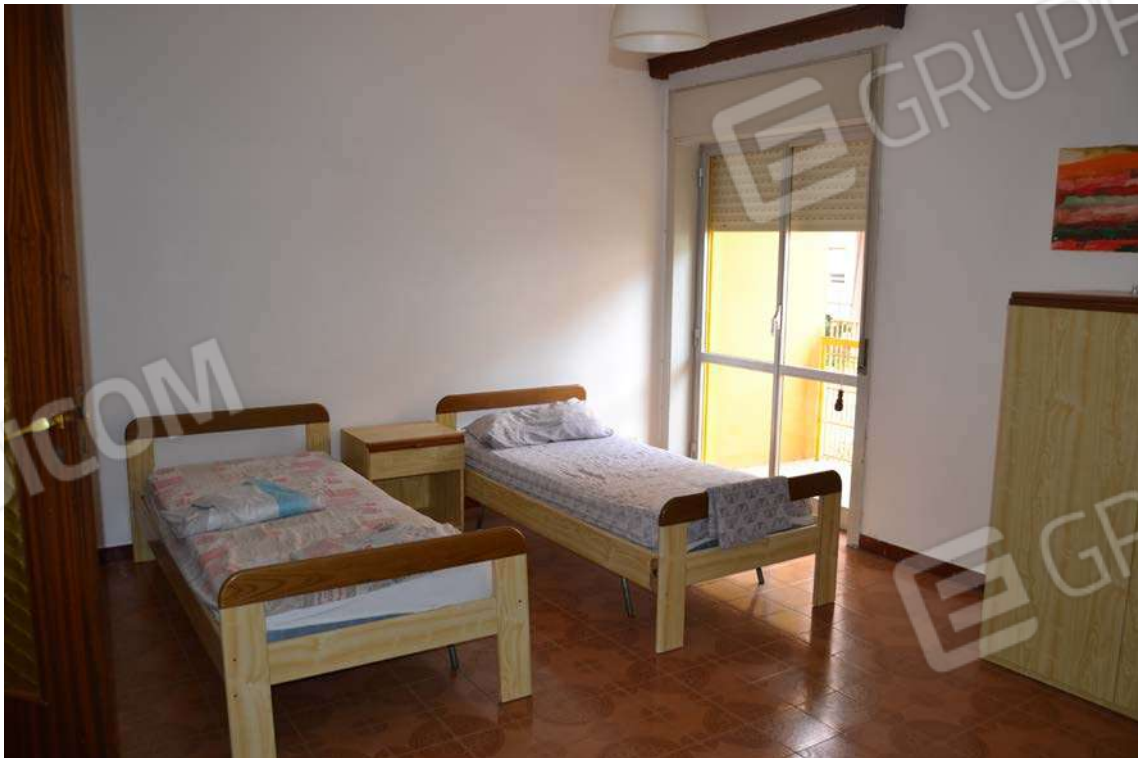
Fotografia 16 – letto 1

Lotto Tre – Immobile identif. al N.C.E.U. del Comune di Cefalù (PA), fg. n. 1, part. n. 278 – sub. n. 26.