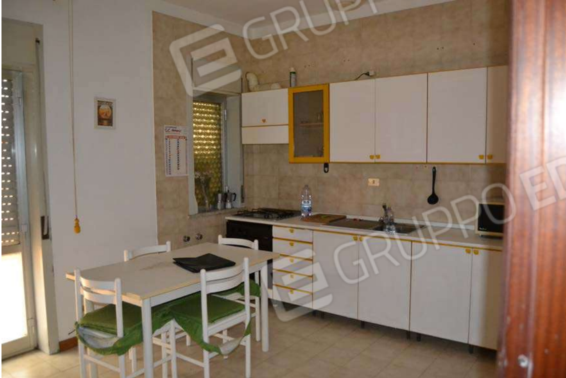
Fotografia 7 – Cucina

Lotto Tre – Immobile identif. al N.C.E.U. del Comune di Cefalù (PA), fg. n. 1, part. n. 278 – sub. n. 26.