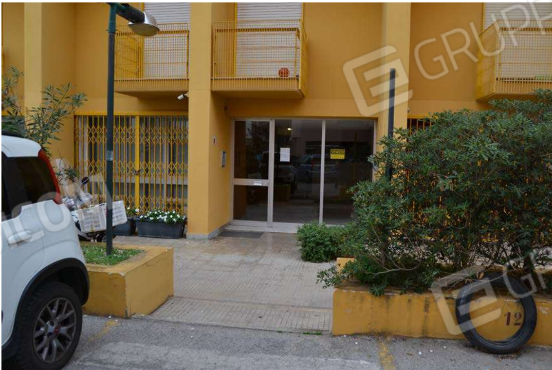
Fotografia 4 – Ingresso esterno via G. Prestisimone n. 21

Lotto Tre – Immobile identif. al N.C.E.U. del Comune di Cefalù (PA), fg. n. 1, part. n. 278 – sub. n. 26.