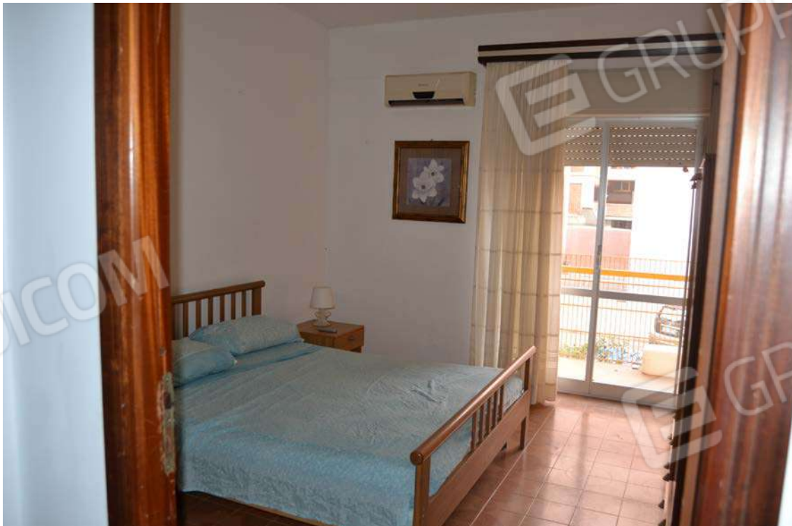
Fotografia 18 – letto 2

Lotto Tre – Immobile identif. al N.C.E.U. del Comune di Cefalù (PA), fg. n. 1, part. n. 278 – sub. n. 26.