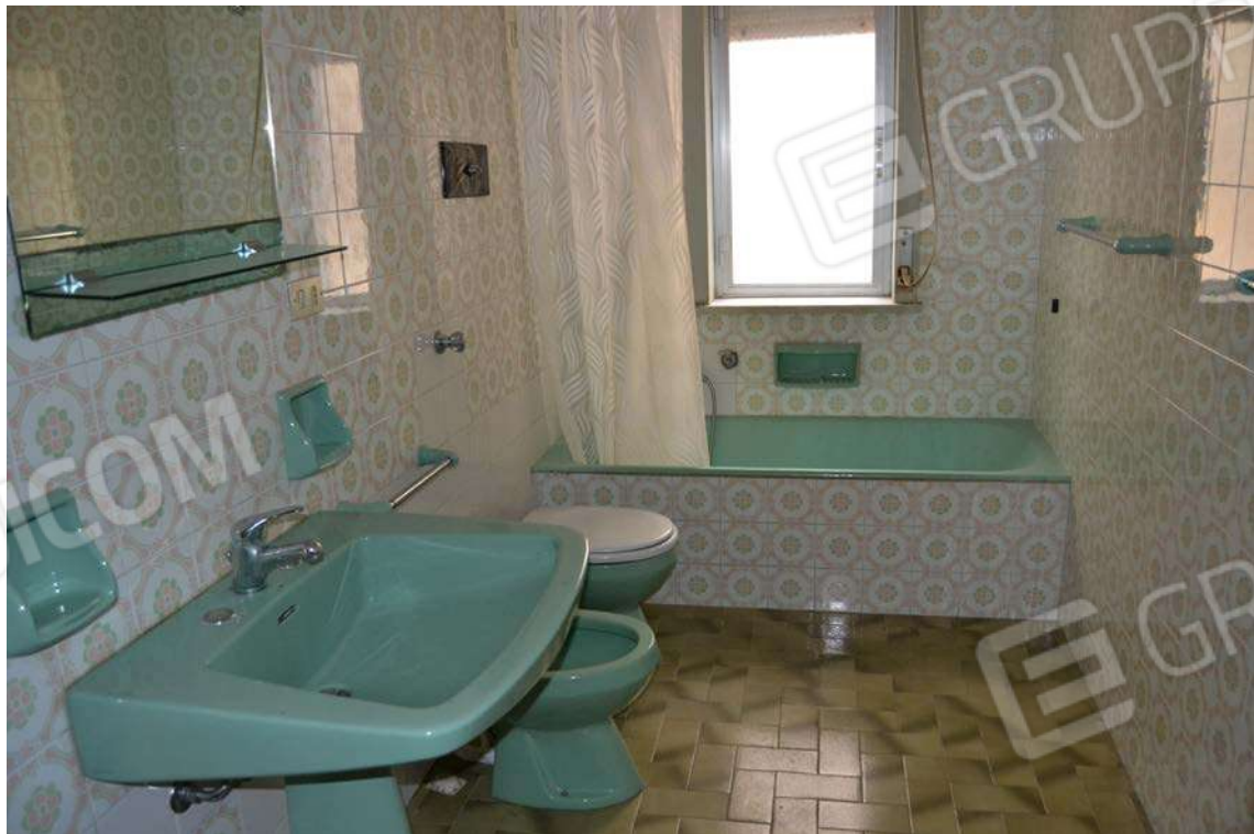
Fotografia 14 – w.c.

Lotto Tre – Immobile identif. al N.C.E.U. del Comune di Cefalù (PA), fg. n. 1, part. n. 278 – sub. n. 26.