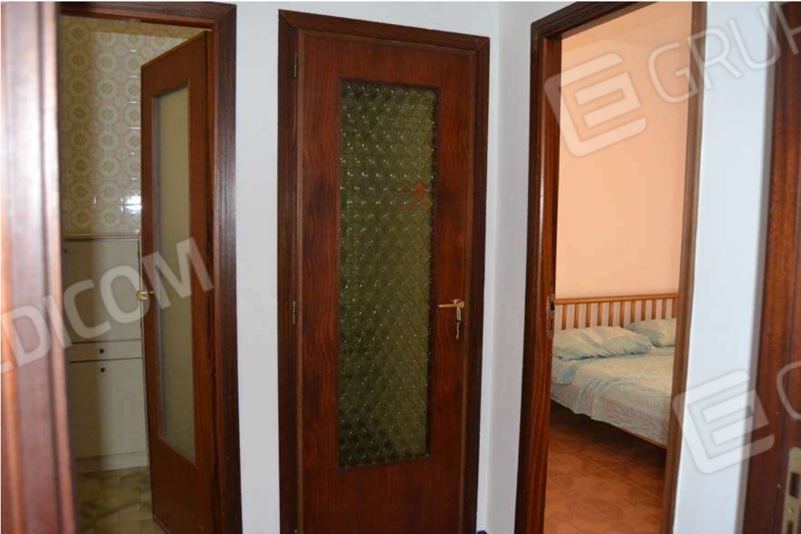
Fotografia 12 – disimpegno Lotto Tre – Immobile identif. al N.C.E.U. del Comune di Cefalù (PA), fg. n. 1, part. n. 278 – sub. n. 26.