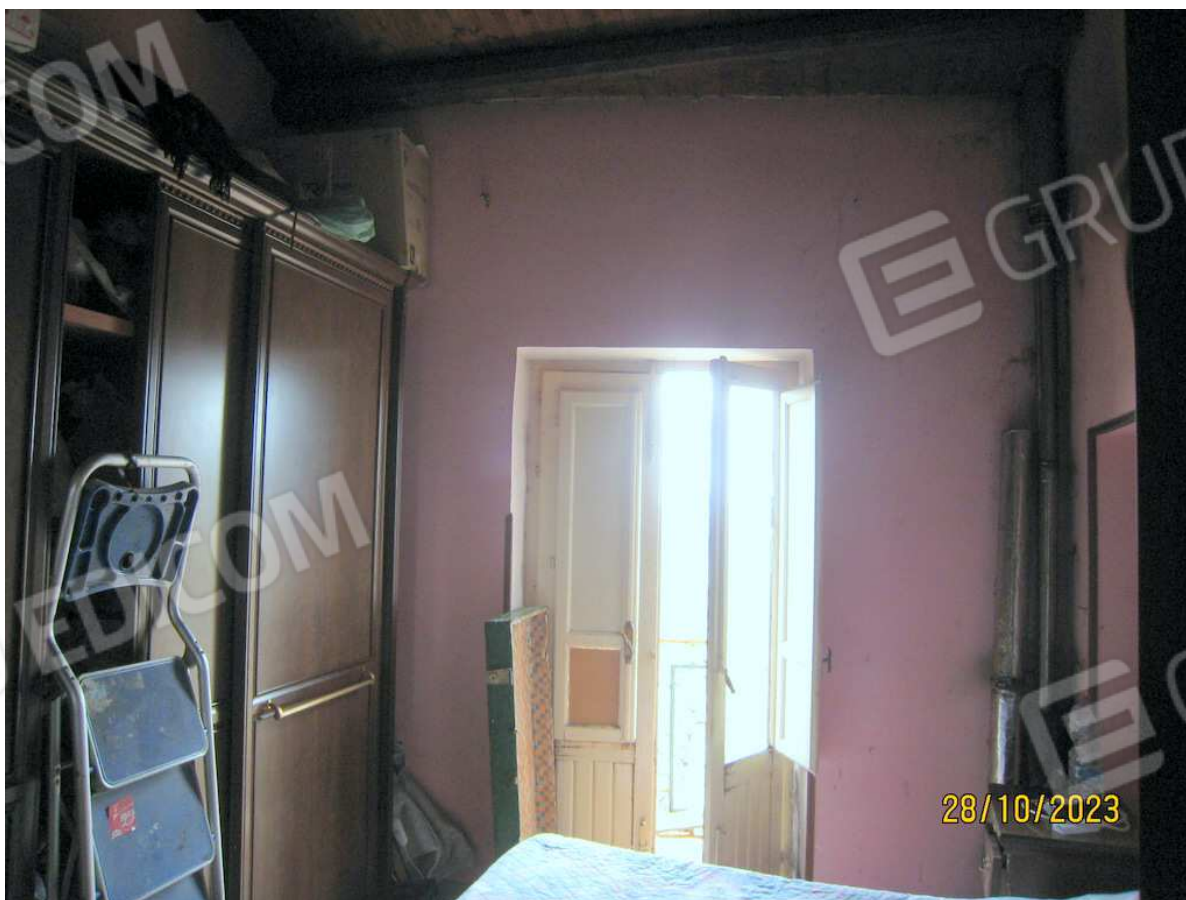
Foto n. 56. La parete lungo la canna fumaria è danneggiata dal calore e da fenomeni di condensa.