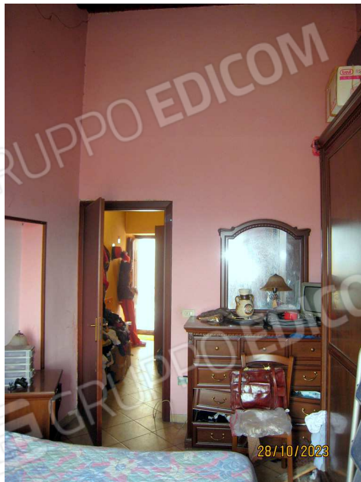
Foto n. 54-55. La camera matrimoniale.