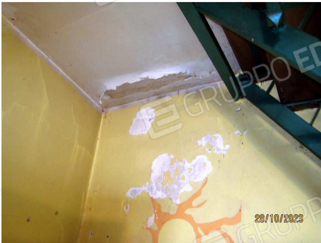
Foto n. 66. Umidità sulla parete contro il terrapieno di Via S. Antonio.