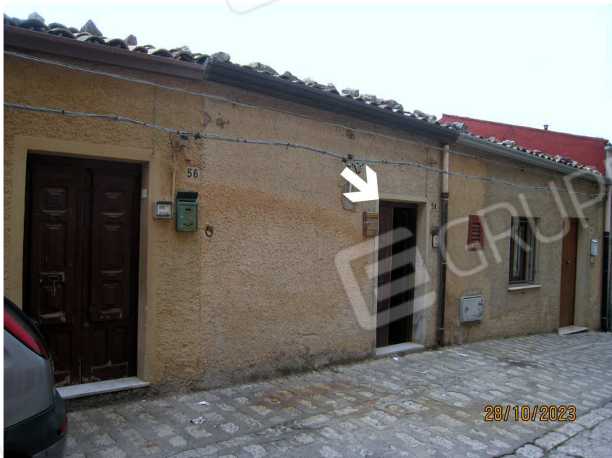
Foto n. 42-43. Accesso e Via S. Antonio.