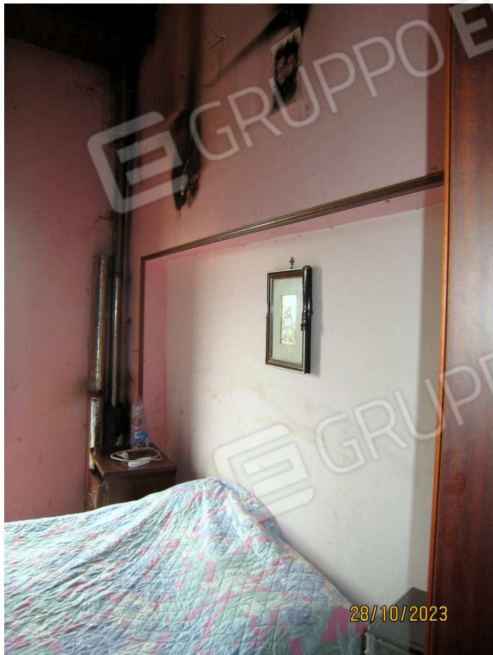
Foto n. 52-53. La camera matrimoniale con delle bruciature sulle pareti (impianto elettrico malfunzionante?).