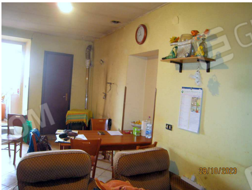
Foto n. 57-59. Scesa la scala si raggiunge la cucina (piano seminterrato) che viene mostrata attraverso queste tre fotografie.