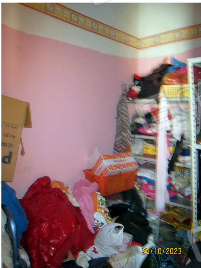
Foto n. 50. Il ripostiglio accessibile dall'ingresso. dall'ingresso.