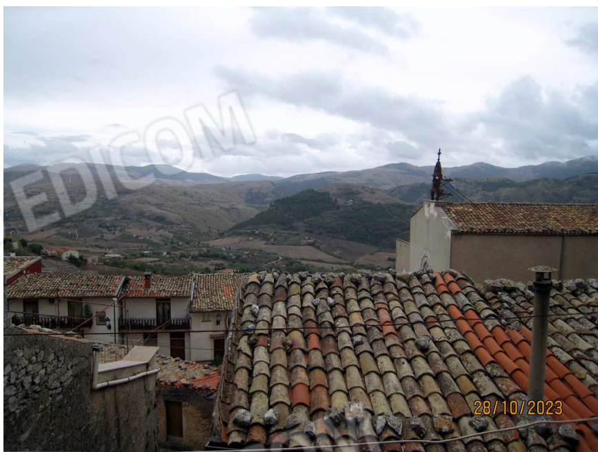
Foto n. 44. Panorama dal balcone della camera da letto matrimoniale, freccia verde nella foto che segue.