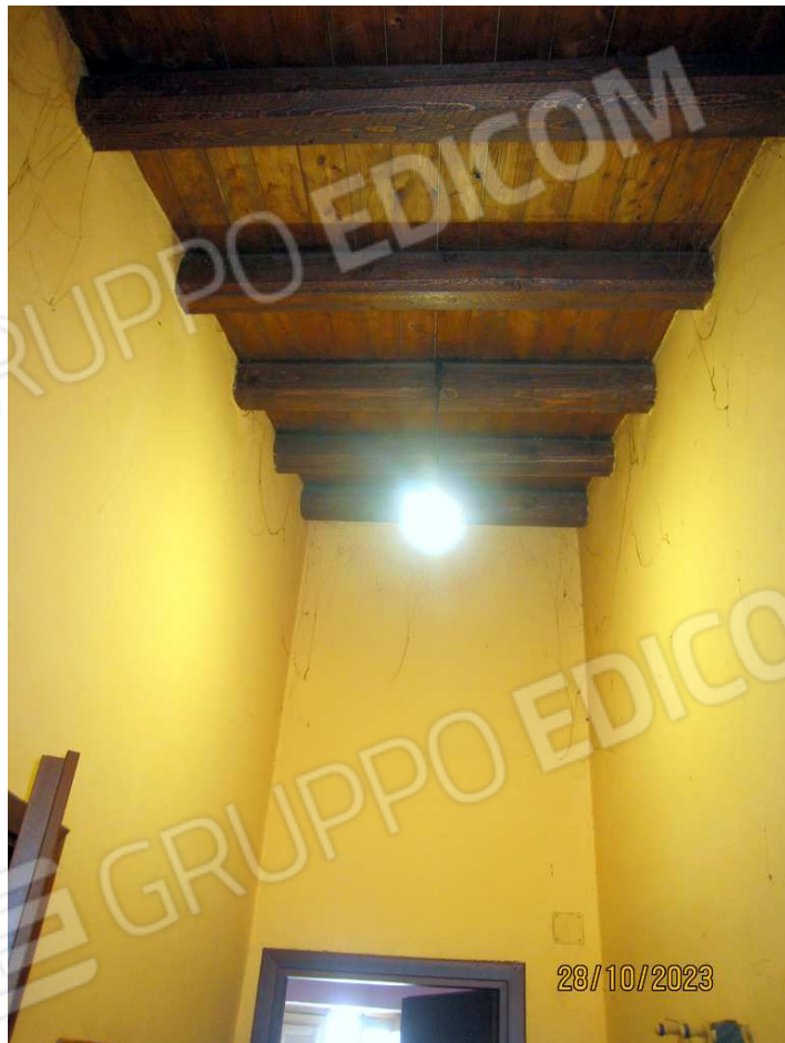
Foto n. 51. La tipologia di copertura del P.T. è ben visibile dall'ingresso.