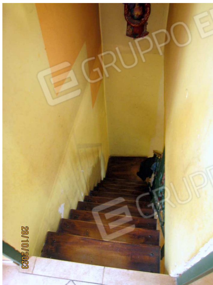
Foto n. 48. L'ingresso, appena varcato il portone, civ. 58.