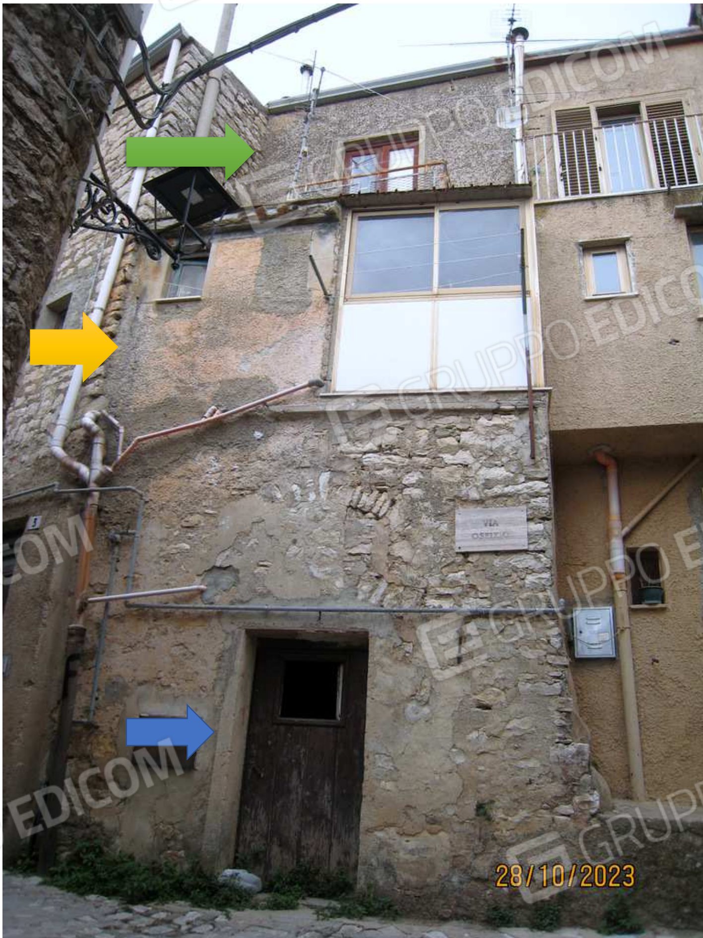
Foto n. 45. Il prospetto su Via Ospizio. La freccia verde segnala il P.T. rispetto alla Via S. Antonio; la freccia gialla il piano seminterrato rispetto alla Via S. Antonio. La freccia blu il piano terra su Via Ospizio indicato nella planimetria catastale del 1962, ma non in possesso della debitrice, come ha dichiarato durante il primo accesso.