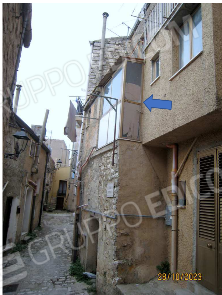
Foto n. 46-47. Le frecce indicano la chiusura abusiva del terrazzino con struttura in metallo, pannelli e vetri.