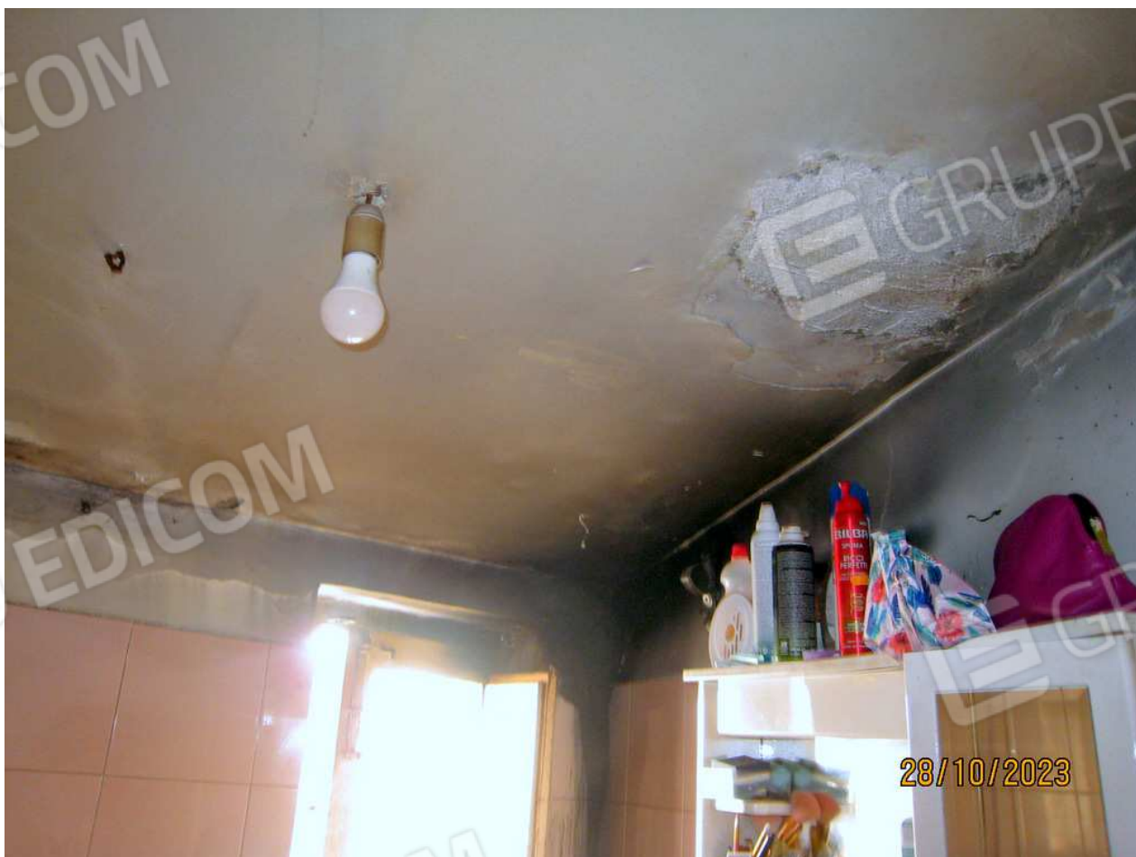
Foto n. 65. Dettaglio del tetto e delle pareti del w.c.