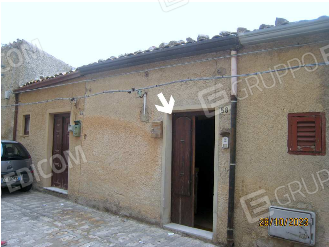
Foto n. 41. La Via S. Antonio con indicata la porta di accesso al fabbricato, civ. 58.