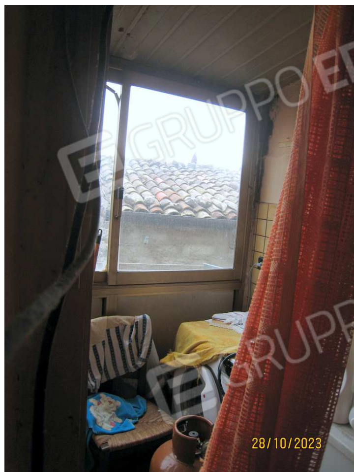
Foto n. 61-62. L'originario terrazzino attinente la cucina è stato chiuso con una struttura in alluminio, pannelli sintetici e copertura con pannelli grecati tipo sandwich. L'originario infisso, segnato da frecce gialle, è stato rimosso.