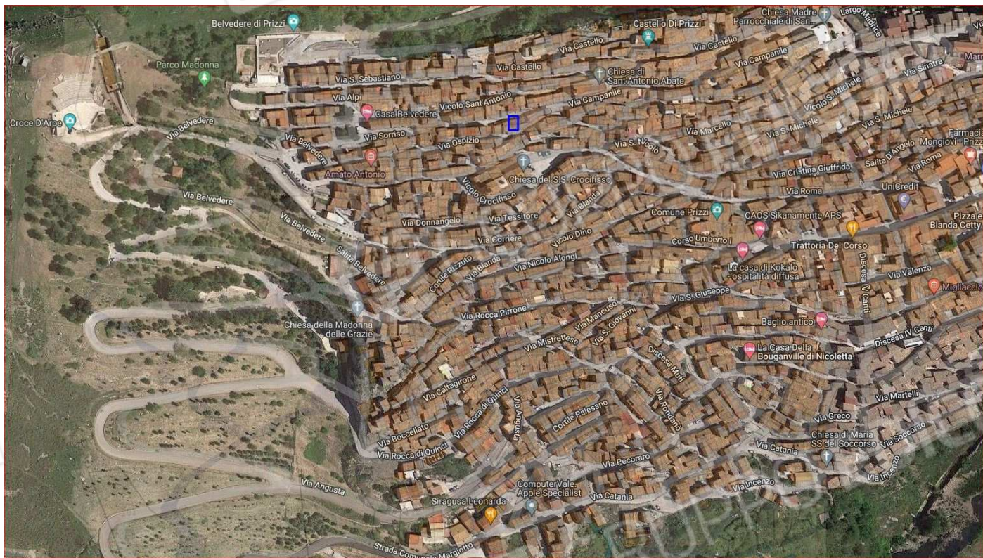
Foto n. 40. Immagine aerea dell'abitato di Prizzi con segnato, da rettangolo blu, il fabbricato in oggetto.