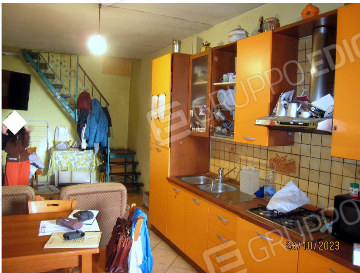
Foto n. 60. Ancora una immagine della cucina.