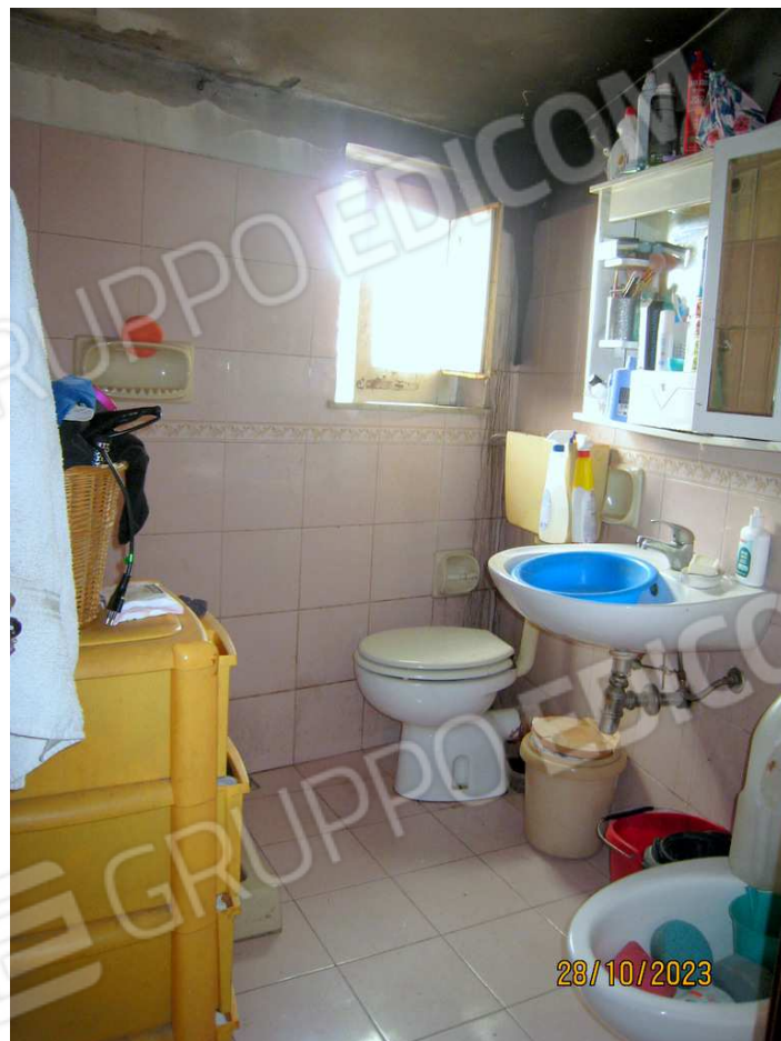
Foto n. 63-64. Il w.c. doccia. Gli intonaci sono danneggiati così la copertura.