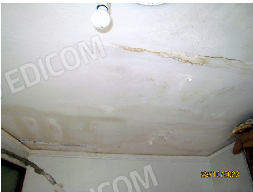
Foto n. 26-28. Le condizioni del tetto sono chiaramente restituite dalle tre fotografie.