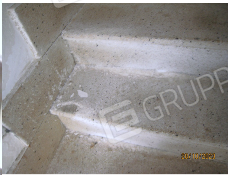
Foto n. 14. Dettaglio dell'umidità di risalita anche nella scala.