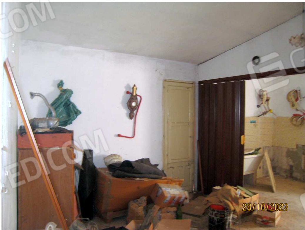
Foto n. 33. La stessa stanza vista da altra angolazione.