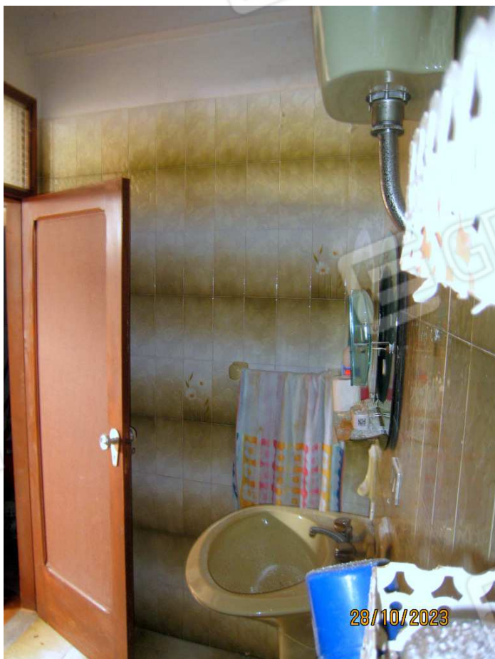
Foto n. 11. Altra immagine del bagno, opposta alla precedente.