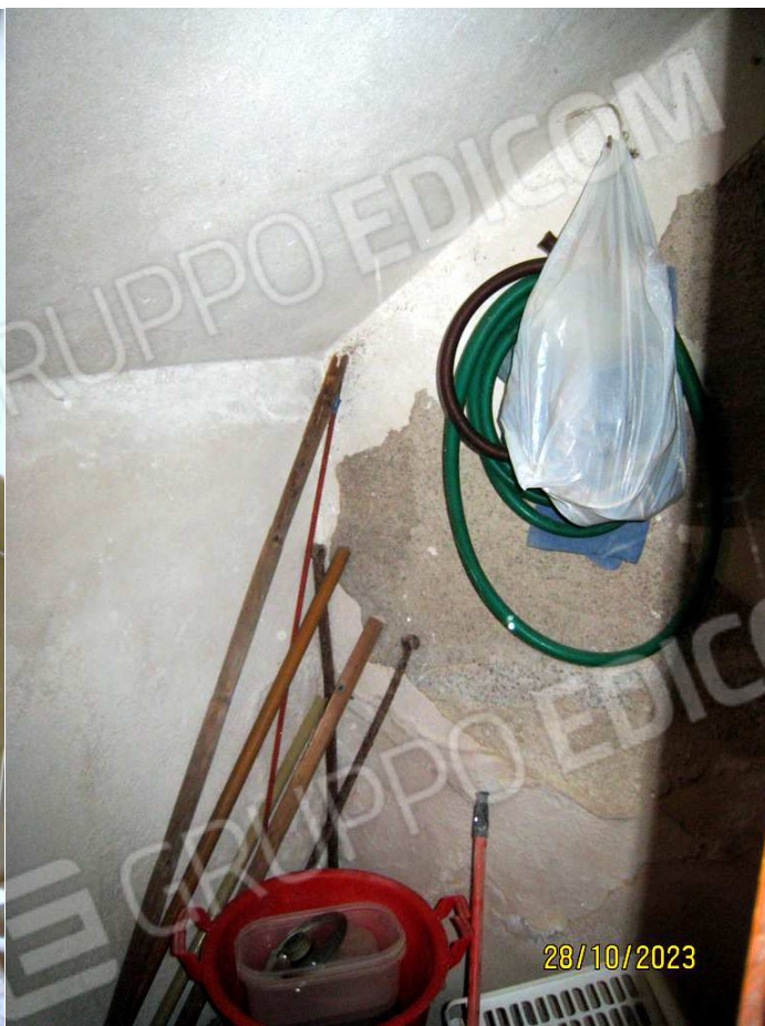
Foto n. 12. Il ripostiglio nel sotto scala del P.T.