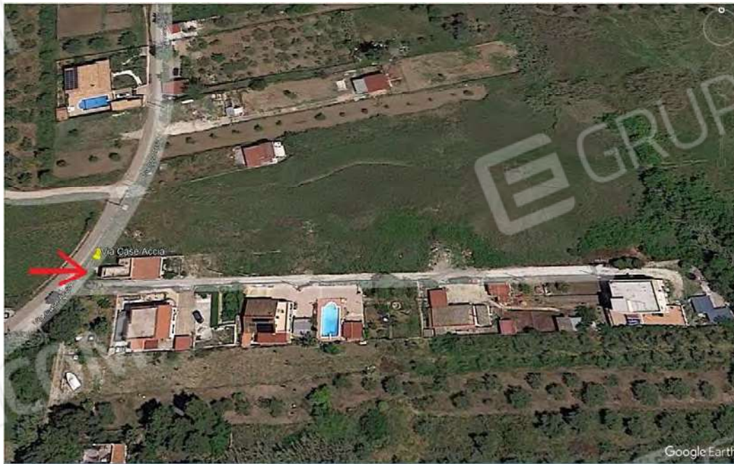
Foto 5 – Foto satellitare di Santa Flavia e del bene pignorato