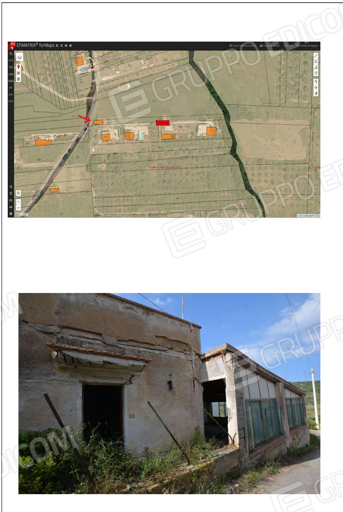
Foto 7 – Sovrapposizione mappa catastale e foto satellitare