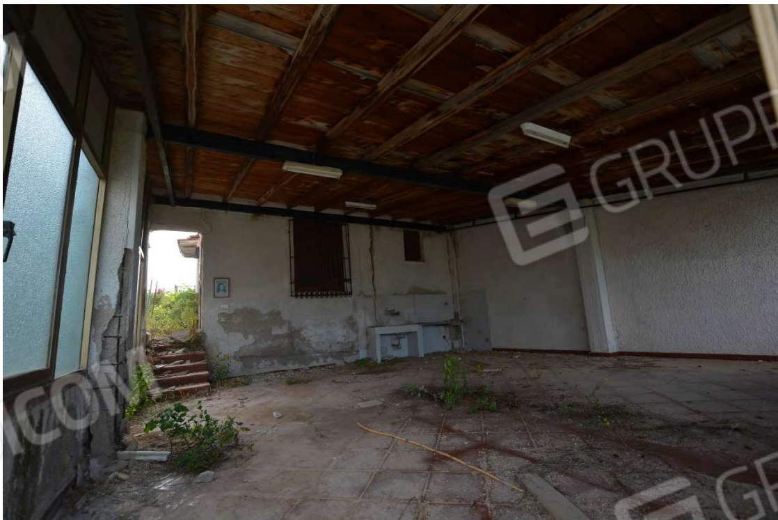
Foto 13 - Veranda