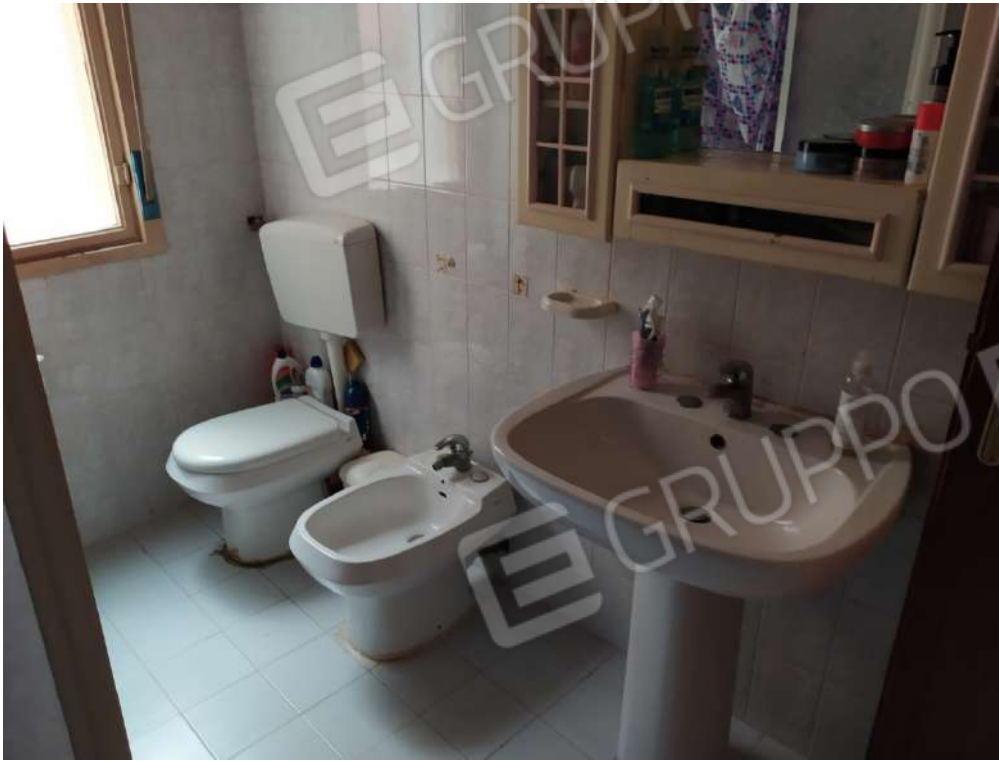
Fotografia 15 – w.c.

Lotto Unico – Immobile identif. al N.C.E.U. del Comune di Misilmeri (PA), fg. n.18, part. n. 2501 – sub. n. 18