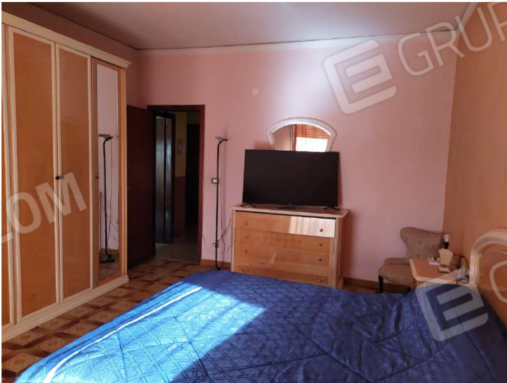
Fotografia 24 – Letto

Lotto Unico – Immobile identif. al N.C.E.U. del Comune di Misilmeri (PA), fg. n.18, part. n. 2501 – sub. n. 18