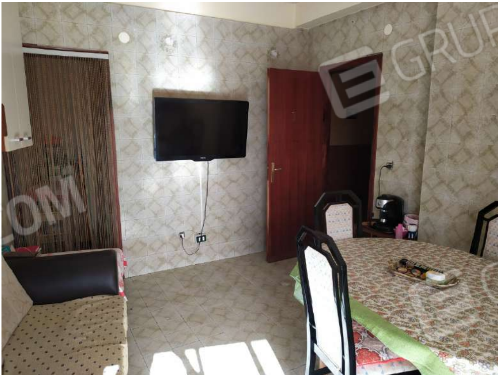
Fotografia 12 – Cucina

Lotto Unico – Immobile identif. al N.C.E.U. del Comune di Misilmeri (PA), fg. n.18, part. n. 2501 – sub. n. 18