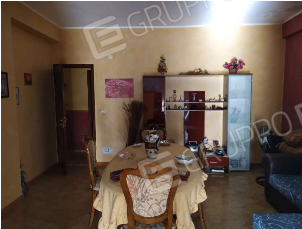
Fotografia 19 – sala da pranzo

Lotto Unico – Immobile identif. al N.C.E.U. del Comune di Misilmeri (PA), fg. n.18, part. n. 2501 – sub. n. 18