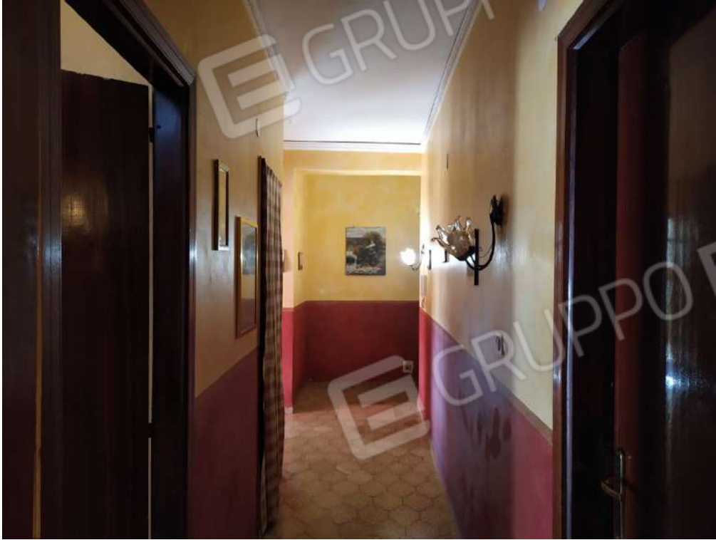
Fotografia 13 – Disimpegno

Lotto Unico – Immobile identif. al N.C.E.U. del Comune di Misilmeri (PA), fg. n.18, part. n. 2501 – sub. n. 18