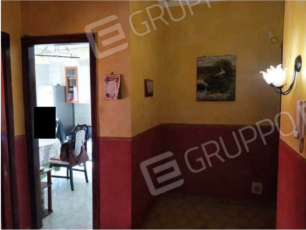
Fotografia 9 – Disimpegno

Lotto Unico – Immobile identif. al N.C.E.U. del Comune di Misilmeri (PA), fg. n.18, part. n. 2501 – sub. n. 18