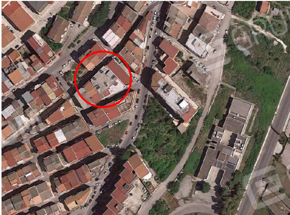
Fotografia 2 -Inquadramento territoriale MISILMERI (PA), via Carso, n.123