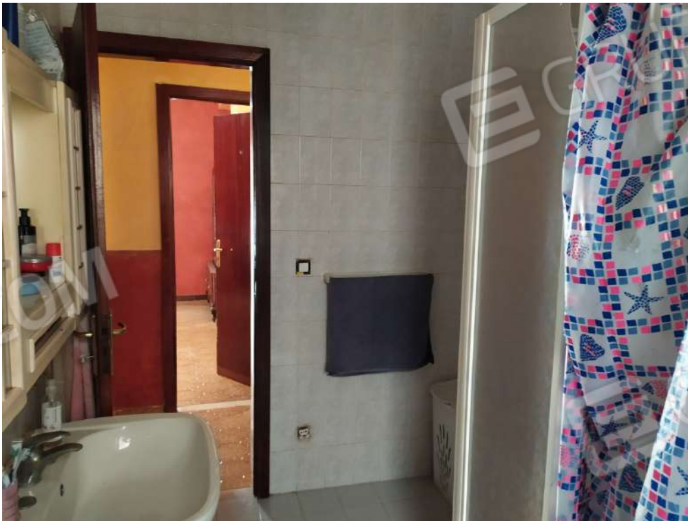
Fotografia 16 – w.c.

Lotto Unico – Immobile identif. al N.C.E.U. del Comune di Misilmeri (PA), fg. n.18, part. n. 2501 – sub. n. 18