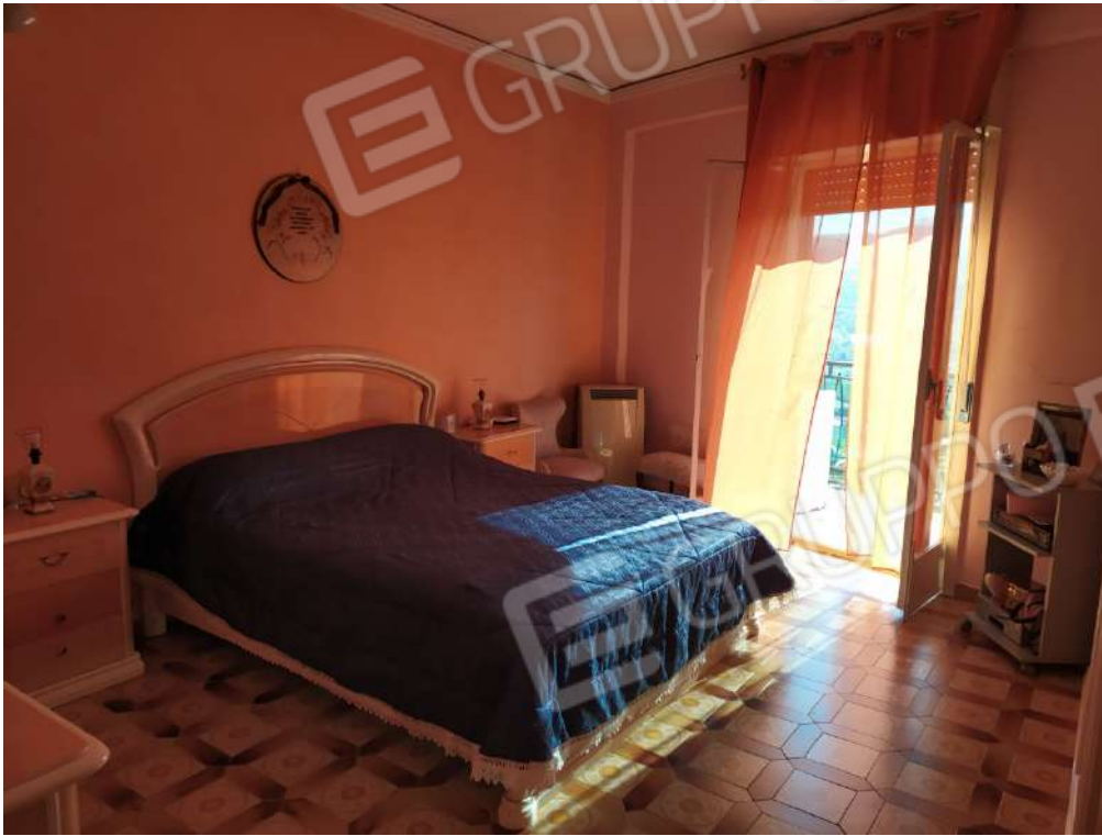
Fotografia 23 – Letto

Lotto Unico – Immobile identif. al N.C.E.U. del Comune di Misilmeri (PA), fg. n.18, part. n. 2501 – sub. n. 18