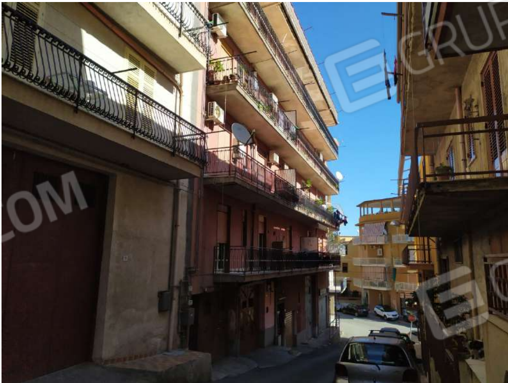
Fotografia 4 – Prospetto via Turrisi Colonna

Lotto Unico – Immobile identif. al N.C.E.U. del Comune di Misilmeri (PA), fg. n.18, part. n. 2501 – sub. n. 18