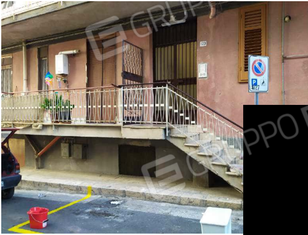
Fotografia 5 – Ingresso su via Carso n. 123

Lotto Unico – Immobile identif. al N.C.E.U. del Comune di Misilmeri (PA), fg. n.18, part. n. 2501 – sub. n. 18