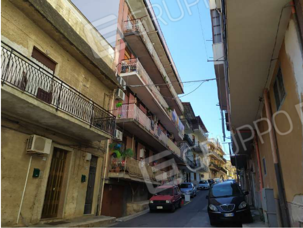
Fotografia 3 – Prospetto via Carso n. 123

Lotto Unico – Immobile identif. al N.C.E.U. del Comune di Misilmeri (PA), fg. n.18, part. n. 2501 – sub. n. 18