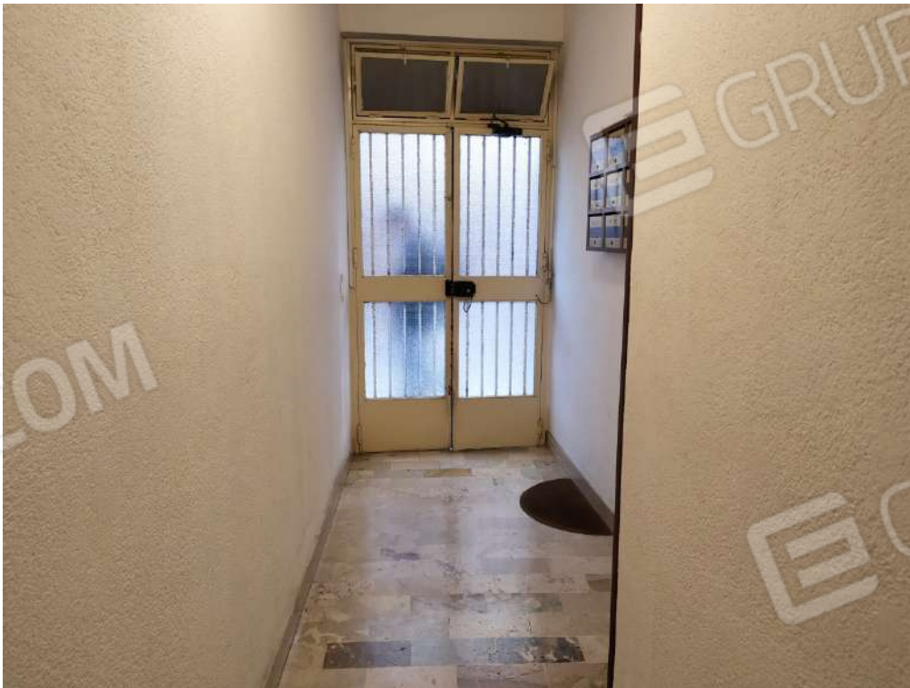
Fotografia 6 – Ingresso interno edificio condominiale

Lotto Unico – Immobile identif. al N.C.E.U. del Comune di Misilmeri (PA), fg. n.18, part. n. 2501 – sub. n. 18