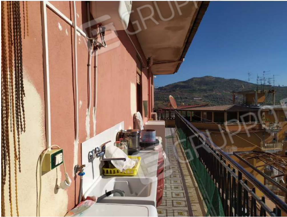
Fotografia 25 – Balcone

Lotto Unico – Immobile identif. al N.C.E.U. del Comune di Misilmeri (PA), fg. n.18, part. n. 2501 – sub. n. 18