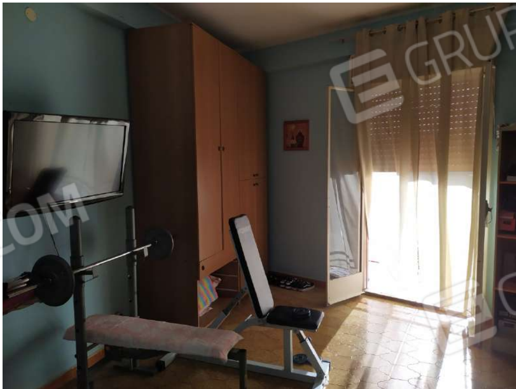
Fotografia 22 – soggiorno

Lotto Unico – Immobile identif. al N.C.E.U. del Comune di Misilmeri (PA), fg. n.18, part. n. 2501 – sub. n. 18