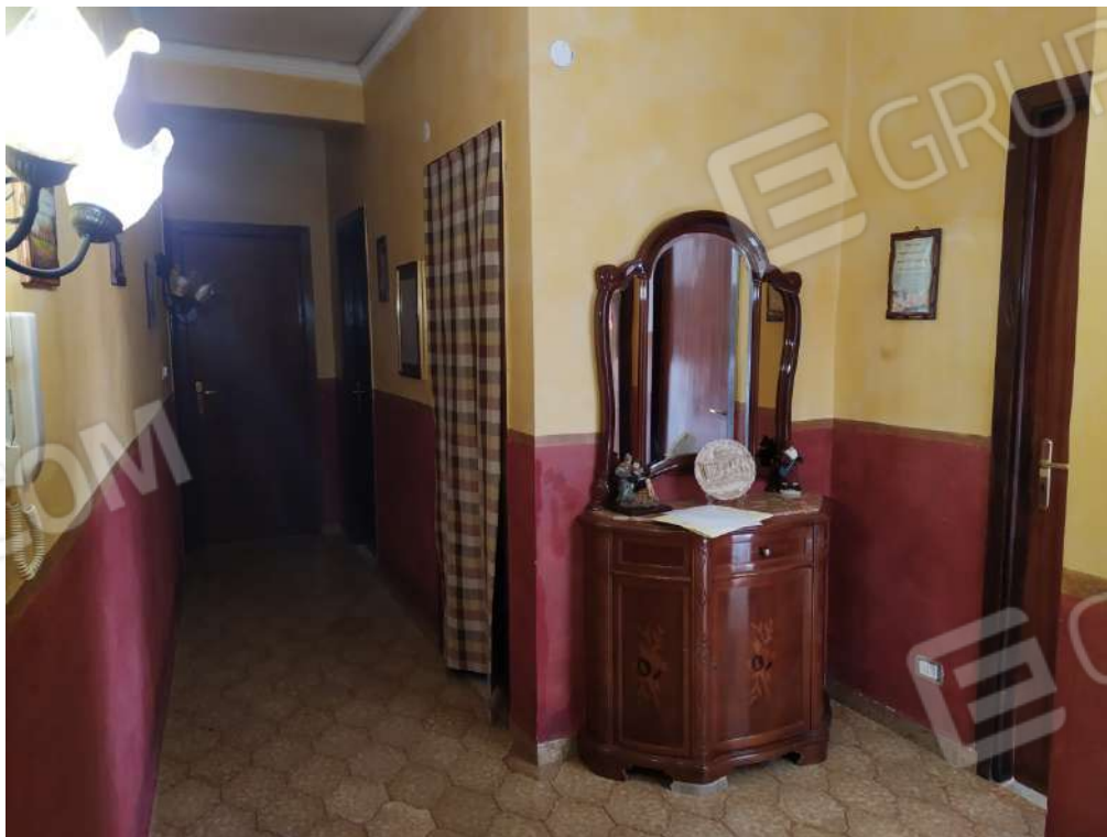
Fotografia 14 – Disimpegno

Lotto Unico – Immobile identif. al N.C.E.U. del Comune di Misilmeri (PA), fg. n.18, part. n. 2501 – sub. n. 18