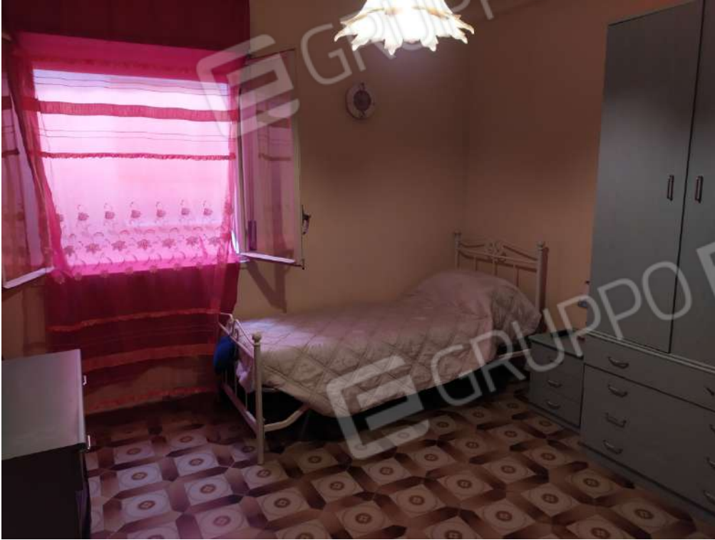
Fotografia 17 – Letto

Lotto Unico – Immobile identif. al N.C.E.U. del Comune di Misilmeri (PA), fg. n.18, part. n. 2501 – sub. n. 18