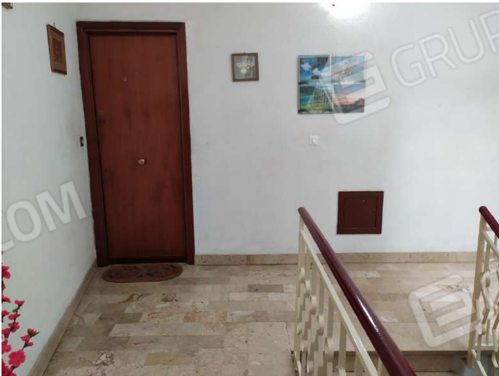
Fotografia 8 – Ingresso all'abitazione, Piano secondo

Lotto Unico – Immobile identif. al N.C.E.U. del Comune di Misilmeri (PA), fg. n.18, part. n. 2501 – sub. n. 18