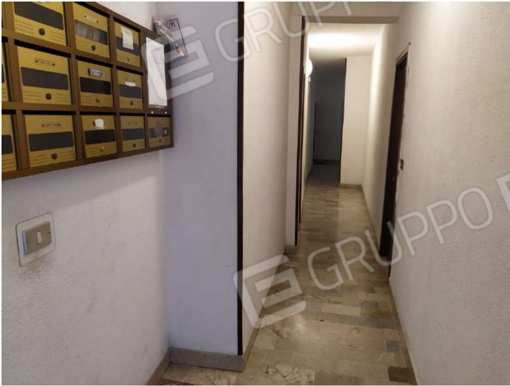
Fotografia 7 – Androne

Lotto Unico – Immobile identif. al N.C.E.U. del Comune di Misilmeri (PA), fg. n.18, part. n. 2501 – sub. n. 18