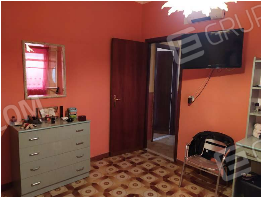
Fotografia 18 – Letto

Lotto Unico – Immobile identif. al N.C.E.U. del Comune di Misilmeri (PA), fg. n.18, part. n. 2501 – sub. n. 18