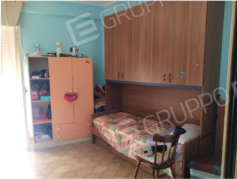
Fotografia 21 – soggiorno

Lotto Unico – Immobile identif. al N.C.E.U. del Comune di Misilmeri (PA), fg. n.18, part. n. 2501 – sub. n. 18