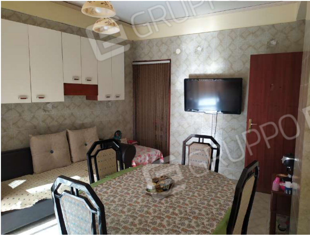
Fotografia 11 – Cucina

Lotto Unico – Immobile identif. al N.C.E.U. del Comune di Misilmeri (PA), fg. n.18, part. n. 2501 – sub. n. 18