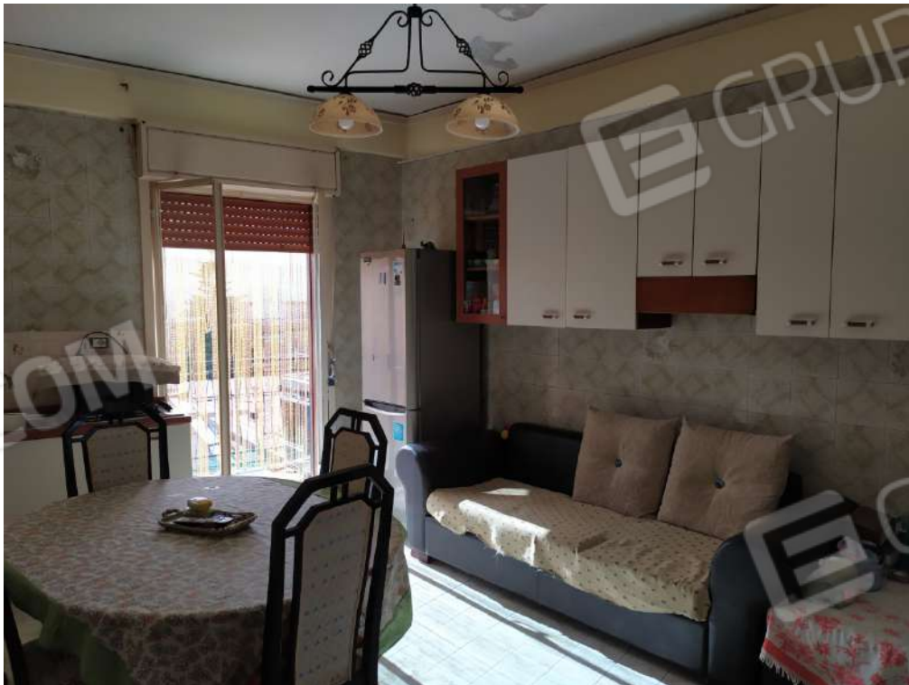
Fotografia 10 – Cucina

Lotto Unico – Immobile identif. al N.C.E.U. del Comune di Misilmeri (PA), fg. n.18, part. n. 2501 – sub. n. 18