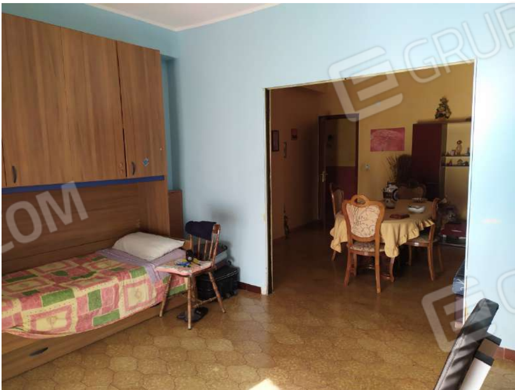
Fotografia 20 – soggiorno.

Lotto Unico – Immobile identif. al N.C.E.U. del Comune di Misilmeri (PA), fg. n.18, part. n. 2501 – sub. n. 18