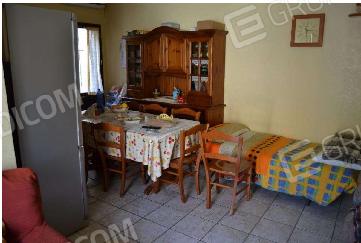
Foto 58) BENE 8 – Vista interno locale e porta di accesso laterale