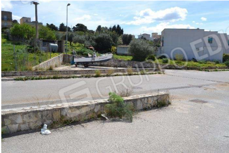
Foto 59) BENI 8 e 9 – Vista particelle 556 e 557 in parte occupate dalla sede stradale e in parte sistemate come aree di sosta