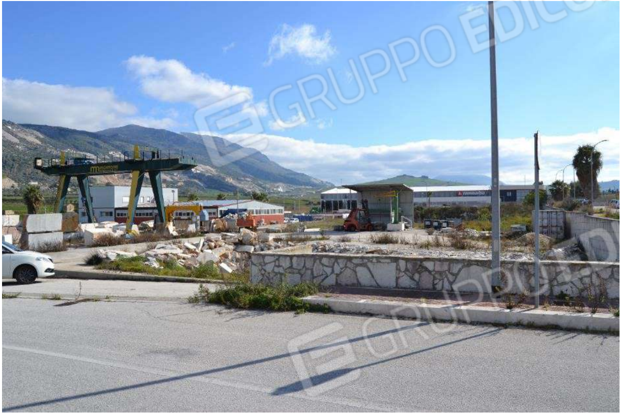
Foto 1) BENI 1 e 2 – Vista del lotto di terreno dalla stradella della zona PIP