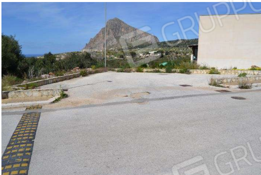
Foto 60) BENE 8 – Vista particella F.64 part. 556 con la sede stradale della via Piano Alastre