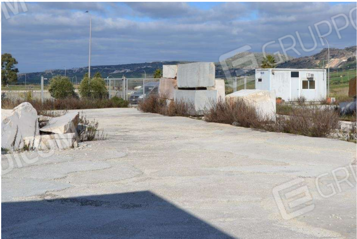
Foto 2) BENI 1 E 2 – Vista dall'interno del cancello di accesso al lotto e blocchi di marmo depositati a cielo libero