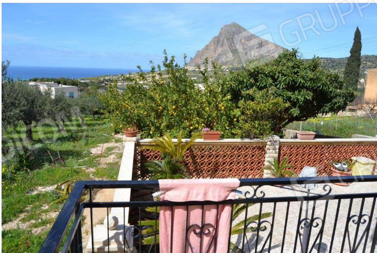
Foto 40) BENE 5 – Vista del giardino di pertinenza posto a nord del fabbricato