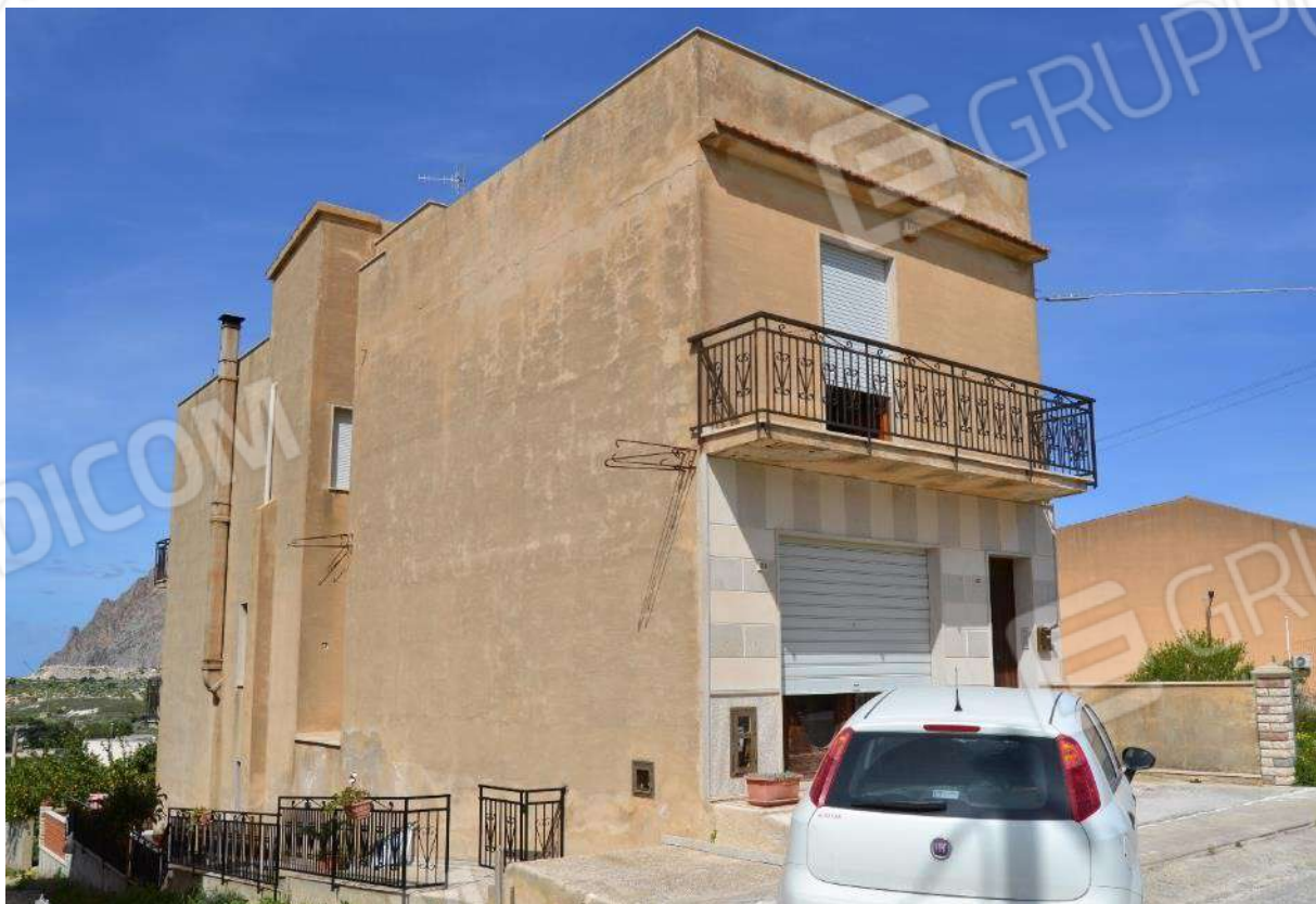
Foto 18) BENE 5 – Facciate lato sud e ovest e camminamenti per l'accesso al piano seminterrato