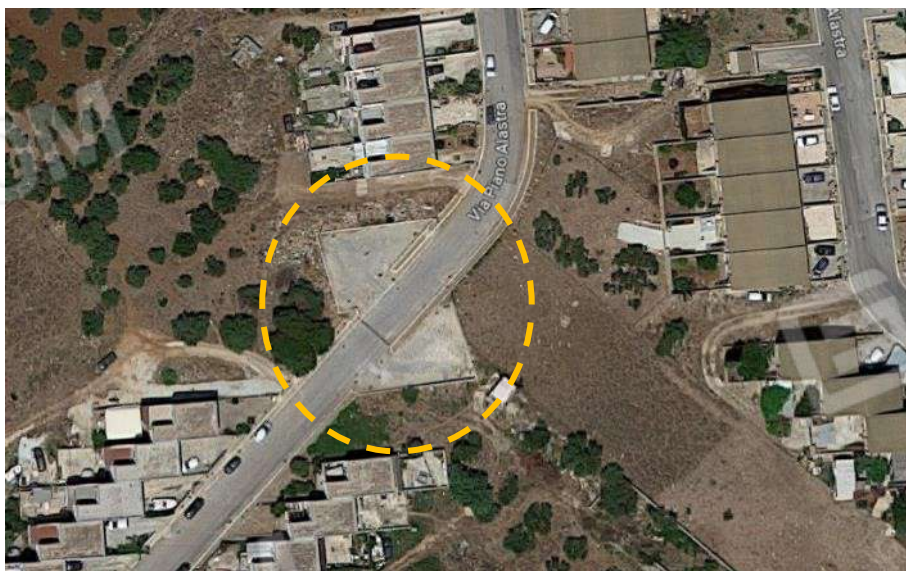
Foto 61) BENI 8 e 9 – Vista particelle attraversate dalla sede stradale