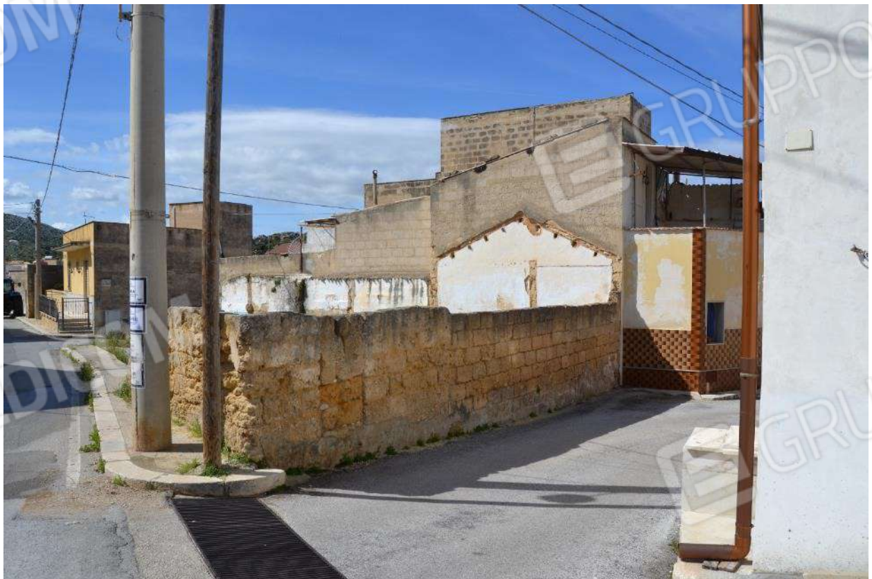
Foto 14) BENE 4 – Vista del lotto di terreno dalla via Santa Lucia angolo via Badalucco