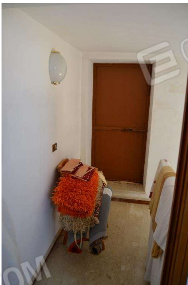
Foto 36) BENE 5 – Vista ballatoio piano secondo e portoncino di accesso ai lastrici solari lato via Piano Alastre