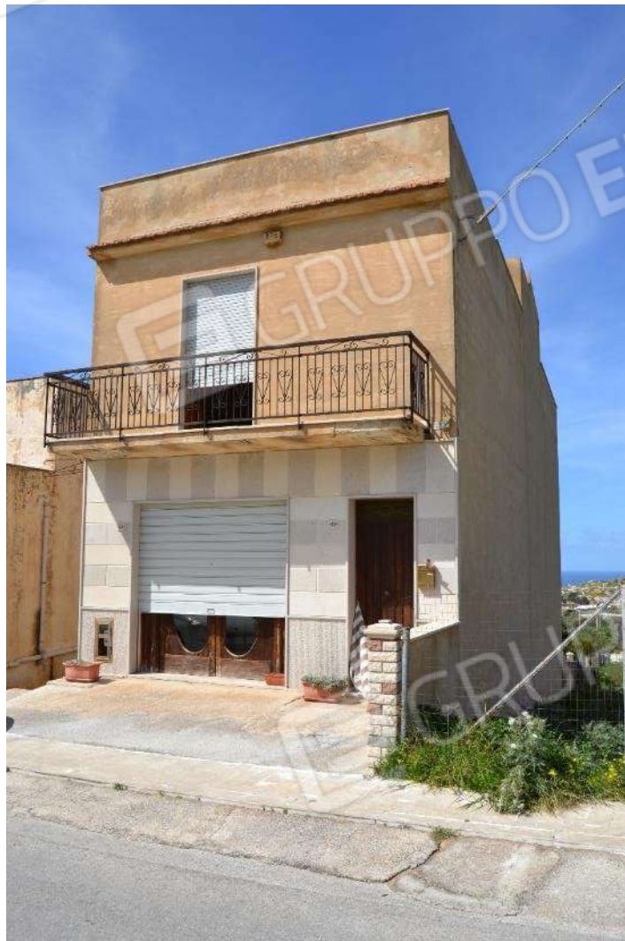
Foto 17) BENE 5 – Vista facciata su Via Piano Alastre e accesso dal civico 35