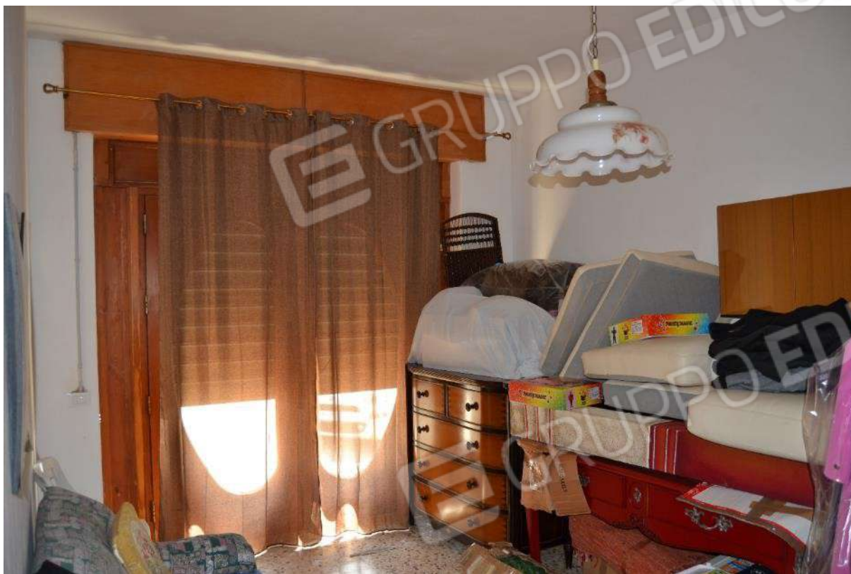
Foto 25) BENE 5 – Garage-riposto con vano di accesso dalla via Piano Alastre