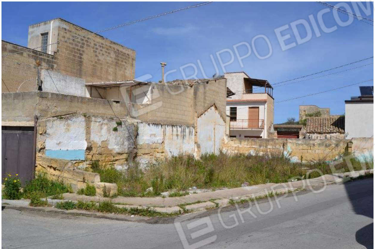
Foto 13) BENE 4 – Vista del lotto di terreno su cui sorgeva l'immobile e sagome (via Santa Lucia angolo via del Mare)