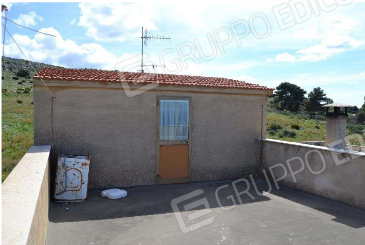
Foto 39) BENE 5 – Vista prospetto lato nord del locale lavanderia al piano secondo