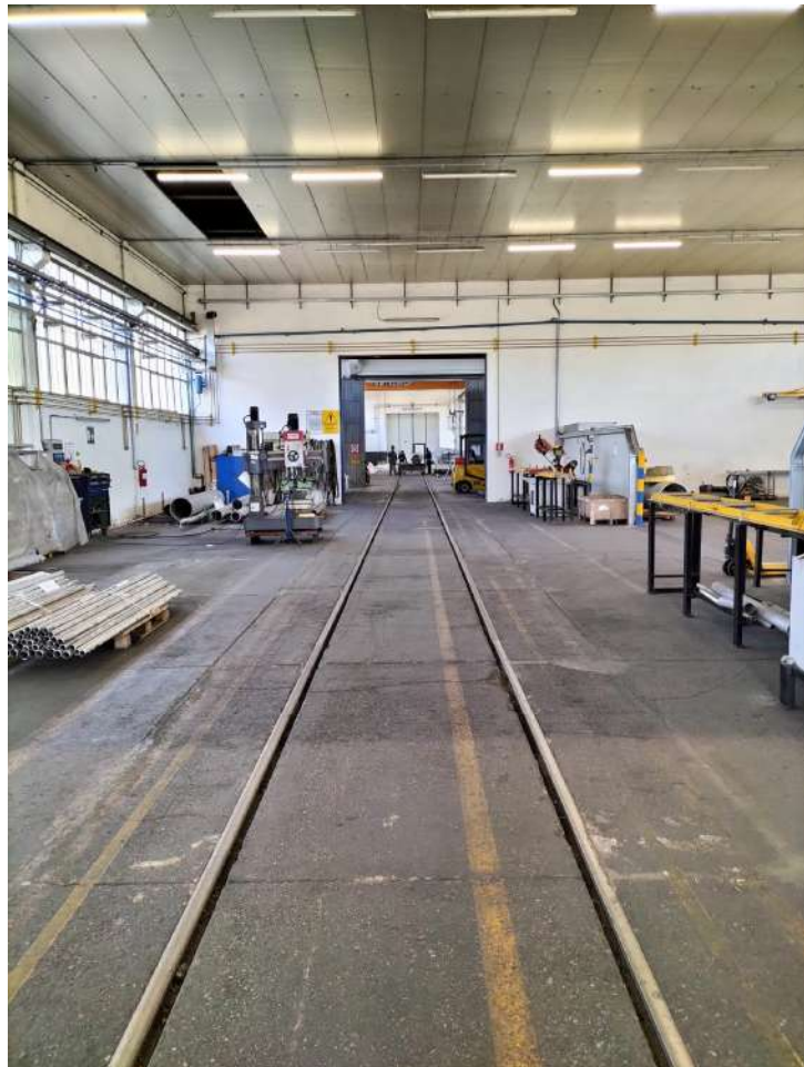
Fabbricato industriale blocco C zona lavoro