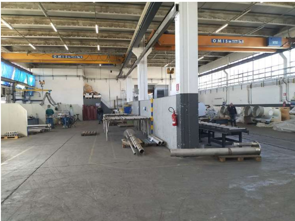
Fabbricato industriale blocco E zona lavoro