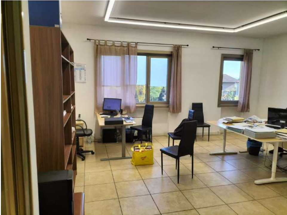
Zona ad uso uffici piano primo sala lavoro