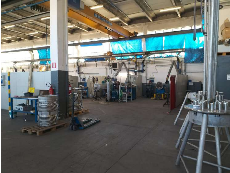
Fabbricato industriale blocco E zona lavoro