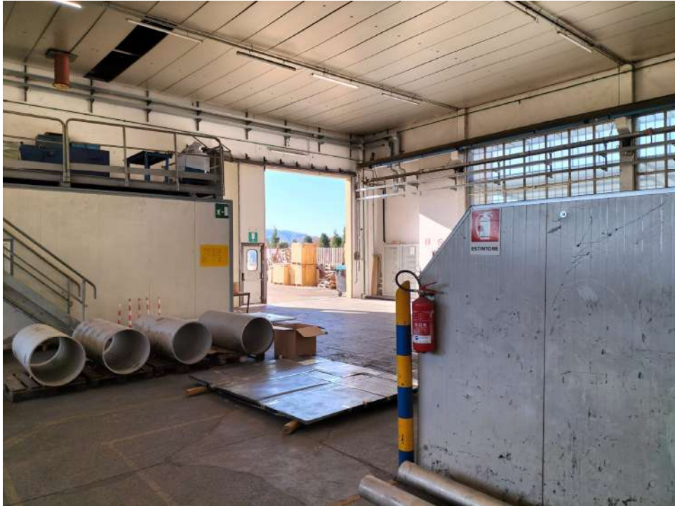
Fabbricato industriale blocco C accesso