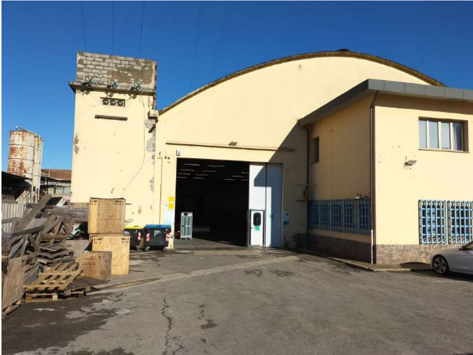
Prospetto frontale accesso zona lavorazioni