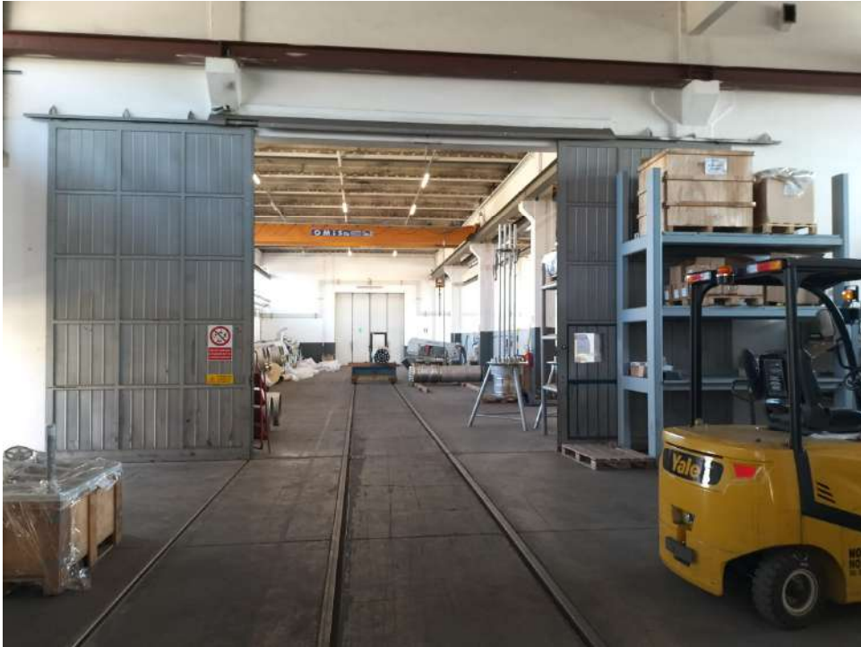
Fabbricato industriale blocco D zona magazzino