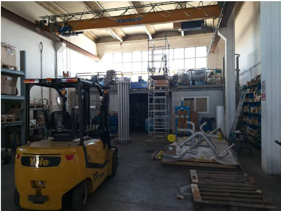
Fabbricato industriale blocco D zona soppalcata