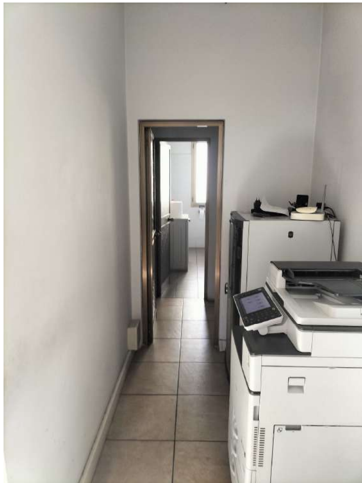
Zona ad uso uffici piano primo disimpegno e bagni