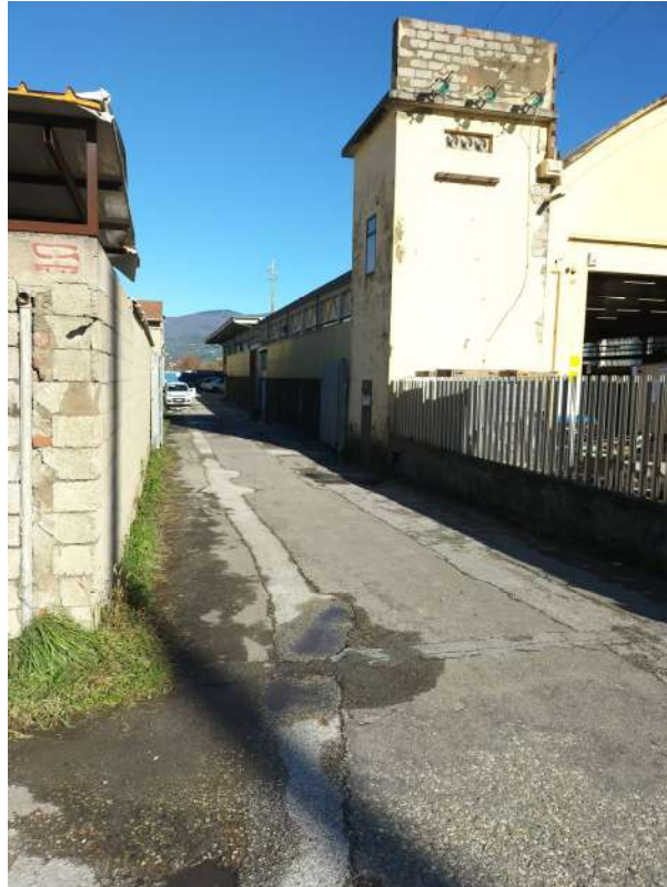
Cabina elettrica a servizio e strada senza sbocco