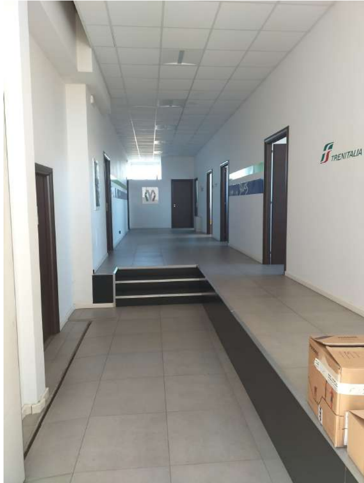
Ingresso piano terra