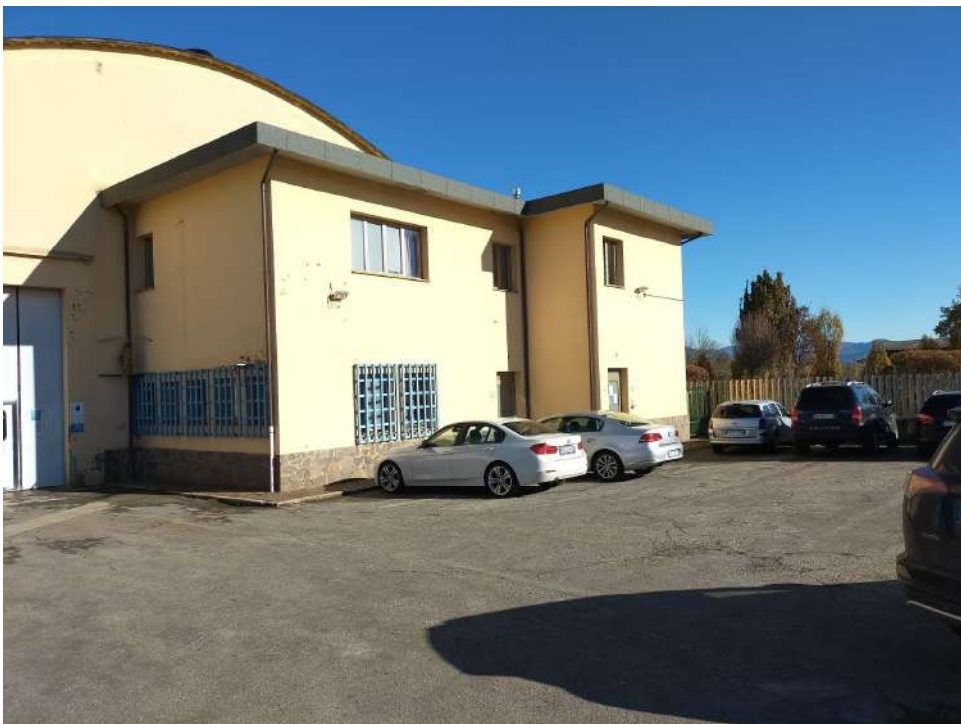
Prospetto frontale zona uso uffici