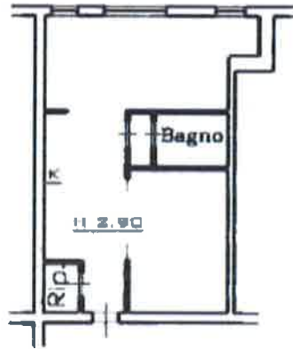
Pianta piano primo