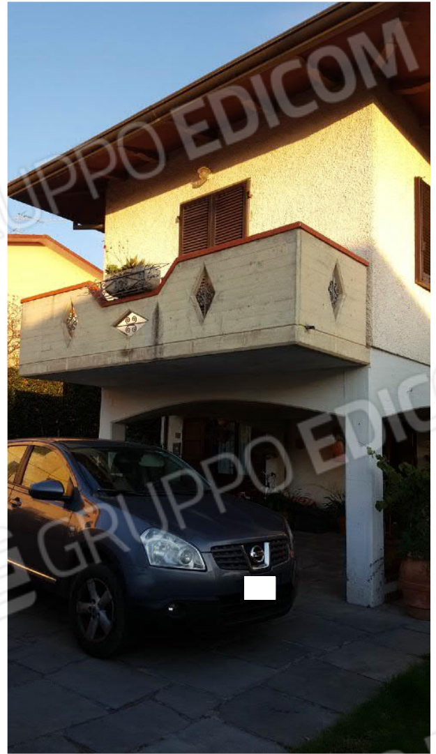
Foto 35. Prospetto lato Carrara lotto 1