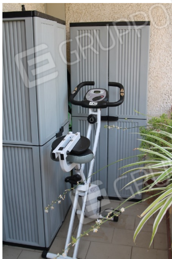
Foto 18. Terrazza lotto 1