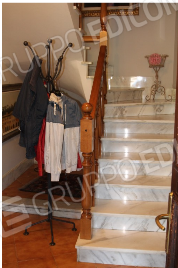
Foto 2. Ingresso e vano scala lotto 1