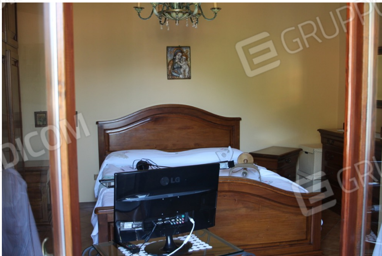
Foto 23. Camera 2 lotto 1