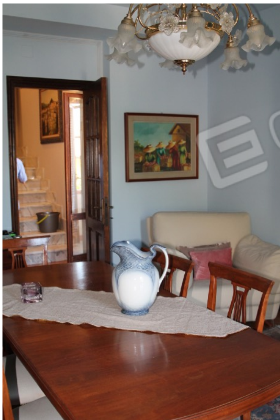
Foto 11. Sala lotto 1