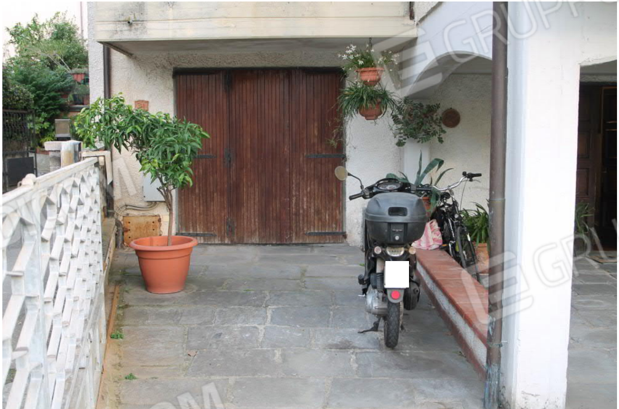
Foto 36. Prospetto lato Carrara piano terra lotto 1