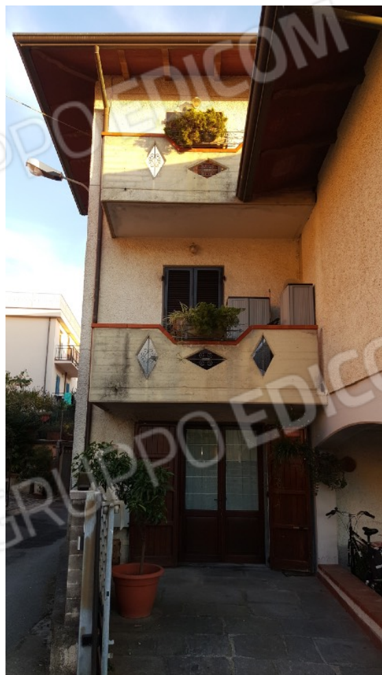
Foto 32. Prospetto lato Carrara lotto 1