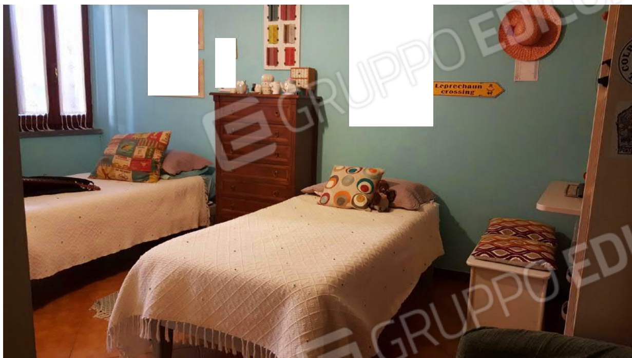
Foto 19. Camera 1 lotto 1