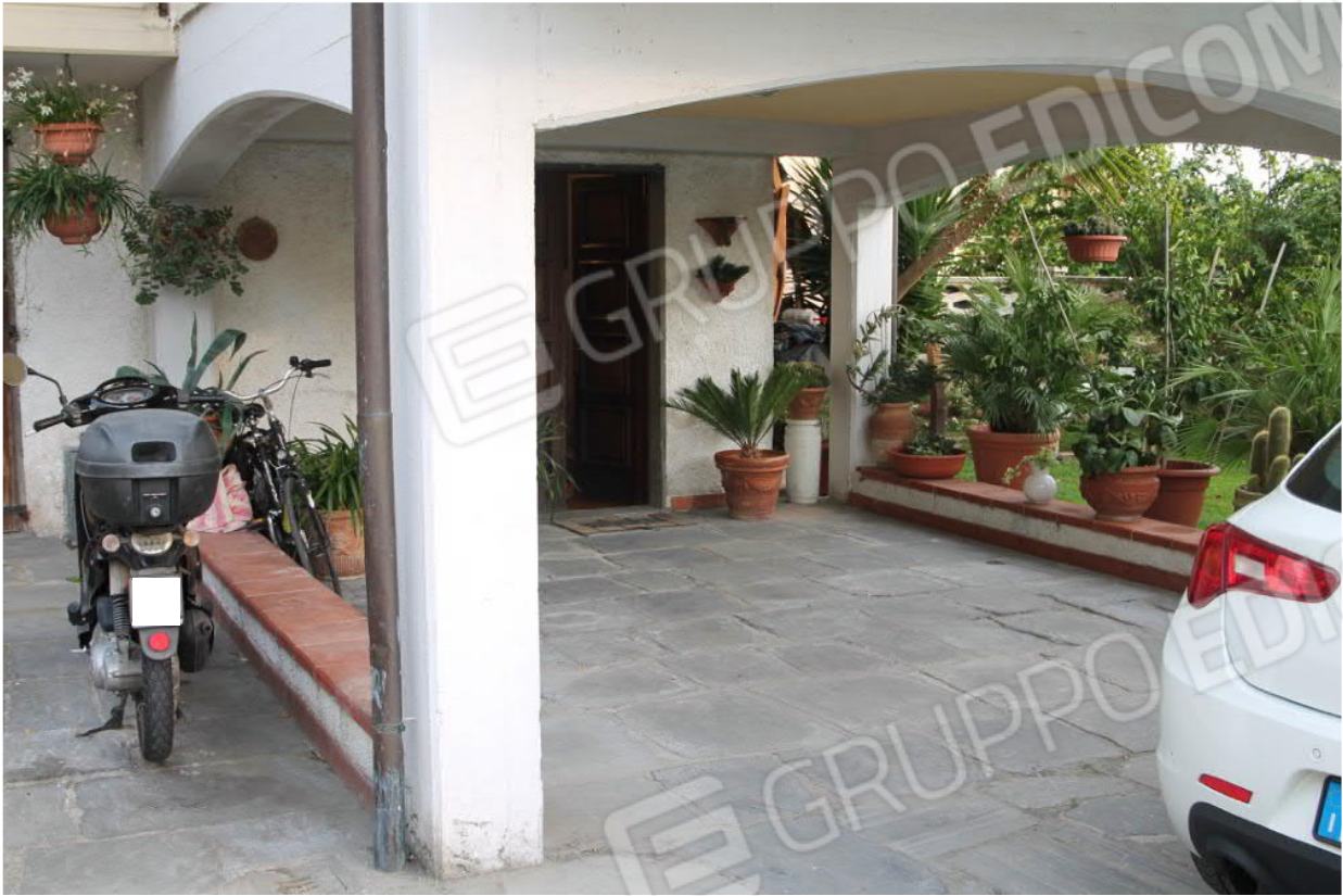
Foto 37. Loggia lotto 1