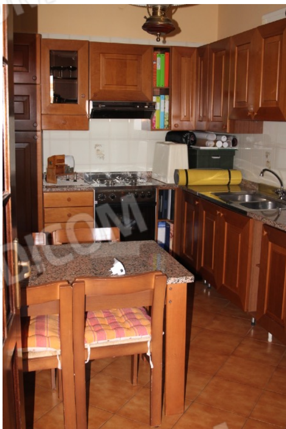
Foto 13. Cucina lotto 1