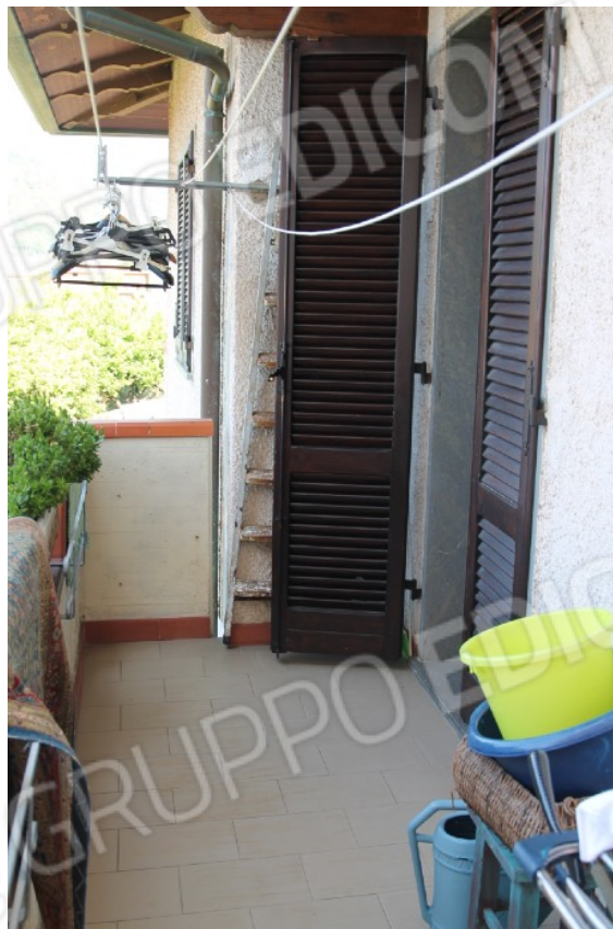
Foto 16. Terrazza 3 lotto 1