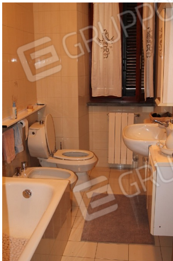
Foto 14. Bagno 1 lotto 1