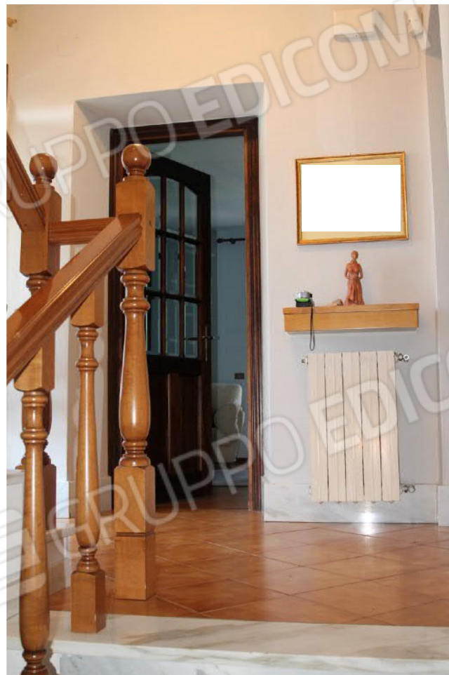
Foto 22. Pianerottolo piano primo lotto 1