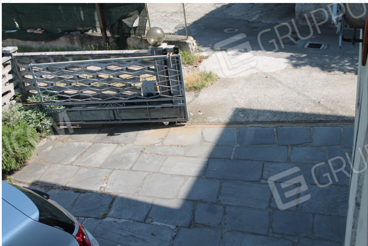
Foto 33. Area di pertinenza esterna lotto 1