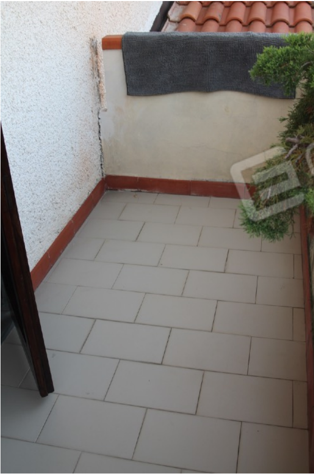
Foto 24. Terrazza 4 lotto 1