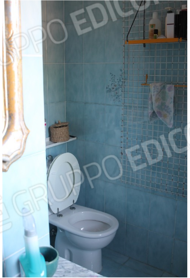
Foto 29. Bagno lotto 1