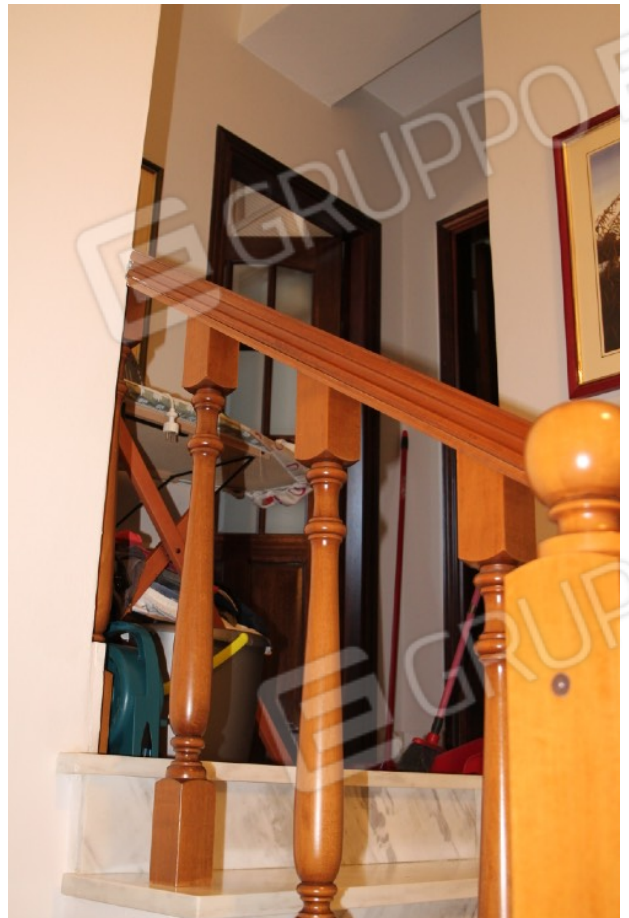
Foto 27. Pianerottolo piano secondo lotto 1