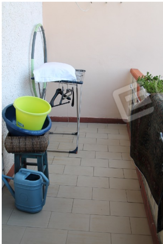
Foto 15. Terrazza 3 lotto 1