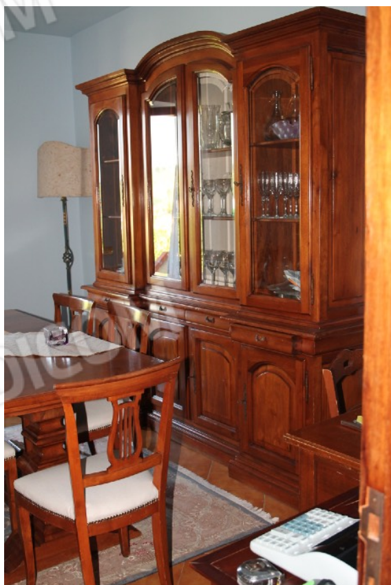
Foto 9. Sala lotto 1