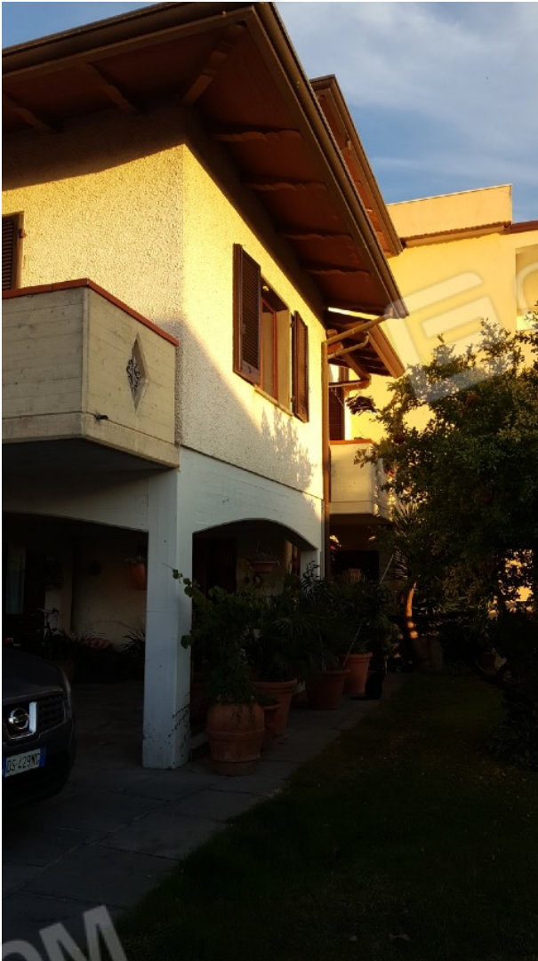
Foto 34. Prospetto lato mare lotto 1