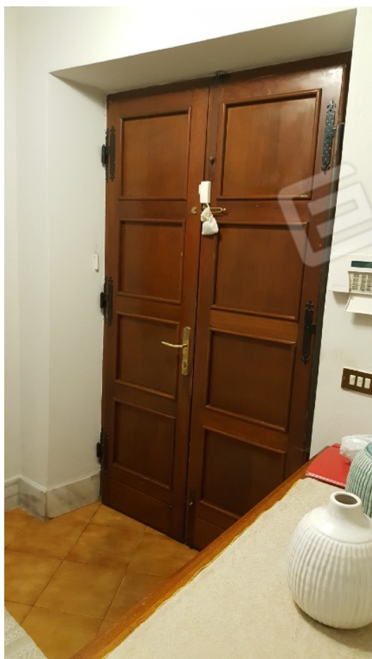
Foto 1. Ingresso lotto 1