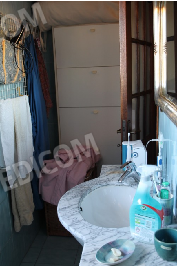
Foto 26. Bagno 2 lotto 1