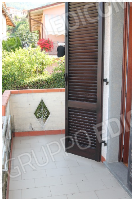
Foto 12. Terrazza 2 lotto 1