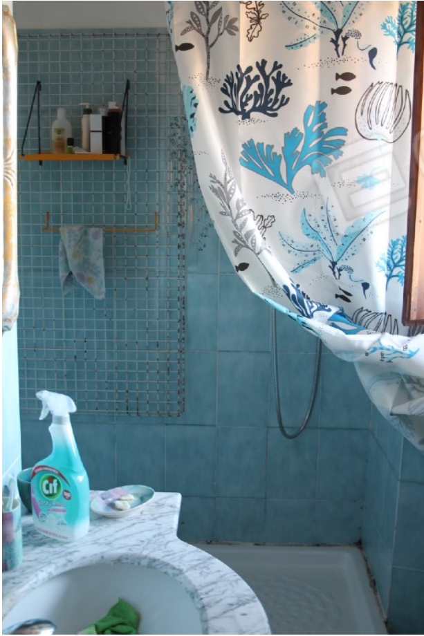
Foto 28. Bagno lotto 1