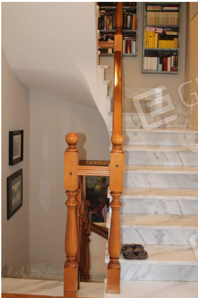
Foto 21. Vano scala tra piano primo e secondo lotto 1