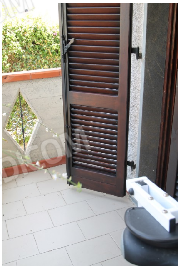
Foto 17. Terrazza 1 lotto 1