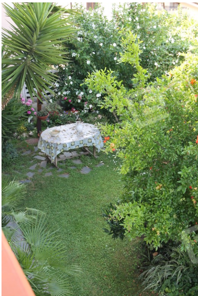
Foto 31. Area di pertinenza esterna lotto 1