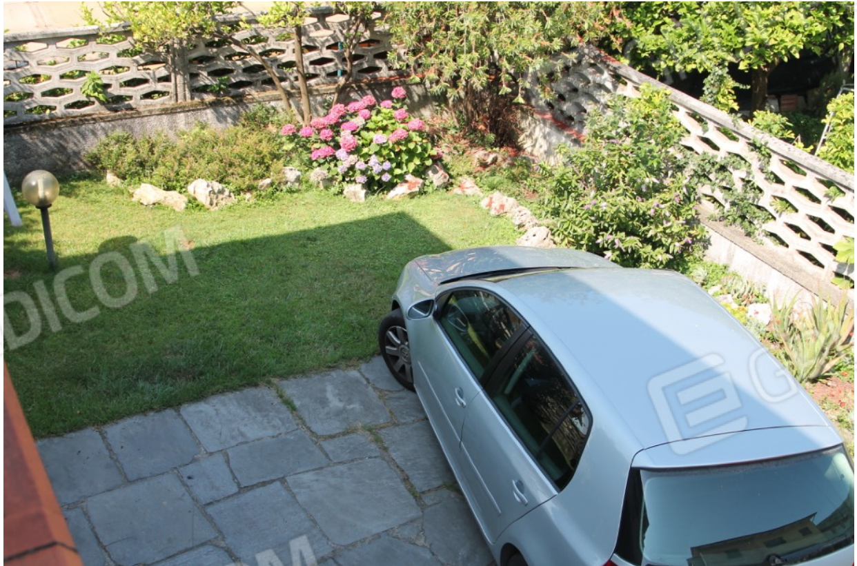
Foto 30. Area di pertinenza esterna lotto 1