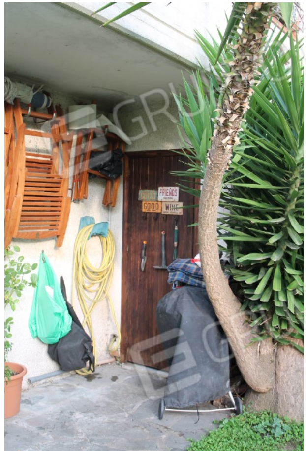
Foto 39. Locale tecnico lotto 1