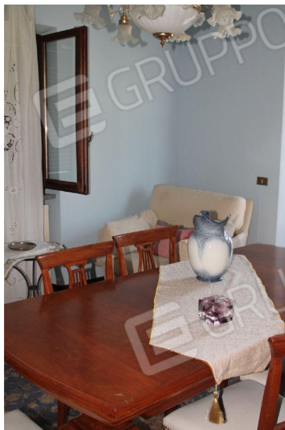
Foto 10. Sala lotto 1