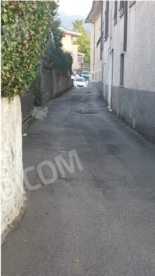
Foto 38. Strada di accesso al lotto 1 e utilizzata attualmente anche per raggiungere il lotto3