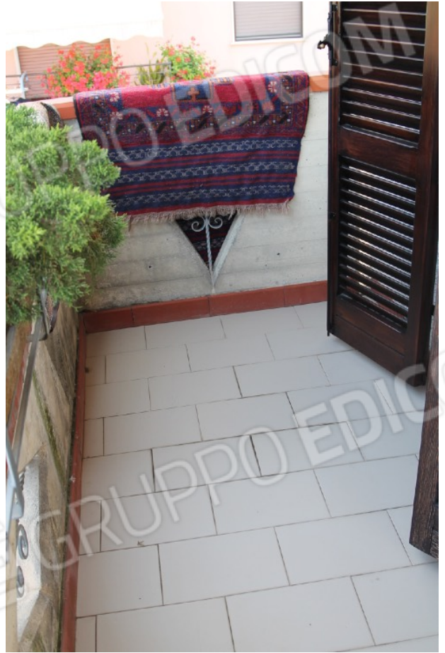
Foto 25. Terrazza 4 lotto 1