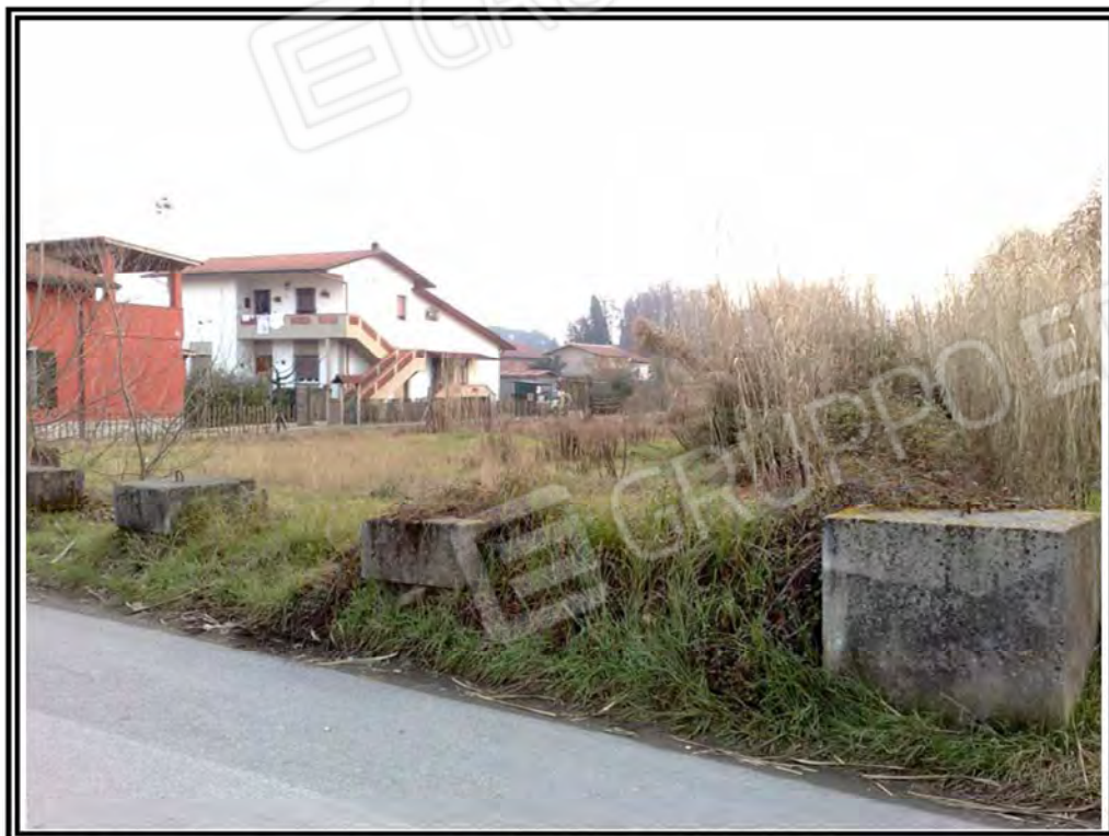
Foto n. 1 - Lato del terreno attestato su Via Trento