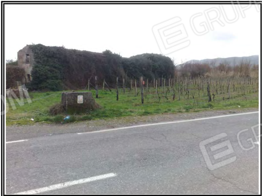
Foto n. 4 – Terreno mappali 42, 44, 45, 252, 253, 254, 255, 311, 161