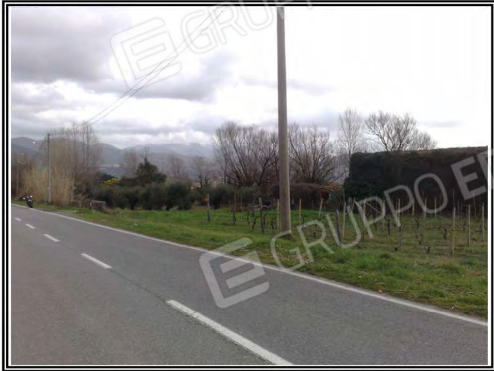
Foto n. 3 – Terreno mappali 42, 44, 45, 252, 253, 254, 255, 311, 161