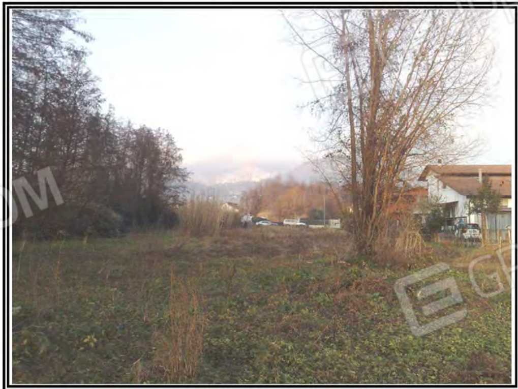
Foto n. 3 - Vista verso mare all'interno del terreno