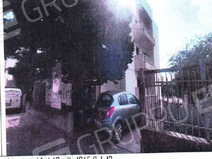
Comune di Nova Siri prospetto laterale unità al f.gl 49 p.IIa 1045 Sub 12