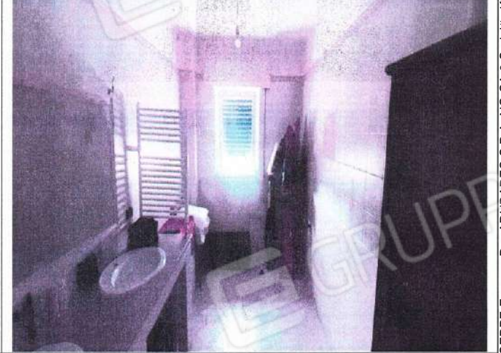
Particolare ambienti interni bagno