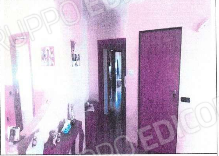
Particolare ambienti interni ingresso e cucina