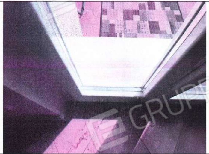
Particolare pavimentazione ed infissi esterni