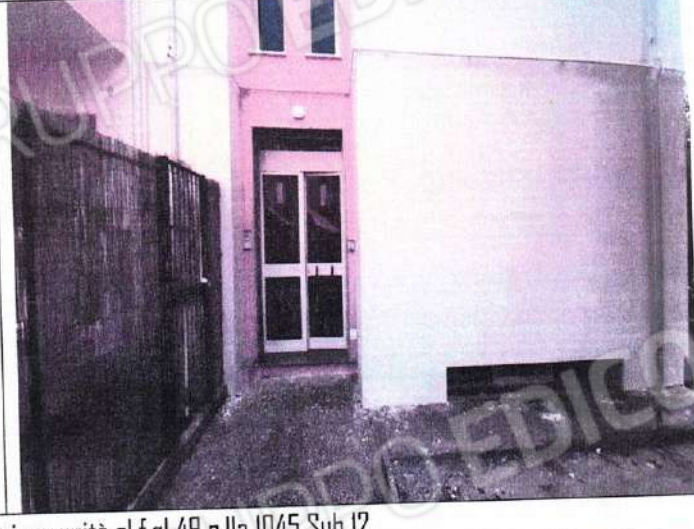
Comune di Nova Siri prospetto anteriore unità al f.gl 49 p.IIa 1045 Sub 12