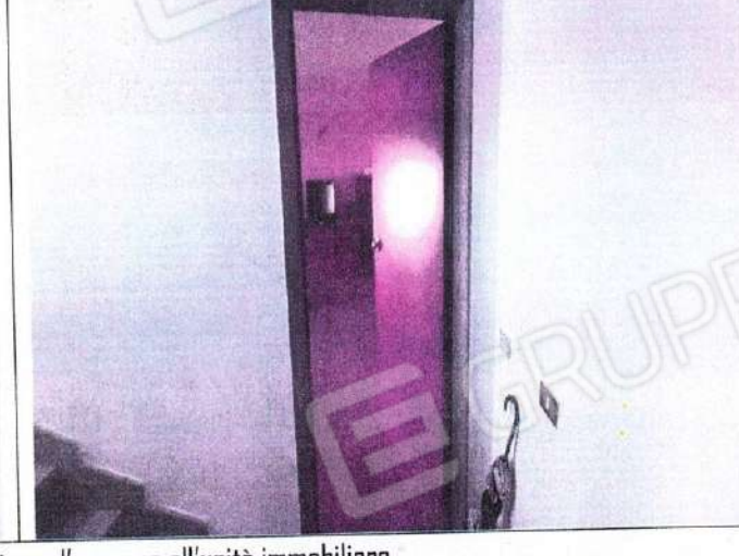
Particolare androne scale e portone d'accesso all'unità immobiliare