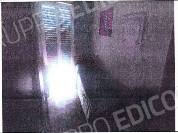
Particolare ambienti interni zona notte