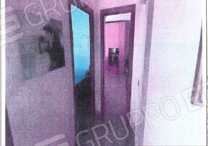
Particolare ambienti interni soggiorno e disimpegno