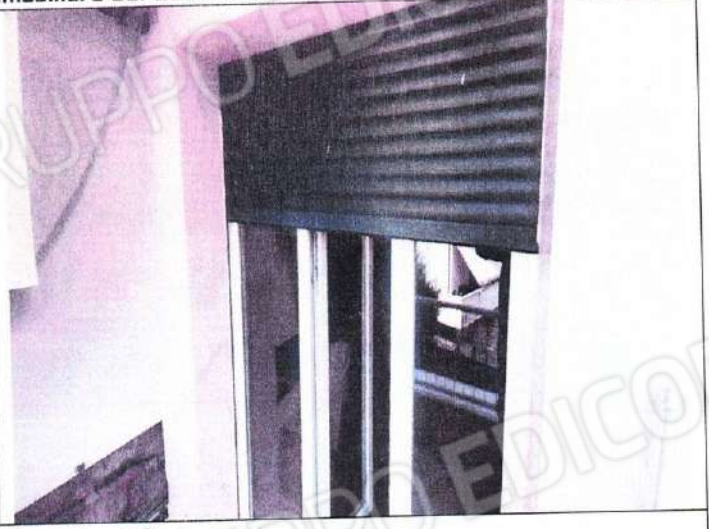
Particolare impianto riscaldamento e infissi esterni