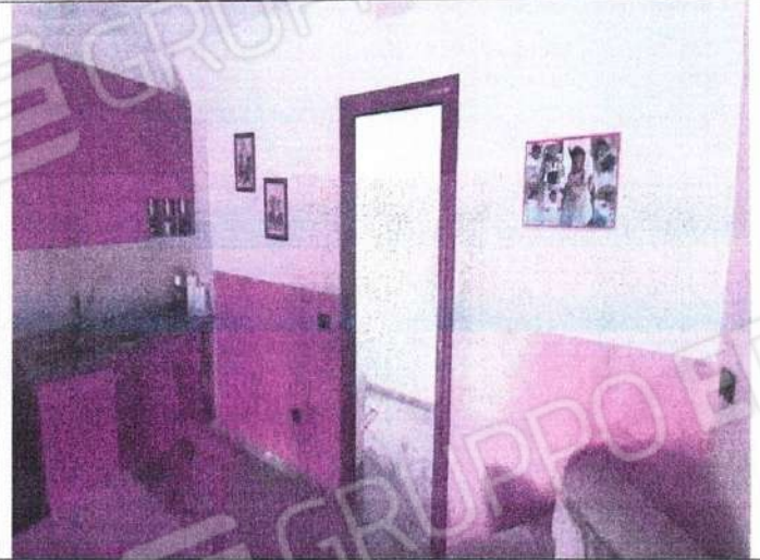
Particolare ambienti interni