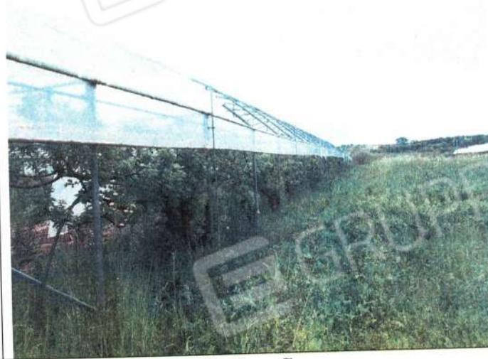
Serre in stato di abbandono culturale comune di Bernalda Sez. C.