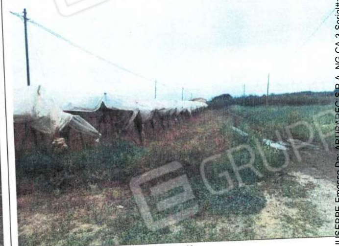
F.gl 87 P.lla 618 e p.lla 304 vigneto con copertura antigrandine