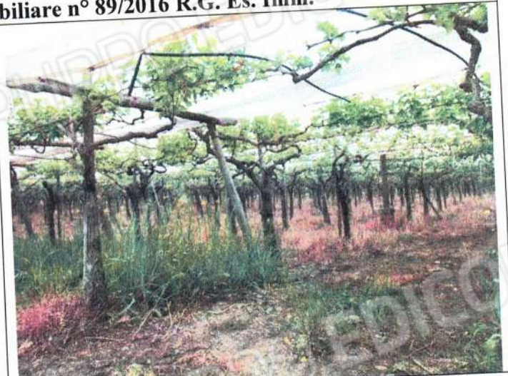
F.gl 87 P.lla 618 e p.lla 304 vigneto con copertura antigrandine