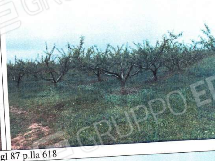
Pescheto f.gl 87 p.lla 618