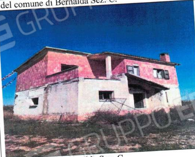
Fabbricato fgl 87 p.lla 601 (ex106) del comune di Bernalda Sez. C.