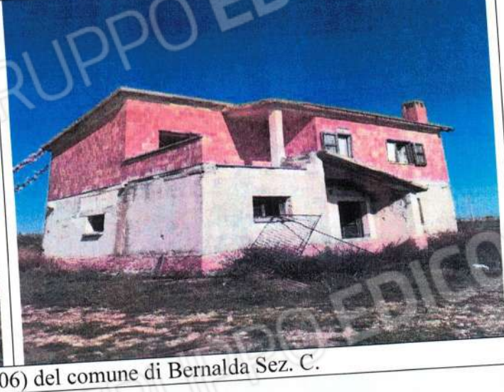
Fabbricato fgl 87 p.lla 601 (ex106) del comune di Bernalda Sez. C.