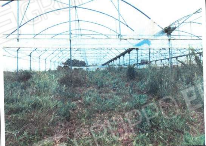
Serre in stato di abbandono culturale comune di Bernalda Sez. C.