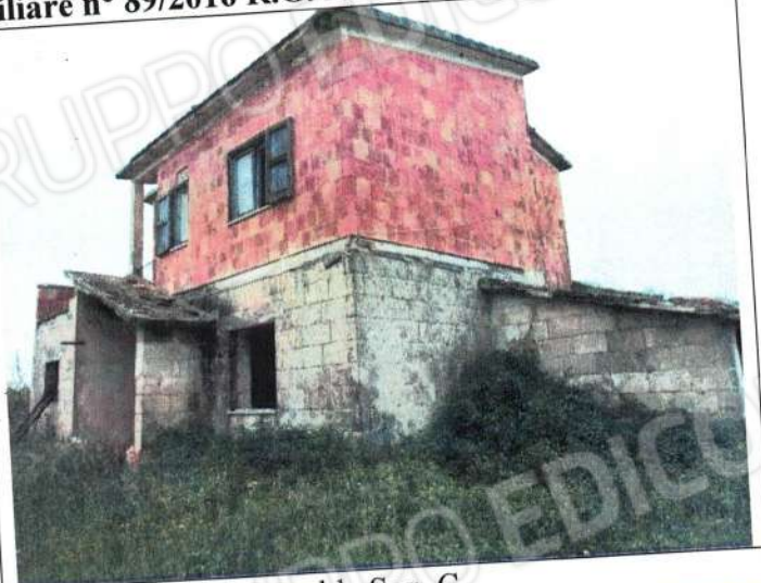
Fabbricato fgl 87 p.lla 601 (ex106) del comune di Bernalda Sez. C.