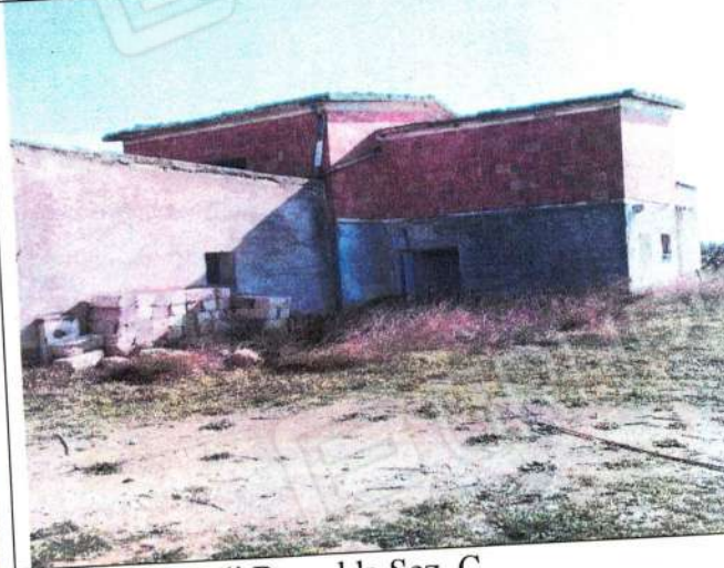
Fabbricato fgl 87 p.lla 601 (ex106) del comune di Bernalda Sez. C.