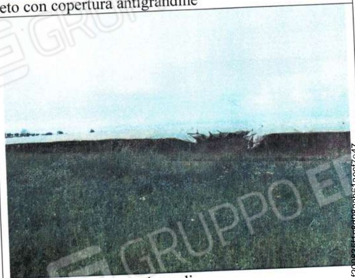
F.gl 87 P.lla 618 e p.lla 304 vigneto con copertura antigrandine