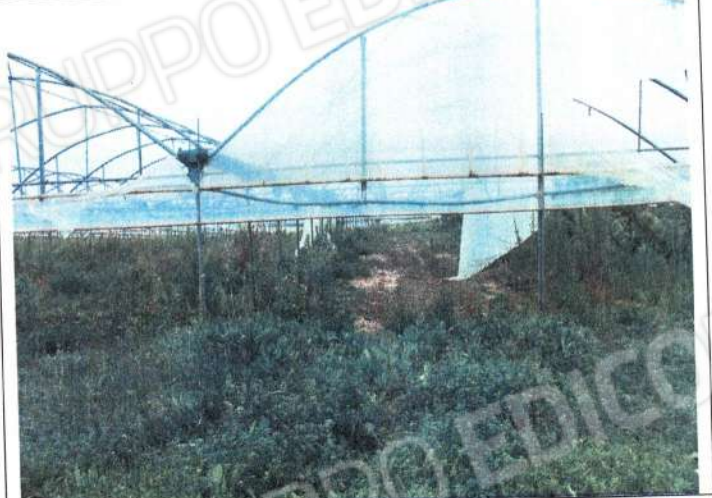
Serre in stato di abbandono culturale comune di Bernalda Sez. C.