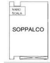
PIANO AMMEZZATO (SOPPALCO) H=mt. 2.00