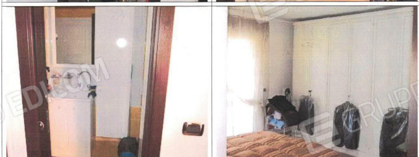
Unità immobiliare foglio n° 35, particella n° 1844, sub. 46