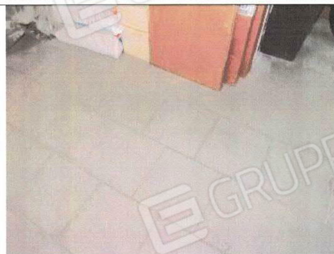
Unità immobiliare accessoria - foglio n° 35, particella n° 1844, sub. 53