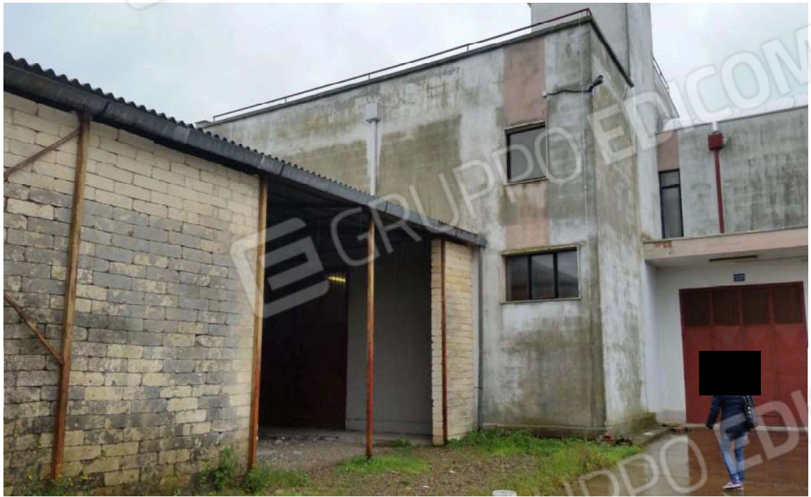
Foto 4: Degrado dei prospetti. Locale deposito con copertura in cemento-amianto