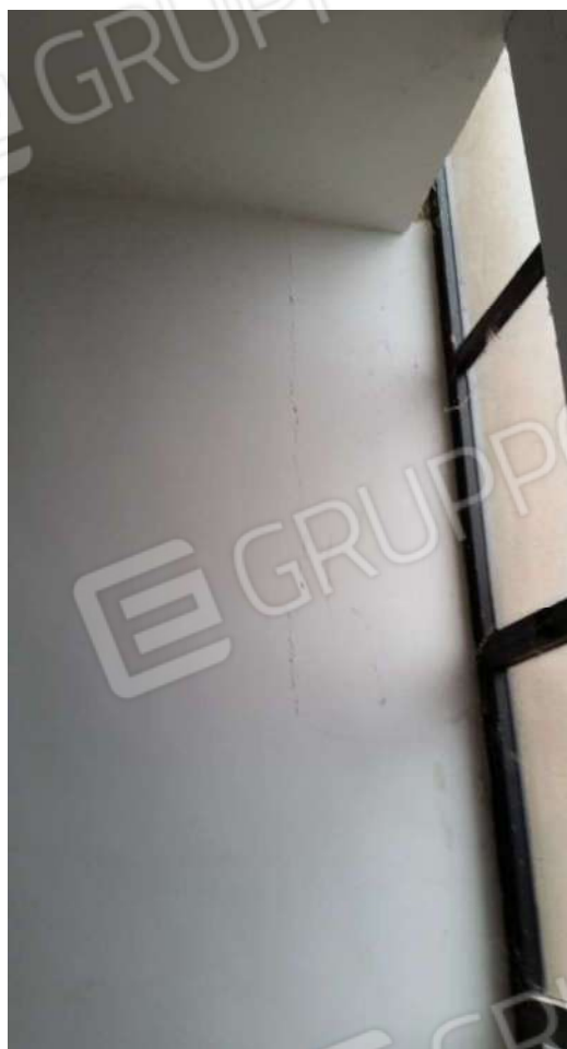
Foto 10-11-12: Quadri fessurativi sulle chiusure verticali esterne