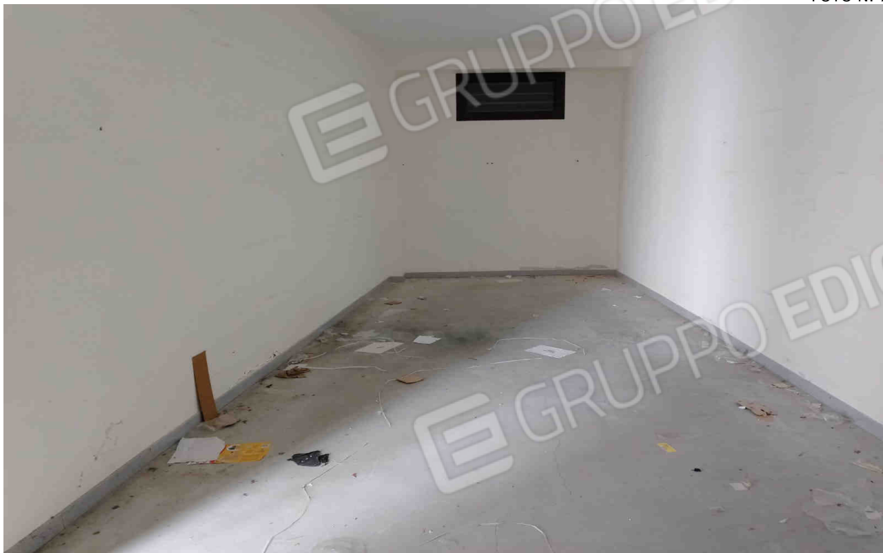
COMUNE DI MATERA FOGLIO 101 PARTICELLA 657 SUB 16 - LOTTO 4 - INTERNO