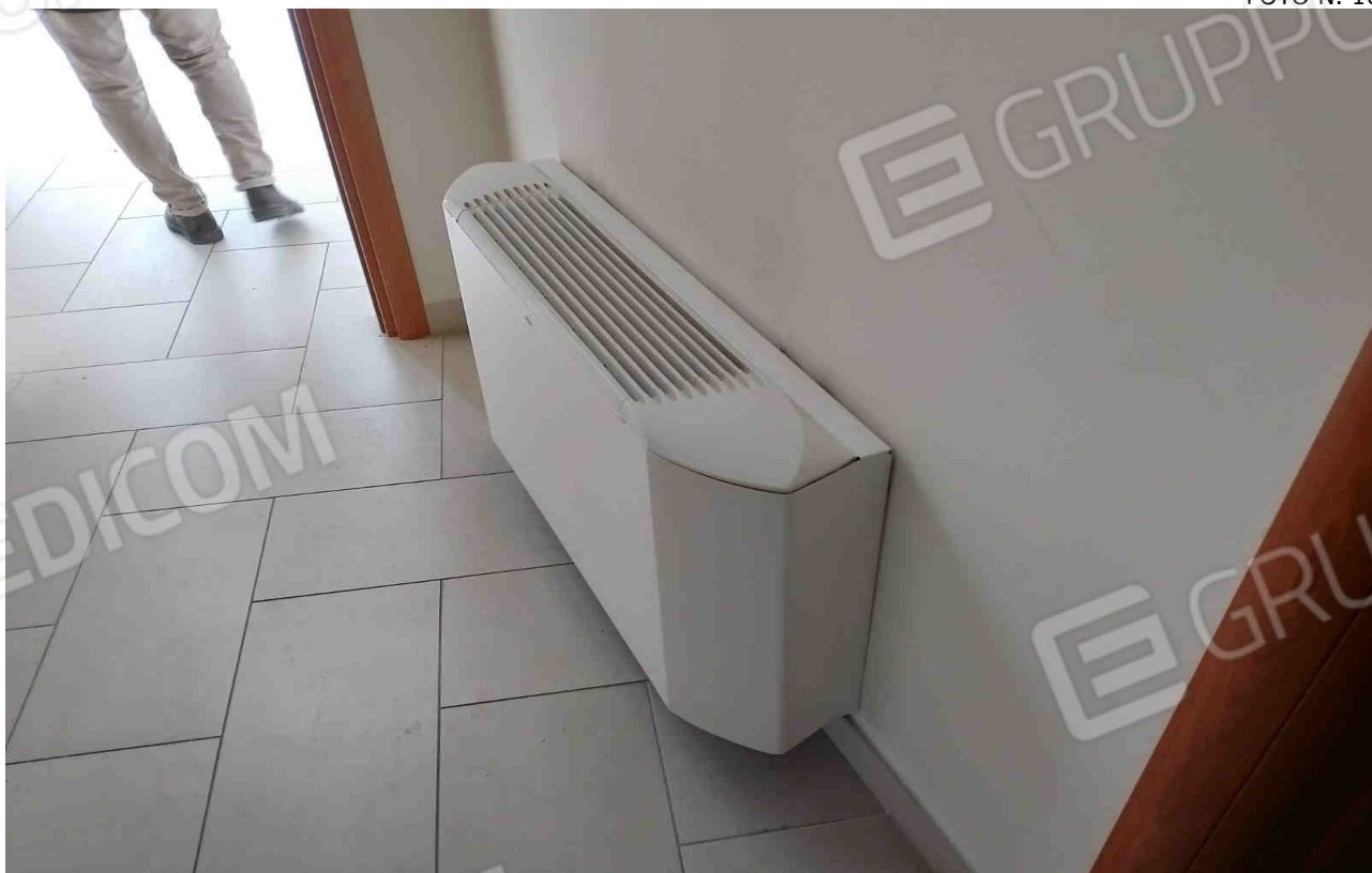
COMUNE DI MATERA FOGLIO 101 PARTICELLA 657 SUB 28 - LOTTO 5 - FAN COIL