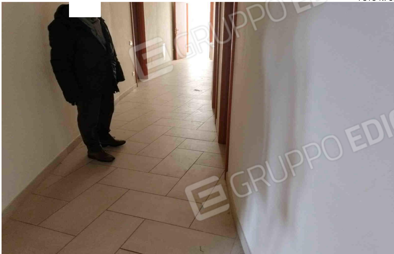
COMUNE DI MATERA FOGLIO 101 PARTICELLA 657 SUB 28 - LOTTO 5 - INTERNO