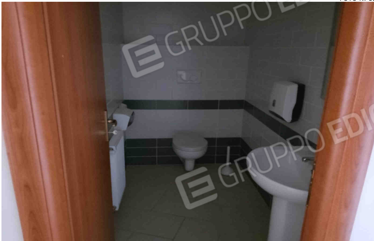
COMUNE DI MATERA FOGLIO 101 PARTICELLA 657 SUB 28 - LOTTO 5 - BAGNI