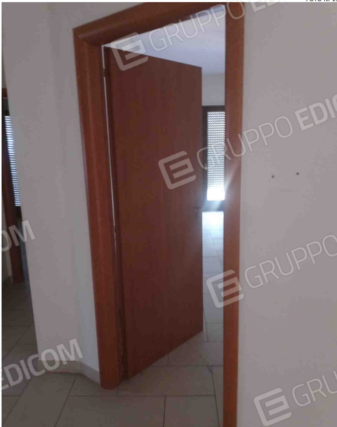
COMUNE DI MATERA FOGLIO 101 PARTICELLA 657 SUB 28 - LOTTO 5 - INFISSI INTERNI