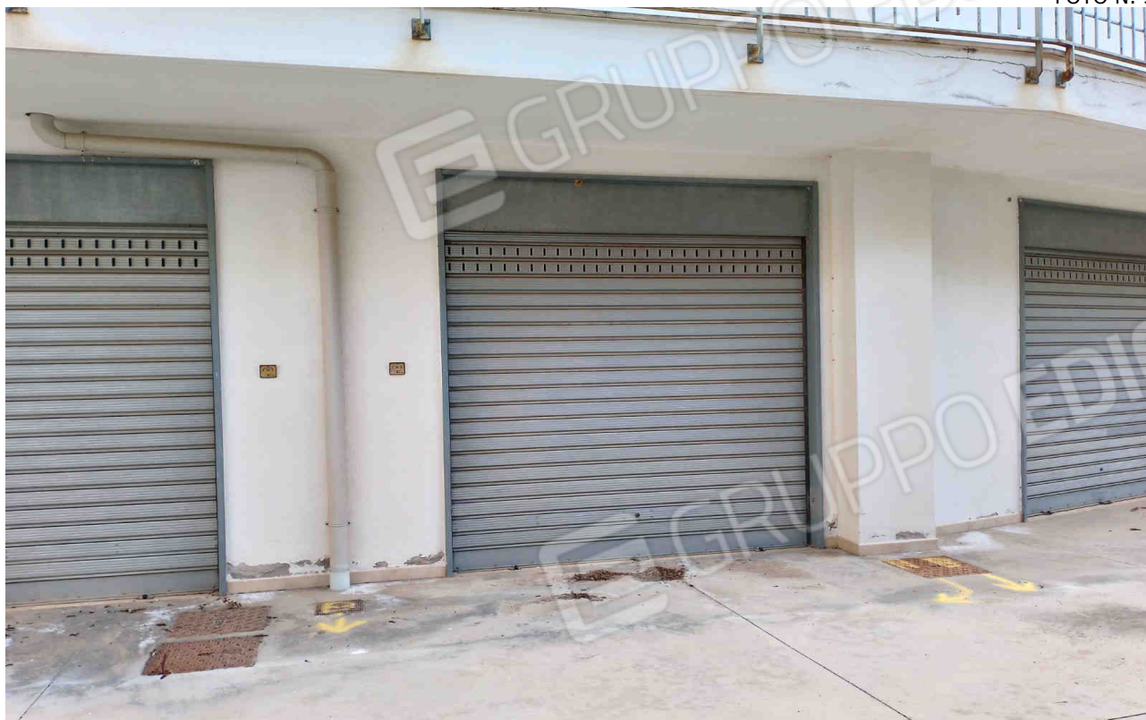
COMUNE DI MATERA FOGLIO 101 PARTICELLA 657 SUB 15 - LOTTO 3 - ACCESSO