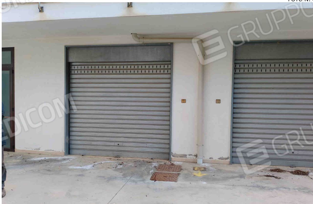
COMUNE DI MATERA FOGLIO 101 PARTICELLA 657 SUB 16 - LOTTO 4 - ACCESSO