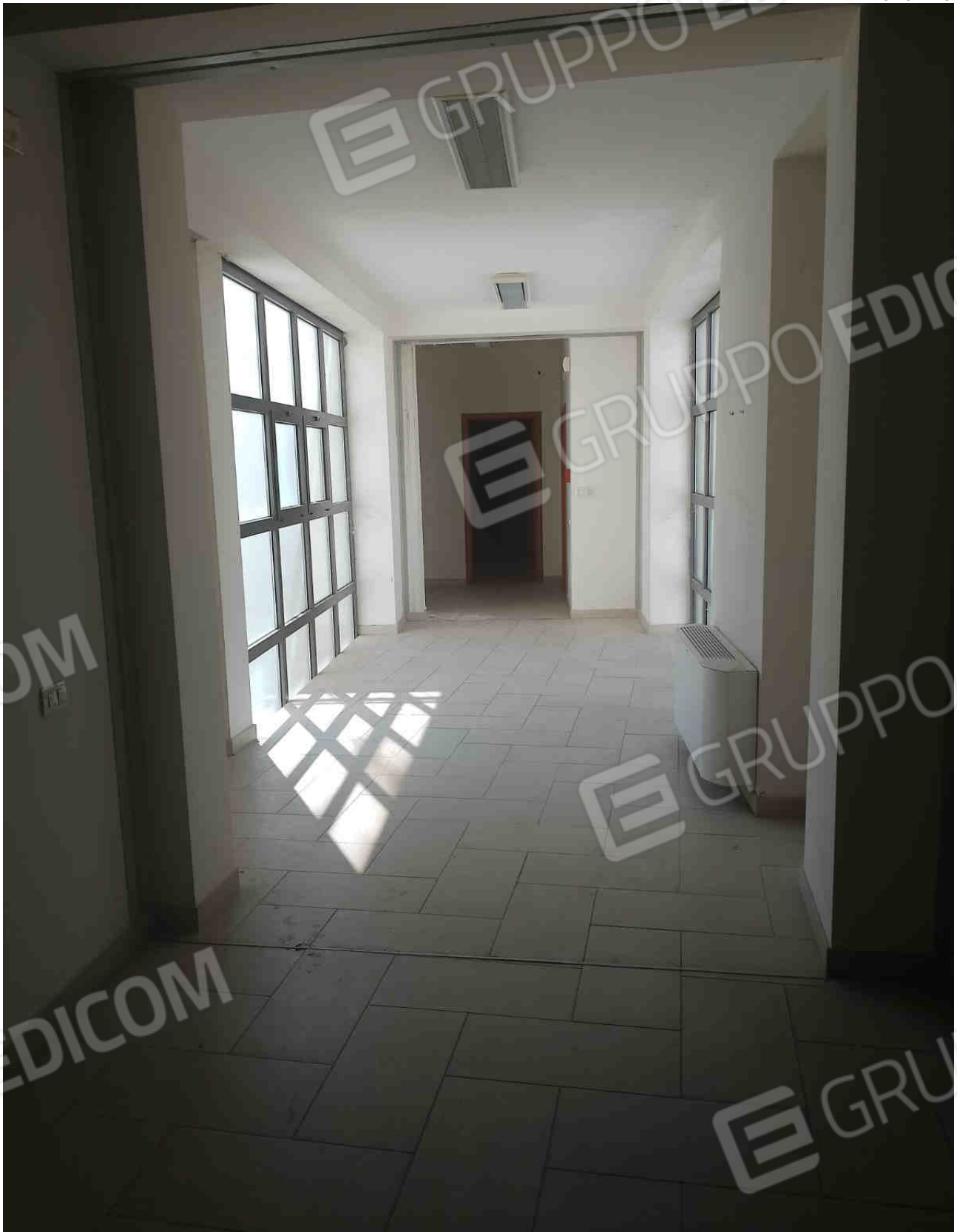
COMUNE DI MATERA FOGLIO 101 PARTICELLA 657 SUB 28 - LOTTO 5 - INTERNO