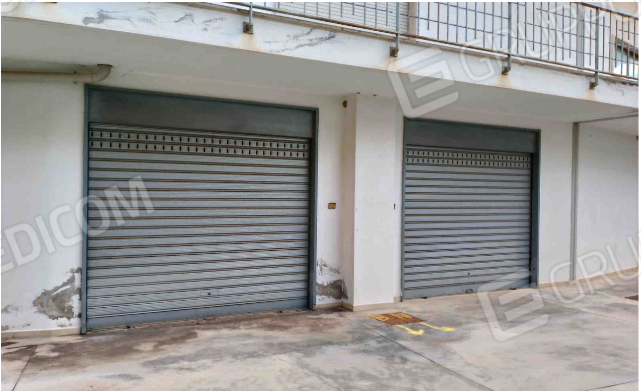
COMUNE DI MATERA FOGLIO 101 PARTICELLA 657 SUB 14 - LOTTO 2 - ACCESSO