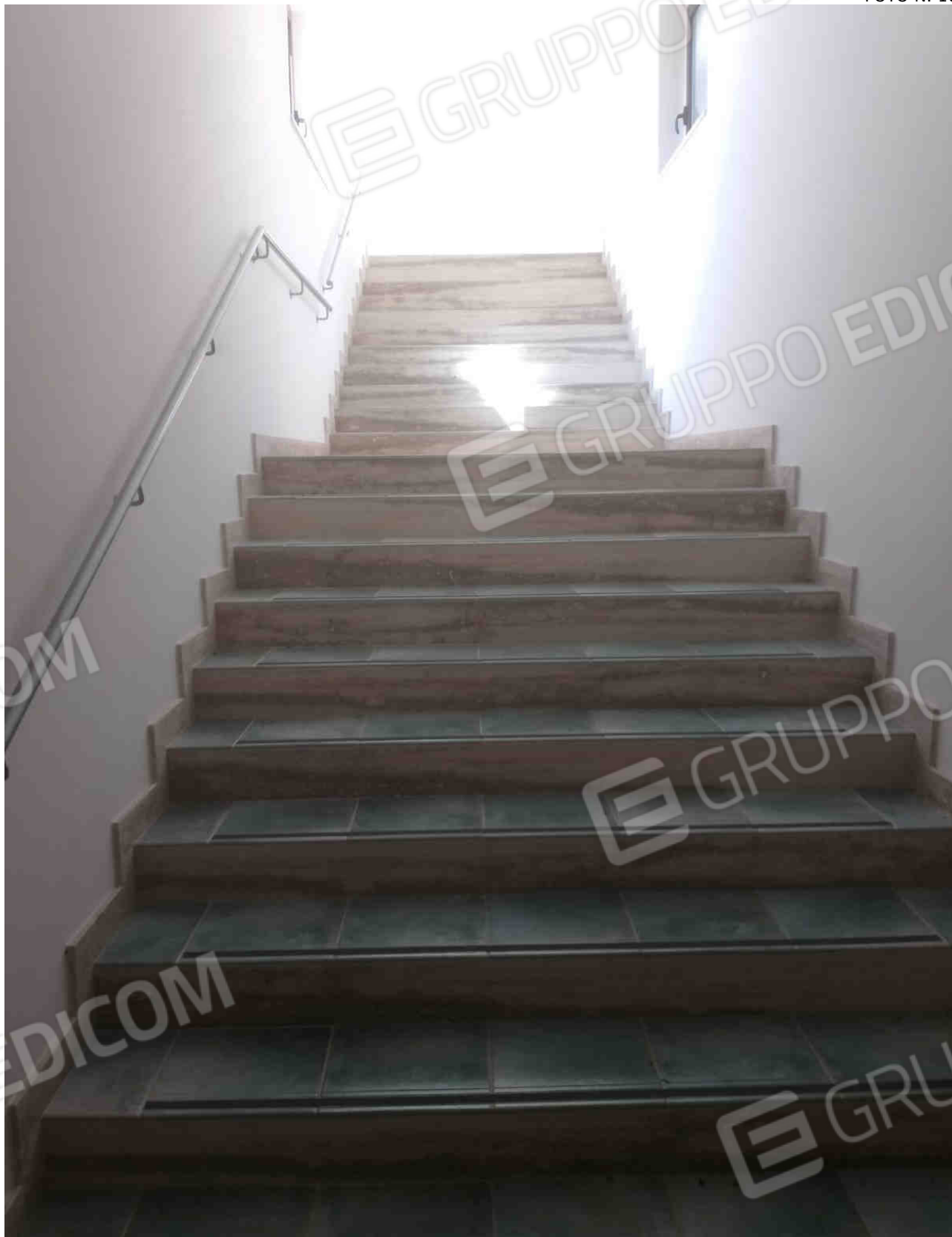
COMUNE DI MATERA FOGLIO 101 PARTICELLA 657 SUB 28 - LOTTO 5 - INTERNO