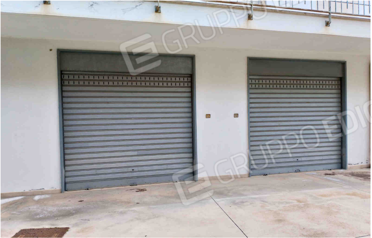
COMUNE DI MATERA FOGLIO 101 PARTICELLA 657 SUB 13 - LOTTO 1 - ACCESSO