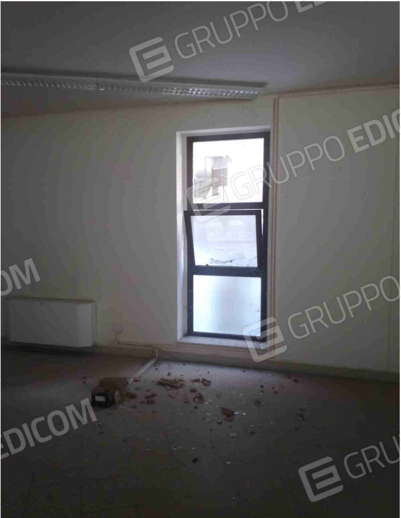
COMUNE DI MATERA FOGLIO 101 PARTICELLA 657 SUB 28 - LOTTO 5 – INFISSI VANDALIZZATI