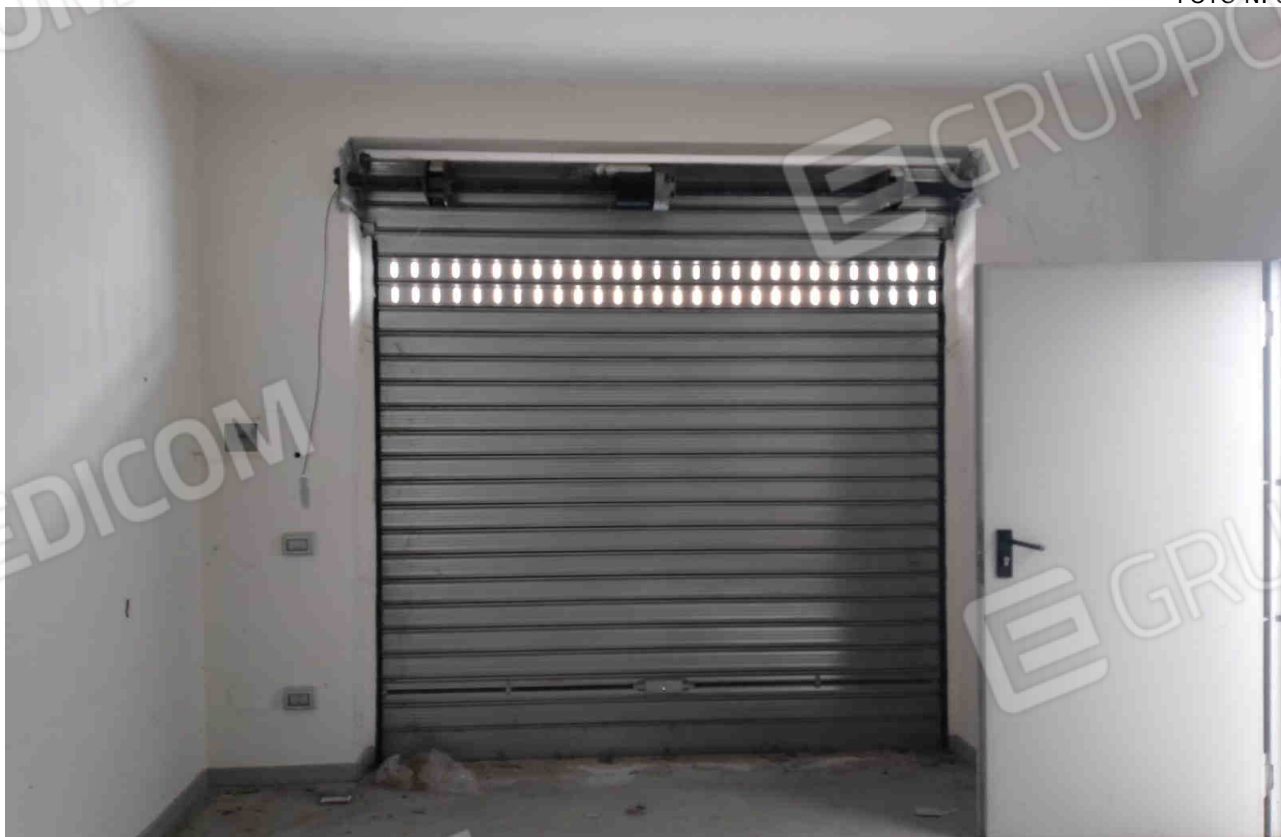
COMUNE DI MATERA FOGLIO 101 PARTICELLA 657 SUB 16 - LOTTO 4 - SARACINESCA INTERNO