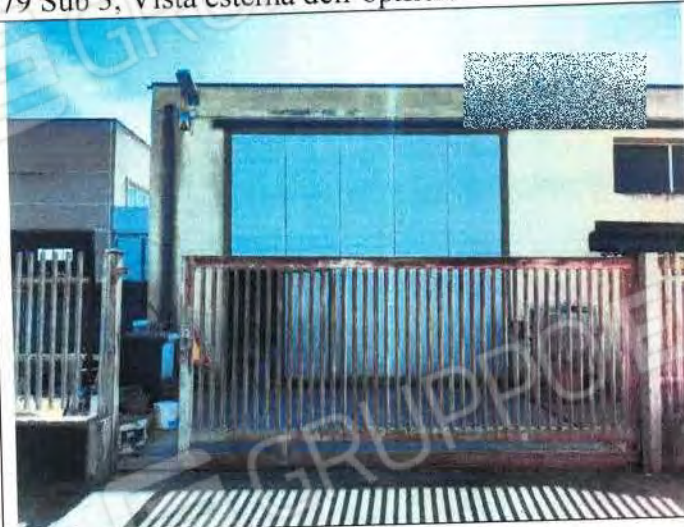
Vista esterna dello stabilimento ingresso dipendenti e materiale