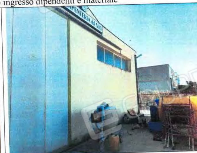
Ingresso e area esterna di stoccaggio materiale