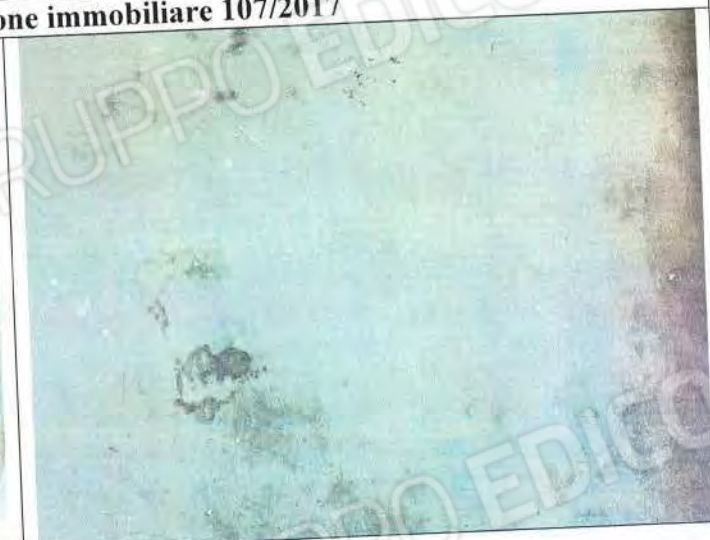
Particolari solaio Sub 3