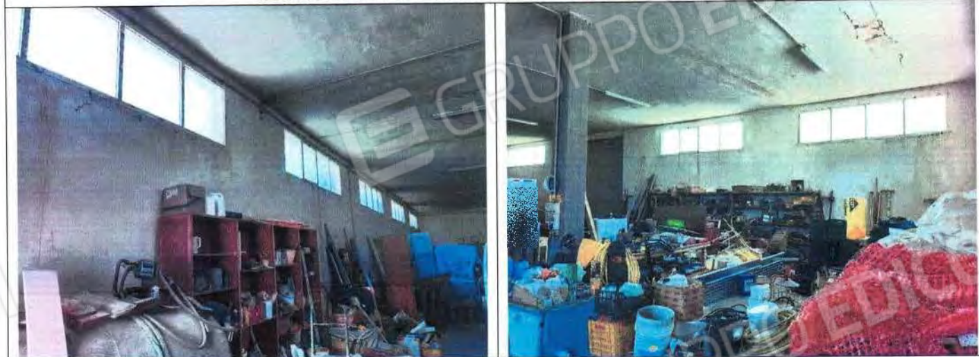
Area locale interno destinato a lavorazione e deposito attrezzatura e materiale