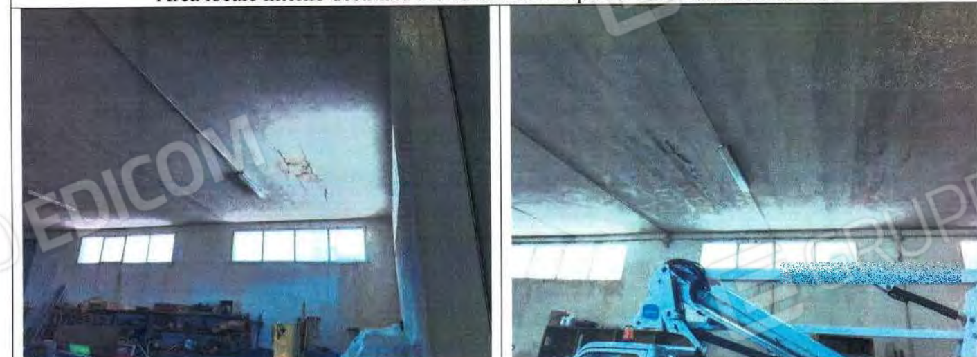
Particolari interno opificio con visione del solaio con infiltrazioni idriche