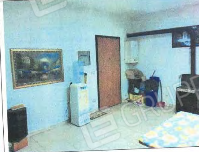
Accesso e interni ufficio Sub 4 a piano terra