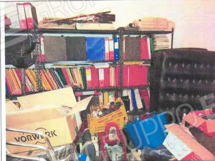
Particolari ambienti interni ufficio Sub 4