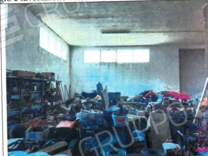
Area interna f.gl 46 p.lla 679 sub 3