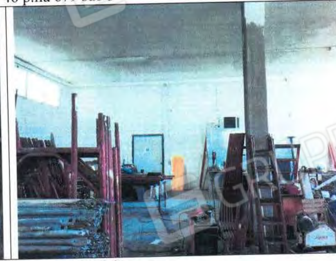
Area interna di stoccaggio materiale