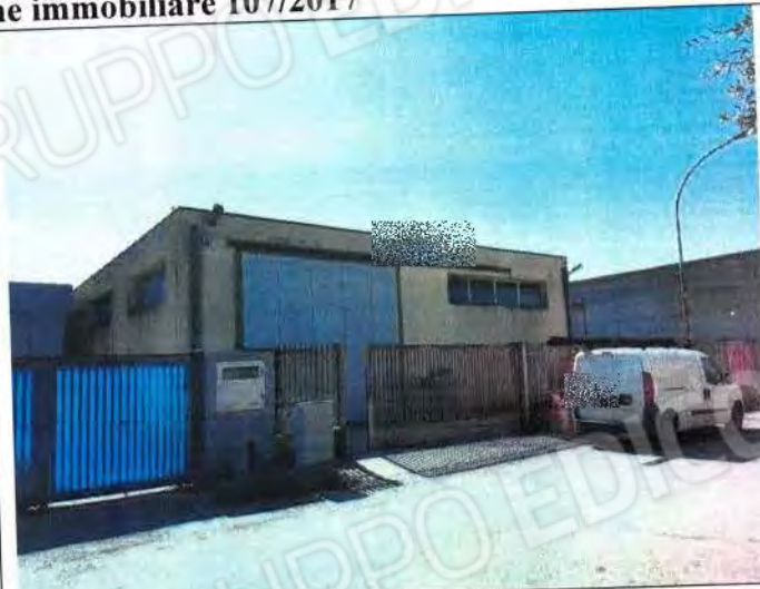
Comune di Rotondella, f.gl 46 p.lla 679 Sub 3, Vista esterna dell'opificio