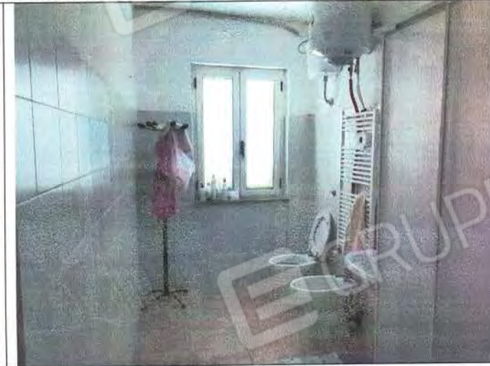
Particolari ambienti interni ufficio e bagno Sub 4