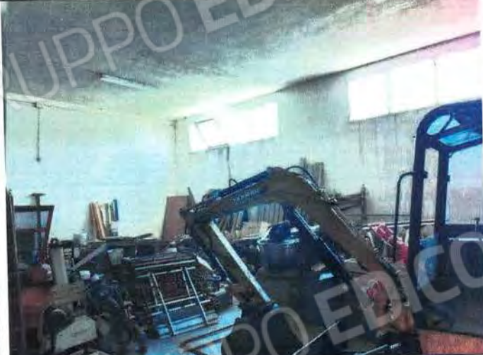
Area interna di stoccaggio e lavorazione Sub 3