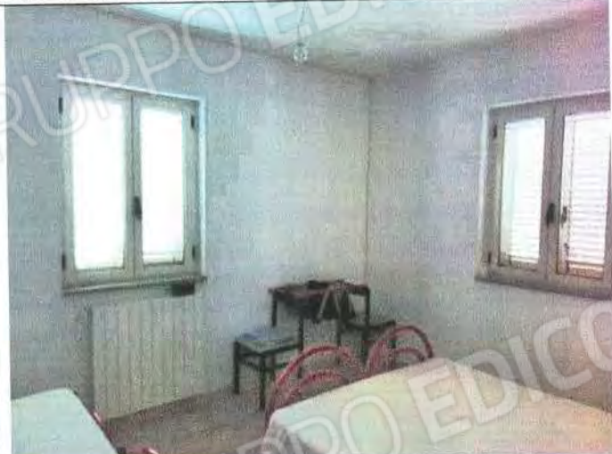
Particolari ambienti interni ufficio Sub 4