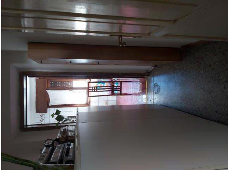
ripostiglio e bagno