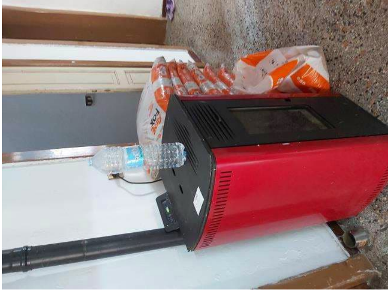
stufa a pellet unica fonte riscaldamento