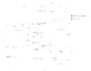
C - Unità abitativa al P.S1 e parti comuni - Rilievo immobile al P.S1