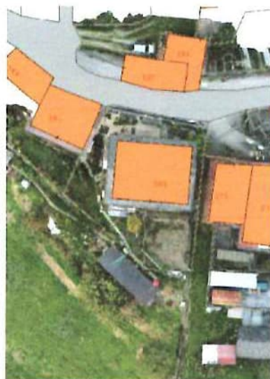
Foto area con inserimento sedime fabbricato