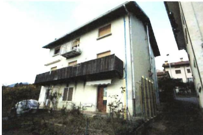
Vista fabbricato lato sud sotto strada