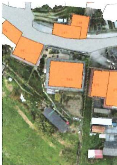
Foto area con inserimento sedime fabbricato

Identificativo corpo: C - Unità abitativa al P.S1 e parti comuni.