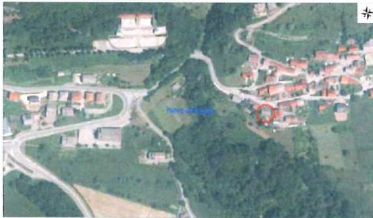
Ortofoto con individuazione beni