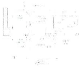
B - Unità abitativa al P.1 con soffitte e parti comuni - Rilievo immobile al P.1