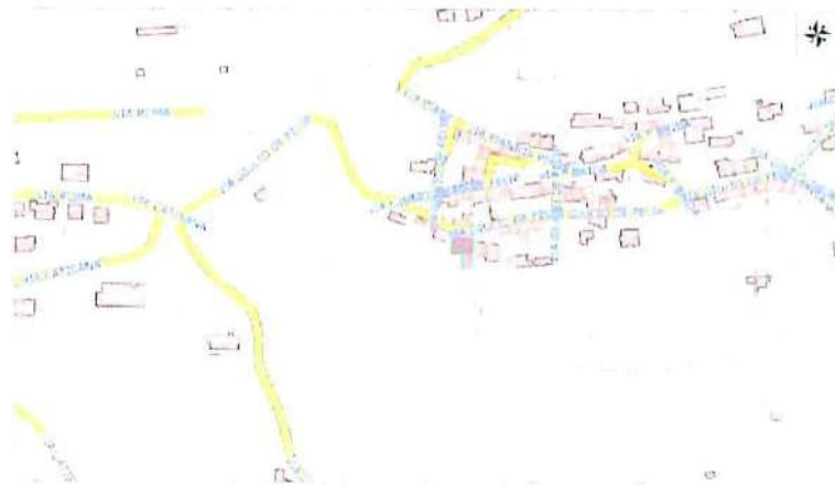
Planimetria con individuazione beni

Per quanto sopra NON si dichiara la conformità catastale