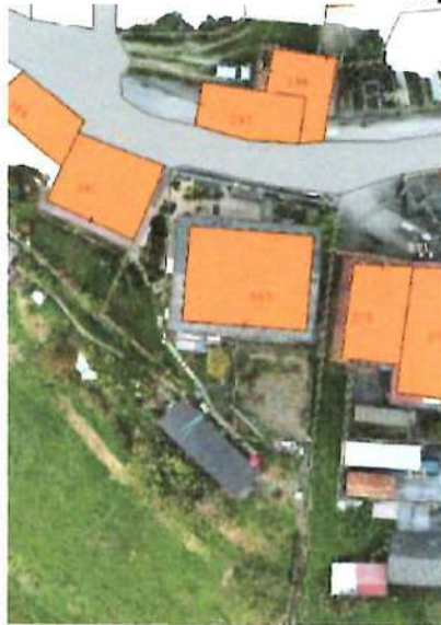
Foto area con inserimento sedime fabbricato