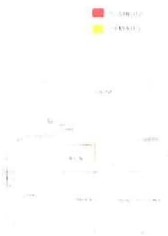
C - Unità abitativa al P.S1 e parti comuni - Differmità rilevate al P.S1