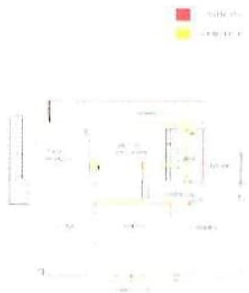
B - Unità abitativa al P.1 con soffitte e parti comuni - Difficoltà edilizie e catastali al P.1