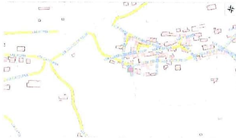
Planimetria con individuazione beni

Per quanto sopra NON si dichiara la conformità catastale