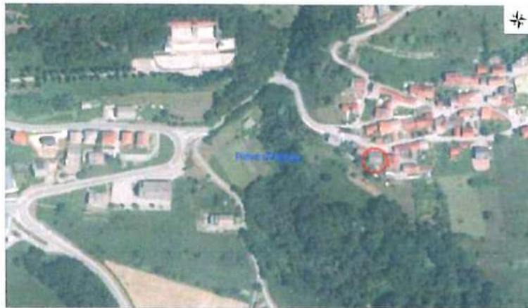
Ortofoto con individuazione beni