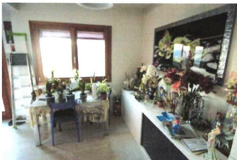
Vista zona pranzo