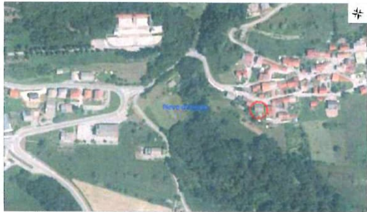
Ortofoto con individuazione beni