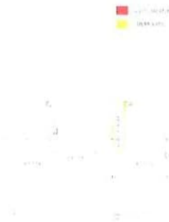
B - Unità abitativa al P.1 con soffitte e parti comuni - Differmità edilizie e catastali - al P.2