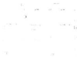
B - Unità abitativa al P.1 con soffitte e parti comuni - Rilievo immobile al P.2