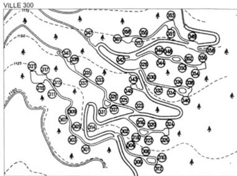
A - Villetta unifamiliare al P.T.-1 in complesso immobiliare denominato Villaggio Corte - ex Eni - Planimetria Comparto 3