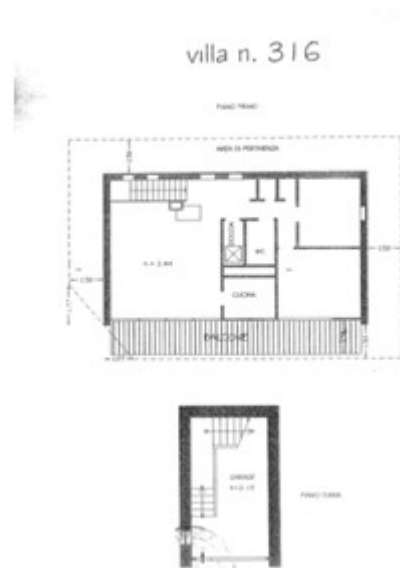
A - Villetta unifamiliare al P.T.-1 in complesso immobiliare denominato Villaggio Corte - ex Eni - Planimetria con indicato area a verde in uso esclusivo