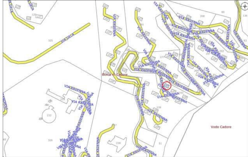
Planimetria con identificazione bene

Per quanto sopra si dichiara la conformità catastale