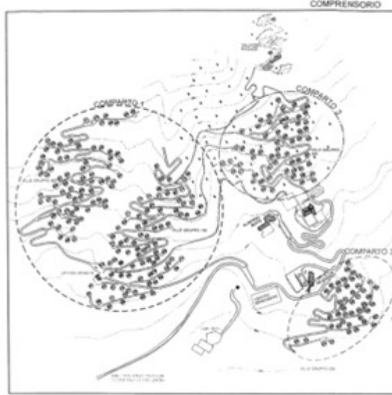
A - Villetta unifamiliare al P.T.-1 in complesso immobiliare denominato Villaggio Corte - ex Eni - Planimetria Comprensorio