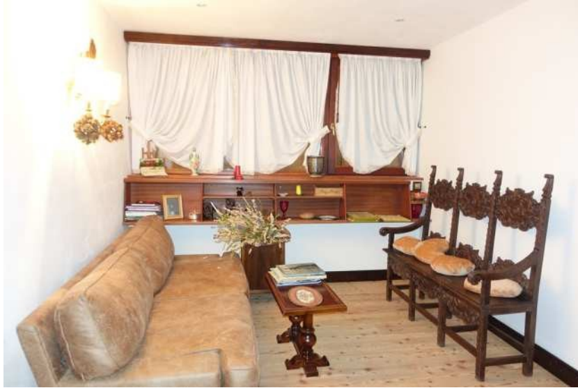
Vista vano al P.T.