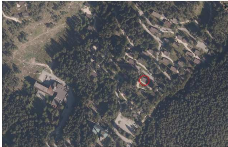
Ortofoto con identificazione bene