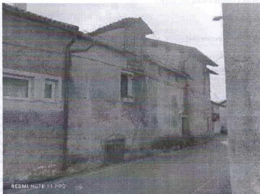
VISAT DA NORD EST