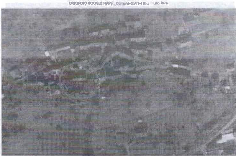
N.C.E.U. foglio 20 particella 131A ORTOFOTO GOOGLE