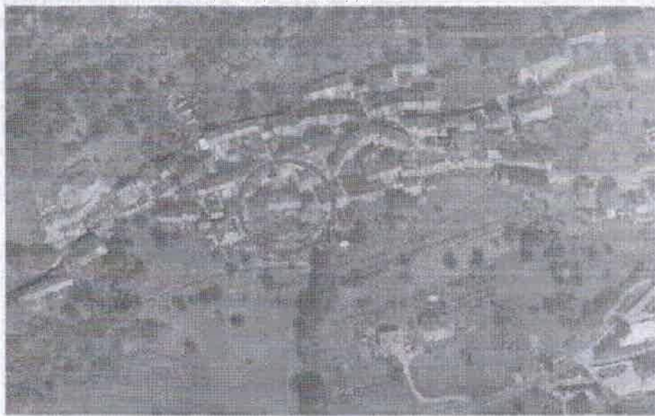
8 N.C.E.U. foglio 20 particella 131A ORTOFOTO SITIC SU BASE CATASTALE