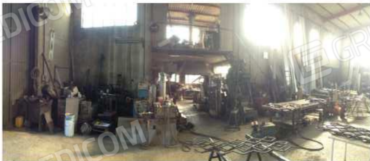
LOTTO 2 - Interno lato soppalco