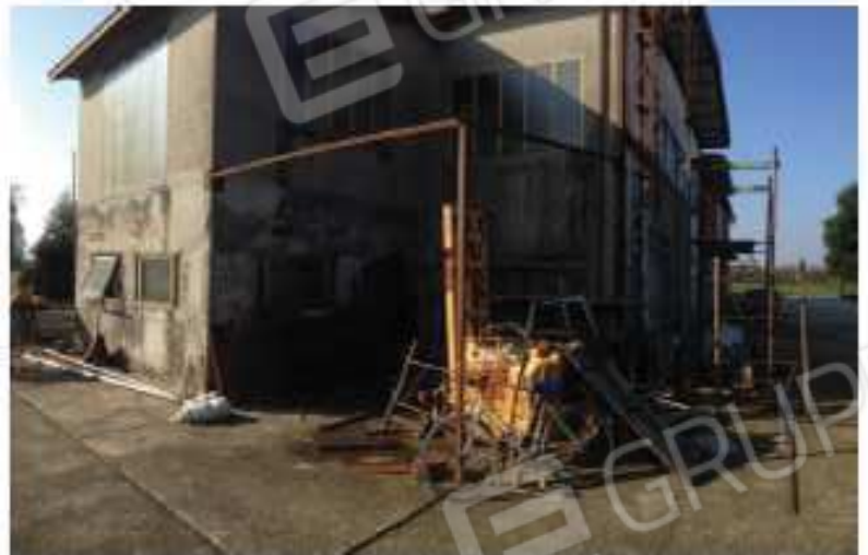
LOTTO 2 - Capannone Nord/Est