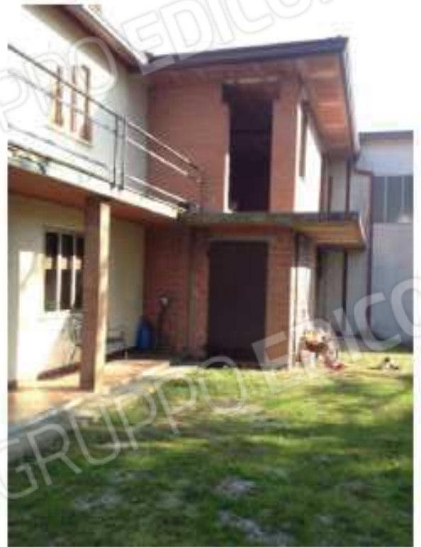
LOTTO 1 - Sud