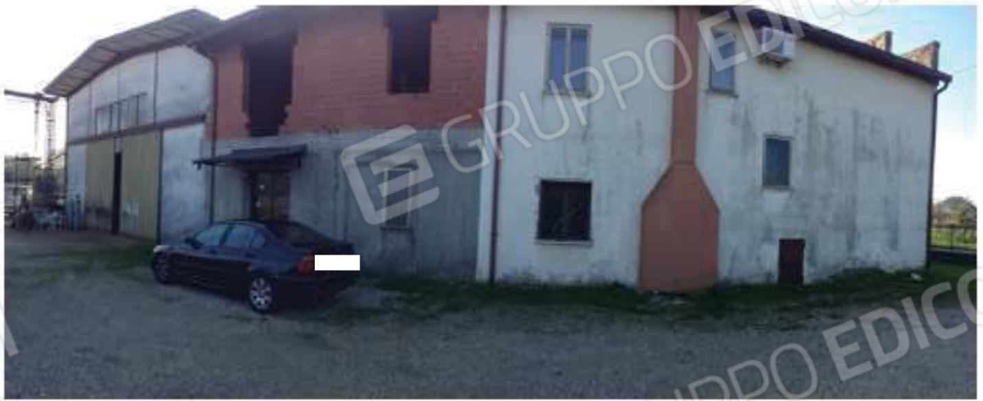
LOTTO 2 - Cortile di accesso