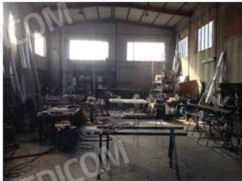
LOTTO 2 - Interno/Sud