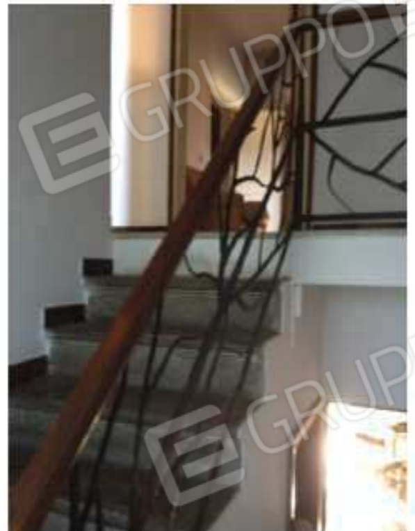
Scala zona notte