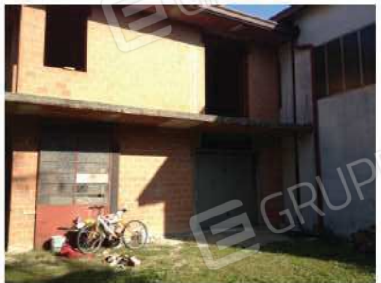
LOTTO 1 - Ampliamento/Sud