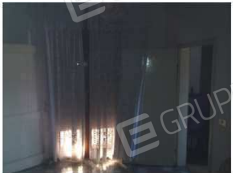
Disimpegno zona notte