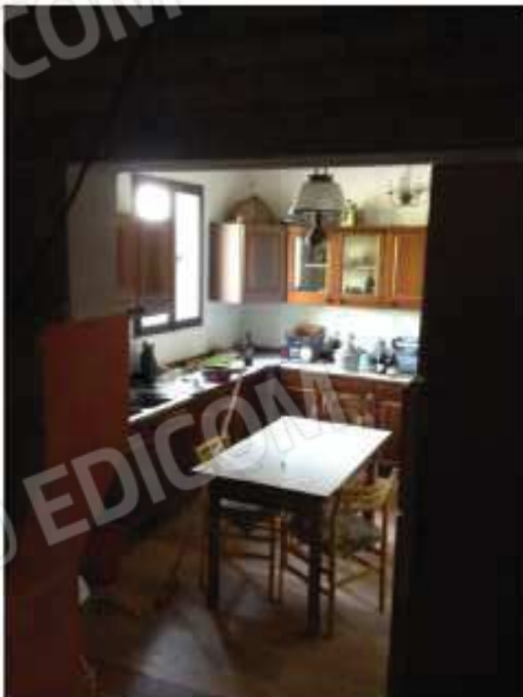
Cucina dal sottoscala