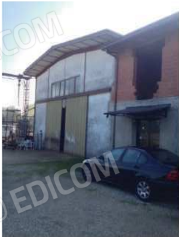
LOTTO 2 - Capannone e ingresso uffici