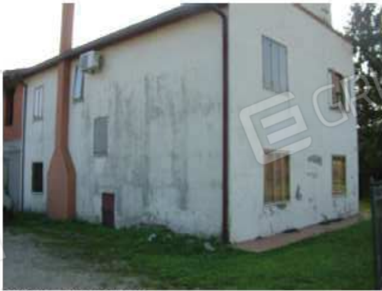
LOTTO 1 - Nord-Ovest