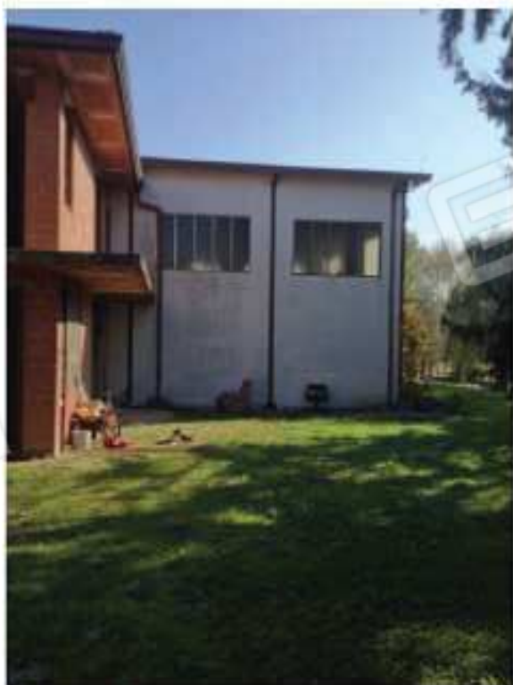
LOTTO 1 - Esterno sud 1