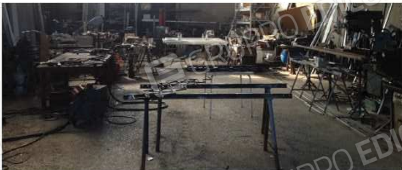
LOTTO 2 - Interno pavimento