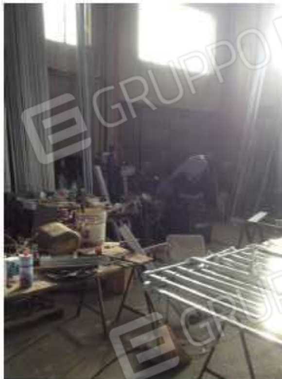
LOTTO 2 - Interno lato collegamento ufficio