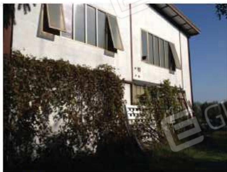
LOTTO 2 - Capannone/Sud