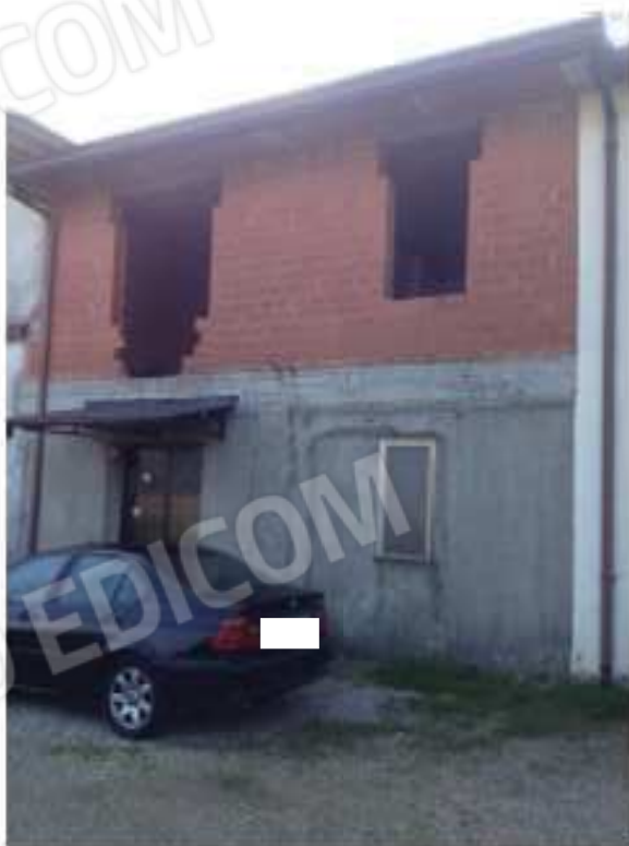
LOTTO 1 - Ampliamento/Nord