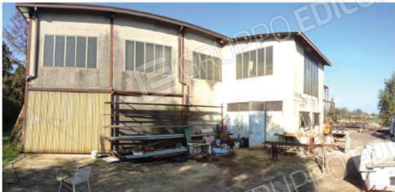
LOTTO 2 - Capannone/Est