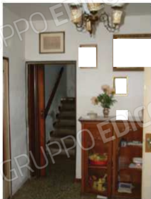
LOTTO 1 - Ingresso