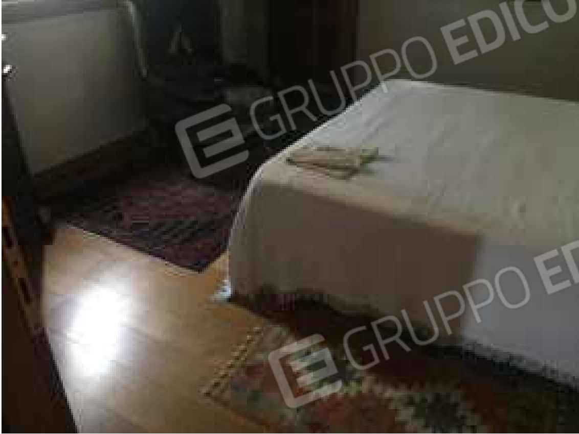
CONO VISIVO N. 45