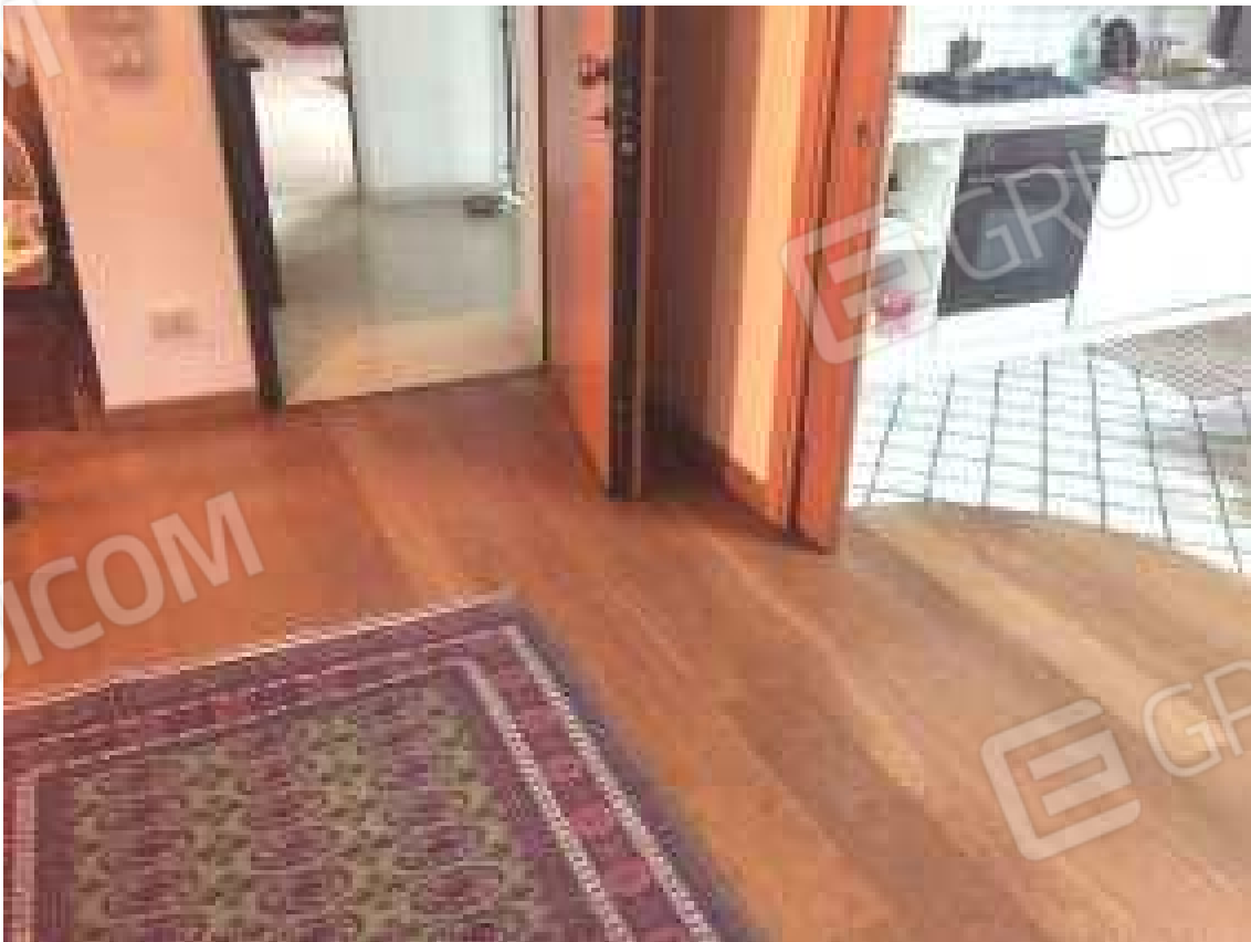
CONO VISIVO N. 48