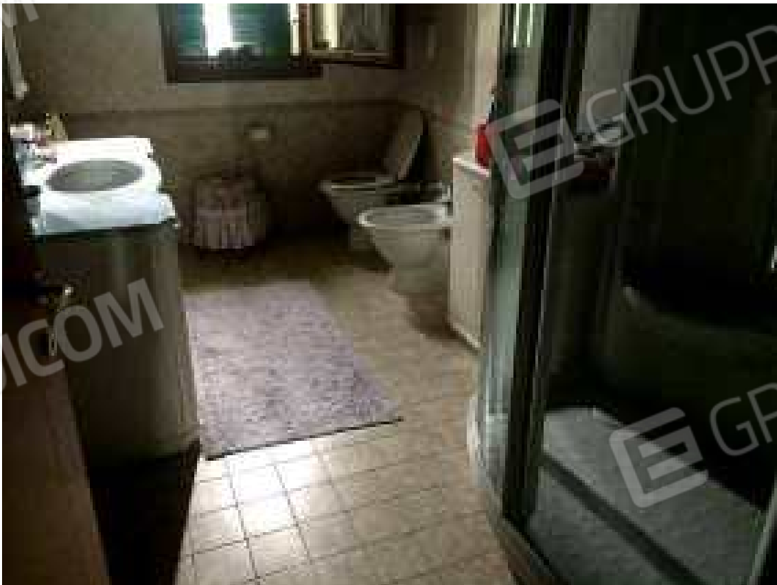
CONO VISIVO N. 46