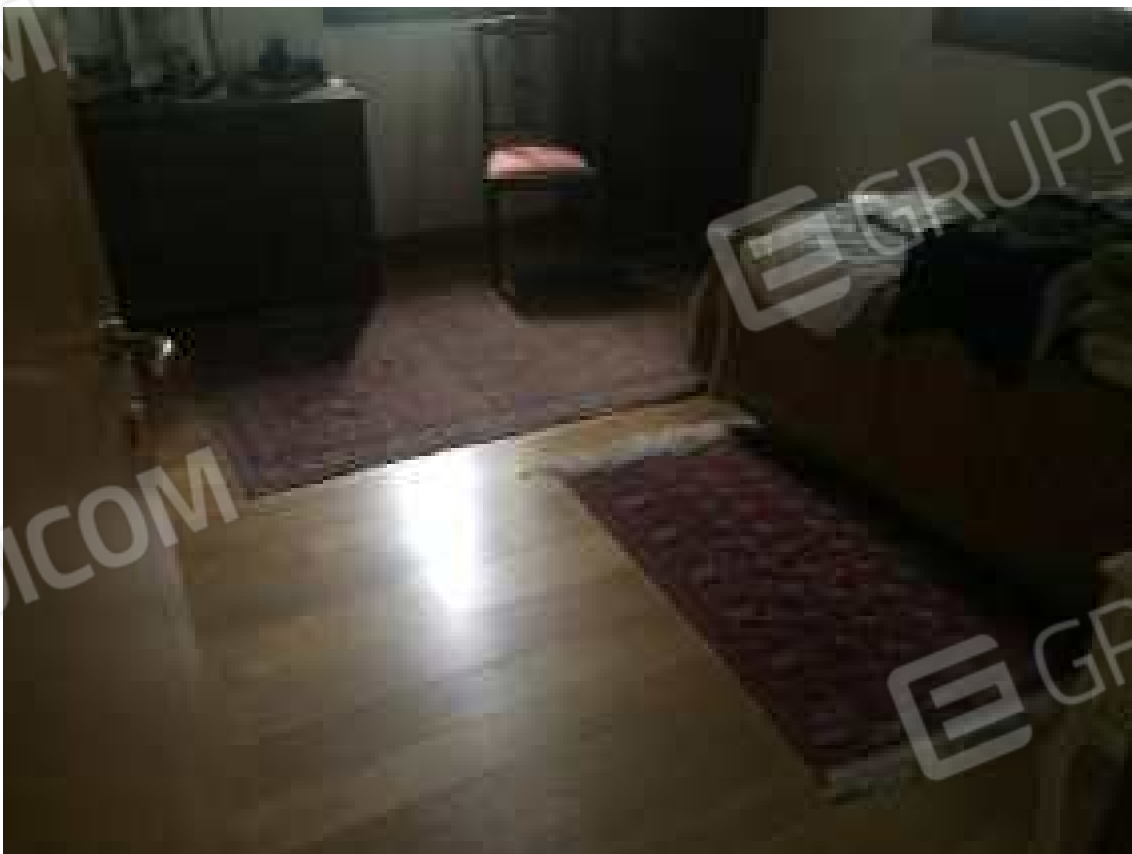
CONO VISIVO N. 44