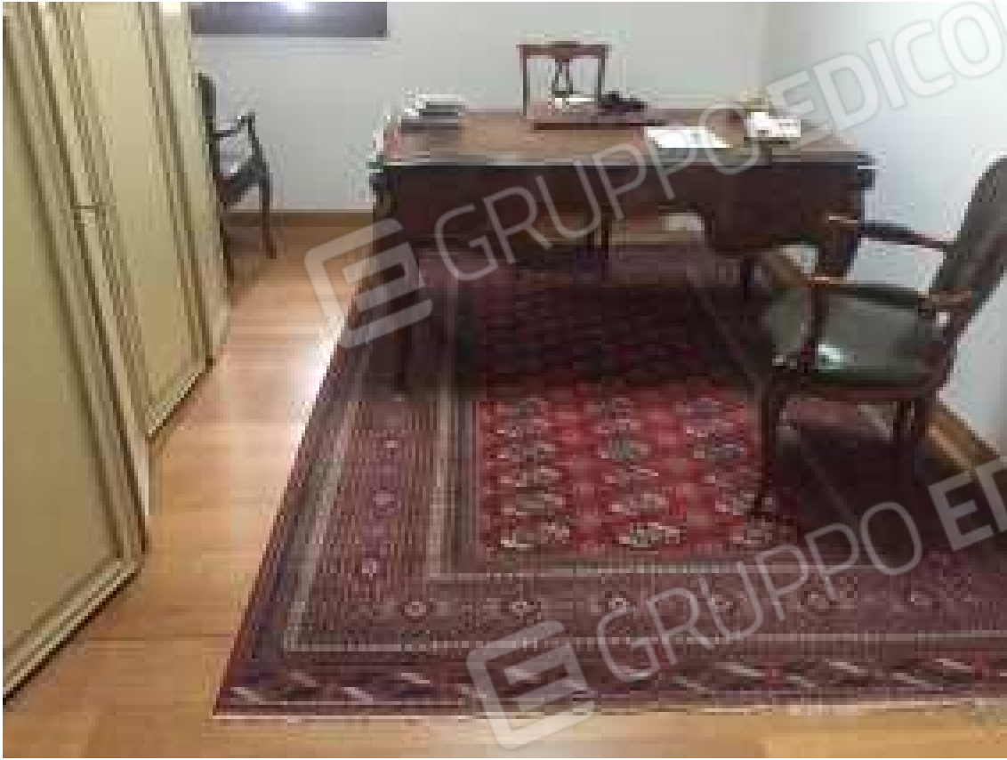
CONO VISIVO N. 41