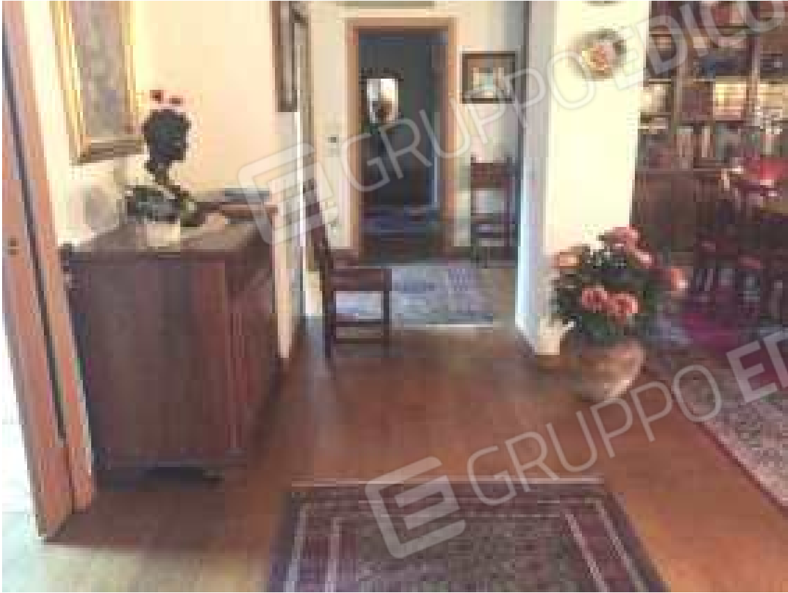
CONO VISIVO N. 39