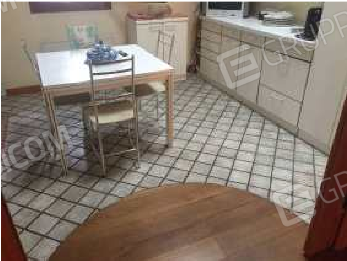
CONO VISIVO N. 40