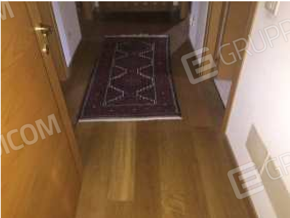
CONO VISIVO N. 42