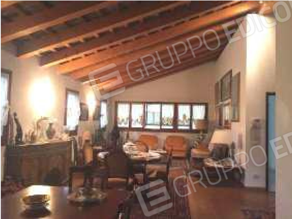
CONO VISIVO N. 47