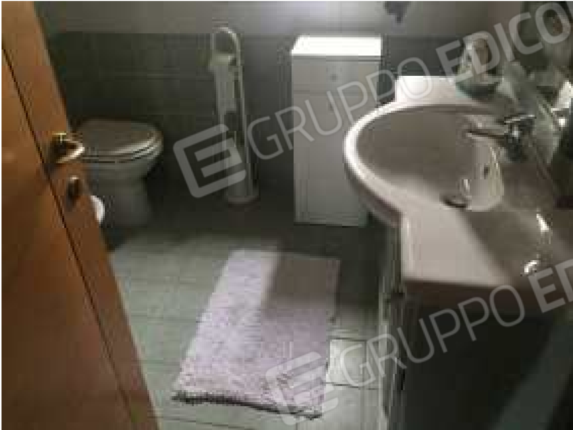
CONO VISIVO N. 43