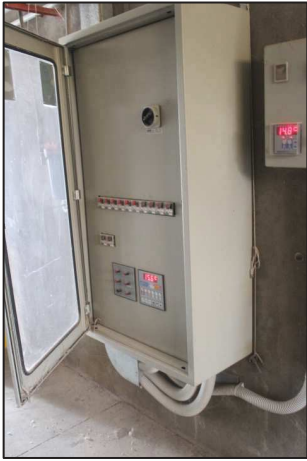
25. Quadro elettrico