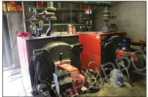
40. Centrale termica