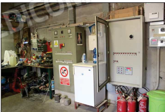
35. Locale di servizio