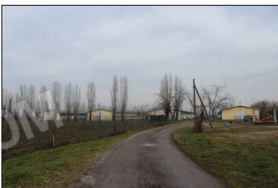
3. Vialetto di accesso