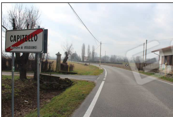
1. Accesso e terreni connessi