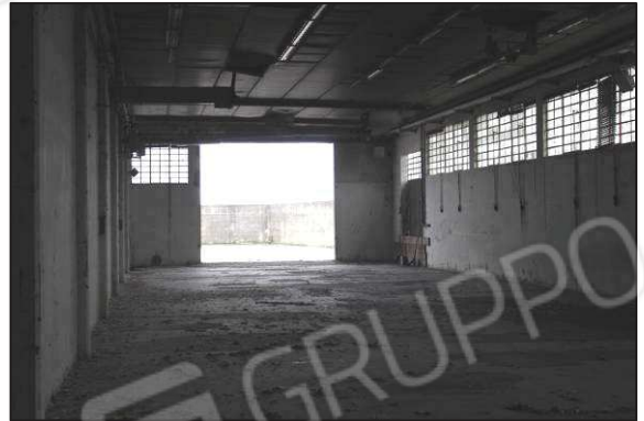
22. Interni ex laboratorio