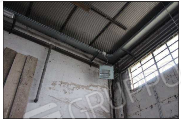
46. Impianti nel capannone