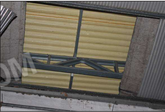
51. Struttura vista attraverso il controsoffitto