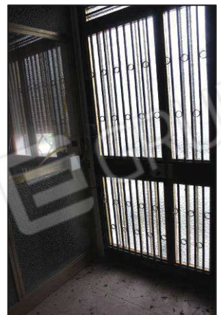
36. Portoncino uffici