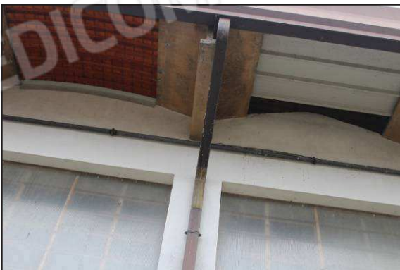
17. Cupolini lato Ovest