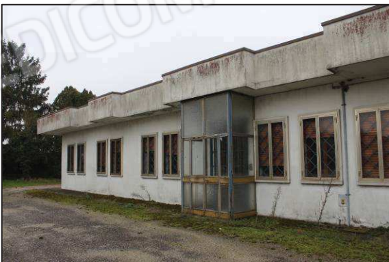
11. Prospetto Ovest