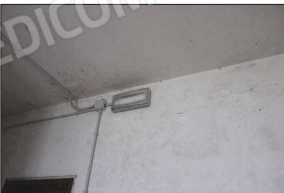
35. Illuminazione di emergenza