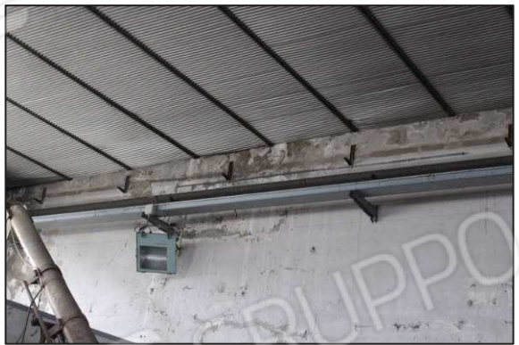
28. Particolare controsoffitto