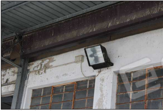
61. Illuminazione notturna