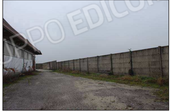
7-8. Prospetto e recinzione Ovest