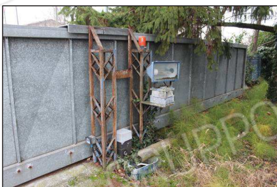
4. Ingresso carraio