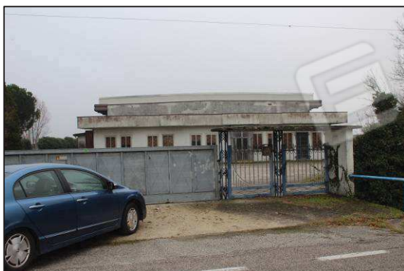
1. Accesso sulla via Frassine (S.P. 23)