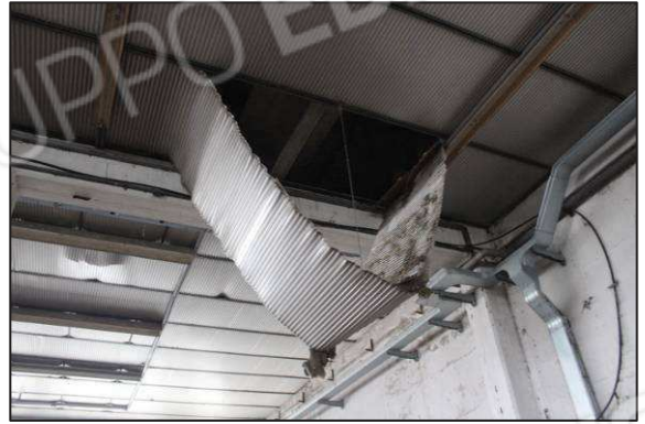
50. Lesione del controsoffitto