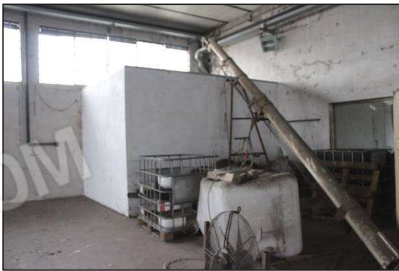
27. Alloggiamento inverter impianto fotovoltaico