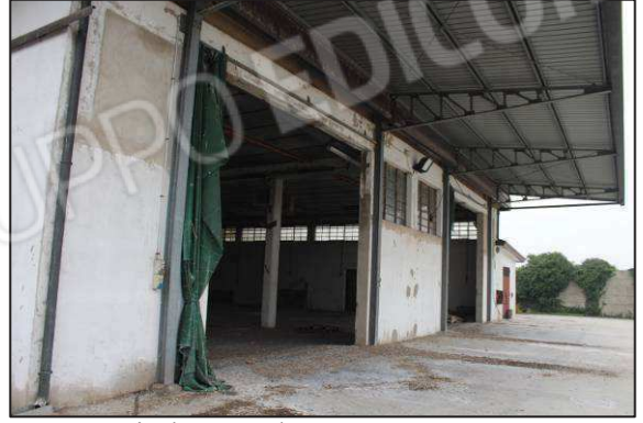
14. Tettoia lato Sud