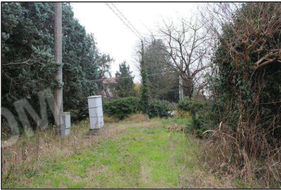
9. Verde sull'angolo Nord-Est