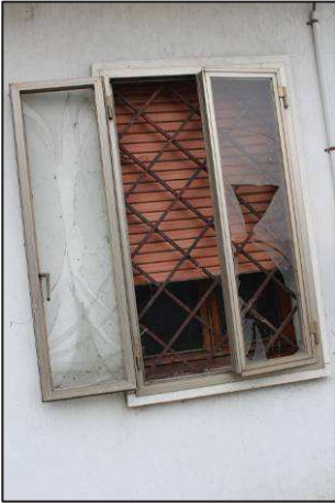
19. Finestra degli uffici