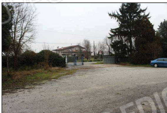
2. Spiazzo davanti al fabbricato