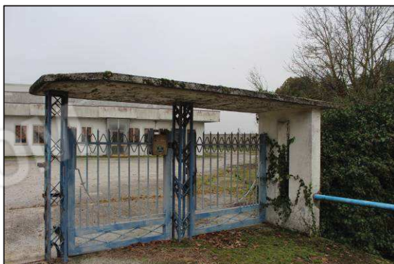
3. Cancello pedonale