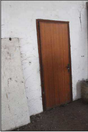
31. Porta accesso uffici