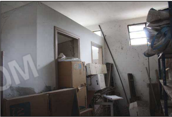
57. Servizi igienici