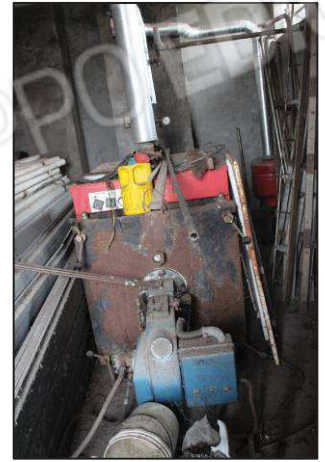
64. Generatore calore