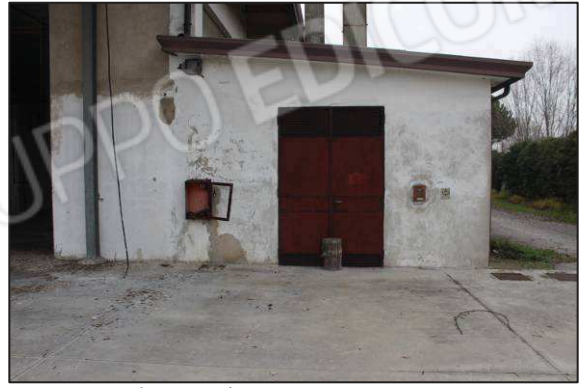
62. Centrale termica