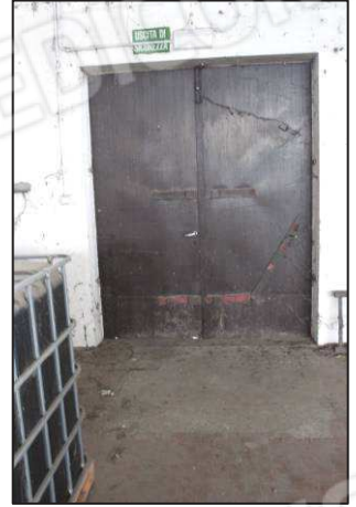
32. Portone magazzino