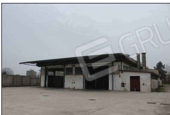
6. Prospetto Sud