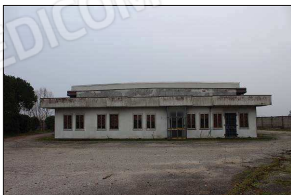
5. Prospetto Nord