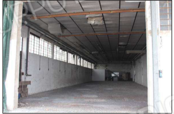
20. Interno ex laboratorio