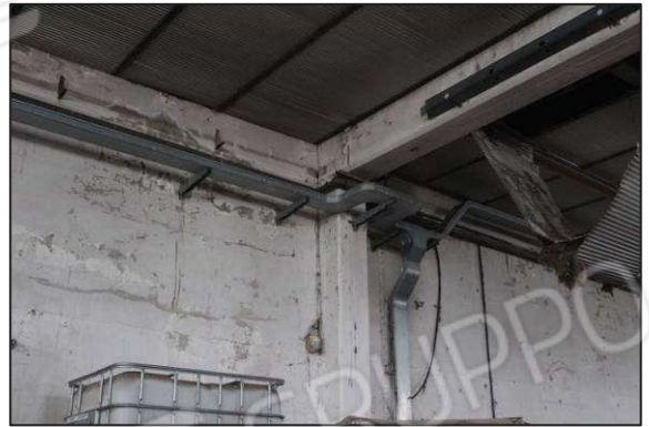
52. Parti strutturali in prefabbricato