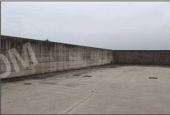
21. Spiazzo e recinzione sul lato Sud