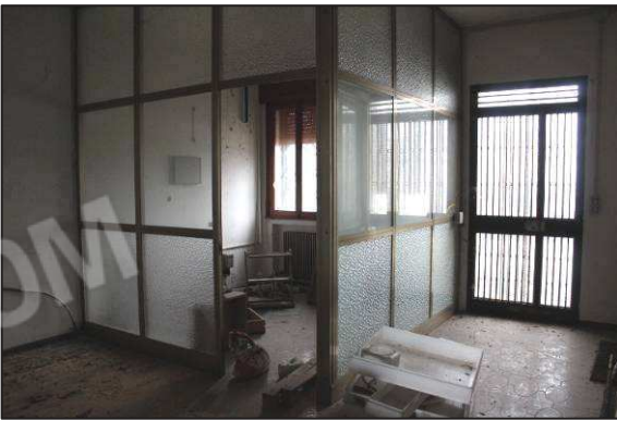
33. Interni uffici