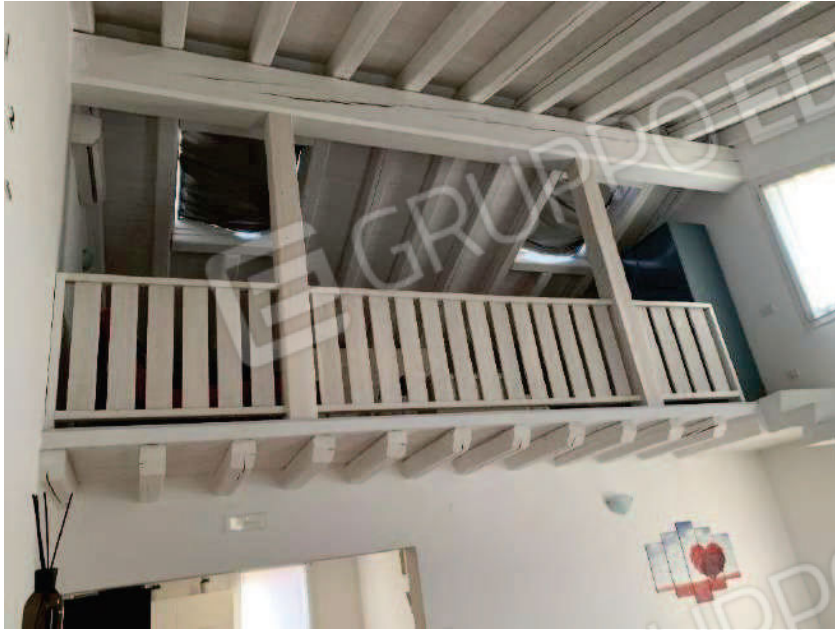
11. Vista soppalco e travi di copertura dal volume a doppia altezza del soggiorno