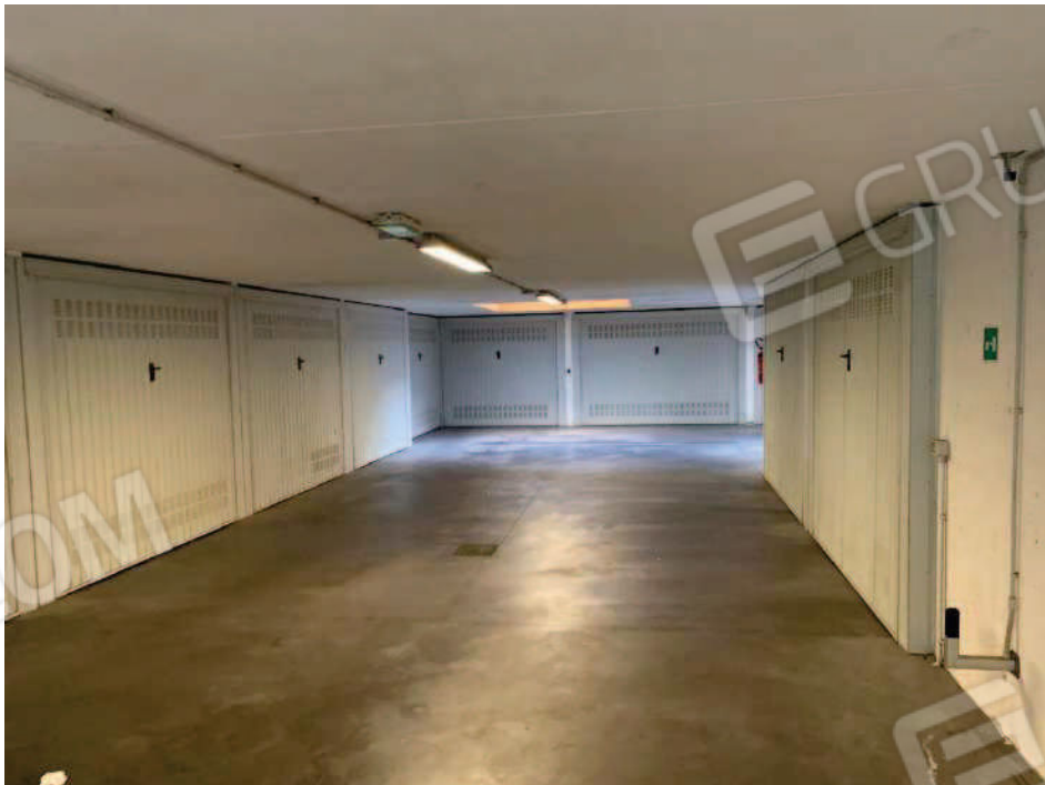
16. Area di manovra garage interrati