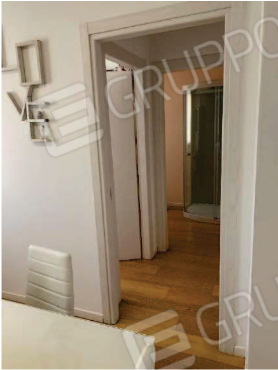
9. Zona disimpegno