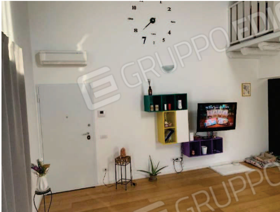
7. Soggiorno vista dell'ingresso