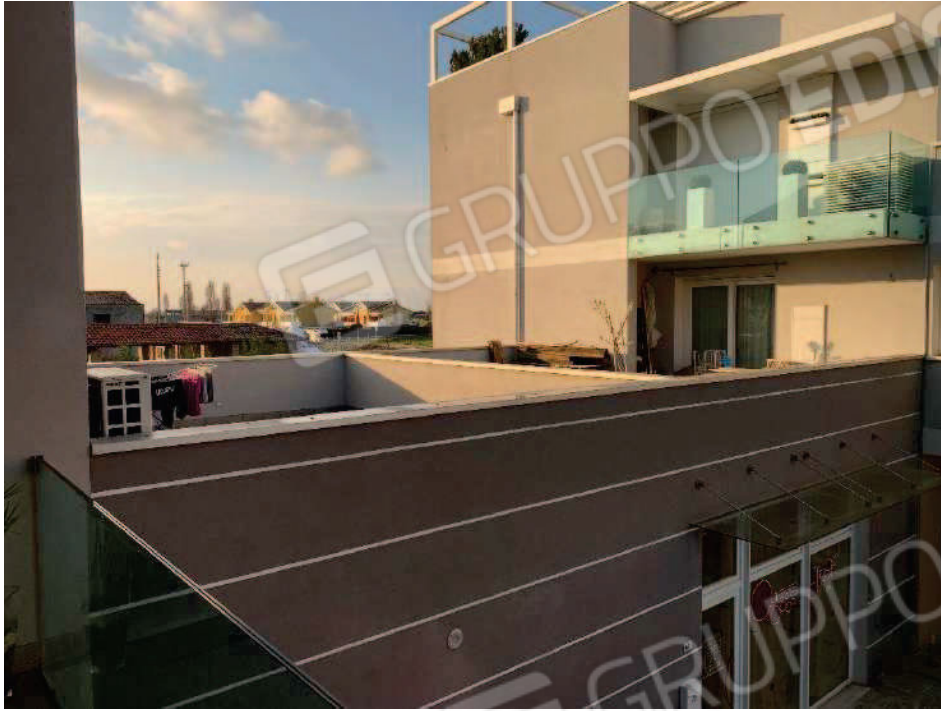
13. Vista della terrazza dalla passerella di ingresso del sottoportico