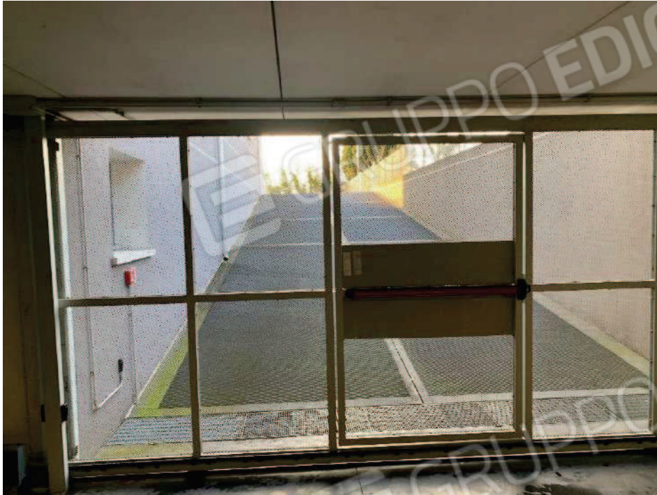
15. Rampa comune di accesso ai garage interrati