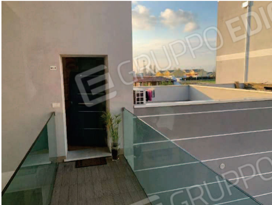
5. Accesso al piano con terrazza lato nord