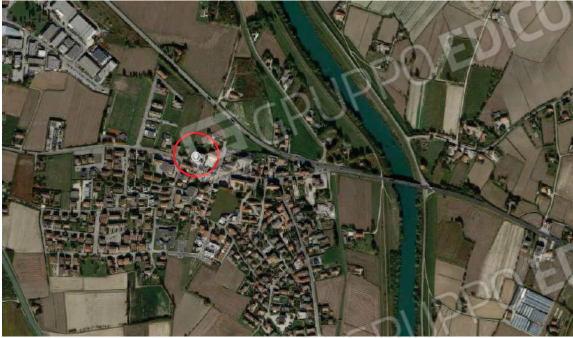
1. Foto aerea