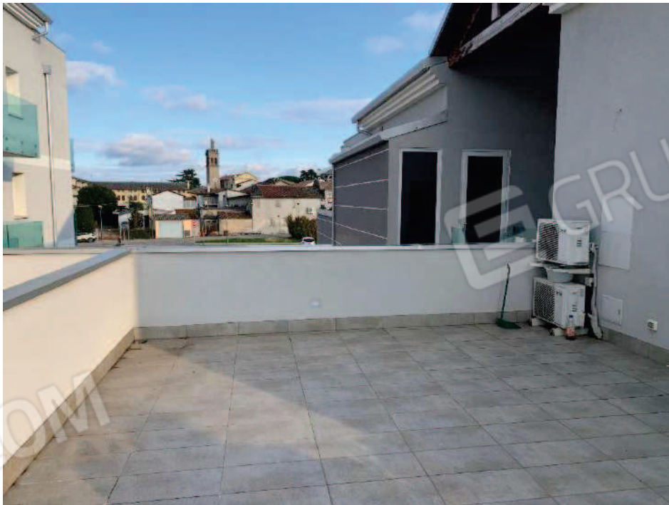
12. Terrazza con esposizione a nord