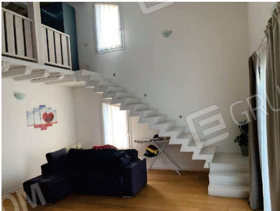
6. Soggiorno con scala di accesso al soppalco