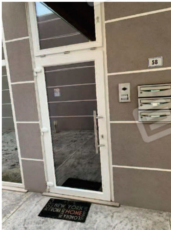
4. Accesso condominiale dal sottoportico