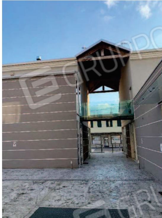
3. Portico passante con ingresso condominiale all'unità