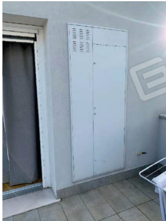
14. Locale alloggio caldaia a muro