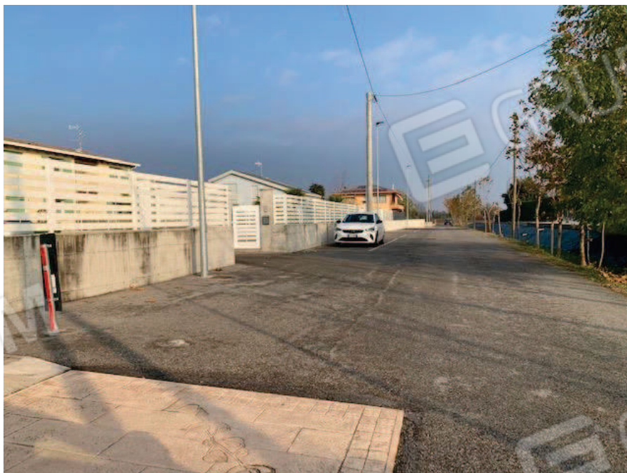
6. Vista d'insieme particelle 304, 320, 321 fg 2 comune di Brugine PD – via Ardoneghe