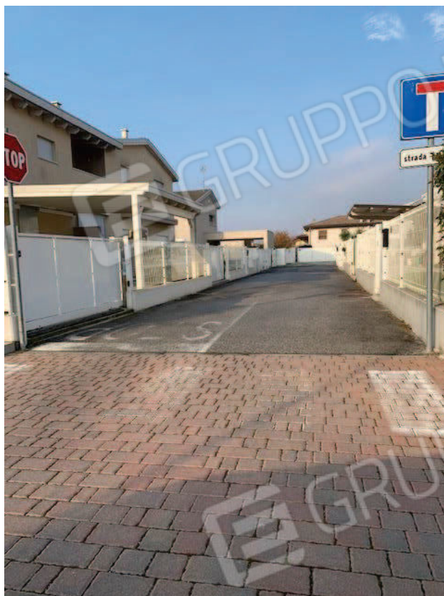
3. Strada privata particella 563 fg 12 comune di Brugine PD – via Zordan