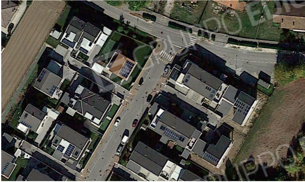
1. Vista aerea via Zordan – Brugine PD