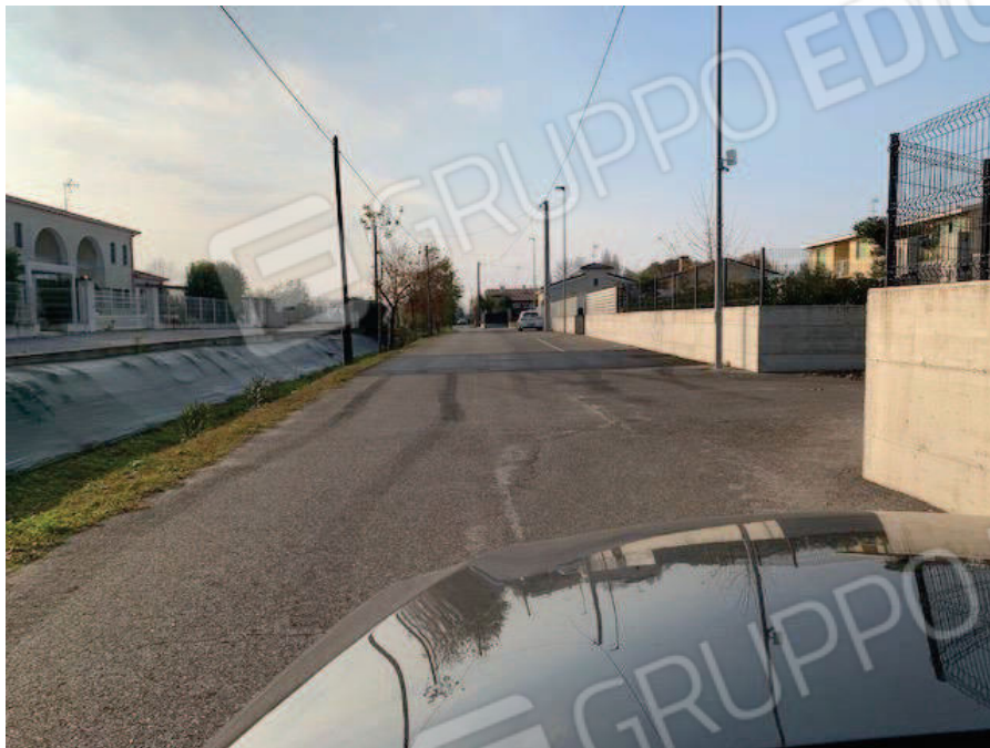
5. Vista d'insieme particelle 304, 320, 321 fg 2 comune di Brugine PD – via Ardoneghe