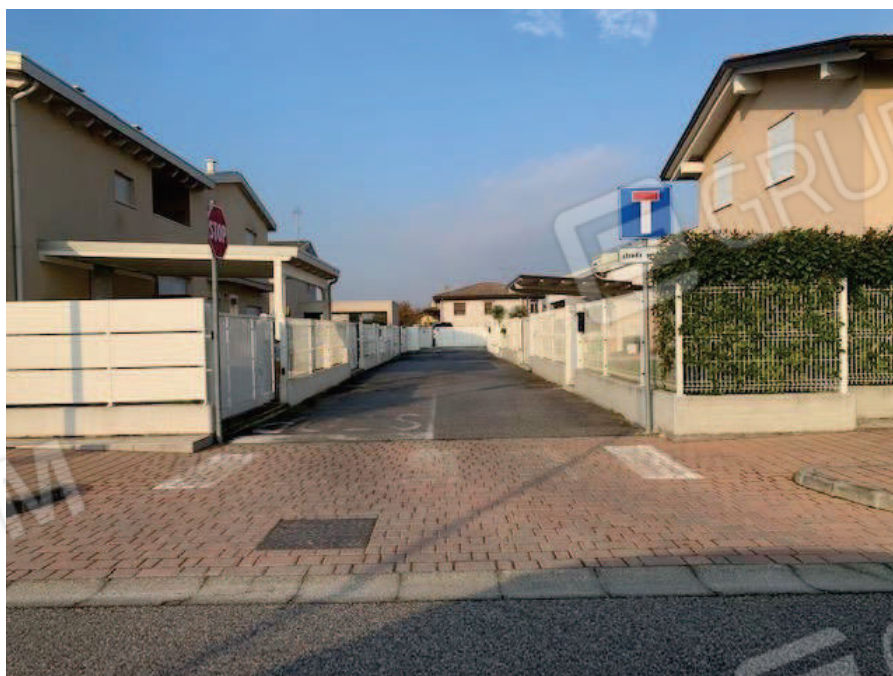
4. Strada privata particella 563 fg 12 comune di Brugine PD – via Zordan