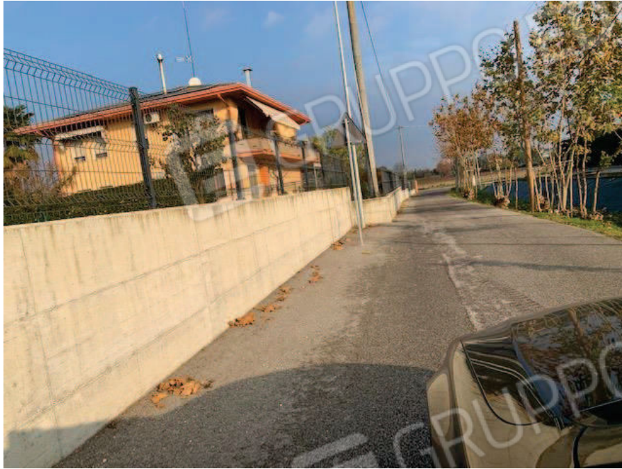
1. Vista particella 321 fg 2 comune di Brugine PD – via Ardoneghe