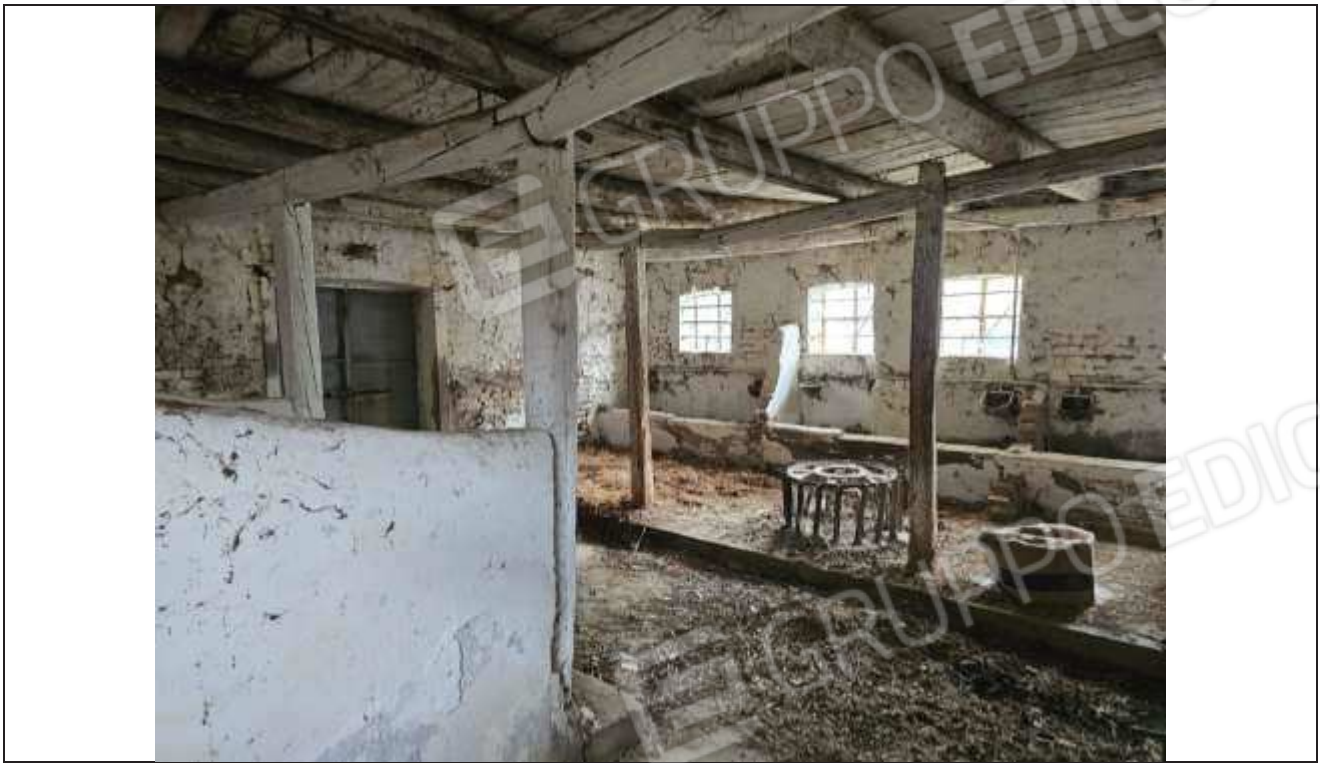
55 Veduta interna della stalla;