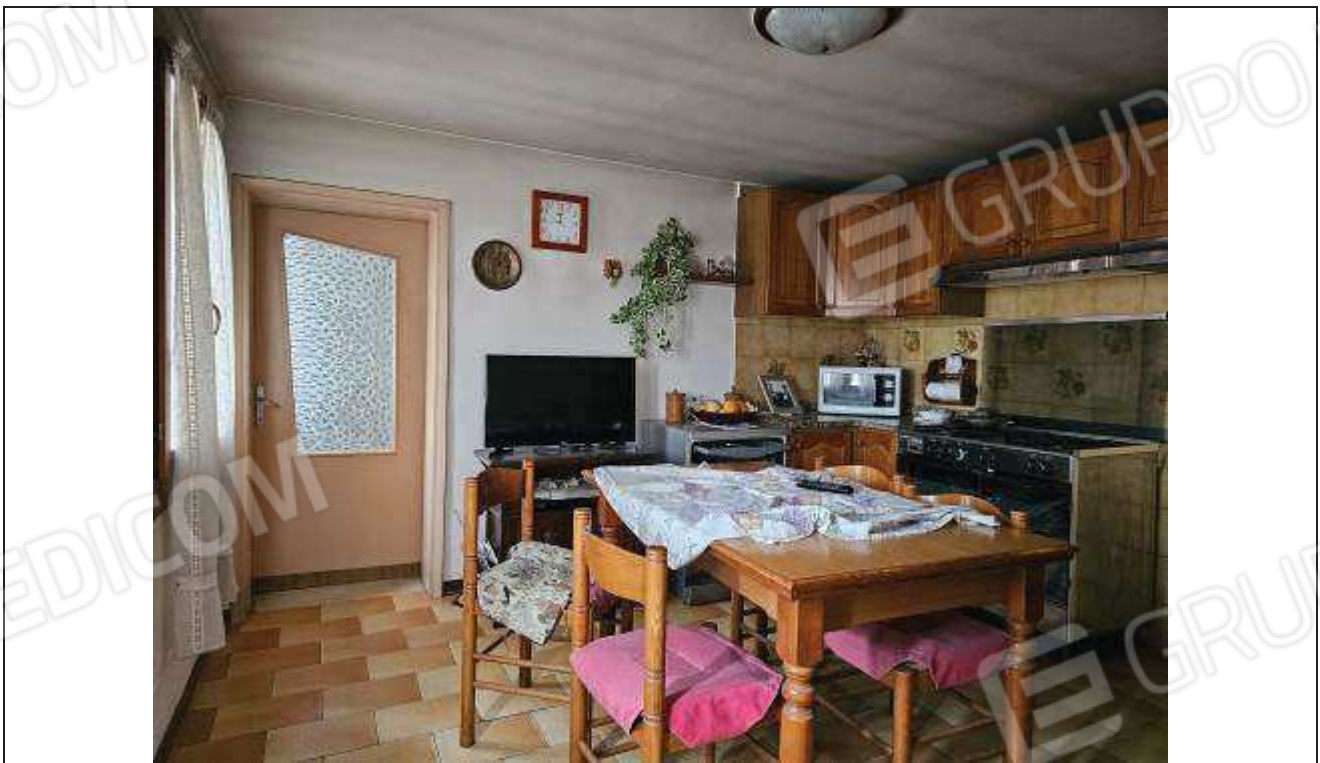
18 Vista del locale cucina;