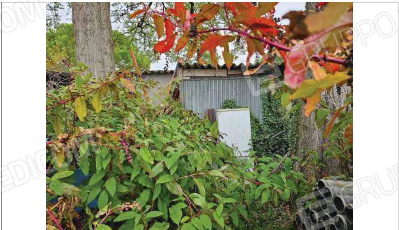
14 Vista lato Sud-Ovest del ricovero attrezzi con addossato il manufatto abusivo;