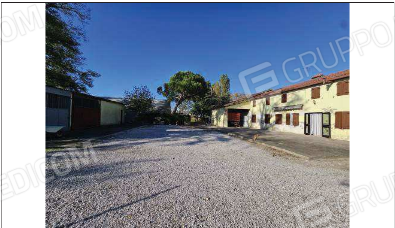
06 Vista dell'area cortiliva con i fabbricati rurali;