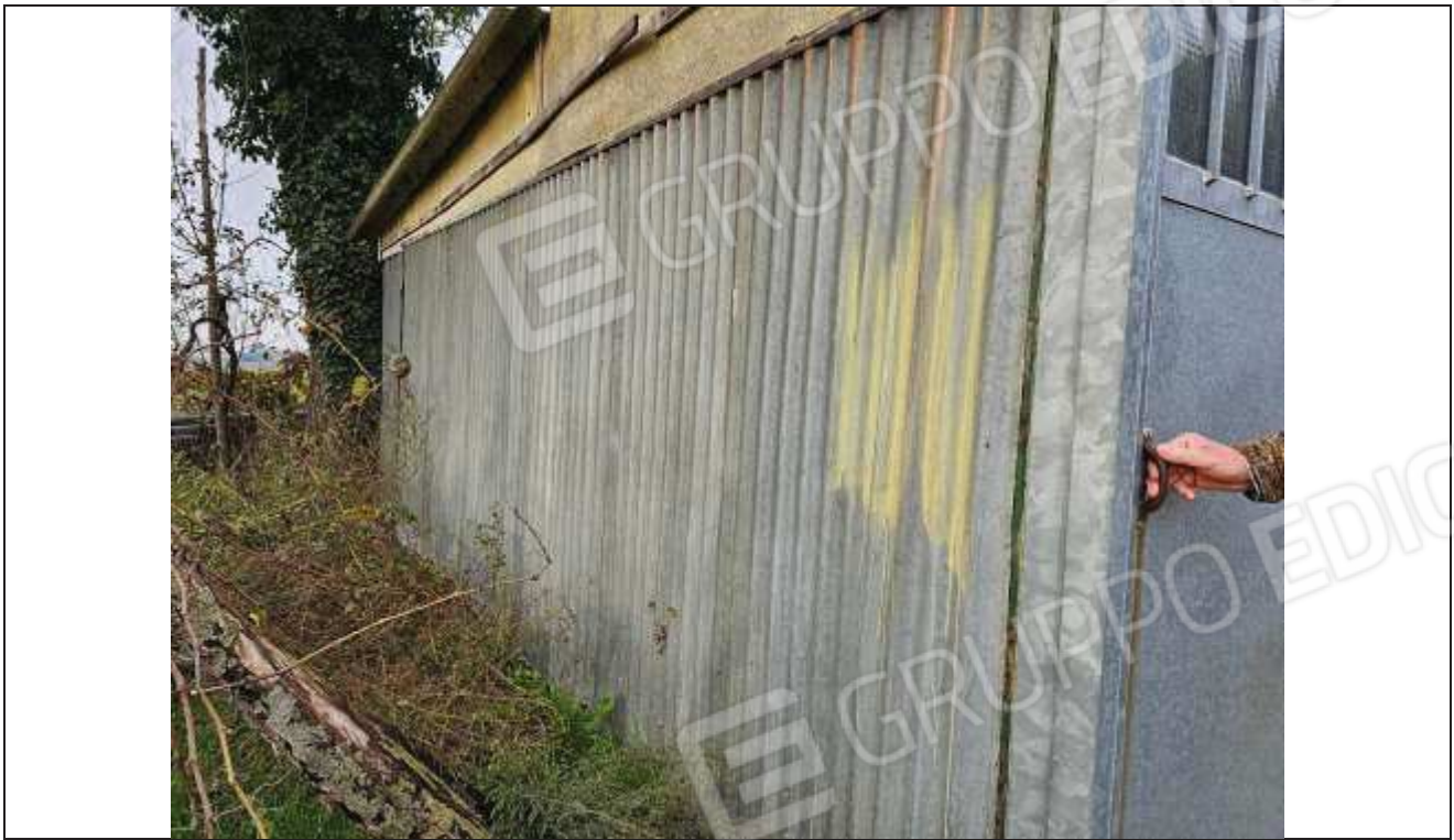
57 Vista della parete Est dell'abuso;