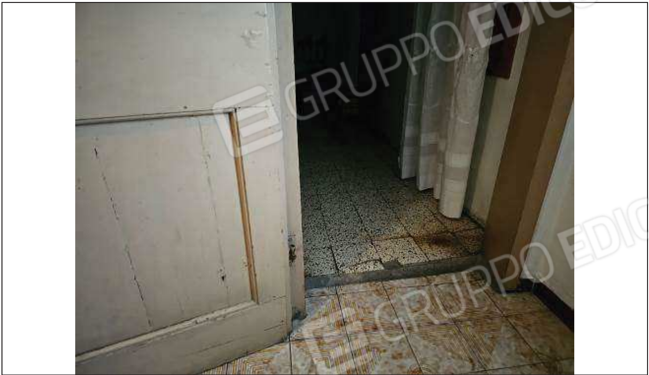
29 Particolare della pavimentazione con gradino dal disimpegno verso la camera da letto;