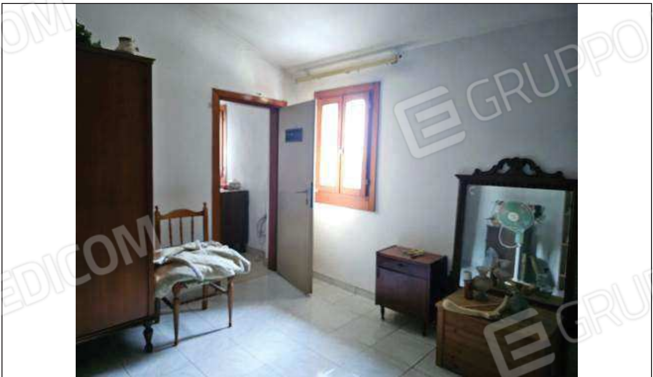
34 Vista dell'ultima camera da letto;