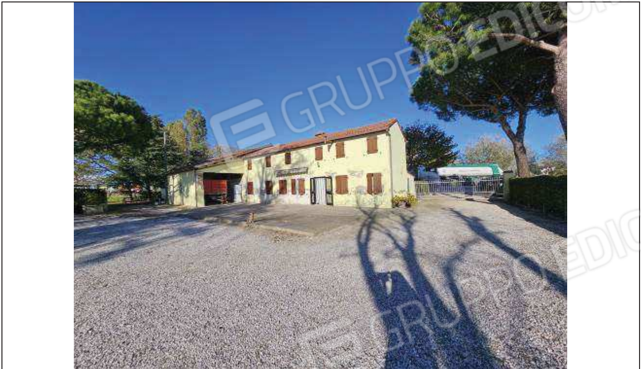
05 Vista del fabbricato rurale lato Sud;