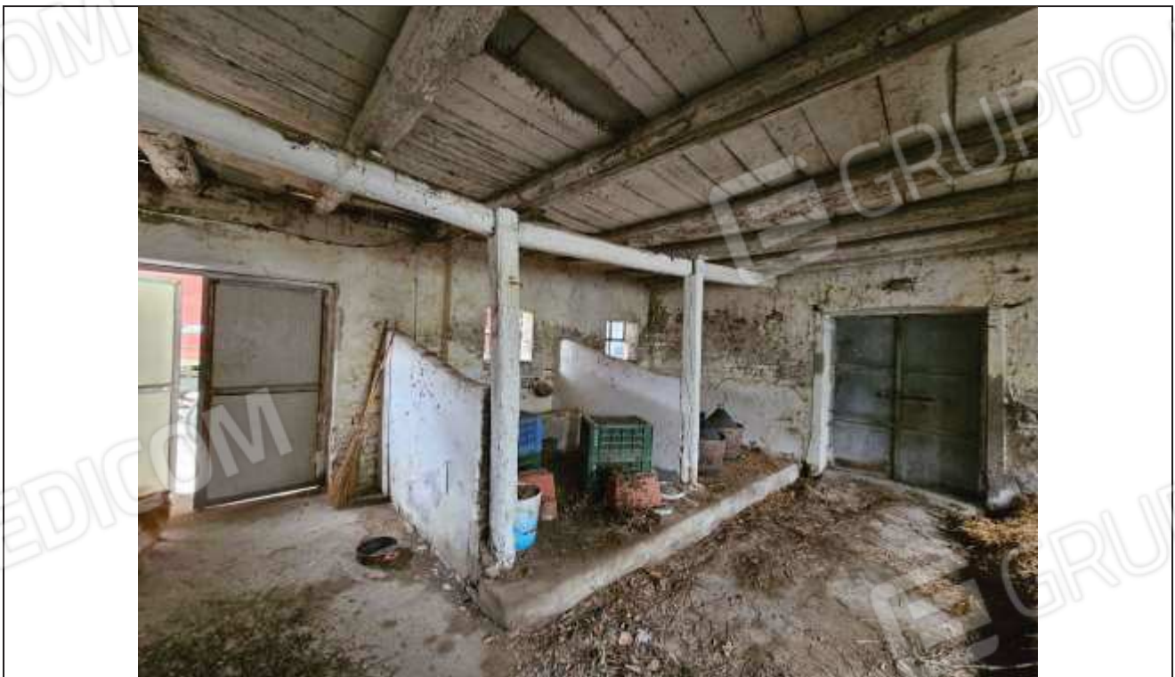
54 Vista interna della stalla e della seconda porta collocata a Nord-Ovest del fabbricato;