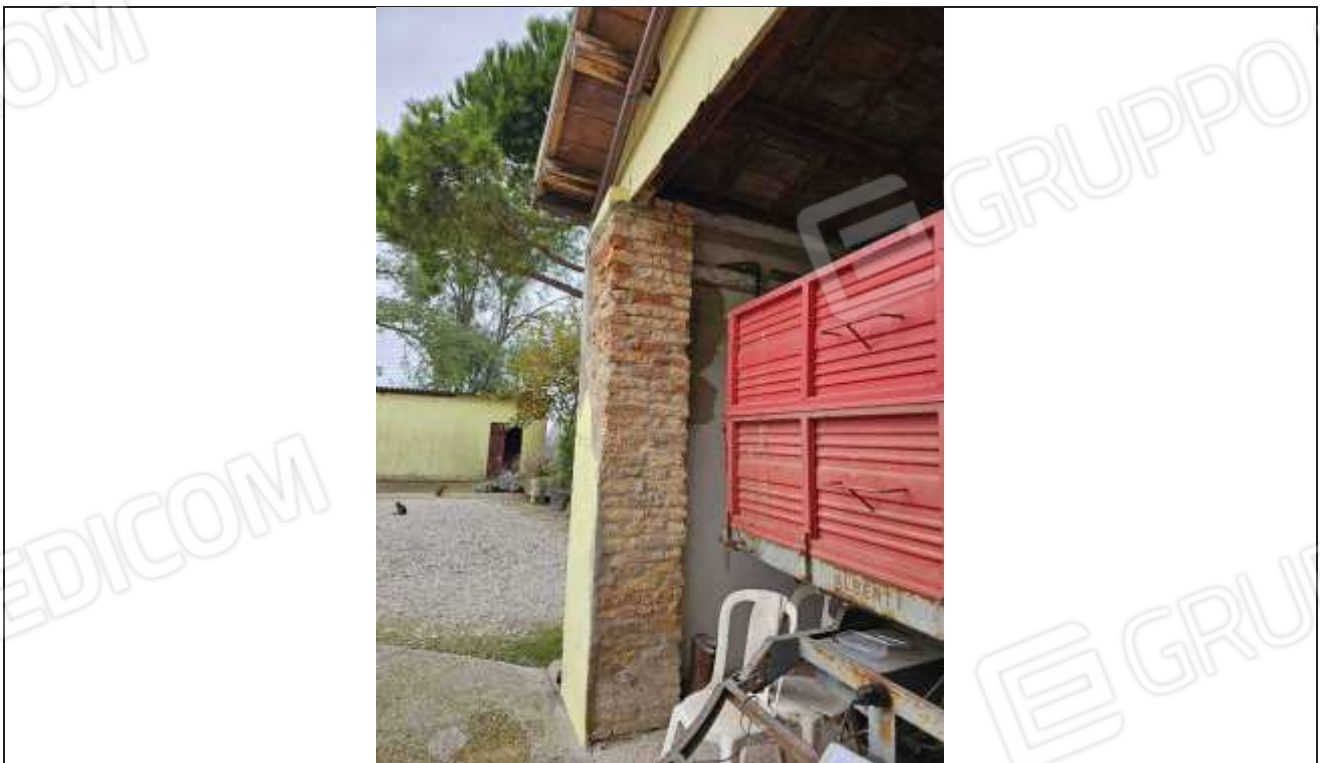
44 Vista dell'accesso al portico;