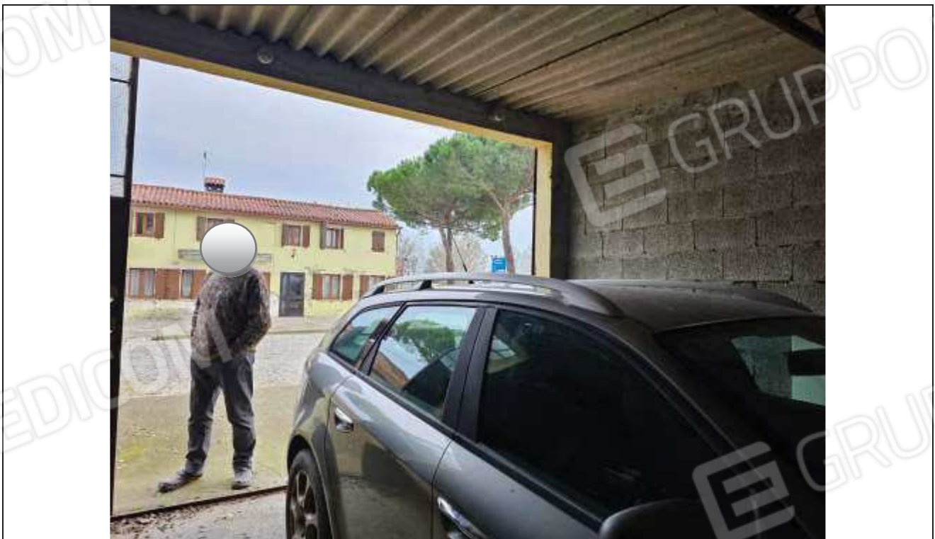
62 Vista interna del deposito attrezzi, verso la corte esterna;