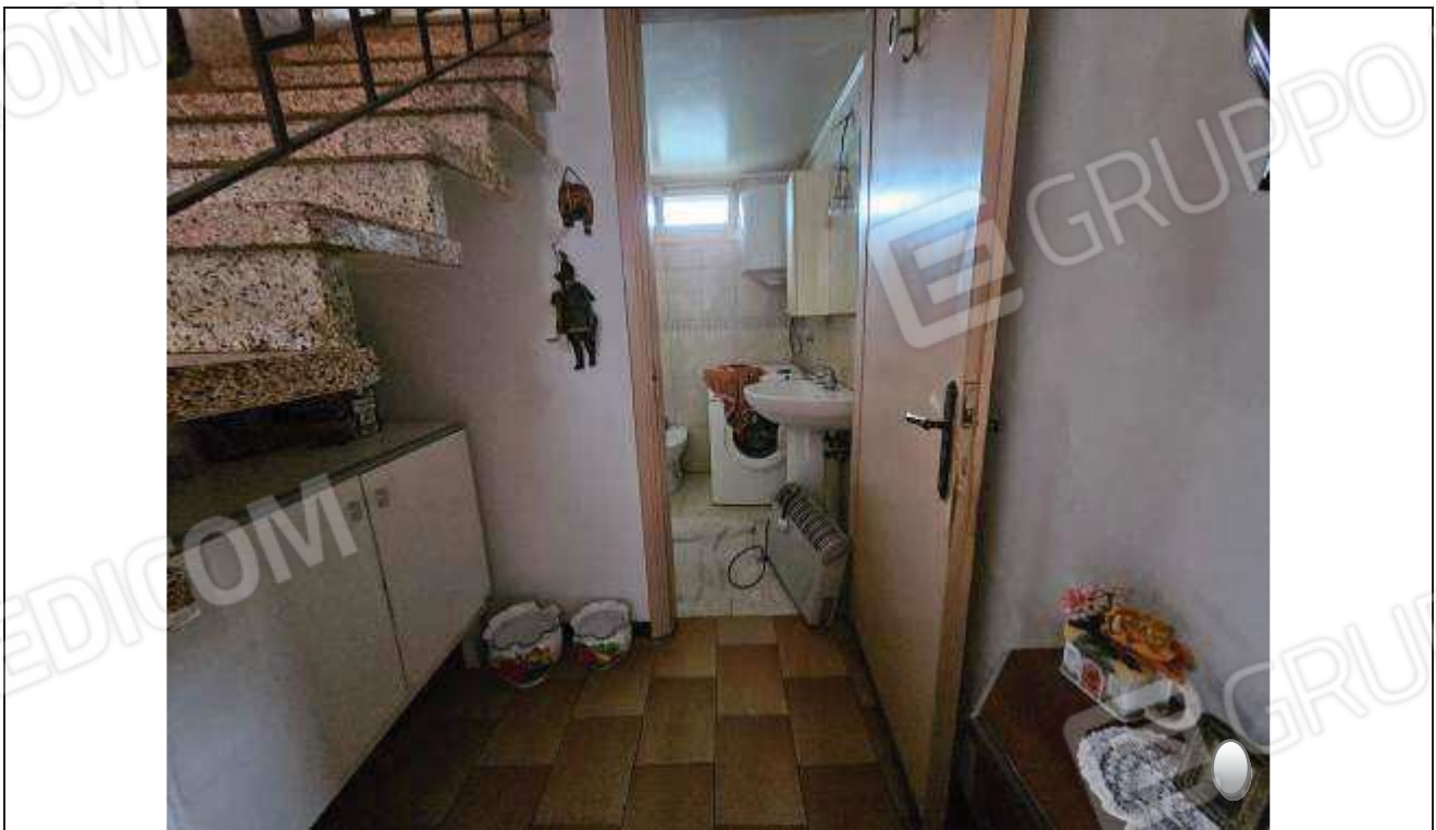
20 Vista del bagno dall'ingresso;