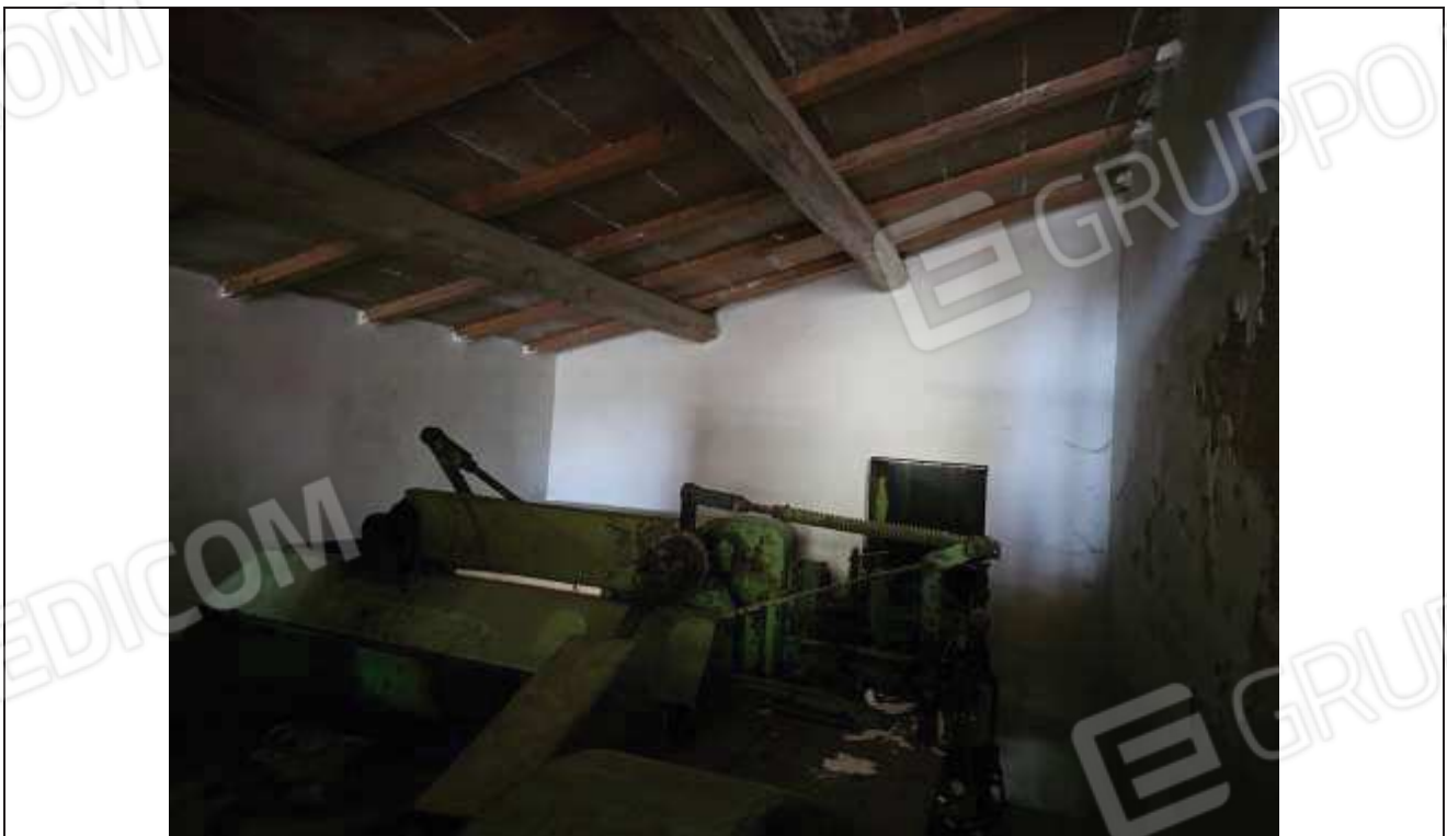
50 Altra vista interna del deposito;