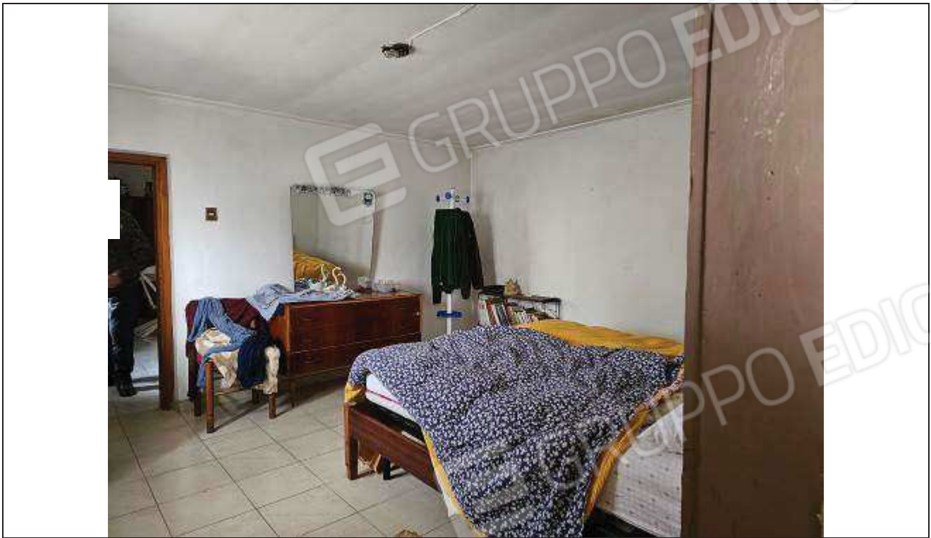
33 Altra vista dall'interno della camera da letto verso la porta che collega ad una terza camera;