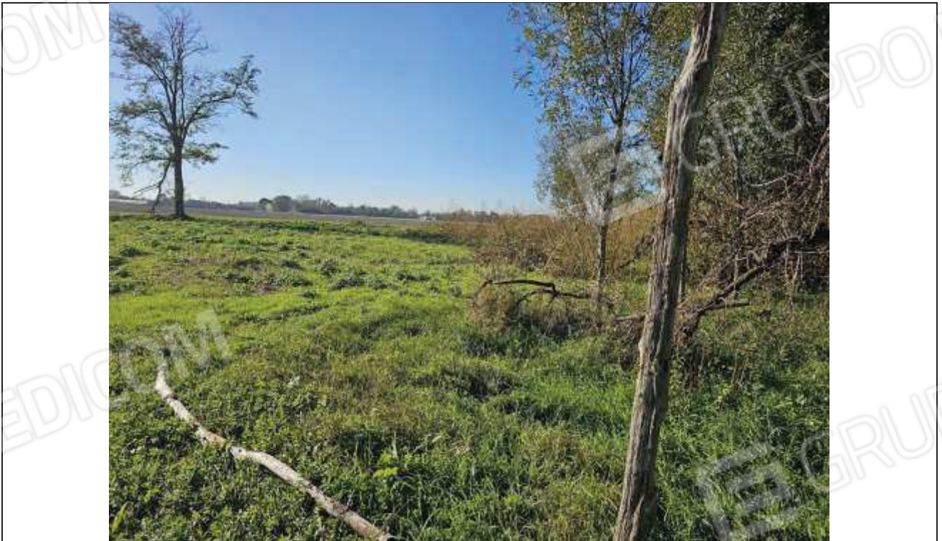
72 Vista della particella n. 494 verso la particella 77;