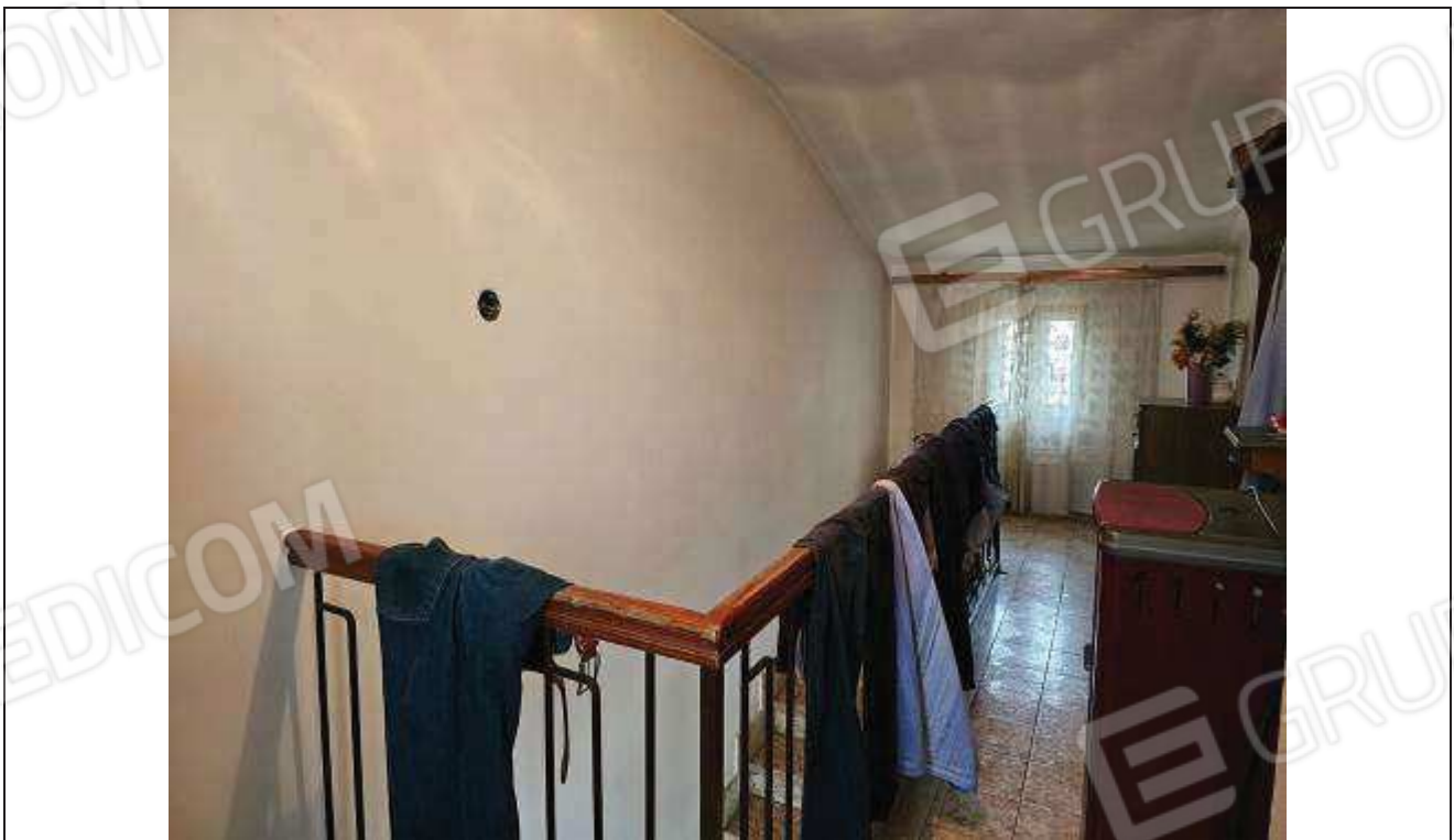
36 Vista del disimpegno verso il vano scale;