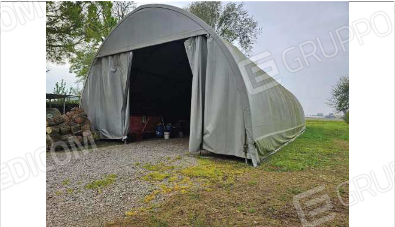
68 Vista della tensostruttura rimovibile adibita a deposito attrezzi e non autorizzata;