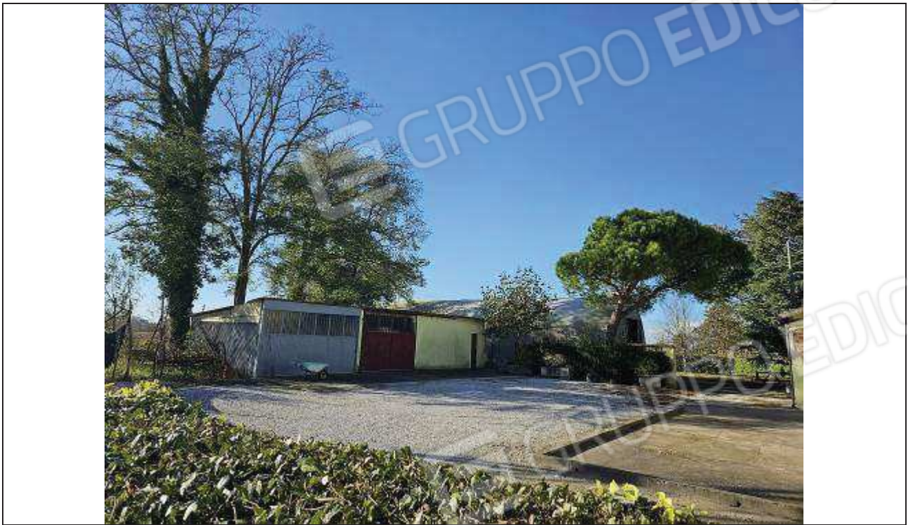
09 Vista del ricovero attrezzi e della porzione realizzata con struttura in lastre in lamiera ondulata, priva di autorizzazione;