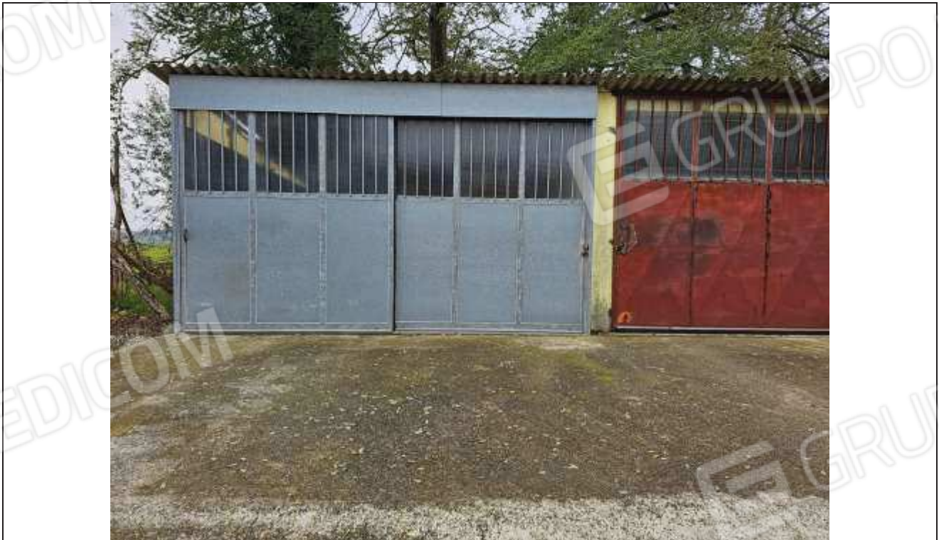
58 Vista del prospetto Nord della porzione in abuso;