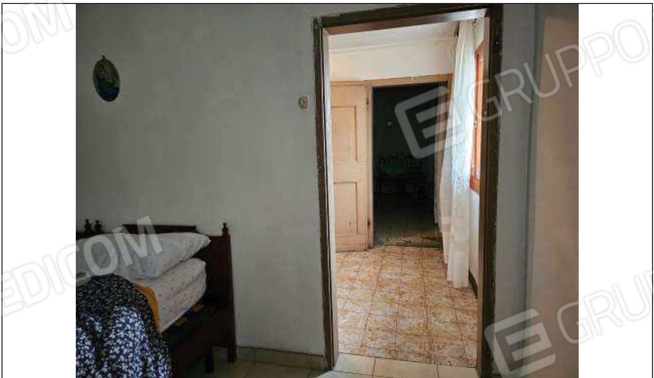
32 Veduta della seconda camera da letto verso il disimpegno;