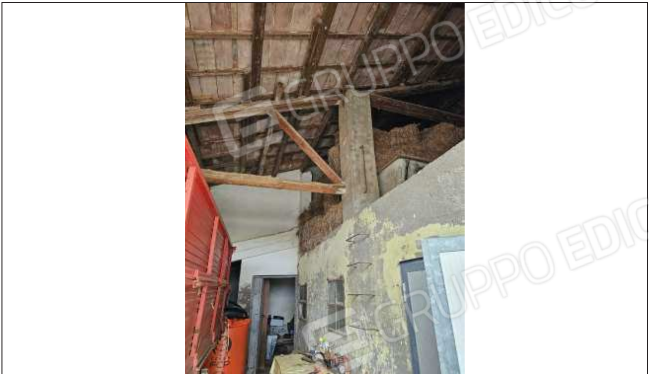
47 Vista dal portico verso il fienile collocato sopra il solaio della stalla ed accessibile mediante scale a pioli;