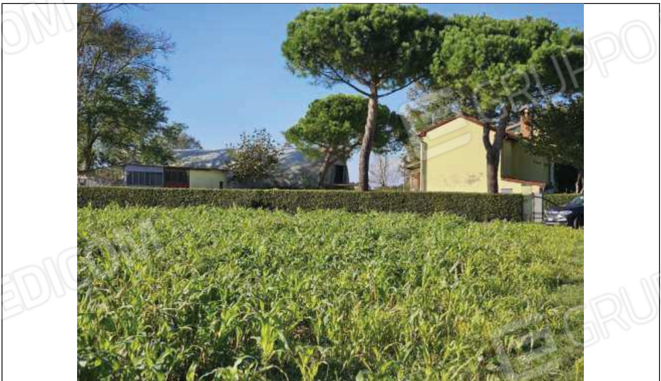
76 Vista del fabbricato rurale e annessi agricoli, dalla particella n. 82;