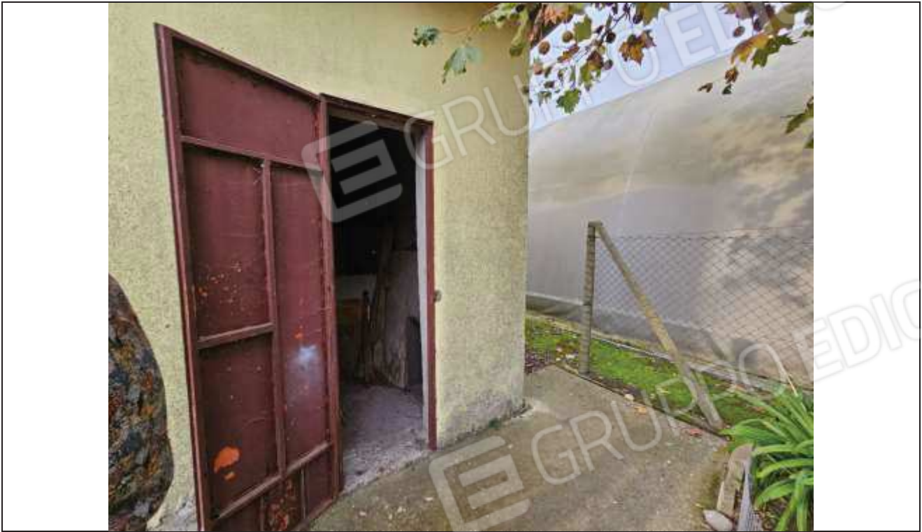
65 Vista dell'accesso al porcile;