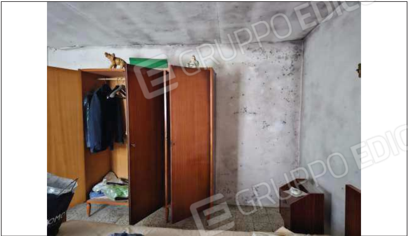
31 Altra vista della camera da letto;