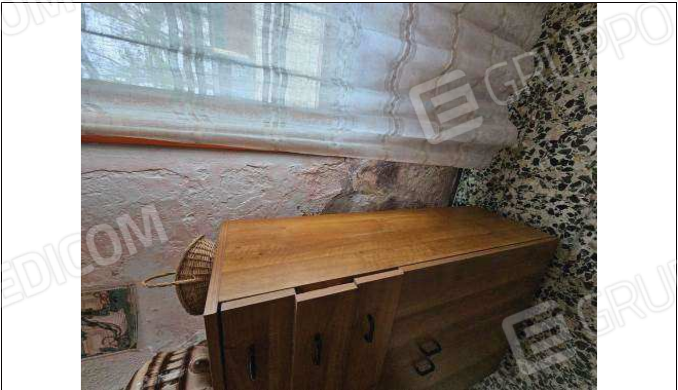
24 Altro particolare della muratura interna al piano terra del fabbricato rurale;