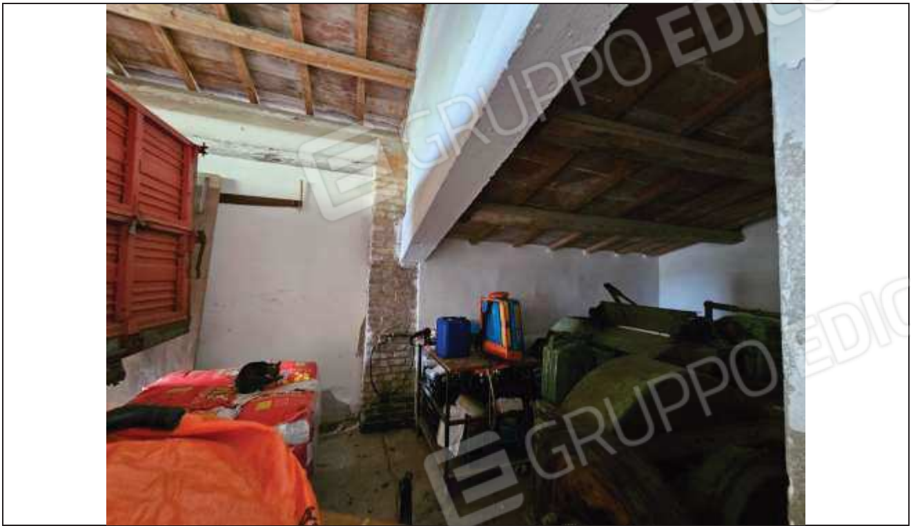
49 Vista del deposito aperto sul portico;