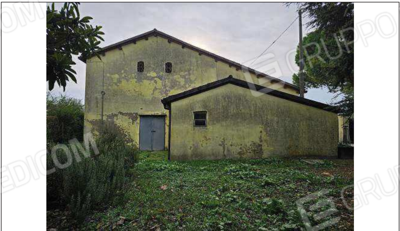
08 Vista del prospetto Nord-Ovest del fabbricato rurale, lato stalla;