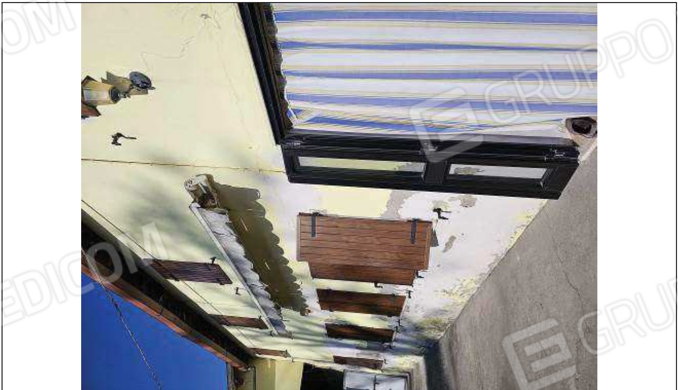
16 Vista dell'ingresso al fabbricato rurale lato Sud-Ovest;