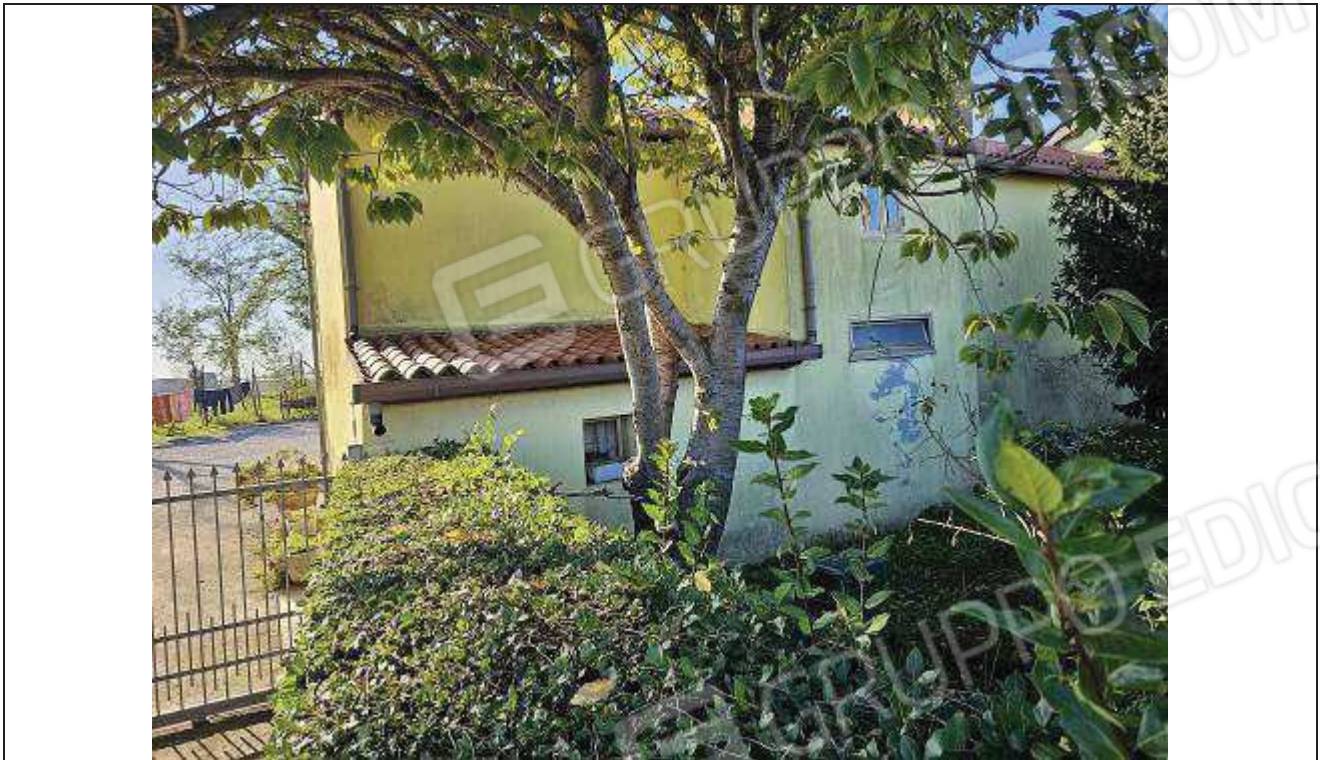
03 Vista del prospetto Nord-Est del fabbricato rurale (porzione residenziale);