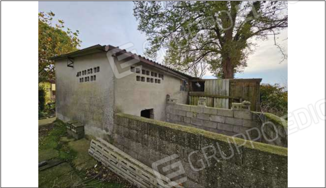
67 Vista dell'angolo Sud-Ovest del porcile e del deposito attrezzi;