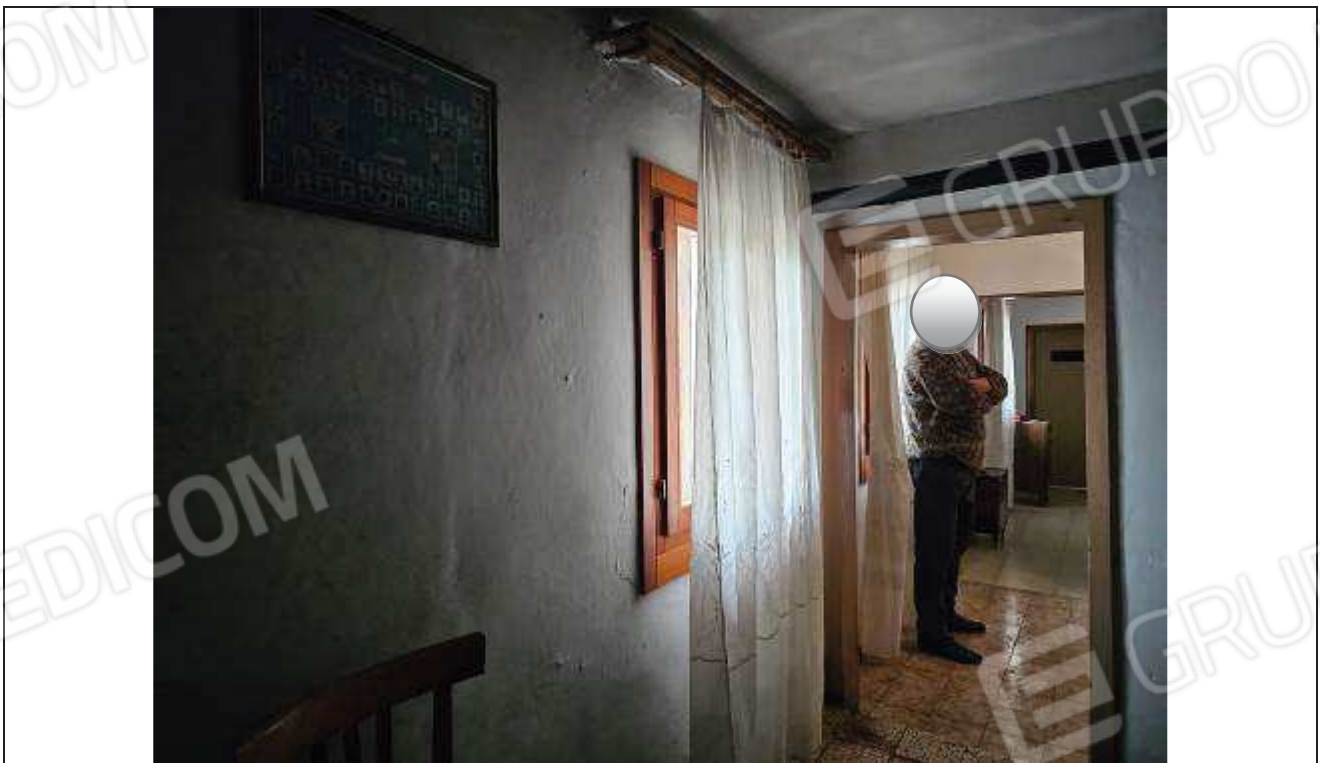
28 Vista dal disimpegno verso la camera singola;