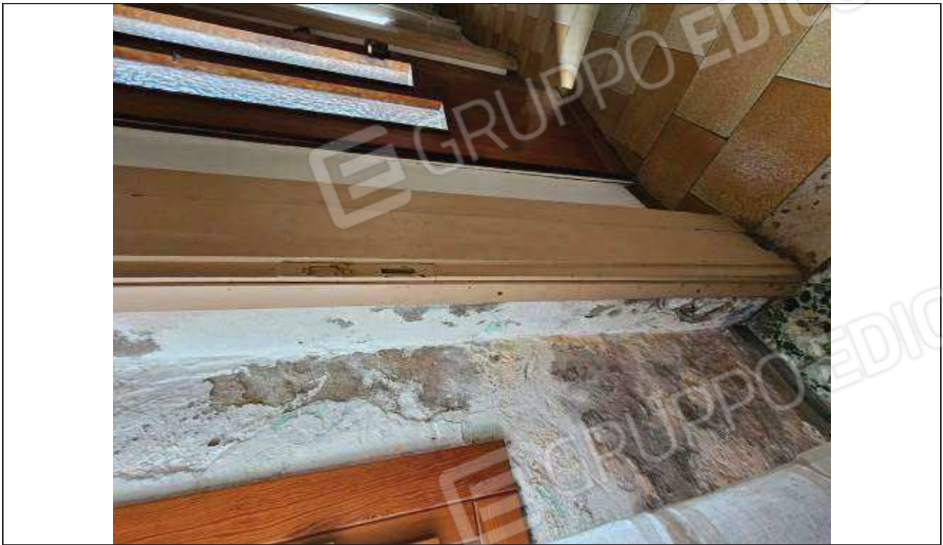
25 Altro particolare del distacco dell'intonaco e presenza di umidità al piano terra;