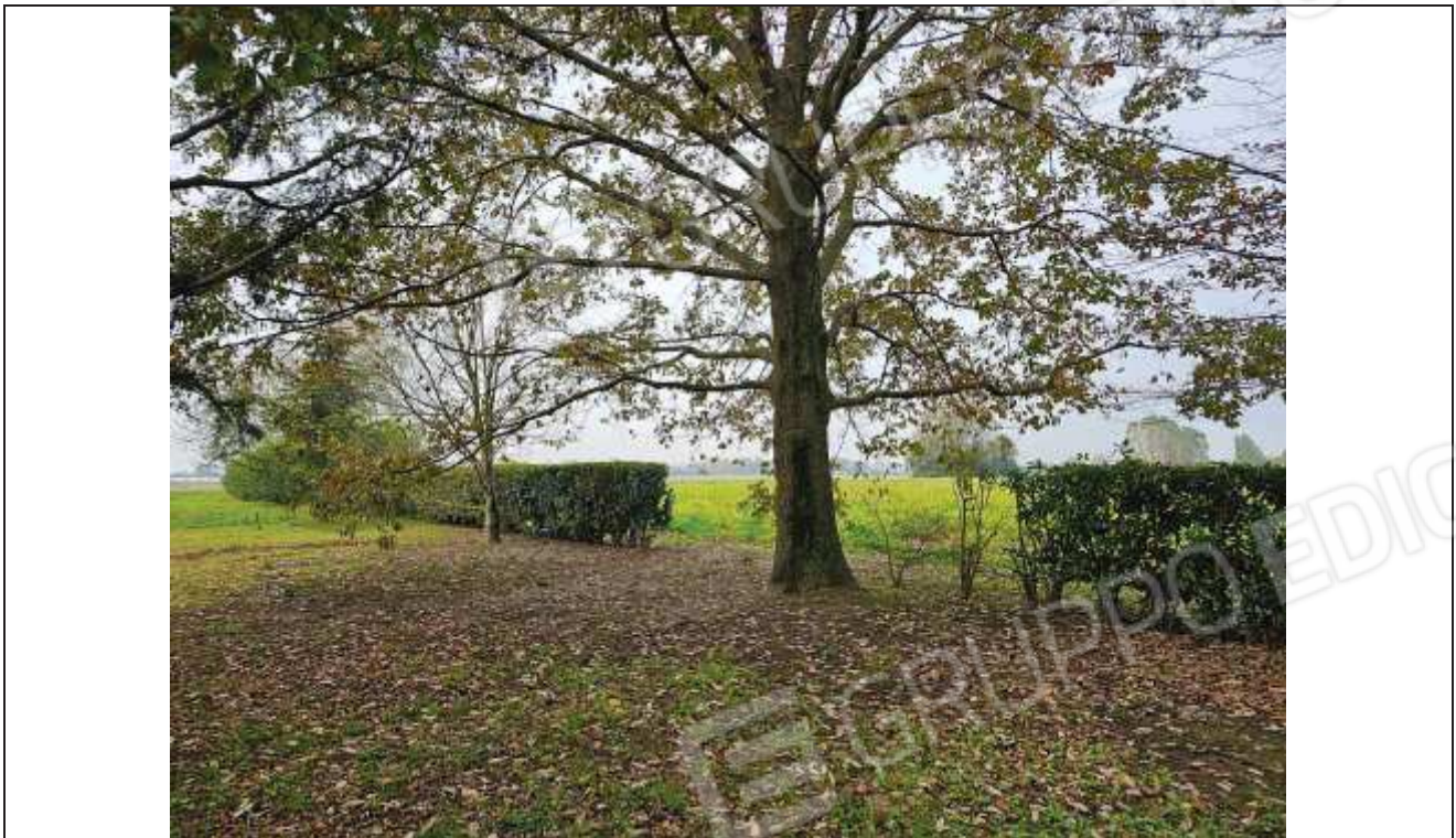
69 Veduta dei terreni agricoli a Nord-Ovest del fabbricato rurale;