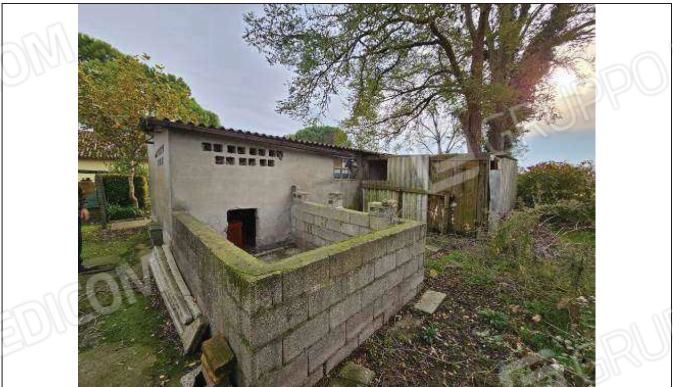
12 Vista del dell'angolo Ovest del deposito attrezzi con manufatto in legno realizzato abusivamente, oggetto di demolizione;