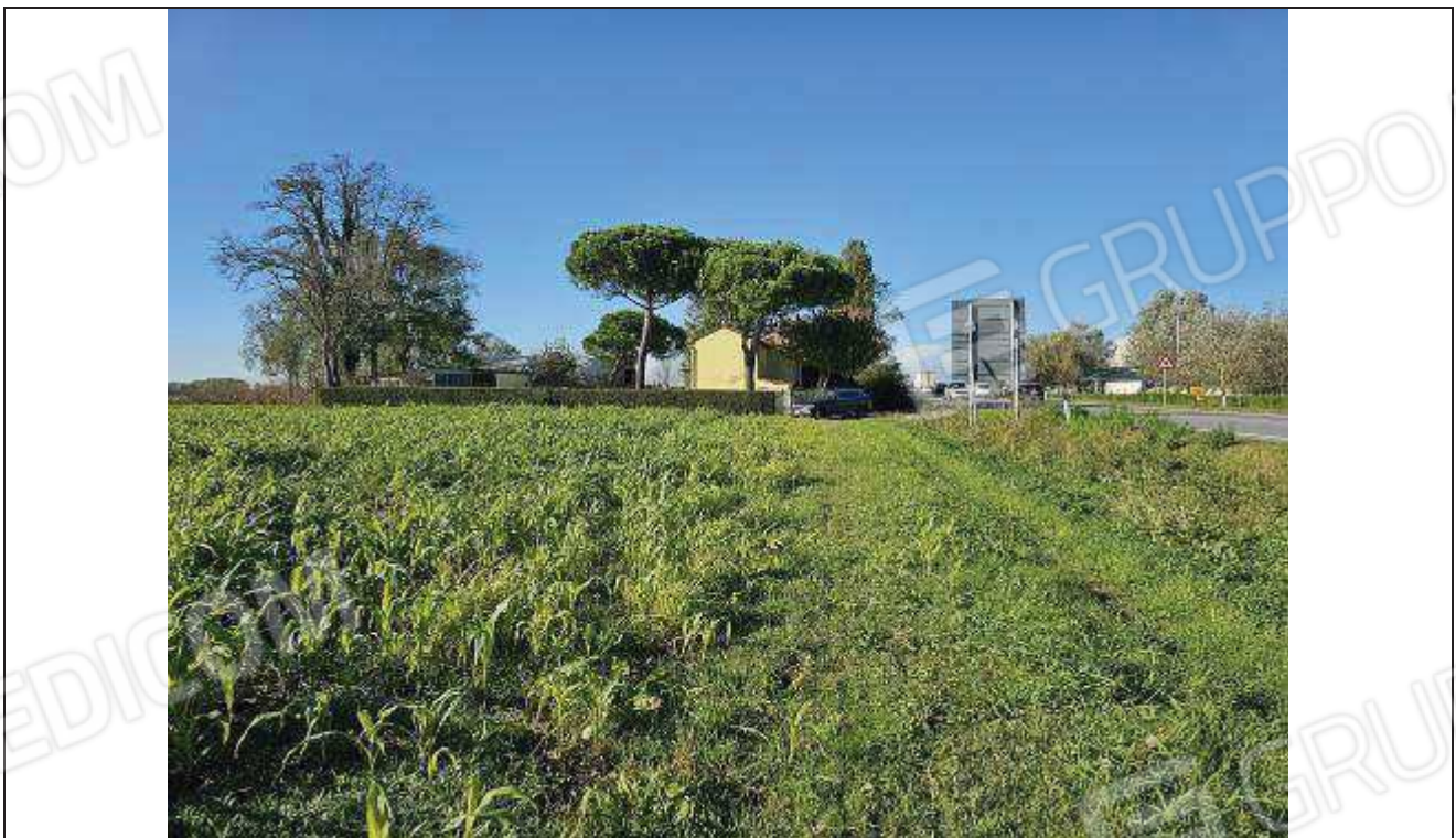
04 Vista del complesso rurale da Sud-Est, con parte dei terreni agricoli identificati al -C.T.: fg. 42, part. n. 82; Veduta lato sviluppato lungo la Strada Statale Romea;