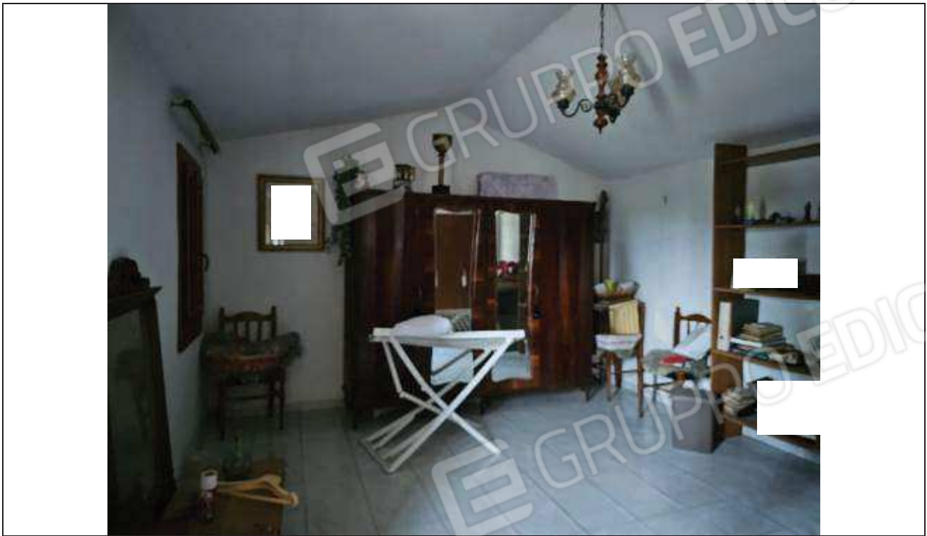
35 Altra vista dell'ultima camera da letto;