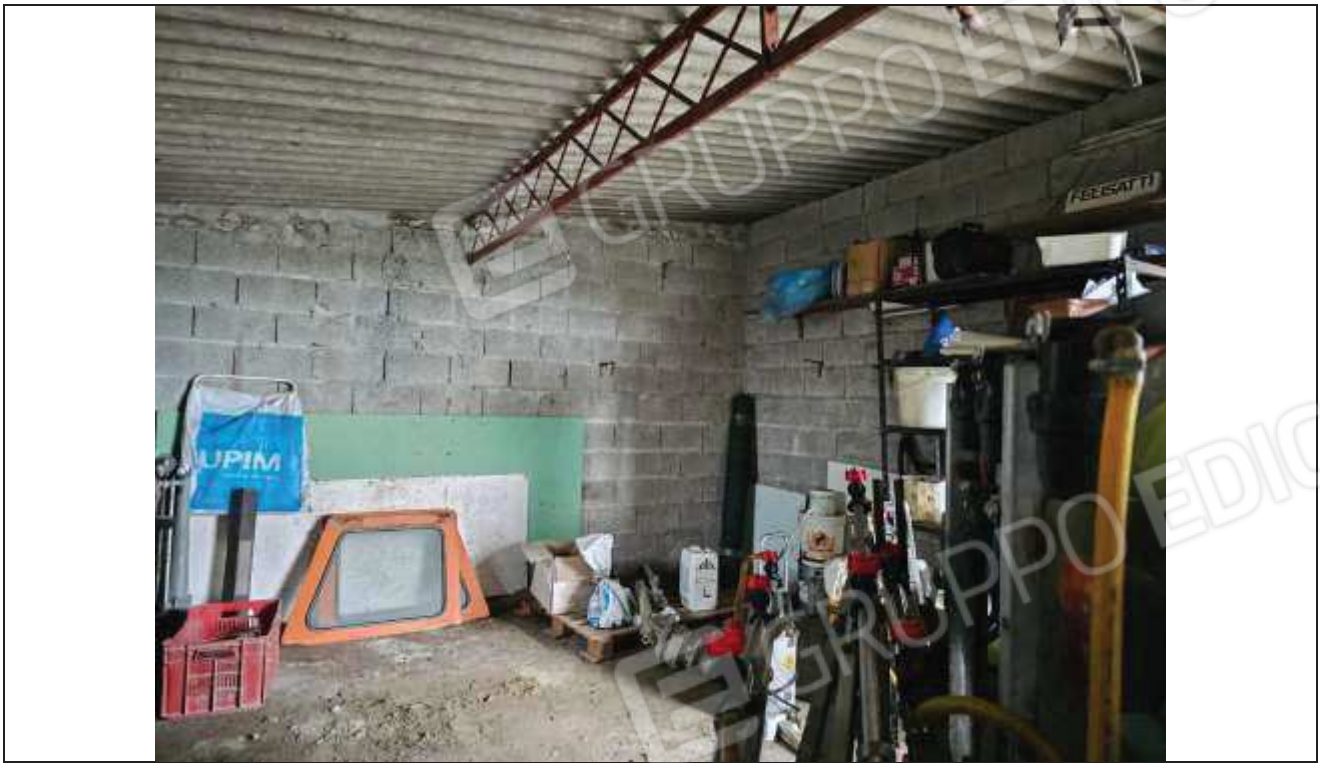
63 Altra vista interna del deposito attrezzi;