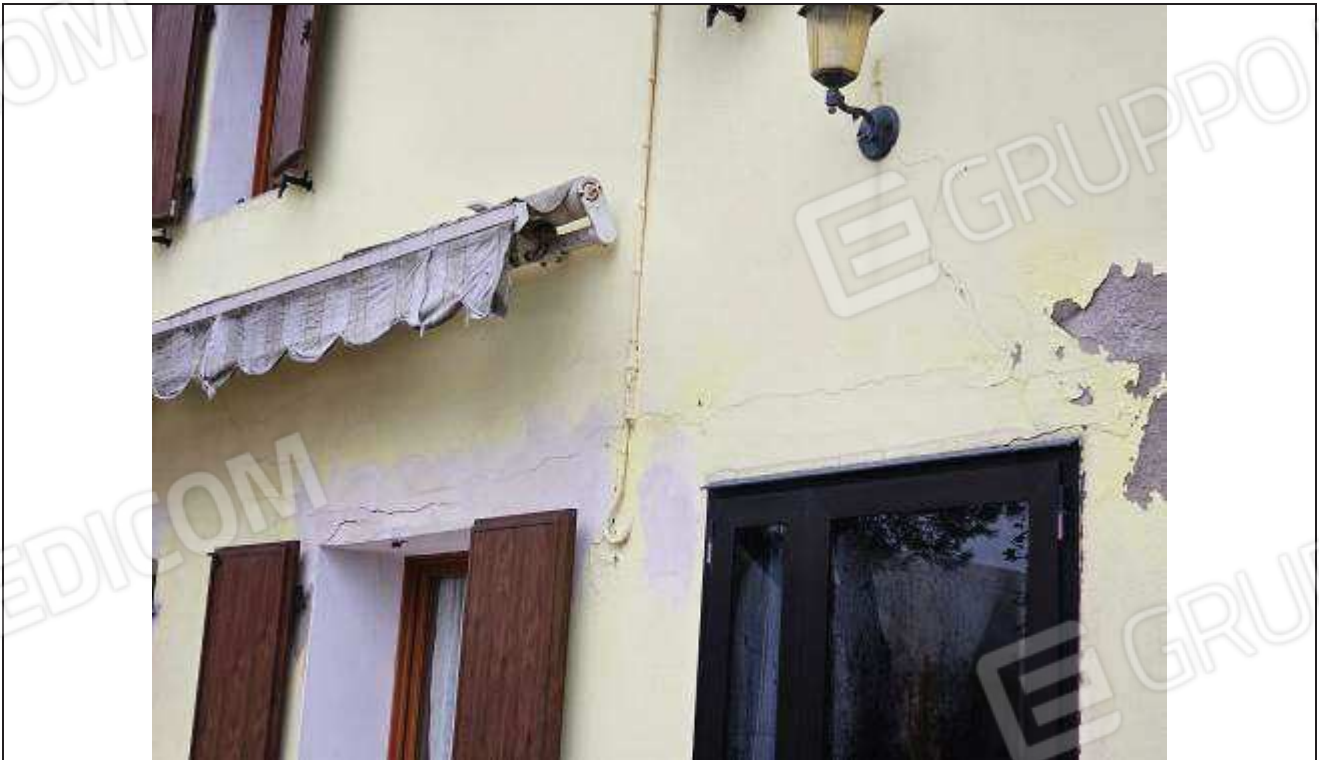
40 Particolare degli scrostamenti e fessurazioni presenti sulla facciata Sud-Ovest, dell'abitazione;