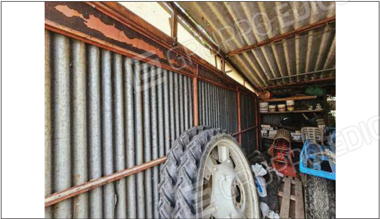
59 Vista interna del deposito attrezzi abusivo;