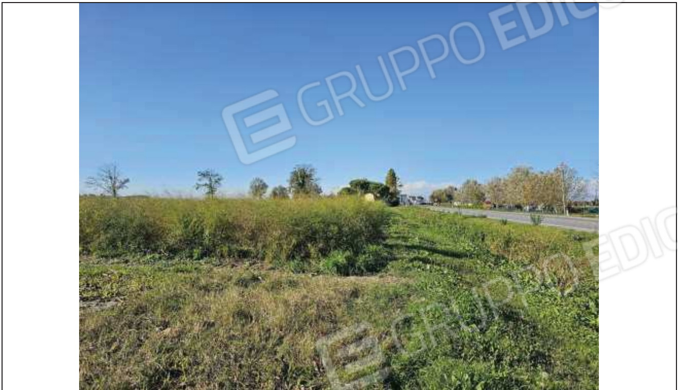
77 Vista dei terreni agricoli ( particella n. 169, particella n. 82) prospettanti la Via Romea;