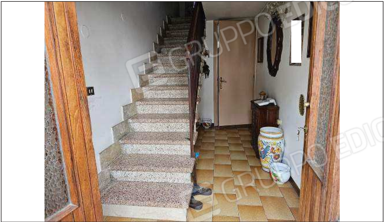
17 Vista dell'ingresso con vano scale e porta di accesso al bagno;