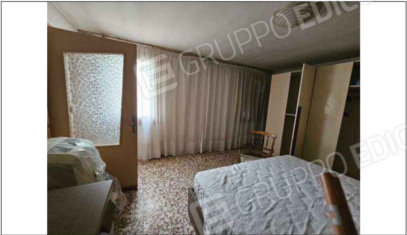
19 Vista del locale pranzo, attualmente adibita a camera da letto;