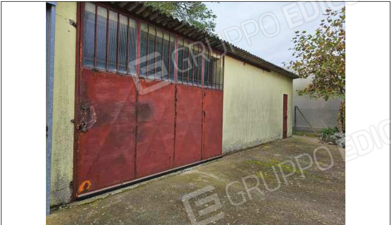
61 Vista del prospetto Nord del deposito attrezzi;