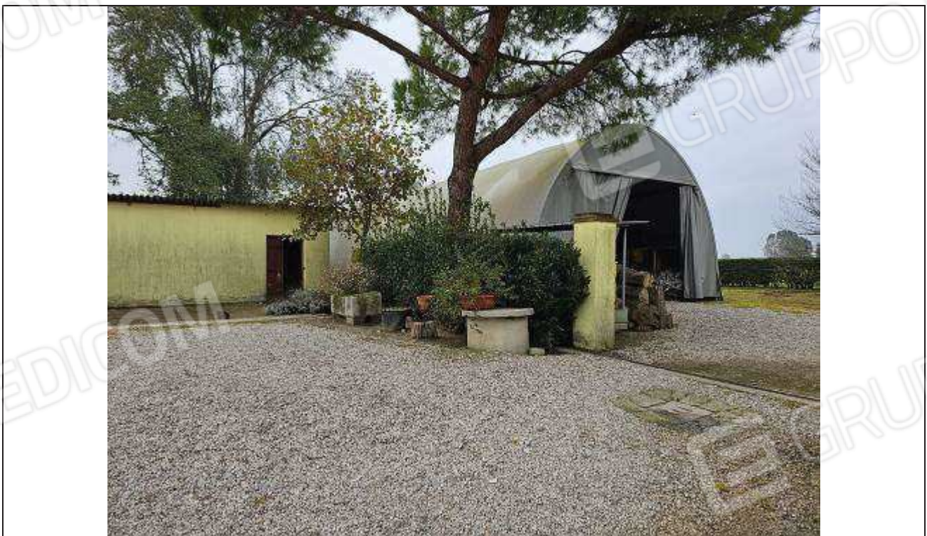
10 Vista dell'accesso al porcile e alla tensostruttura rimovibile non autorizzata, adibita a deposito attrezzi;