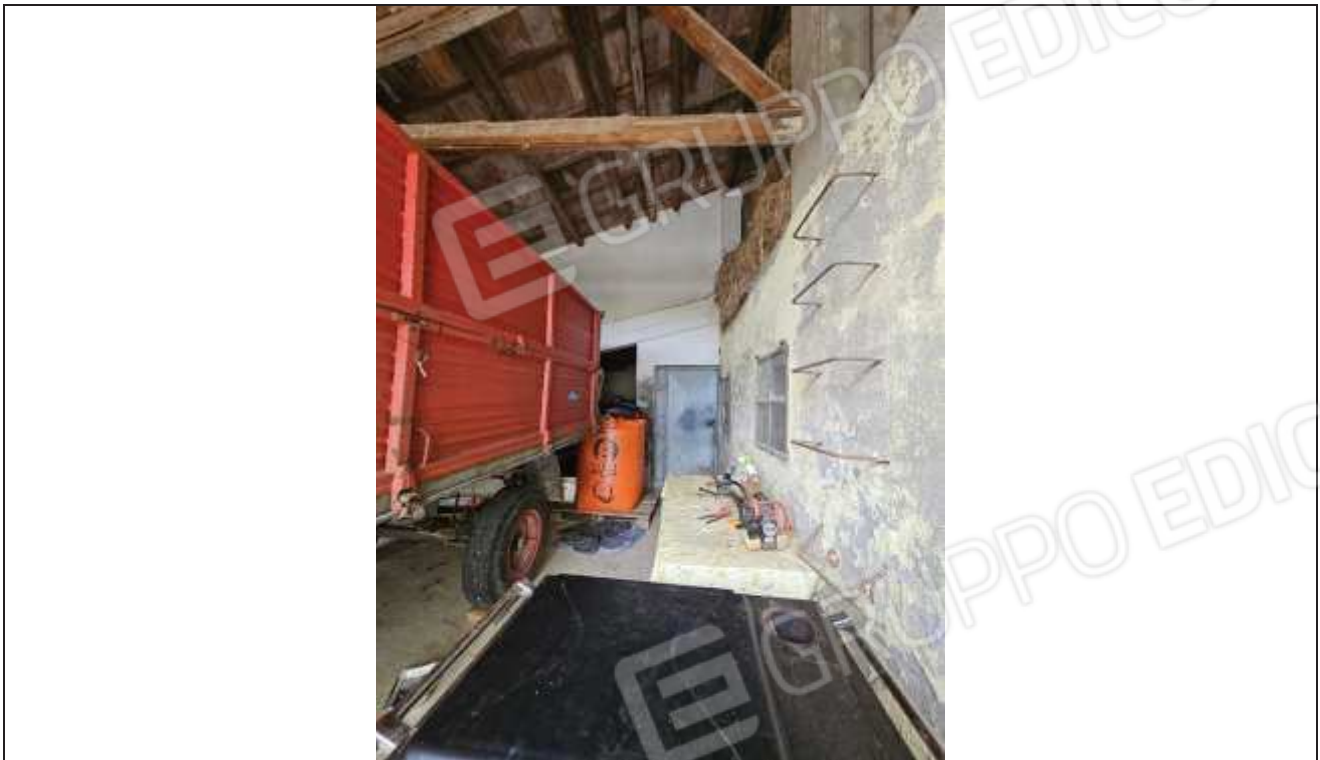
45 Vista interna del portico verso la porta della cantina;