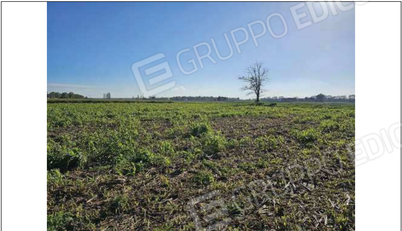
73 Altra vista della particella n. 494;