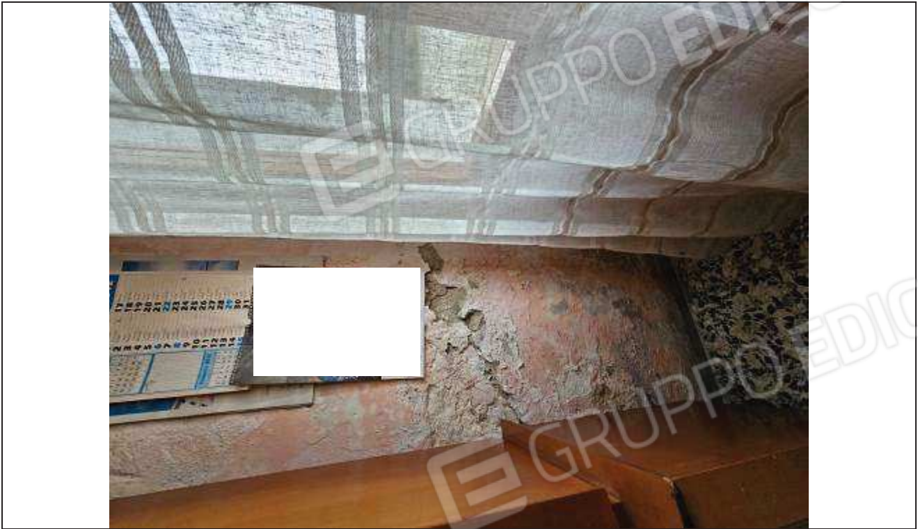
23 Particolare delle fessurazioni e del distacco dell'intonaco sulla parete interna del soggiorno;