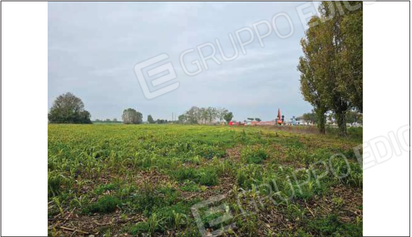
71 Vista della particella n. 77, verso la Strada Statale Romea;