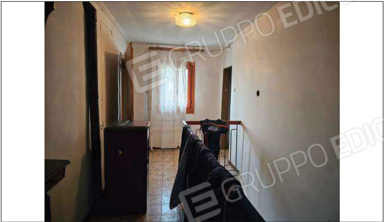
27 Vista dal disimpegno al piano primo;