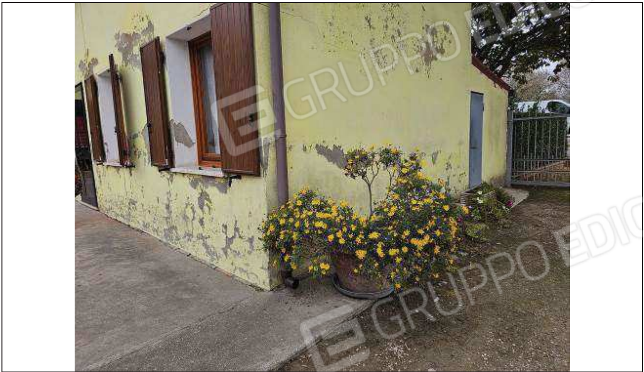
37 Vista del fabbricato rurale angolo Sud-Est con particolare dell'ingresso esterno al vano Ripostiglio;