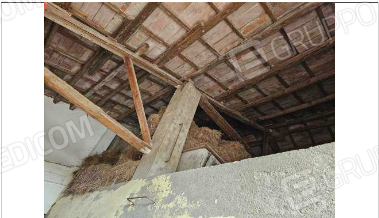
48 Altra vista del fienile;