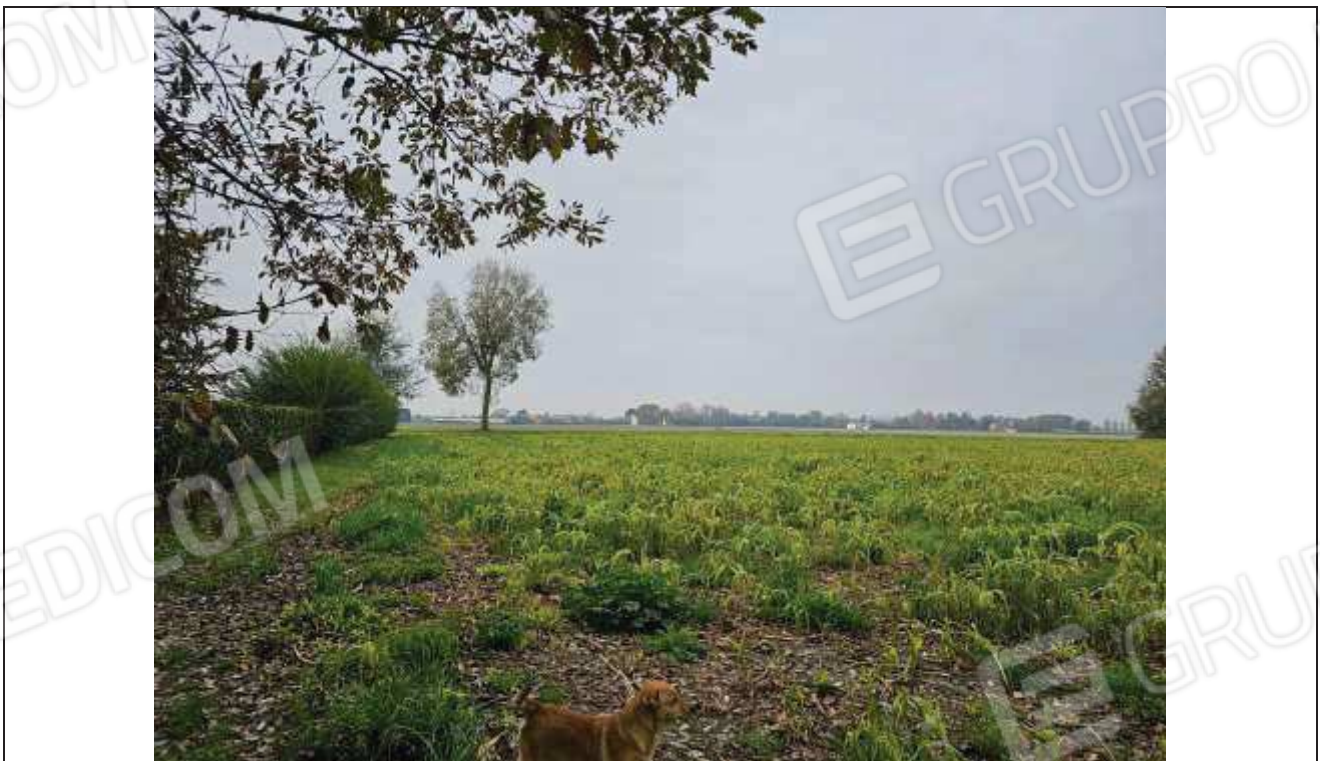
70 Vista dei terreni agricoli -particella n. 77; a Sinistra la siepe di delimitazione dell'area di pertinenza dei fabbricati rurali;