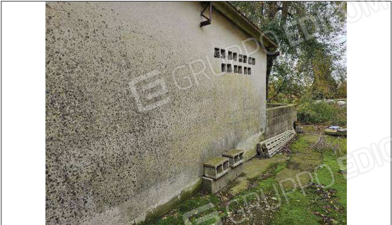
11 Vista del prospetto Est del porcile;