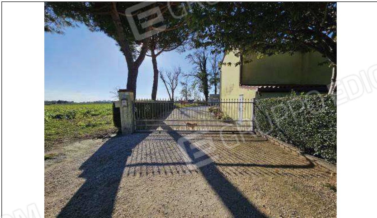
01 Vista della piazzola di sosta interposta tra l’accesso carraio e la SS 309 (via Romea);

-C.T.: fg. 42, part. n. 77, part. n. 494, part. n. 82 e part. n. 169