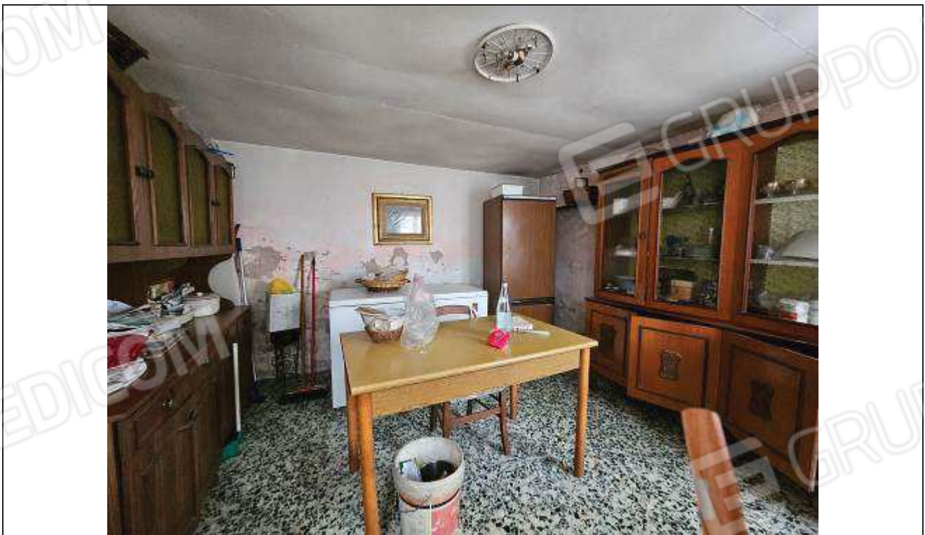
22 Vista del soggiorno;