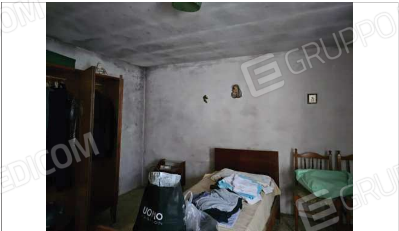
30 Vista della camera a Sud-Est del fabbricato, con evidente presenza di muffe sulle pareti e soffitto;