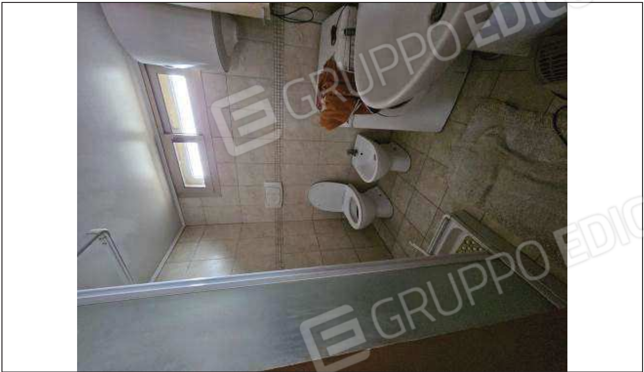
21 Vista interna del bagno;