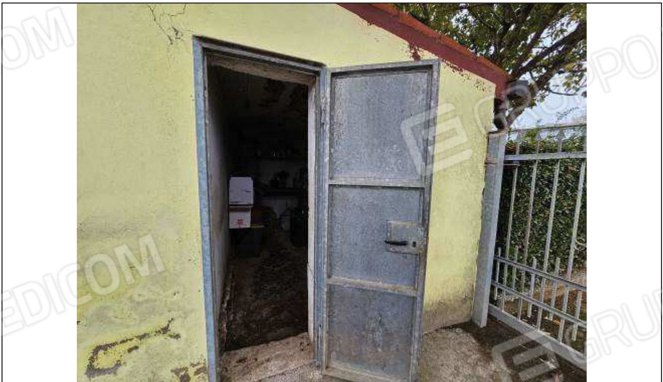
38 Vista del ripostiglio sul lato Sud-Est del fabbricato rurale;