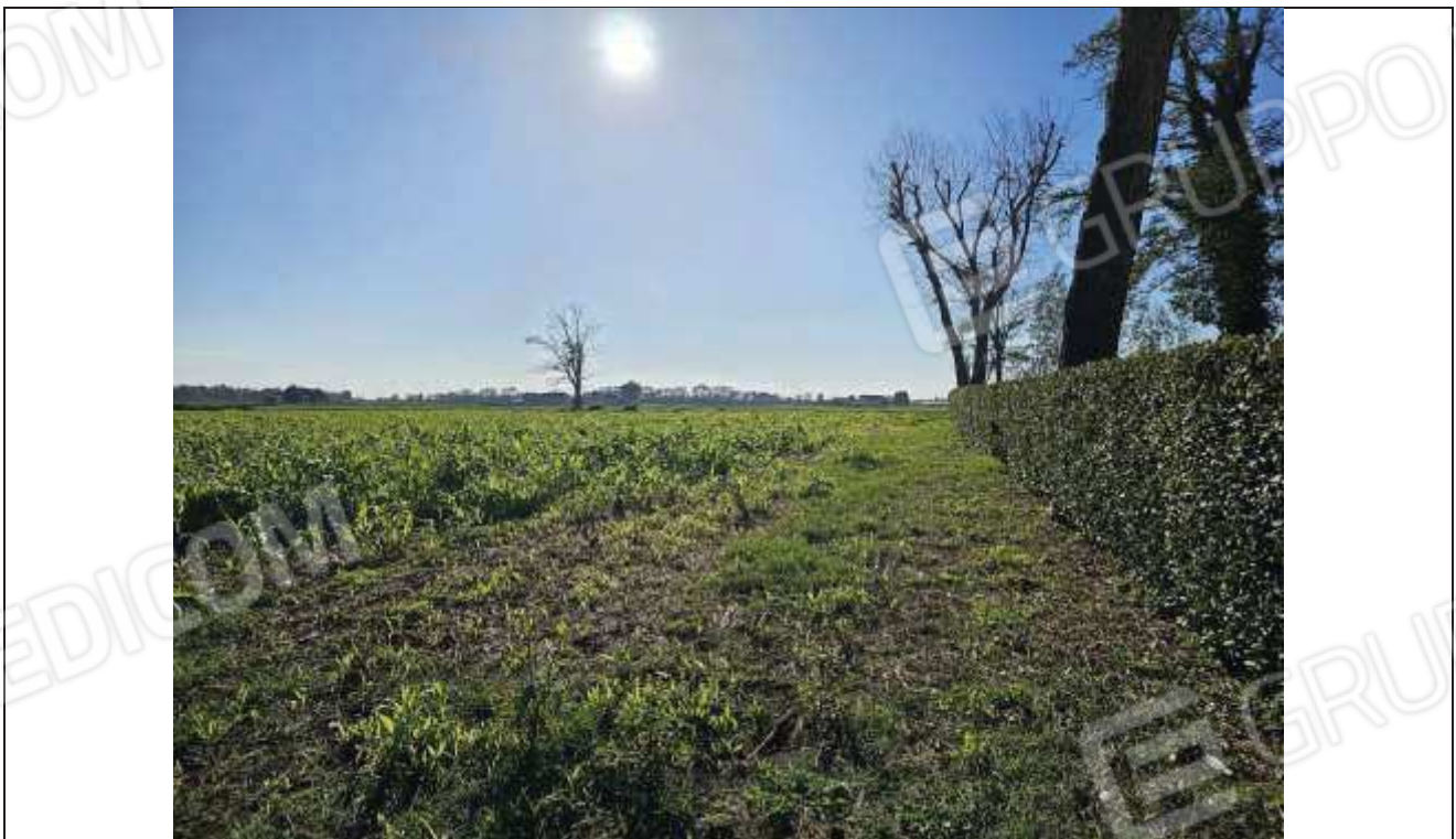
74 Vista della particella n. 82; a destra si nota la siepe di delimitazione dell'area di pertinenza dei fabbricati rurali;