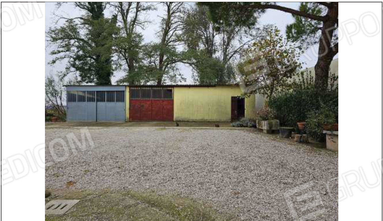
56 Veduta verso i depositi attrezzi e porcile; a Sinistra si nota la porzione di fabbricato in con apertura in metallo grigio, realizzata abusivamente e da rimuovere;