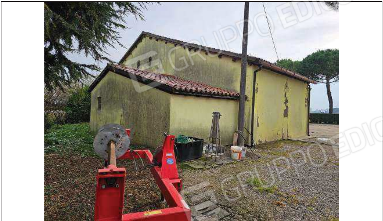
07 Vista dell'angolo Ovest della stalla e ricovero attrezzi;