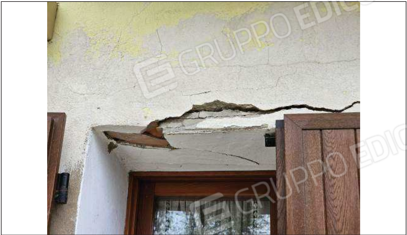
41 Altro particolare del distacco degli intonaci e architrave finestra al piano terra;