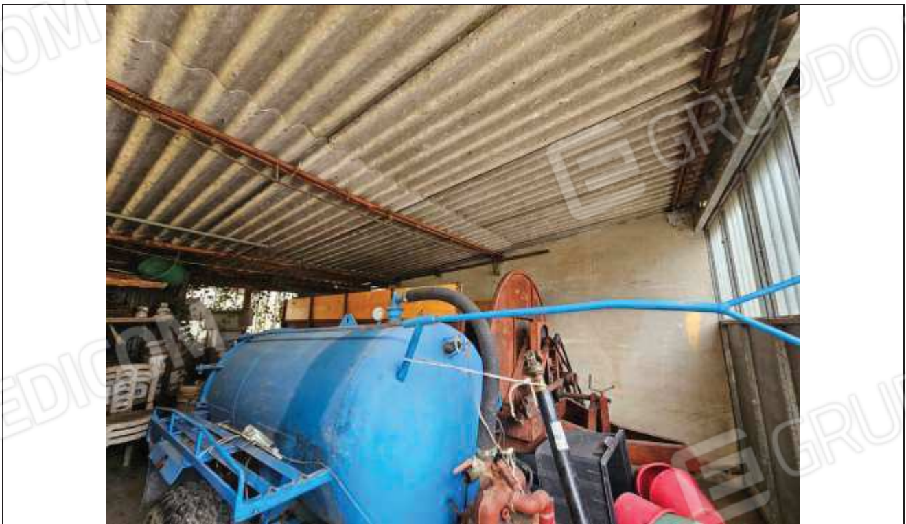
60 Altra vista interna dell'abuso;