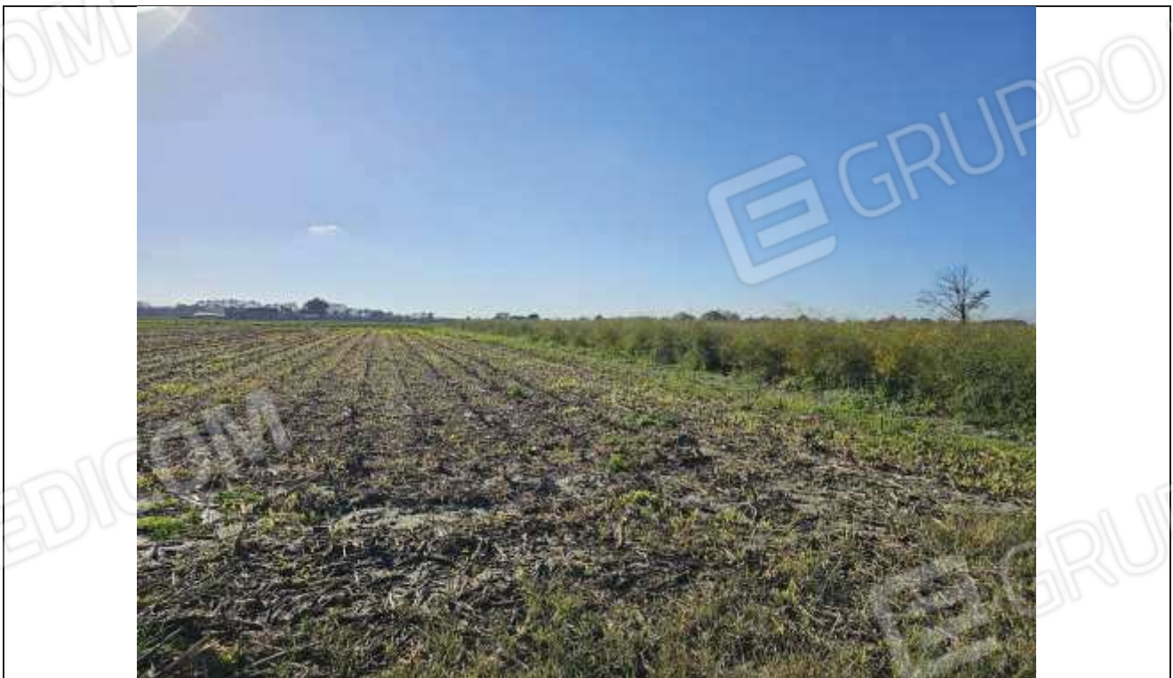
78 Vista della particella 169.