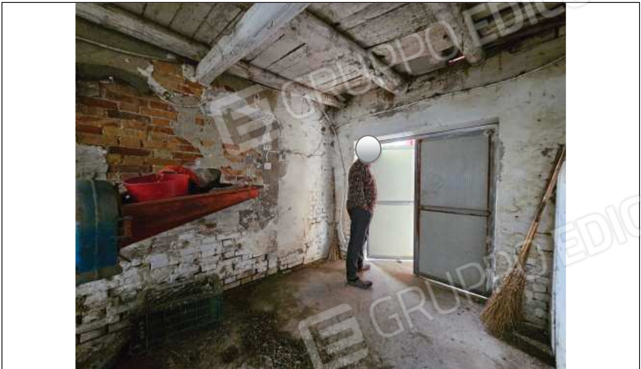
53 Vista interna della stalla verso la porta d'ingresso accessibile dal portico;