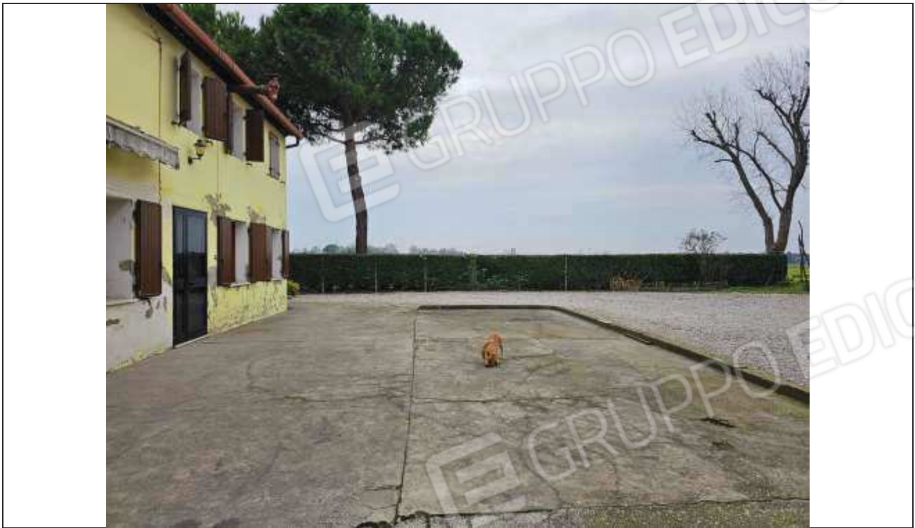
15 Vista dell'area cortilizia pavimentata parte in cemento liscio e parte in ghiaio;