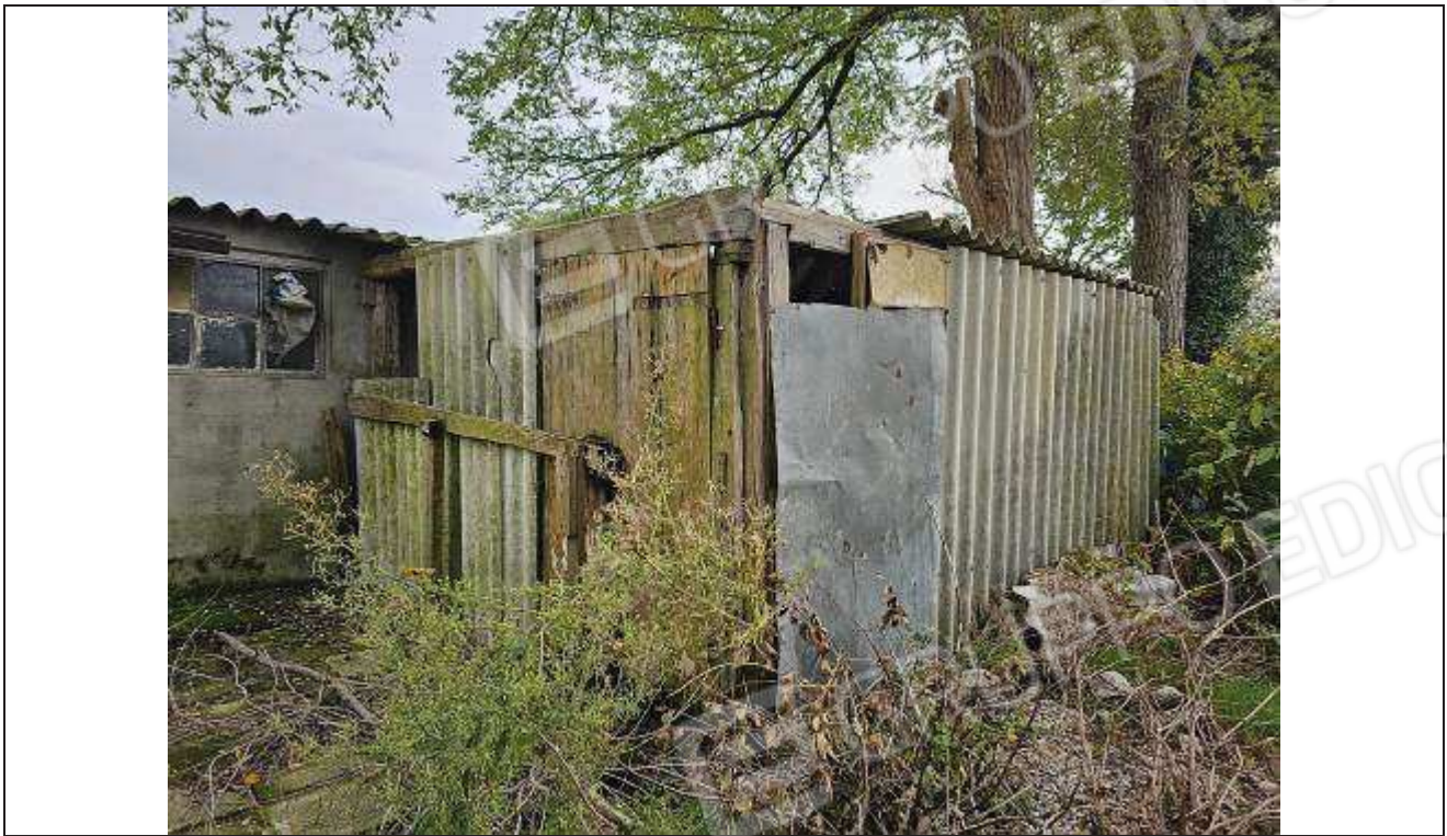
13 Vista manufatto abusivo oggetto di demolizione;