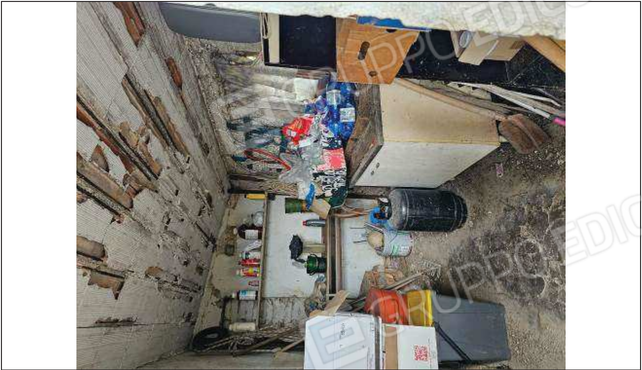
39 Vista interna del ripostiglio;