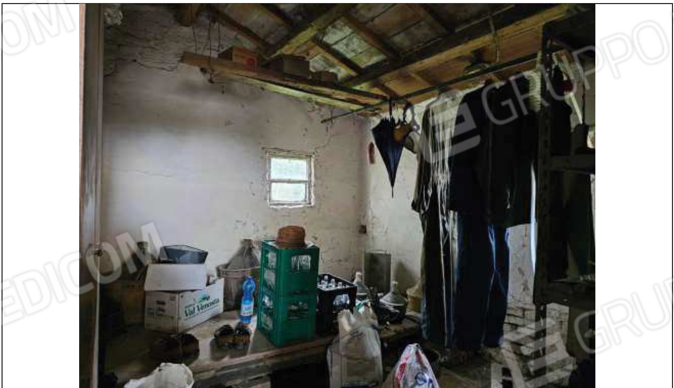
52 Altra vista della cantina;