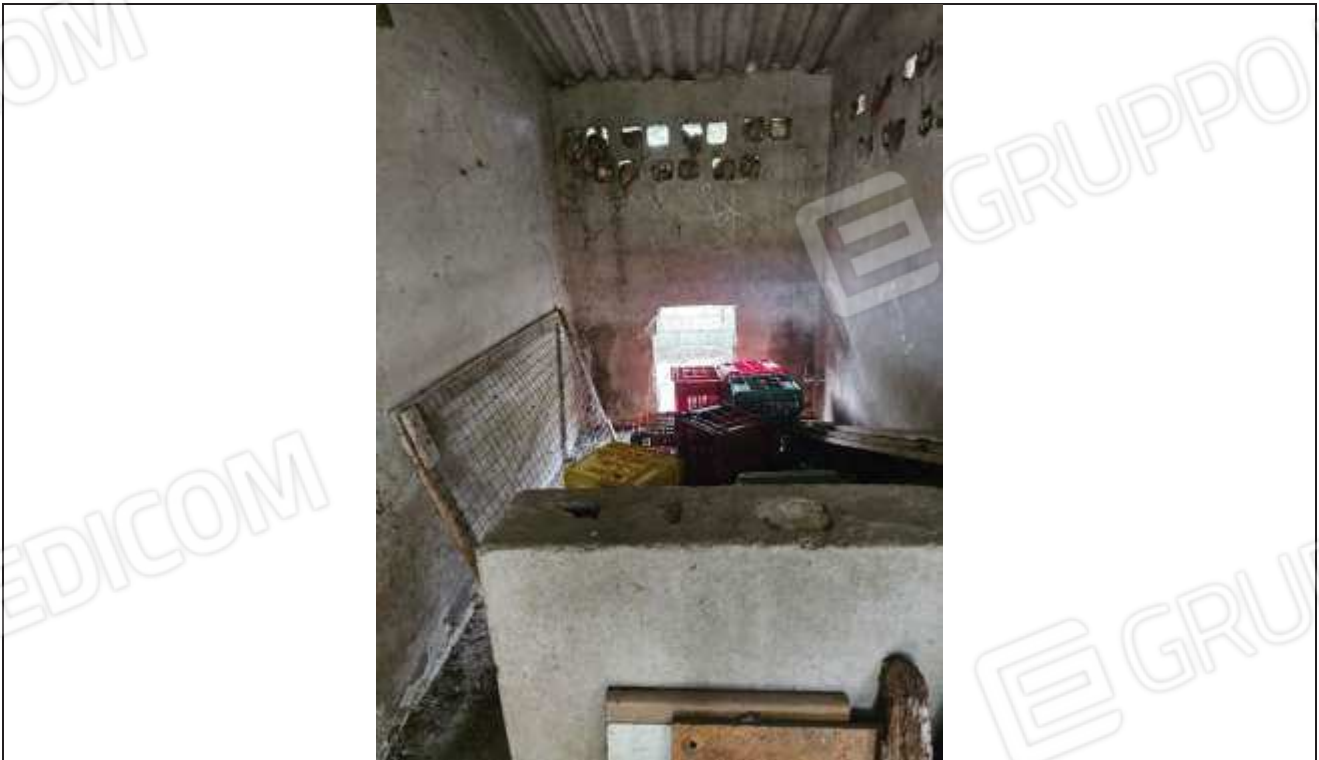
66 Vista interna del porcile con il muretto di separazione interna da regolarizzare;