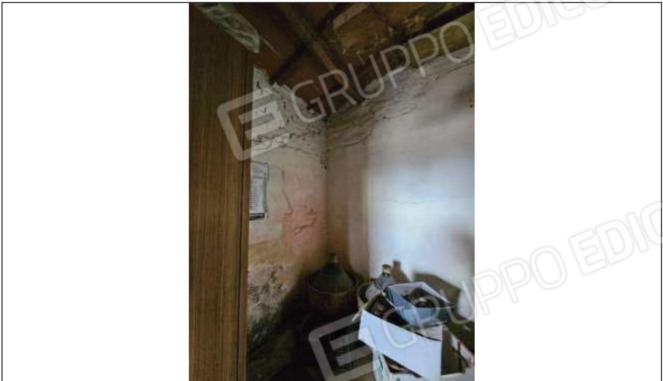
51 Vista della cantina accessibile dal portico;