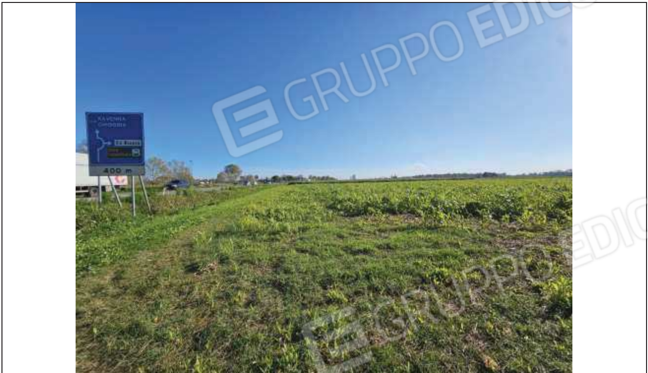
75 Vista della particella n. 82, verso la Strada Statale Romea;