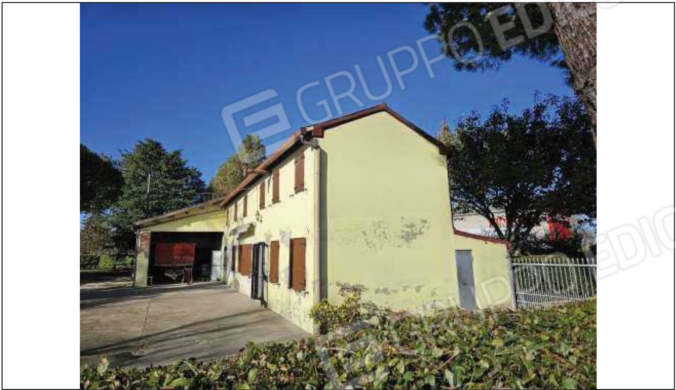
43 Vista del prospetto Sud-Est verso il portico d'ingresso alla stalla;