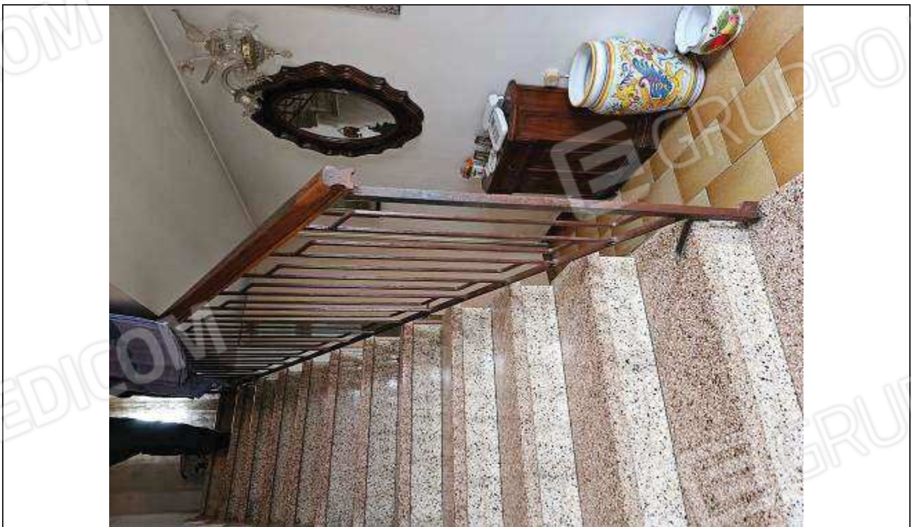
26 Vista del vano scale dall'ingresso;