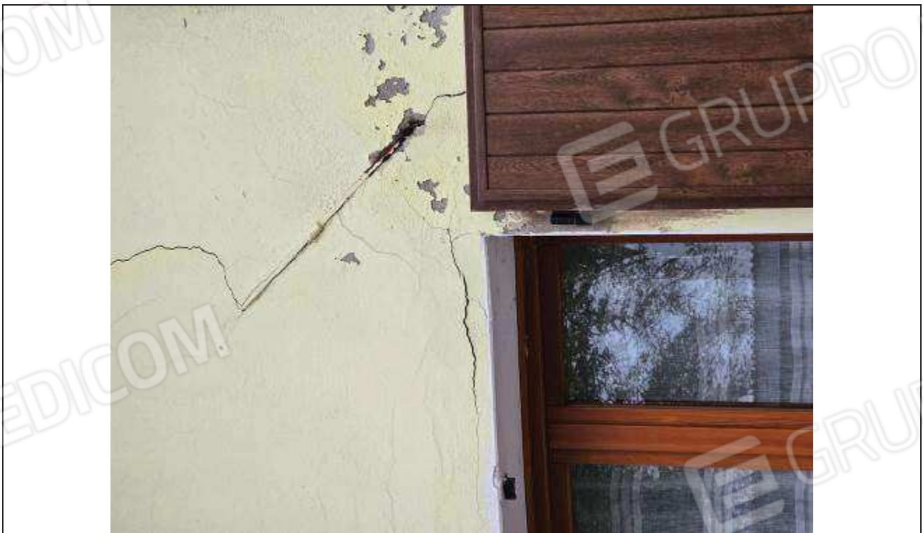
42 Altra vista del particolare delle crepe;