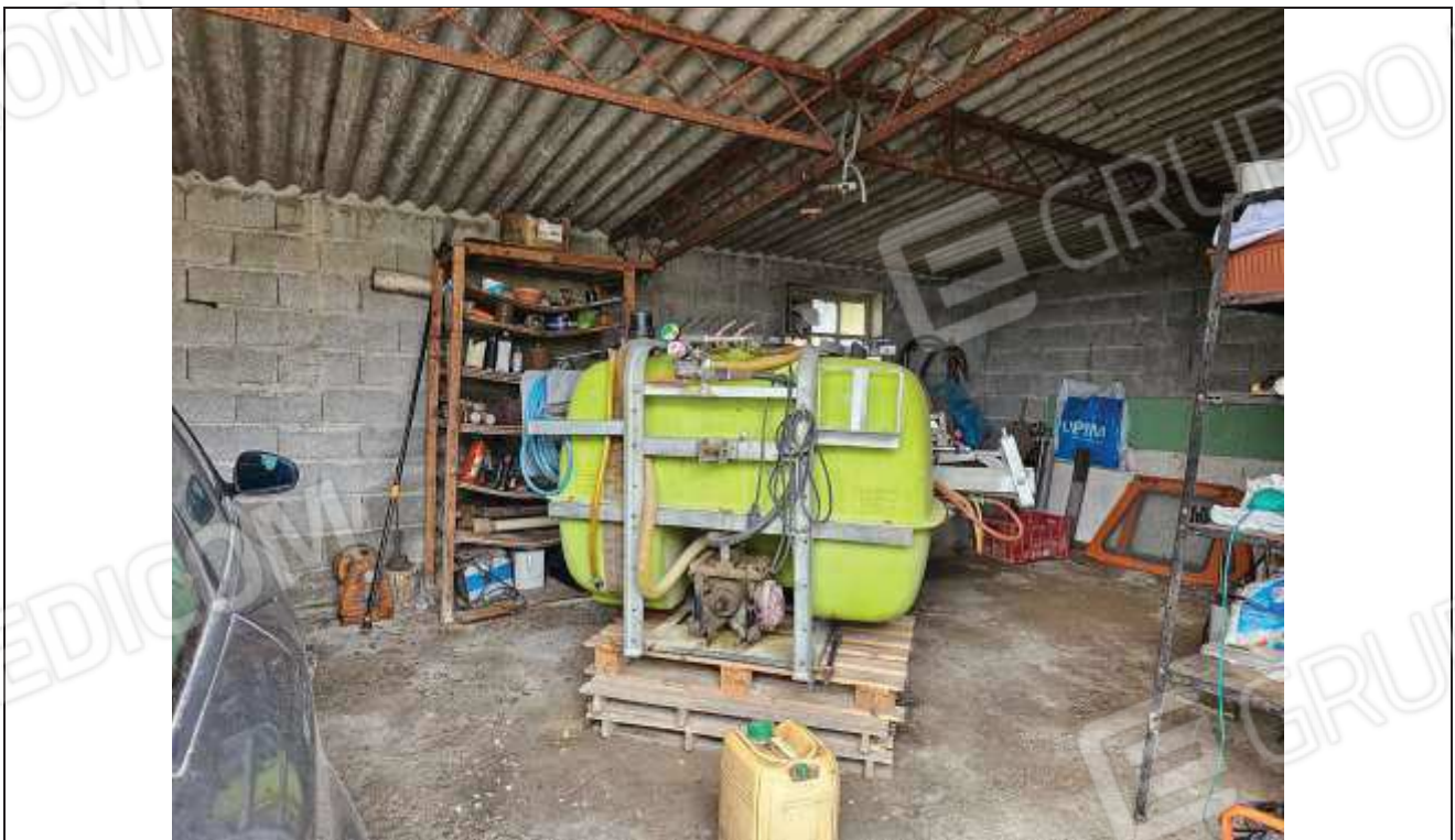
64 Altra vista interna del deposito attrezzi, dal portone d'ingresso;