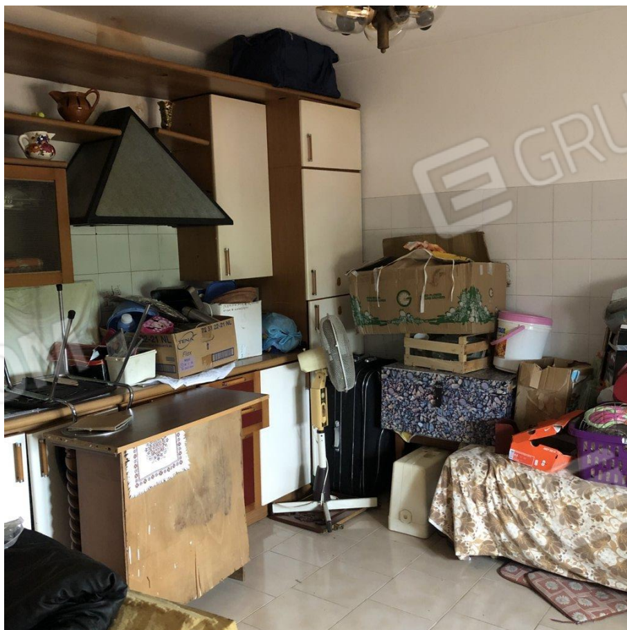
foto n. 16 - cucina al primo piano