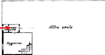
PIANTA PIANO TERRA N.250