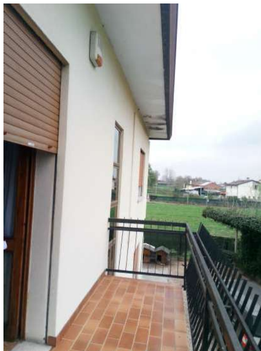
FOTO N. 12 Poggiolo