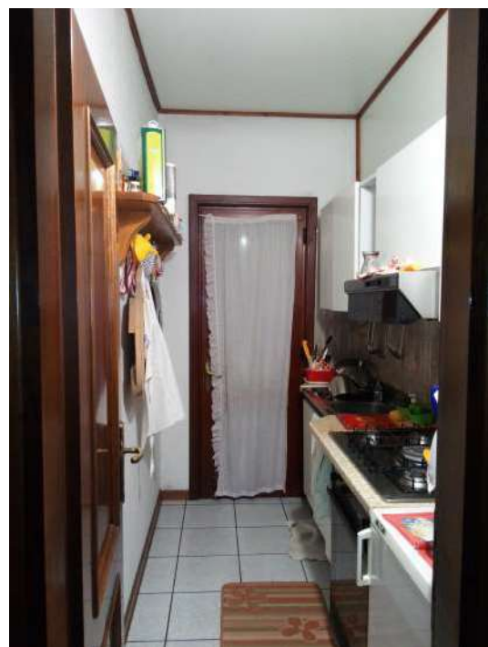
FOTO N. 7 Cucinino