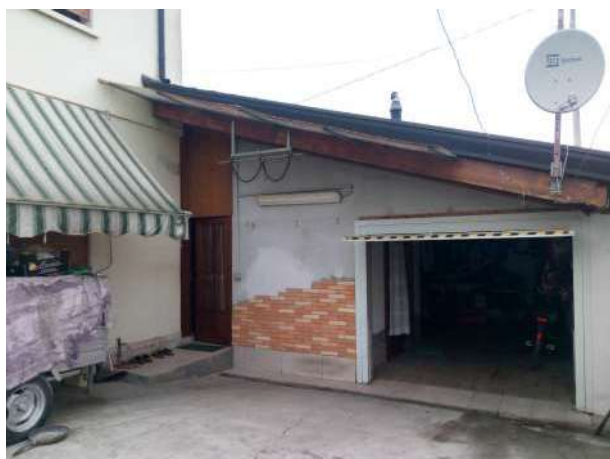
FOTO N. 17 garage