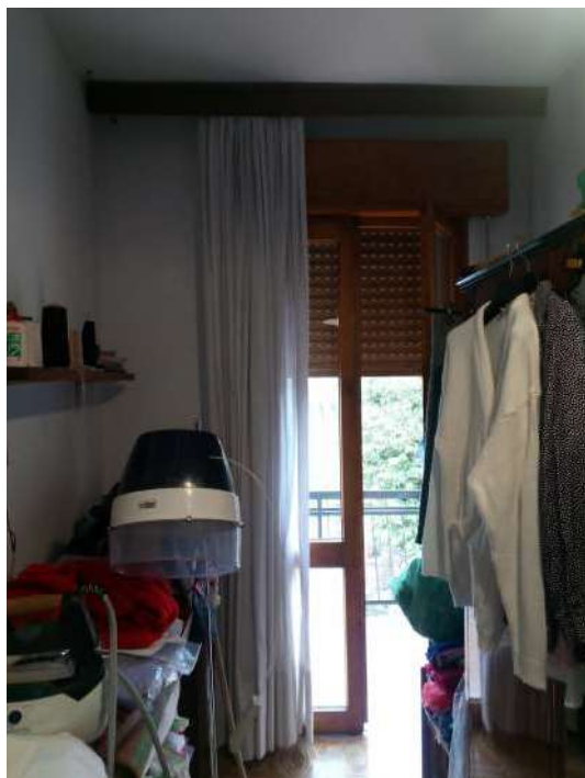
FOTO N. 11 Cameretta