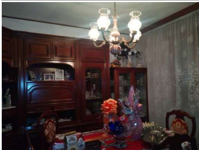
FOTO N. 6 Soggiorno