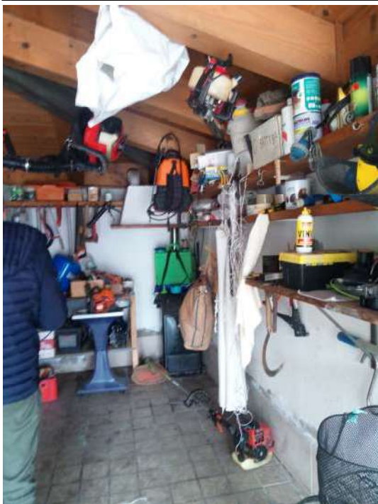
FOTO N. 19 Garage