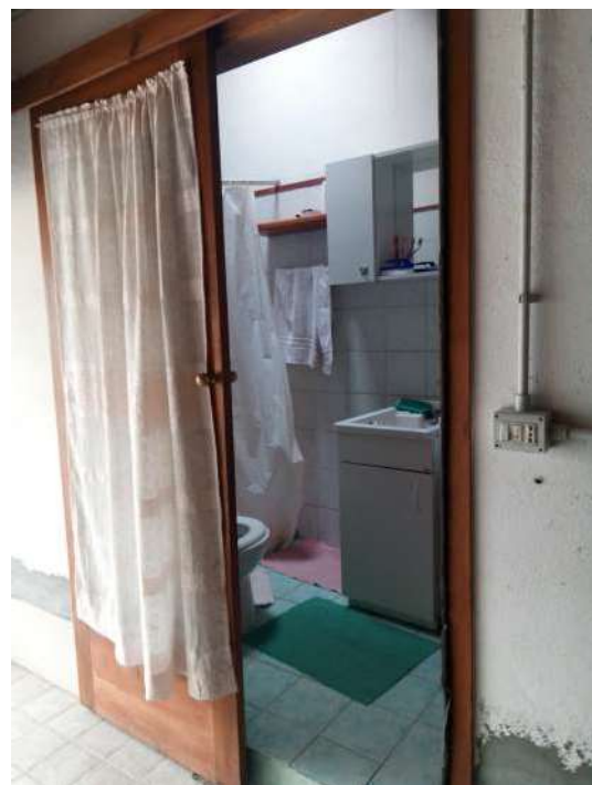
FOTO N. 18 Bagno interno garage