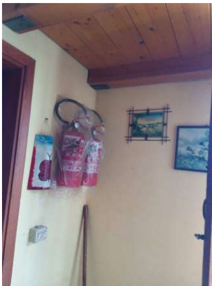
FOTO N. 21 Ingresso cantina