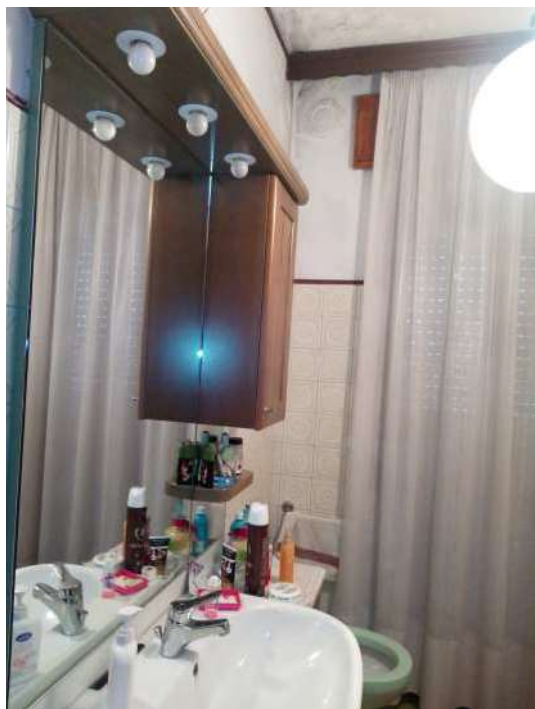
FOTO N. 15 Bagno