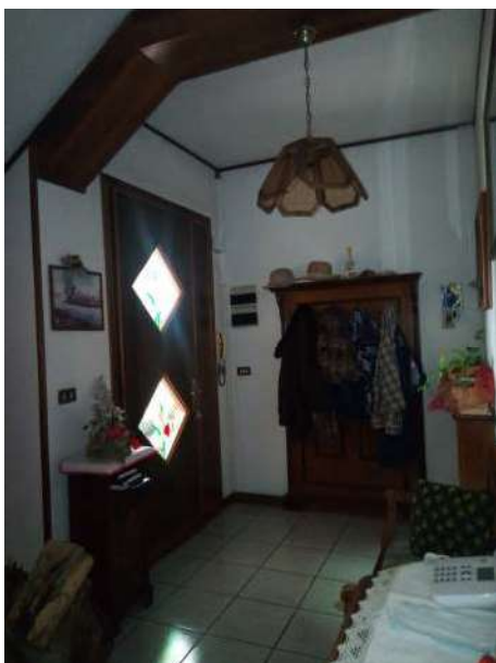
FOTO N. 4 Ingresso