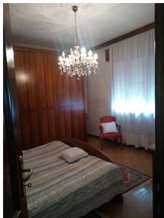
FOTO N. 9 Camera da letto