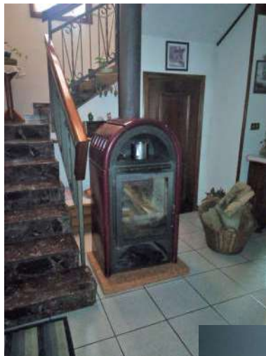
FOTO N. 5 Cucina