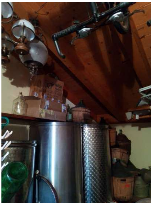
FOTO N. 22 cantina