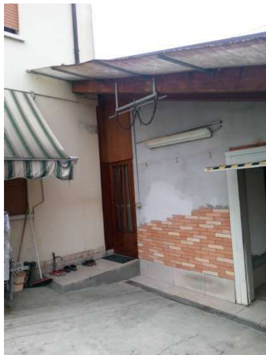
FOTO N. 20 Ingresso cantina