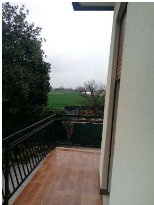
FOTO N. 13 Poggiolo