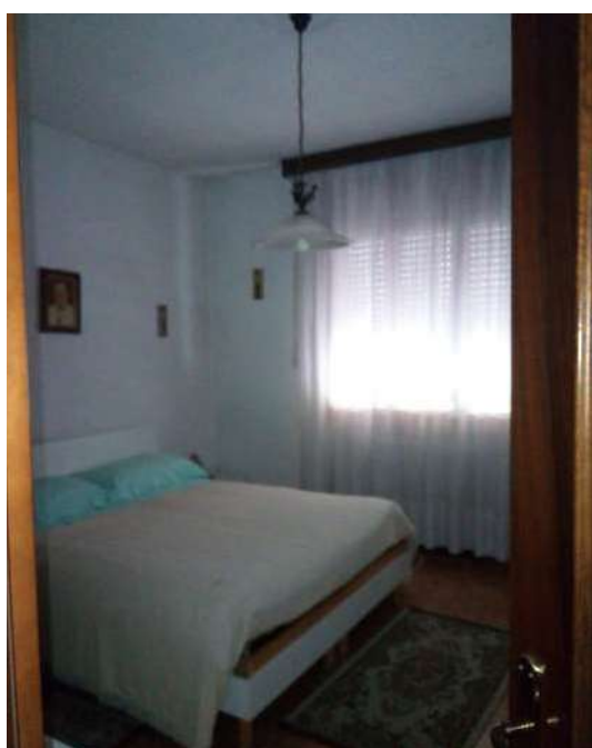
FOTO N. 10 Camera da letto