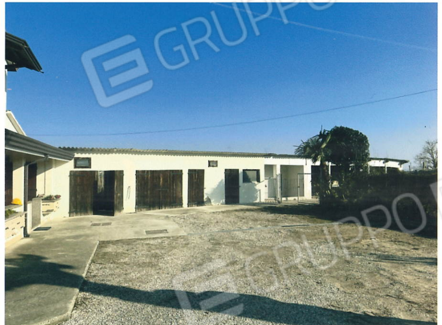
Cortile e vista sud edificio