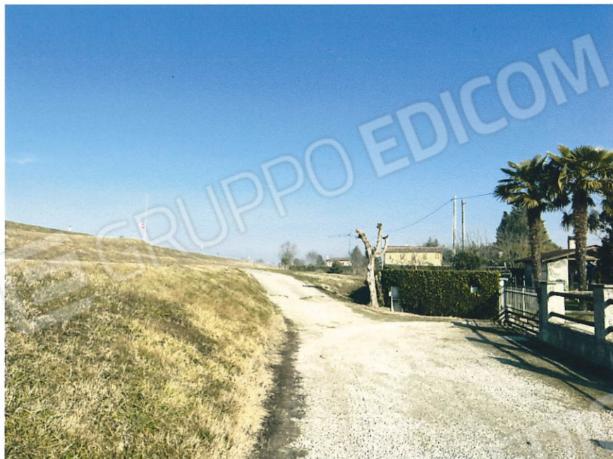
via Cavaizza - Codevigo