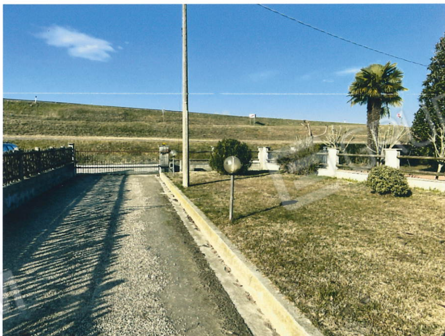
Lotto lato Ovest