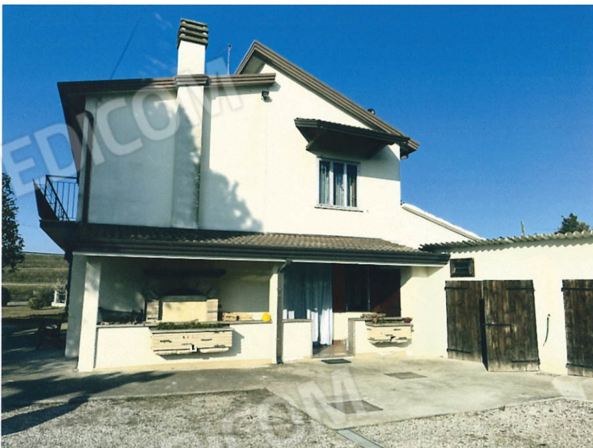
Fabbricato vista Est