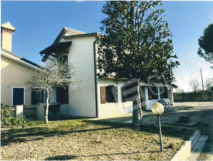
Fabbricato vista sud - ovest