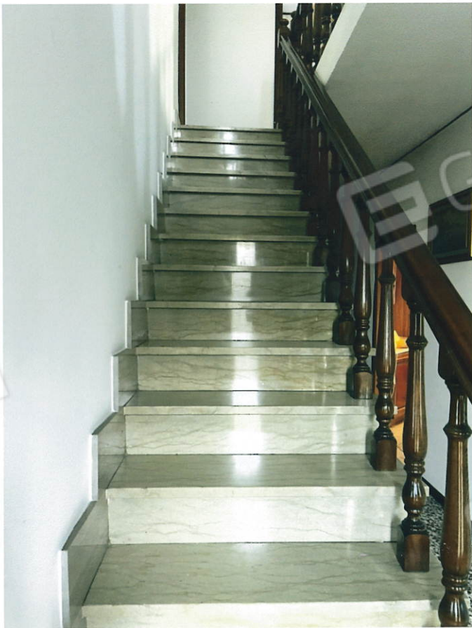
Scala al Piano Primo