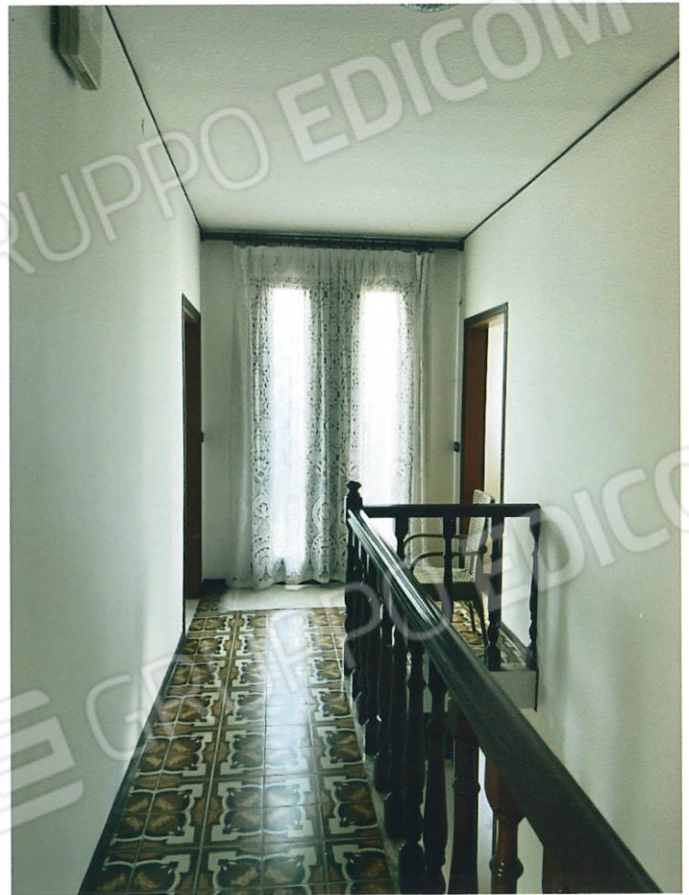
Disimpegno P. Primo