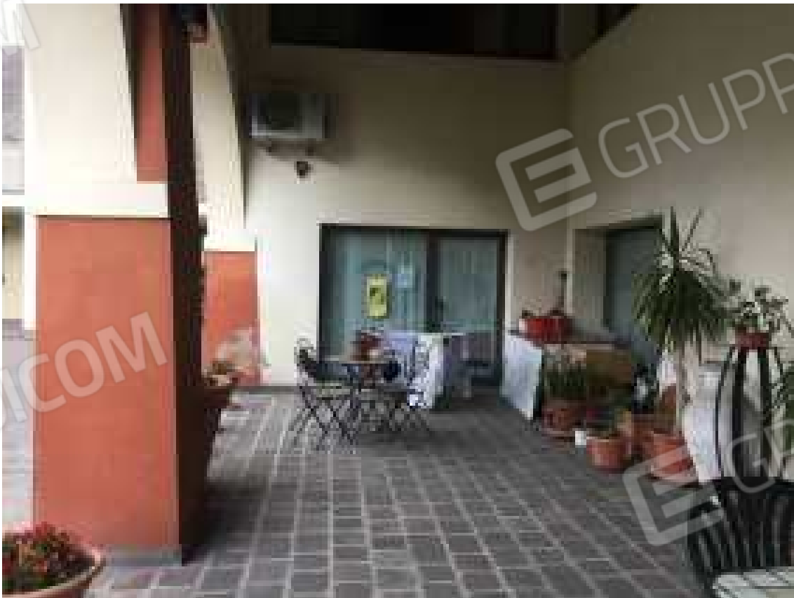
CONO VISIVO N. 10