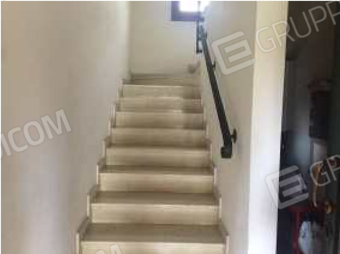
CONO VISIVO N. 30