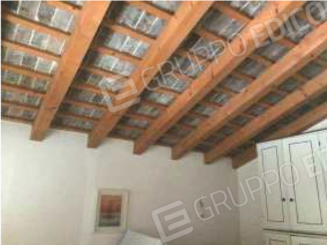
CONO VISIVO N. 37