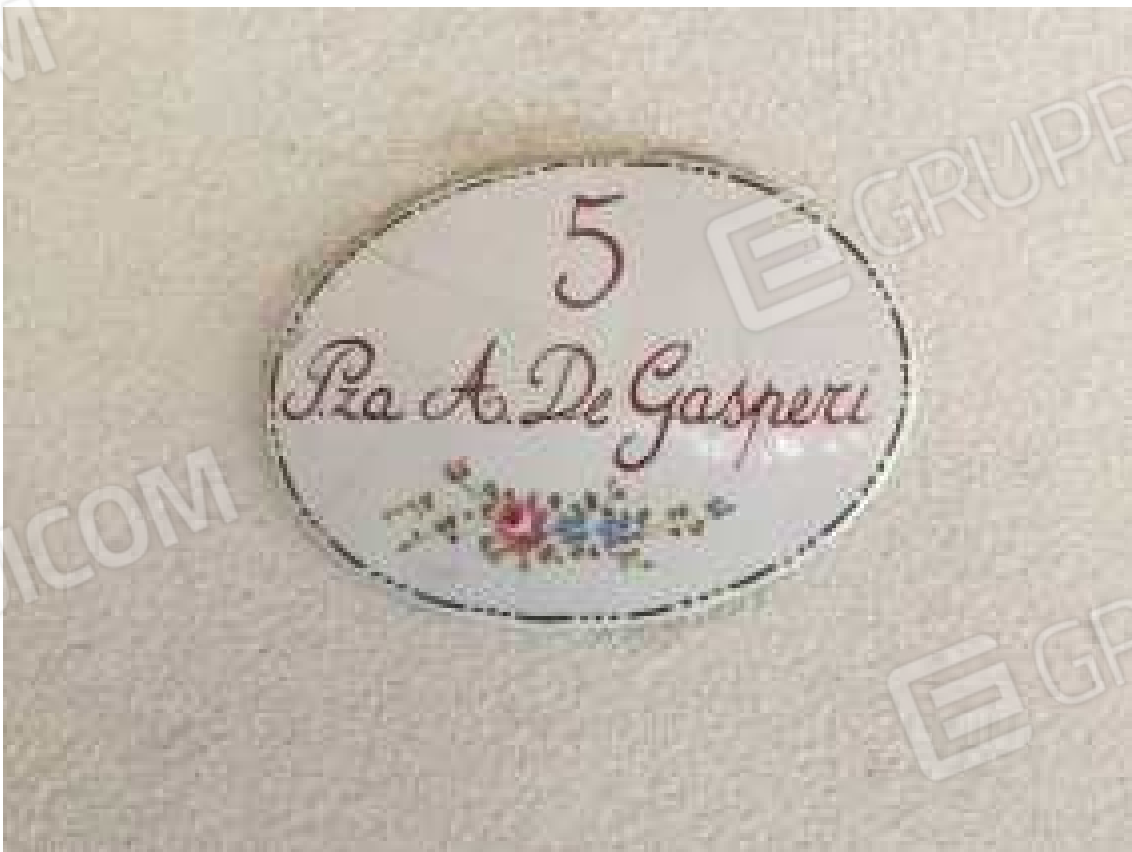
CONO VISIVO N. 14