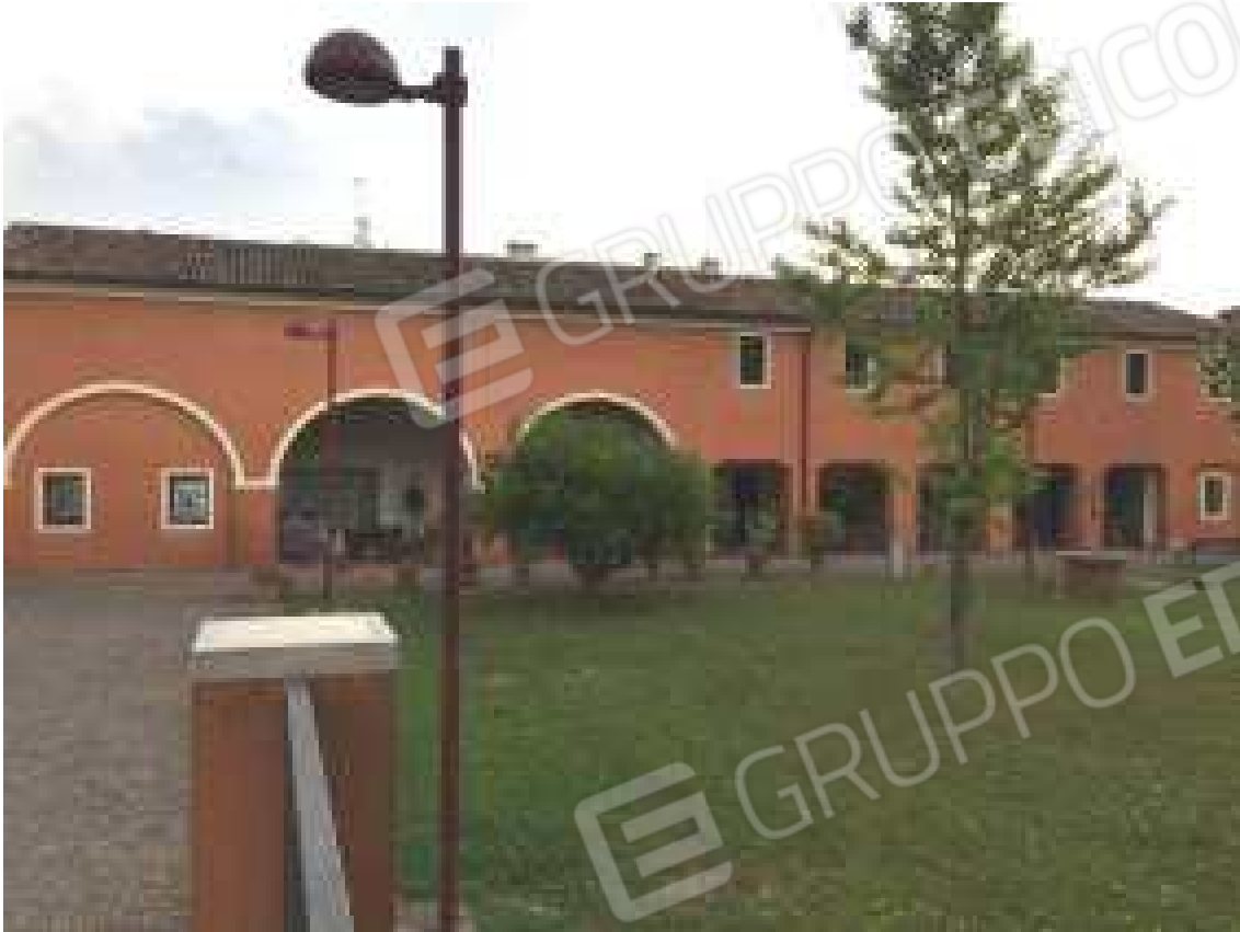
CONO VISIVO N. 03