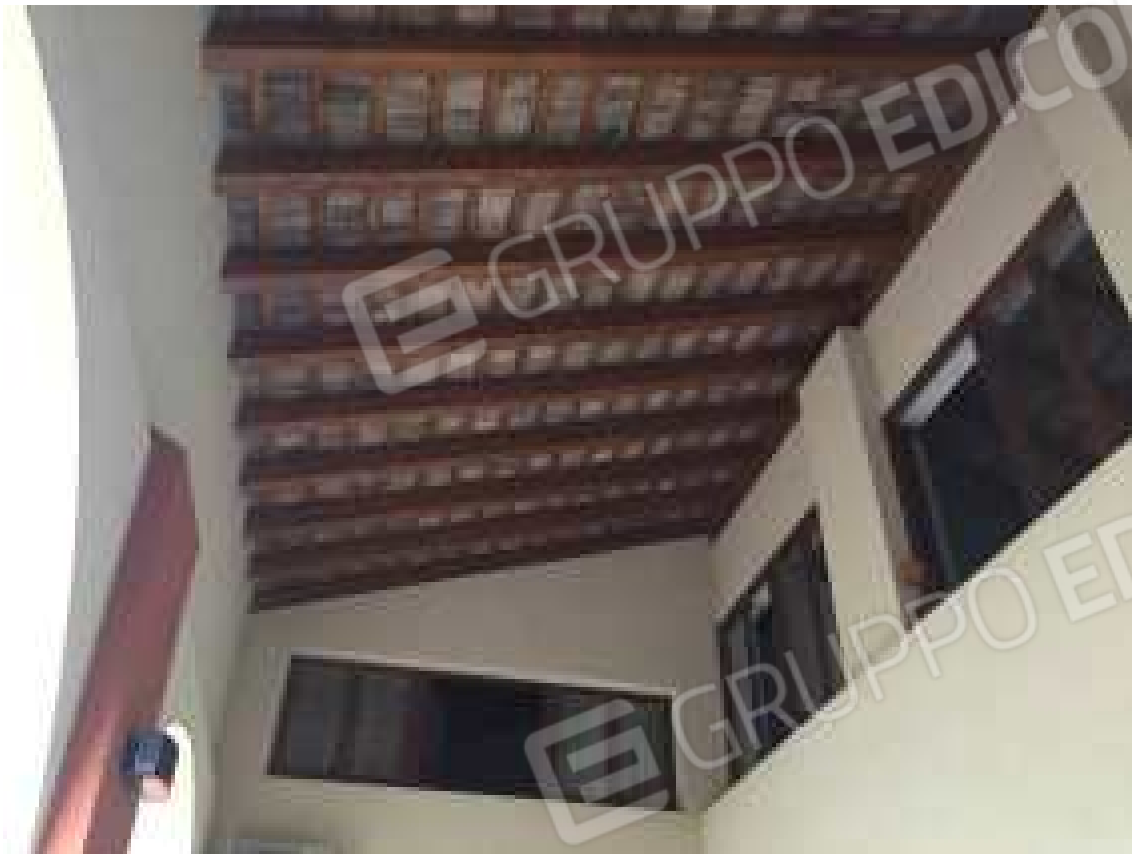
CONO VISIVO N. 11