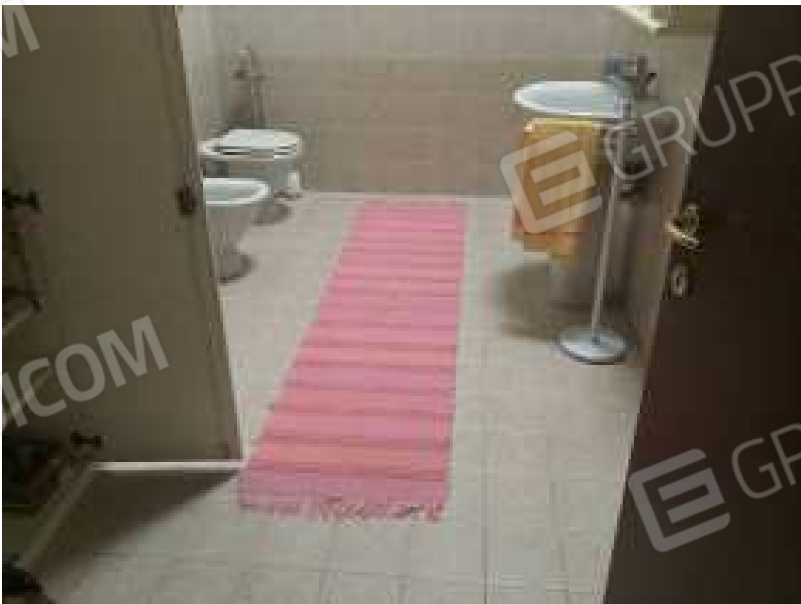
CONO VISIVO N. 36