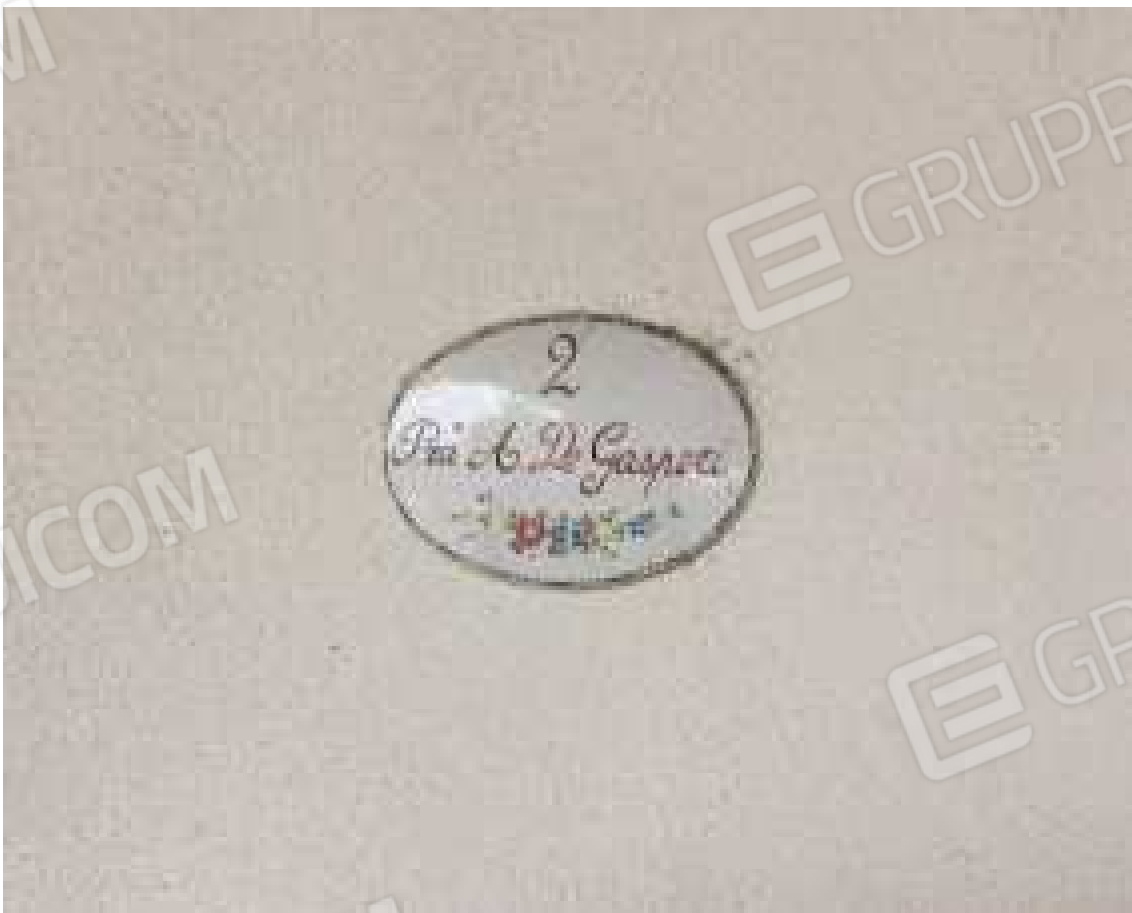
CONO VISIVO N. 22