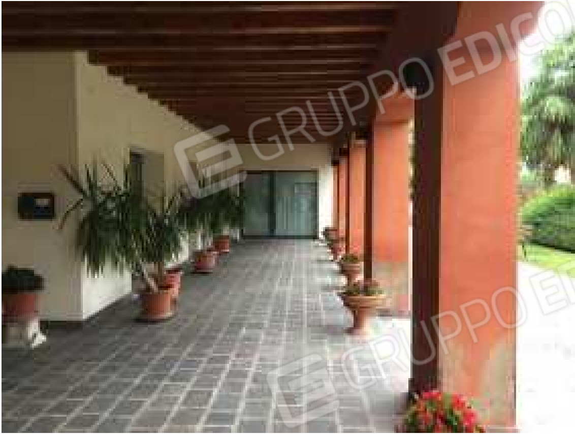
CONO VISIVO N. 09