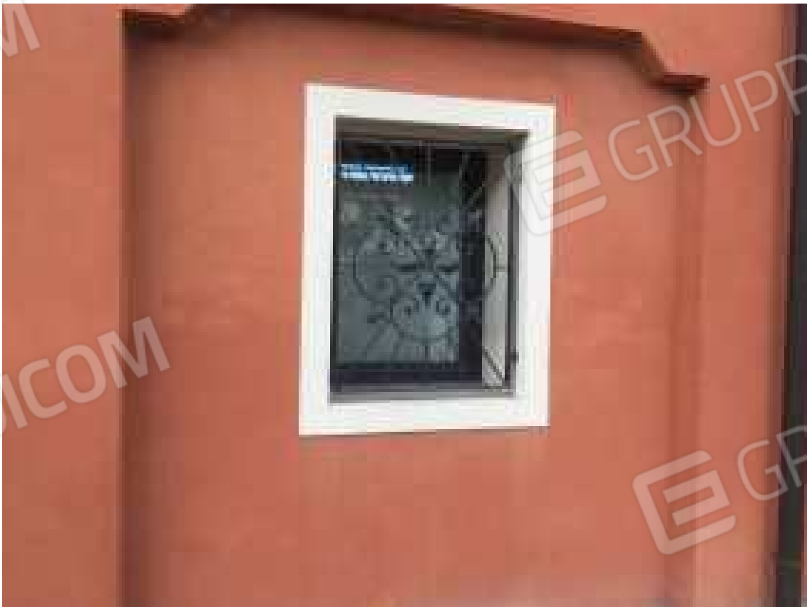
CONO VISIVO N. 18