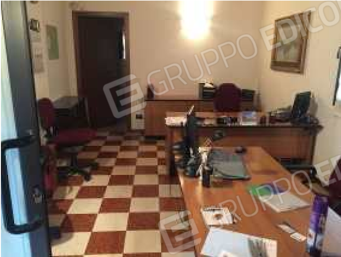
CONO VISIVO N. 15