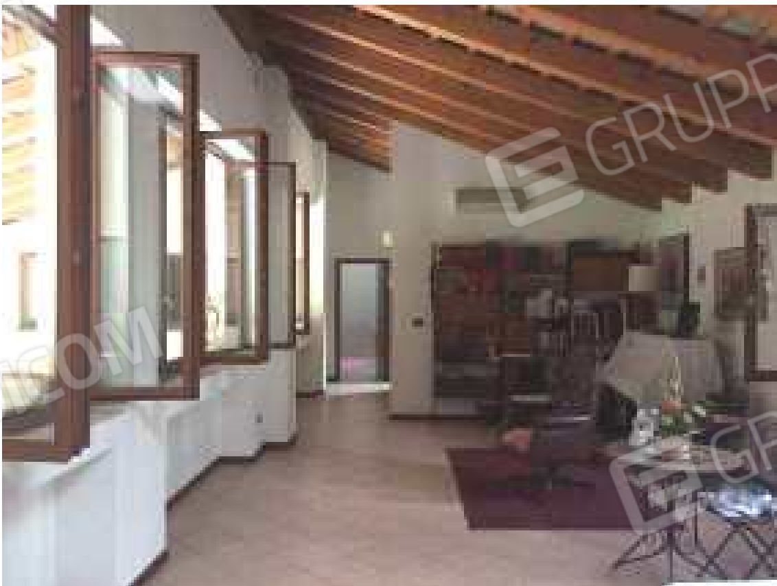
CONO VISIVO N. 32