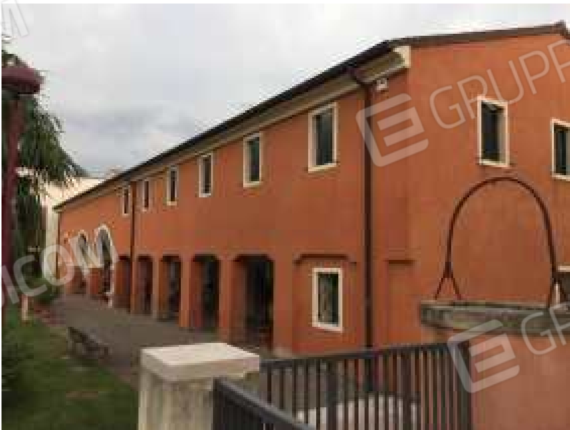
CONO VISIVO N. 08