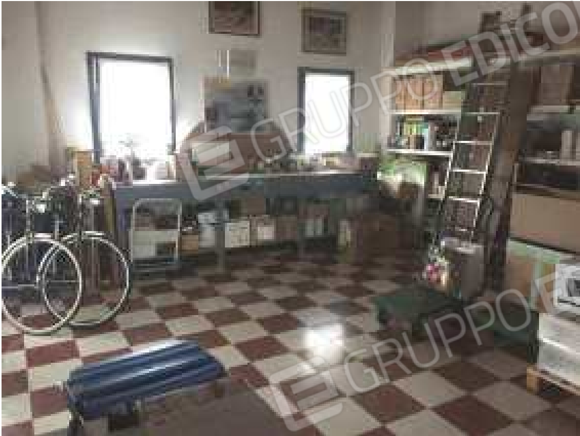
CONO VISIVO N. 27