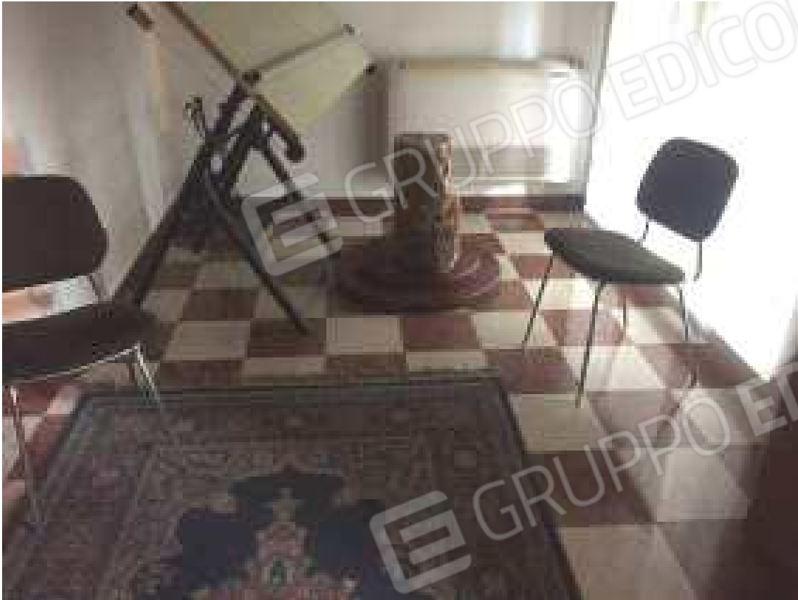
CONO VISIVO N. 21