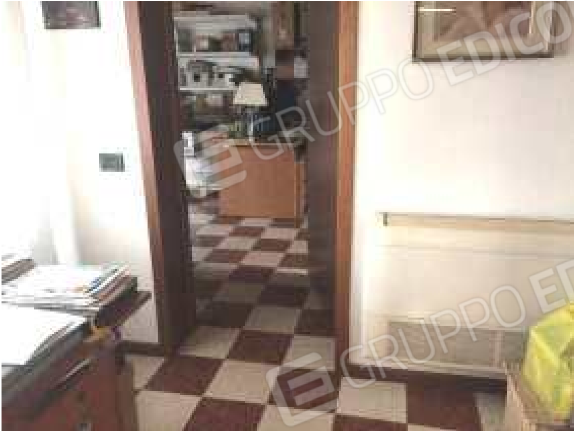
CONO VISIVO N. 25