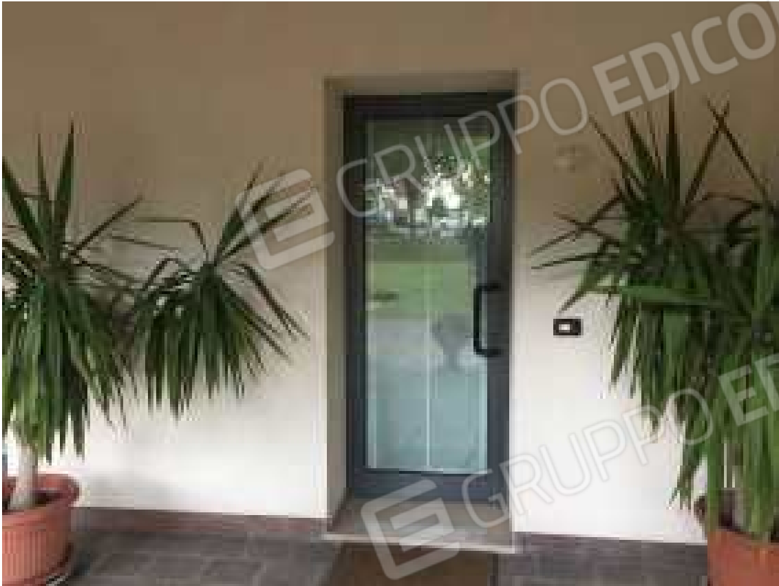
CONO VISIVO N. 13