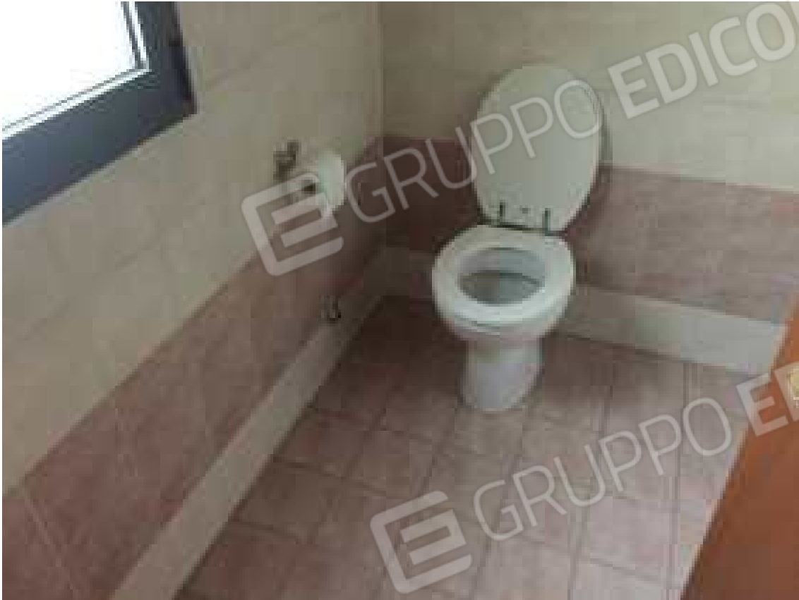
CONO VISIVO N. 17