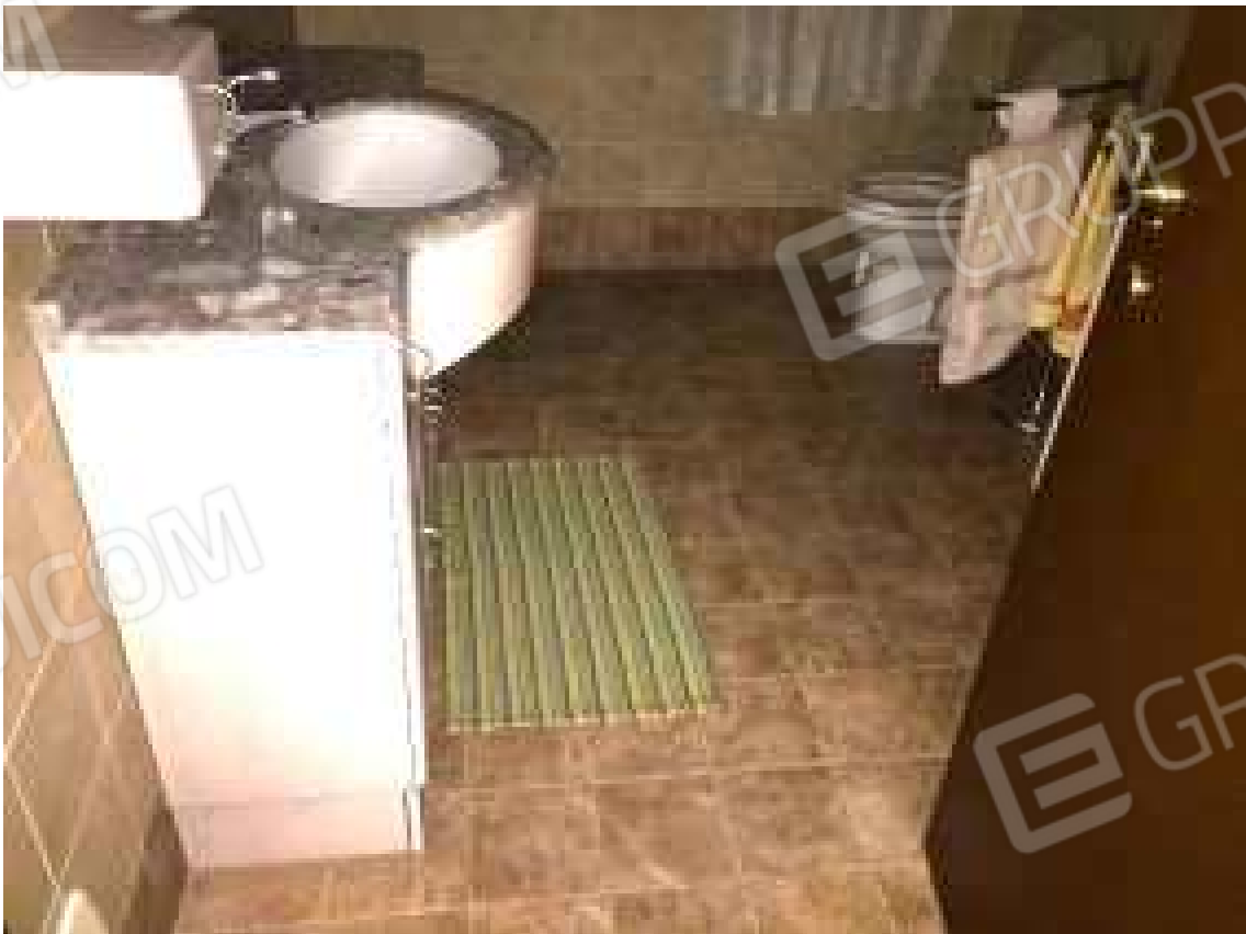
CONO VISIVO N. 34