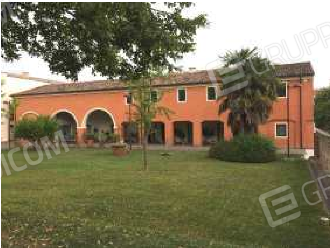
CONO VISIVO N. 02