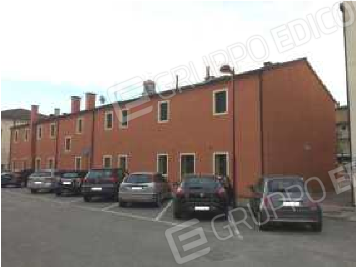
CONO VISIVO N. 05