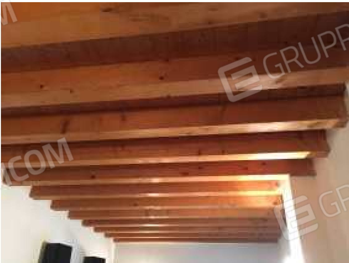
CONO VISIVO N. 16