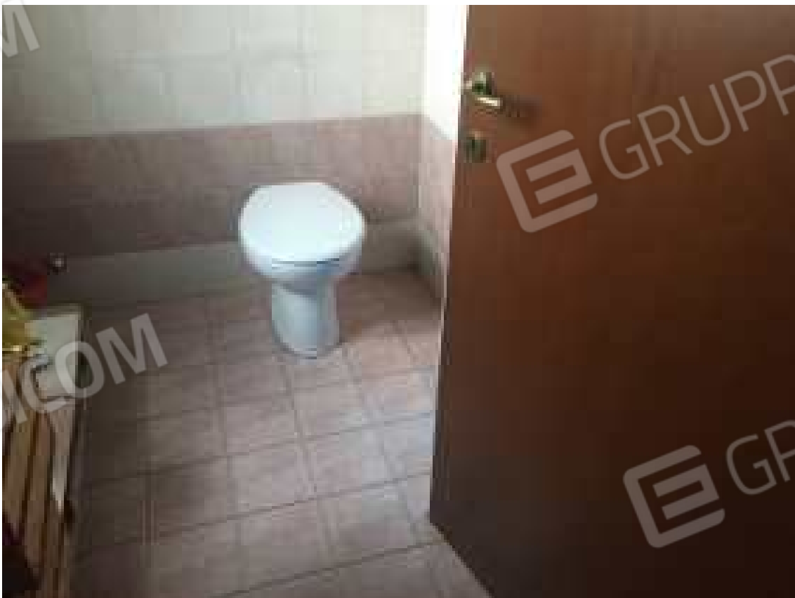
CONO VISIVO N. 28