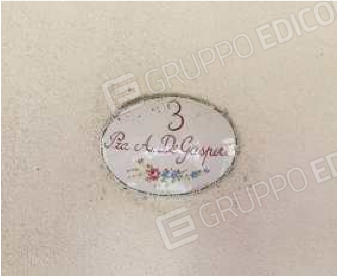
CONO VISIVO N. 29