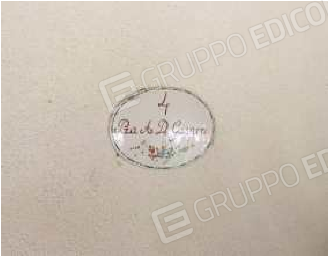
CONO VISIVO N. 19