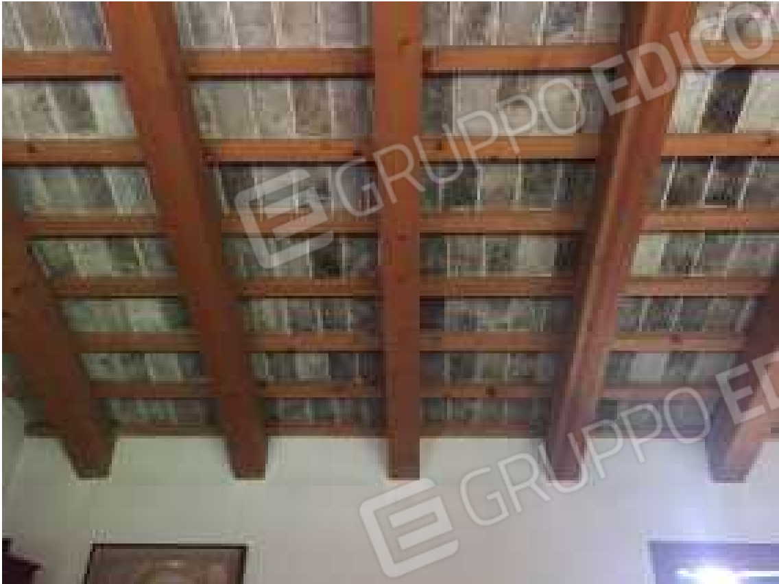
CONO VISIVO N. 33