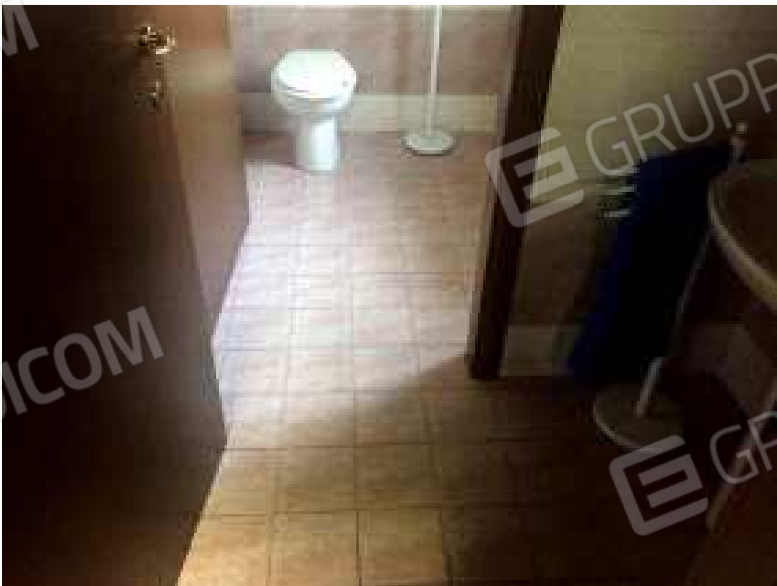
CONO VISIVO N. 24