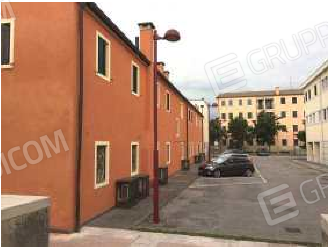
CONO VISIVO N. 06