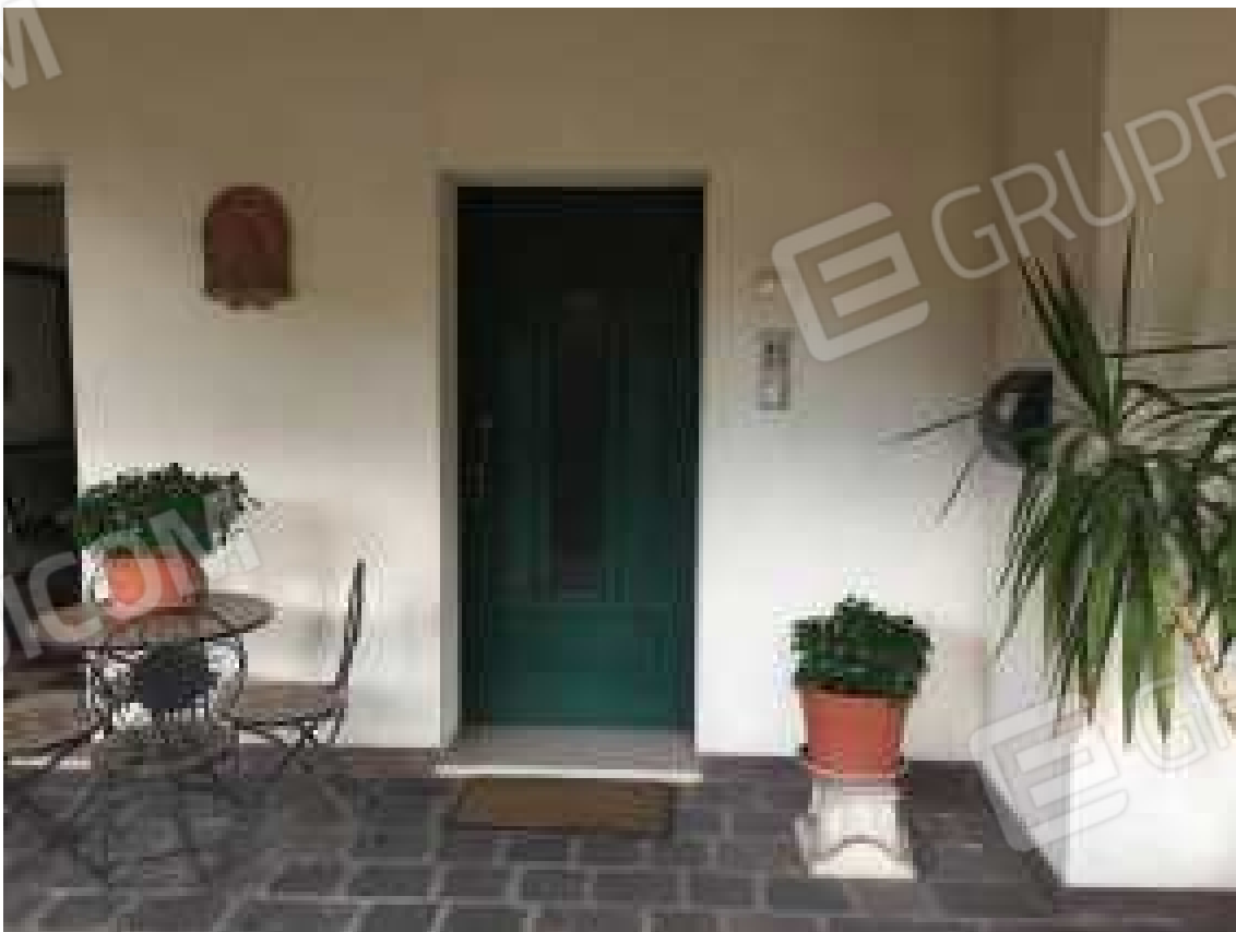
CONO VISIVO N. 12