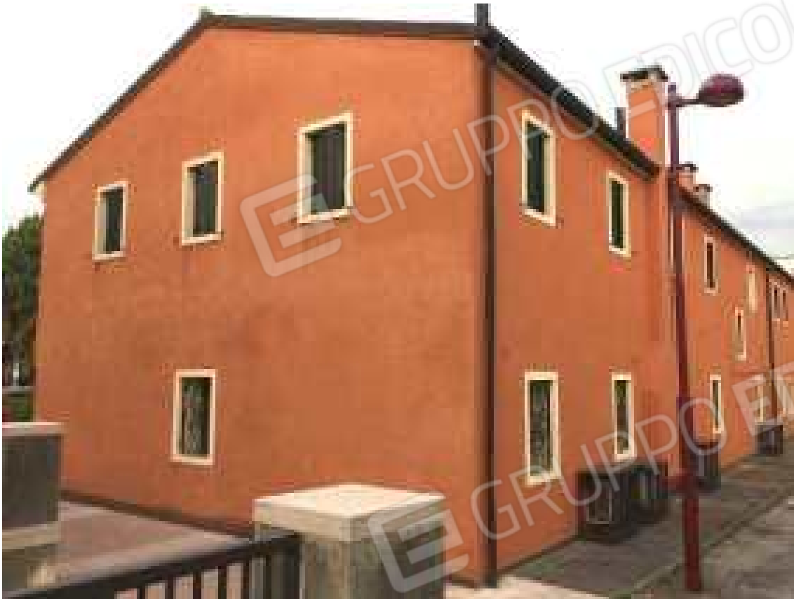
CONO VISIVO N. 07