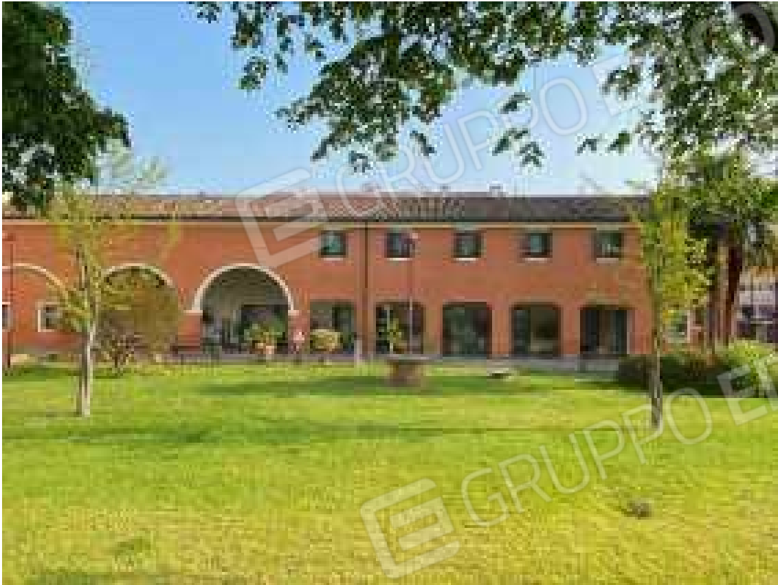
CONO VISIVO N. 01