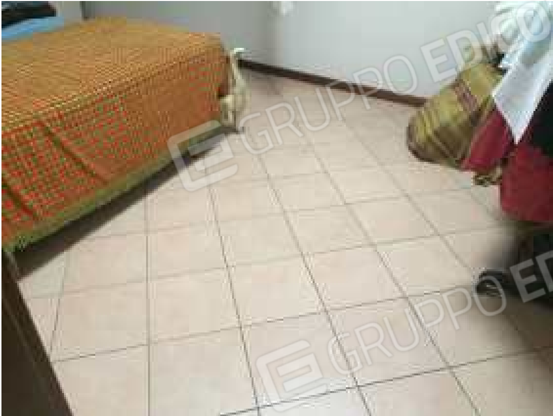
CONO VISIVO N. 35