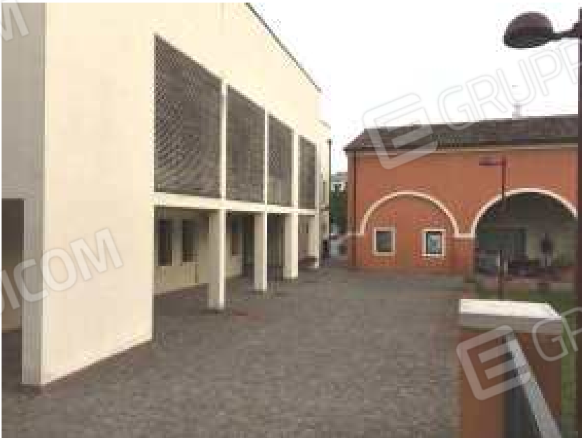
CONO VISIVO N. 04