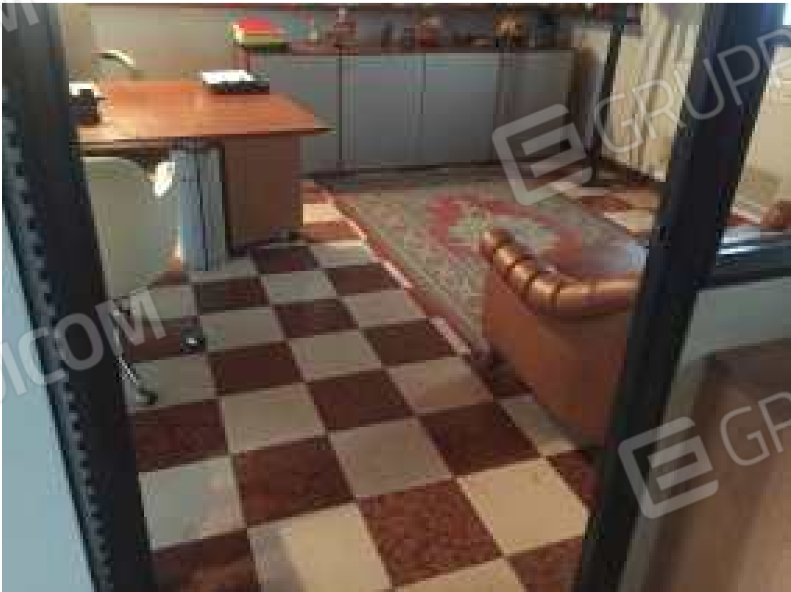
CONO VISIVO N. 20