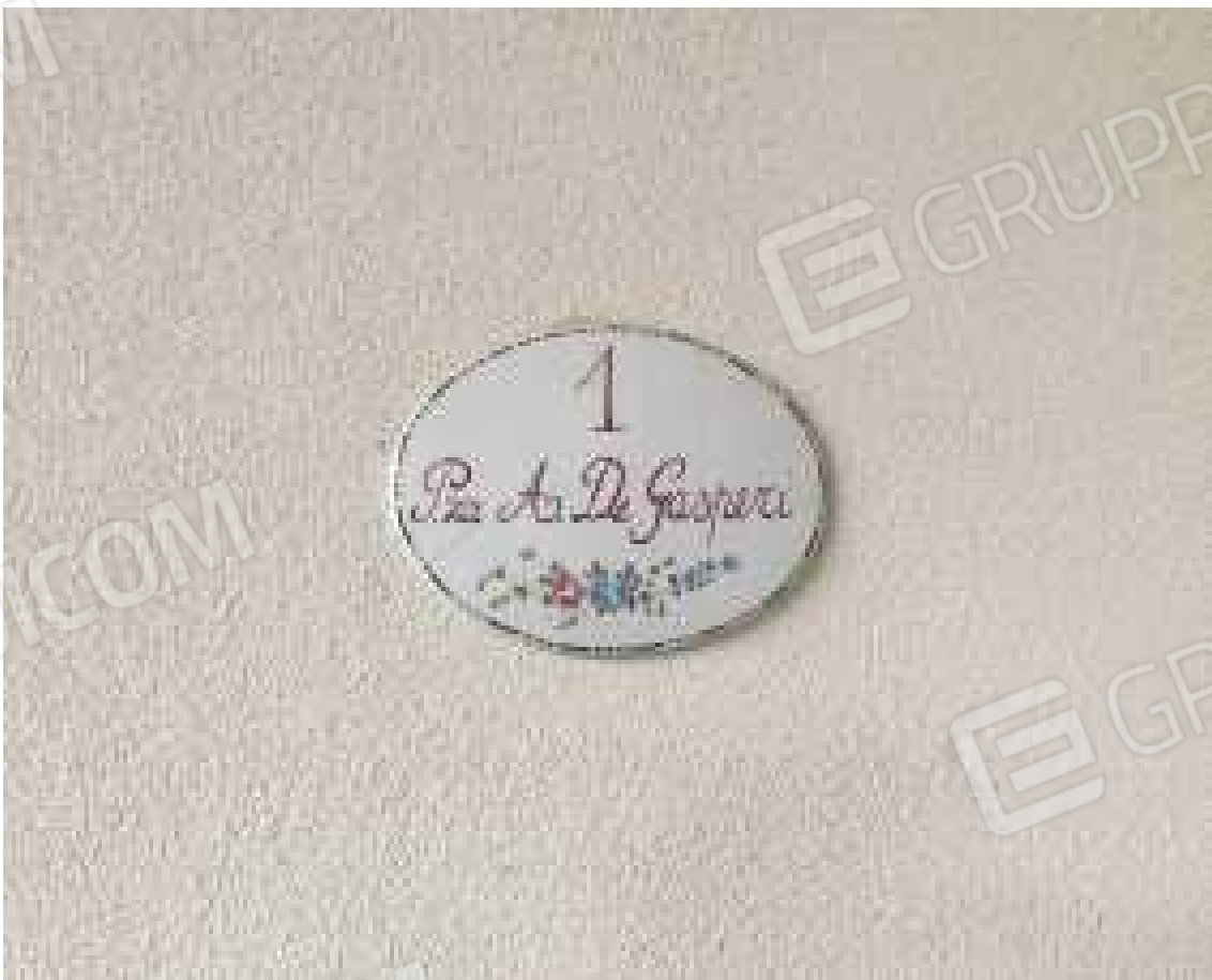
CONO VISIVO N. 26