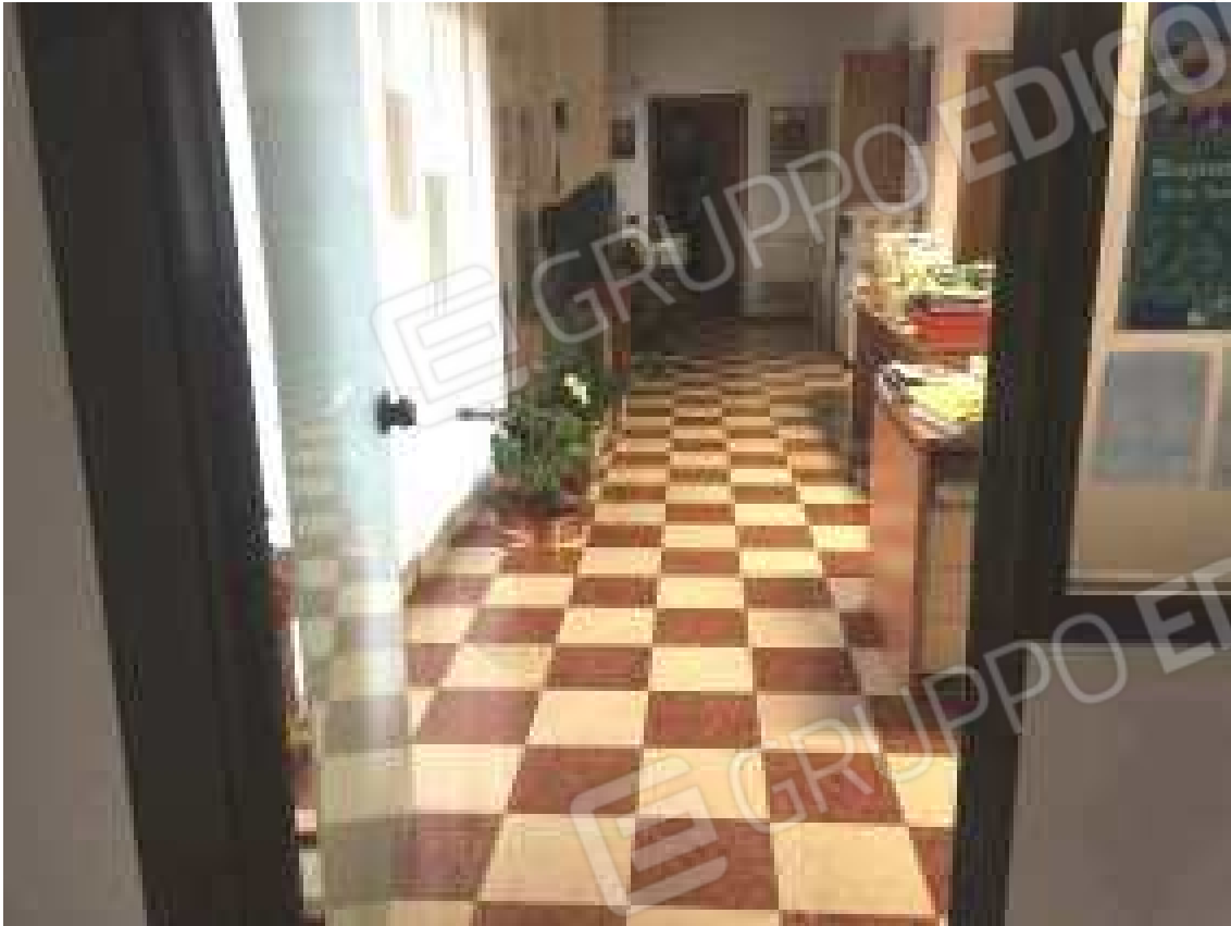
CONO VISIVO N. 23