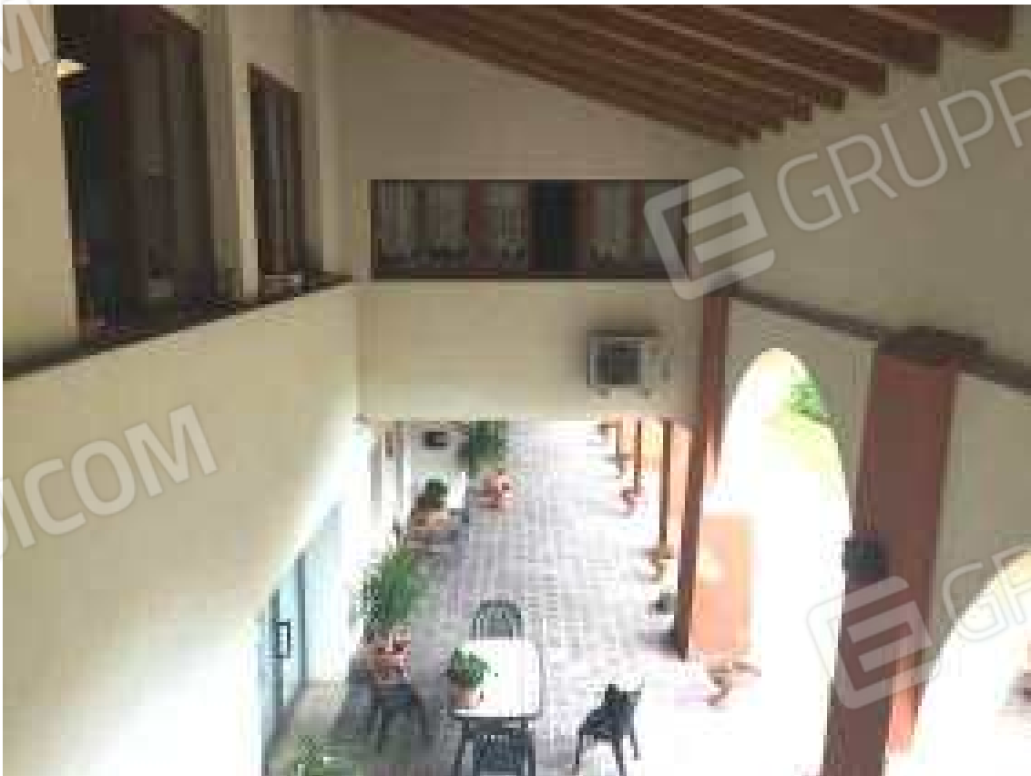
CONO VISIVO N. 38