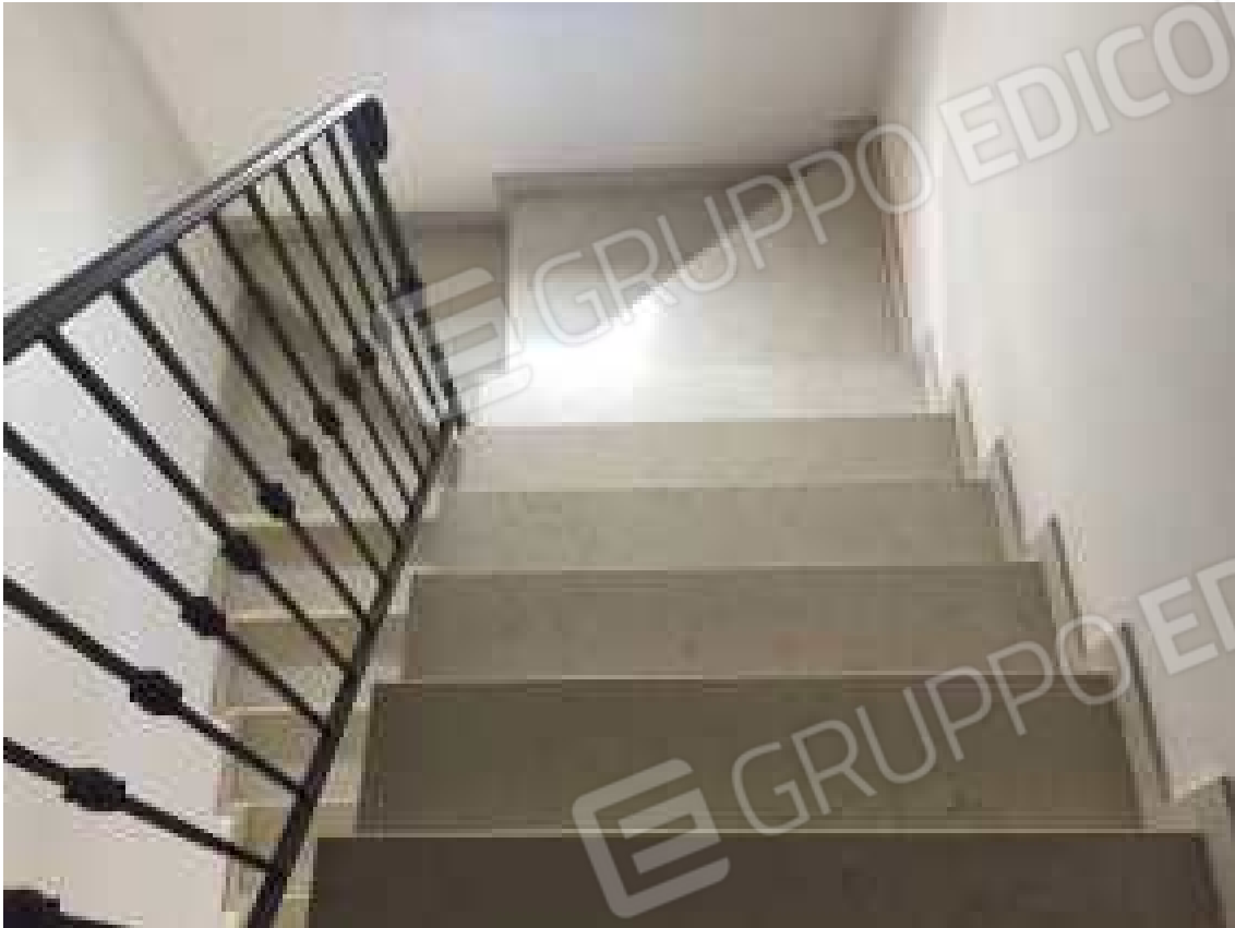
CONO VISIVO N. 31