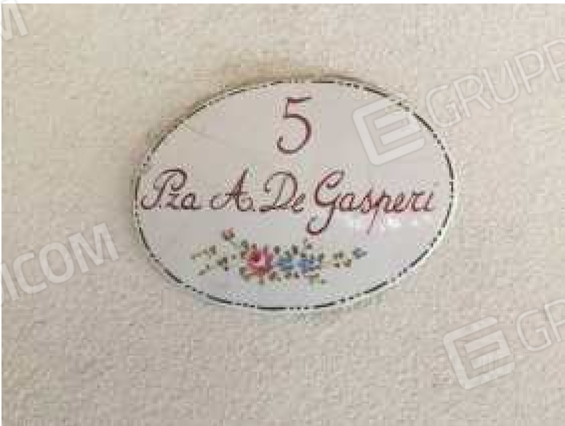
CONO VISIVO N. 14