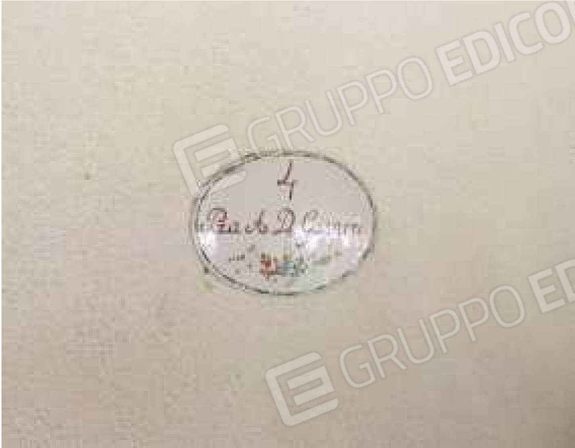
CONO VISIVO N. 19