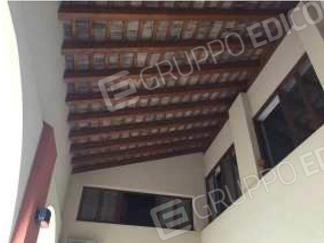
CONO VISIVO N. 11