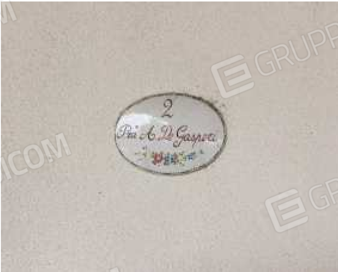
CONO VISIVO N. 22