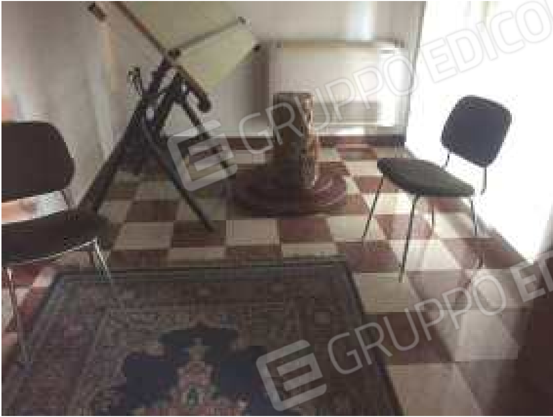
CONO VISIVO N. 21