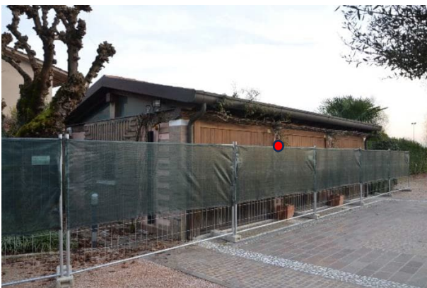
Edificio a garage porzione est in proprietà

Sul lato est della proprietà, lungo il confine, è indicata catastalmente e presente sul posto una porzione di edificio (sub 4) della quale non si è trovata traccia di autorizzazione edilizia, l'edificio risulta in gran parte realizzato su altra proprietà, non è stato possibile visionarlo internamente in quanto transennato.