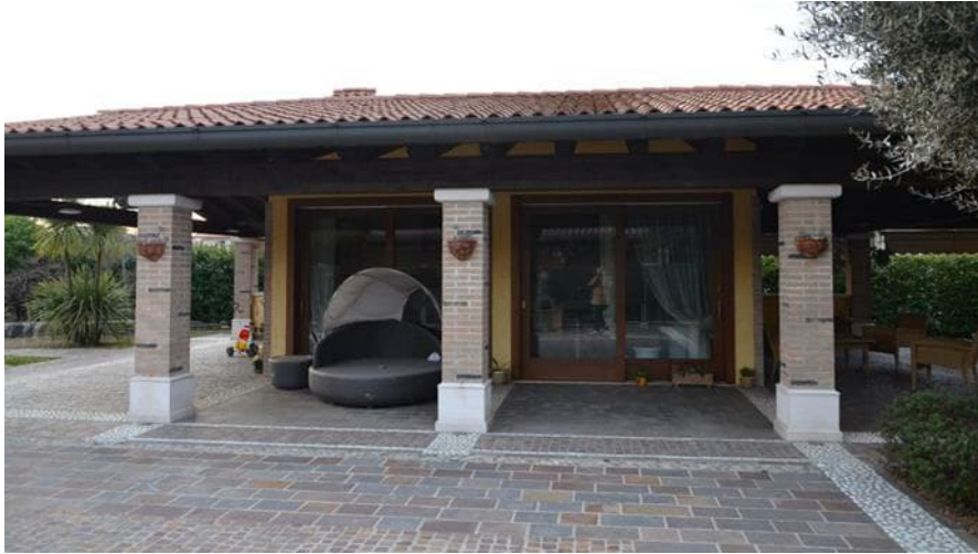
Lato est edificio autorizzato a garage sub 3 collegato con il pergolato all'abitazione

perimetrale in laterizio intonacato e tinteggiato, travi in legno a vista, pilatri quadrati dimensioni 38 cm x 38 cm con finitura in mattoni in laterizio con faccia a vista, nel prospetto ovest sono presenti tre finestre protette da oscuri in legno. Si tratta di un edificio autorizzato a garage ma utilizzato a dependance con bagno, e predisposizione per cucina esterna lato sud, l'altezza autorizzata è pari a ml 2.50.