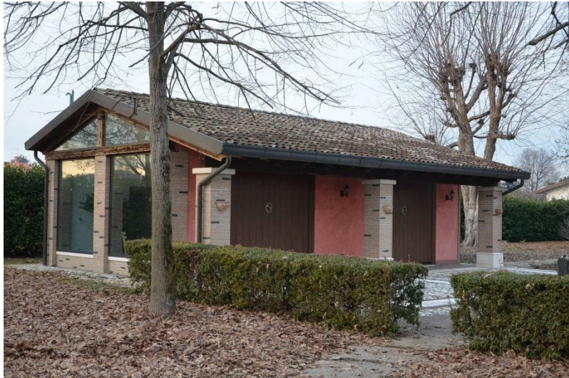
Edificio catastalmente identificato come disbrigo e individuato nella scheda con il sub 2

Si tratta di un edificio non visionato internamente, con tipologia simile al precedente immobile descritto e individuato con il sub 3, a un piano fuori terra con pianta rettangolare con dimensioni esterne di ml 5.80 x ml. 10.80 circa, tetto a due falde con copertura in coppi e lattonerie in rame, porticato sul fronte est con profondità di circa 140 cm, il portico è costituito da tre pilastri con dimensione 50 cm x 50 cm con finitura in mattoni pieni in laterizio con faccia a vista, le travature del tetto sono a vista dal portico. Altezza misurata in corrispondenza del colmo, sotto trave ml 3.97 e in corrispondenza dell'angolo sud est ml 3.04 (sotto al portico).