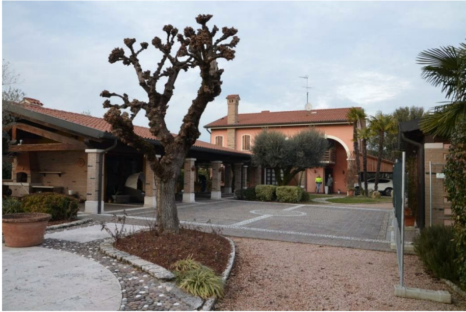
Vista da sud di parte del compendio immobiliare con aree esterne pavimentate

L'area esterna è in parte pavimentata con lastre di trachite, cubetti di porfido, ciottoli di fiume che formano disegni geometrici, camminamenti e spazi pertinenziali all'edificio: lato est del garage, lato sud del garage con piazzetta pavimentata e camminamenti, fascia di collegamento tra abitazione e garage nella zona corrispondente al ex pergolato ora portico.