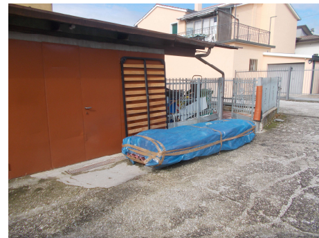
foto della tettoia sul retro - lastre in eternit

Lo scrivente ha contattato una delle maggiori ditte operanti in provincia di Padova nel campo delle bonifiche di coperture industriali, facendo richiesta di preventivo per il tipo di intervento richiesto. Il sig. _____, dell'impresa 2C COPERTURE INDUSTRIALI, preso atto della natura dei