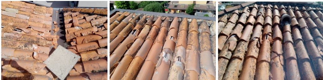
foto del tetto- danni al rivestimento in coppi

Lo scrivente non ha potuto accedere al piano delle coperture, poiché non è presente un accesso dall'interno dell'abitazione. Il sig. _____ ornisce tuttavia alcune immagini del tetto raccolte, dall'impresa intervenuta, durante il sopralluogo a seguito dei danni provocati dalle grandinate dell'agosto 2024.