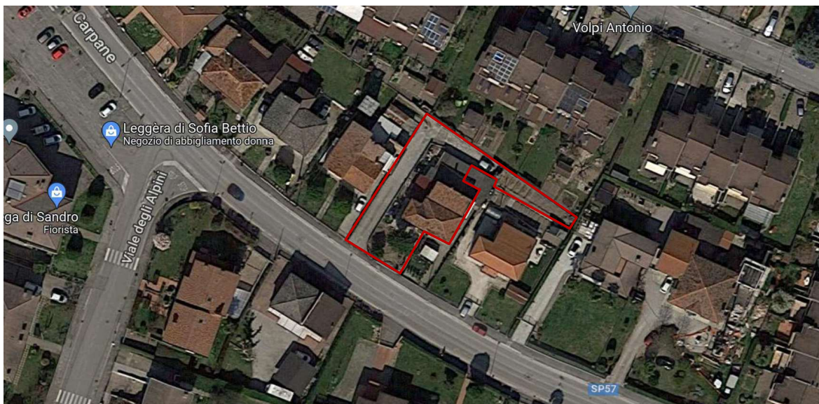
Via Carpane– 15 Vigonza (PD)-

I collegamenti con le principali arterie di traffico comunale e la rete dei trasporti pubblici appaiono mediocri.