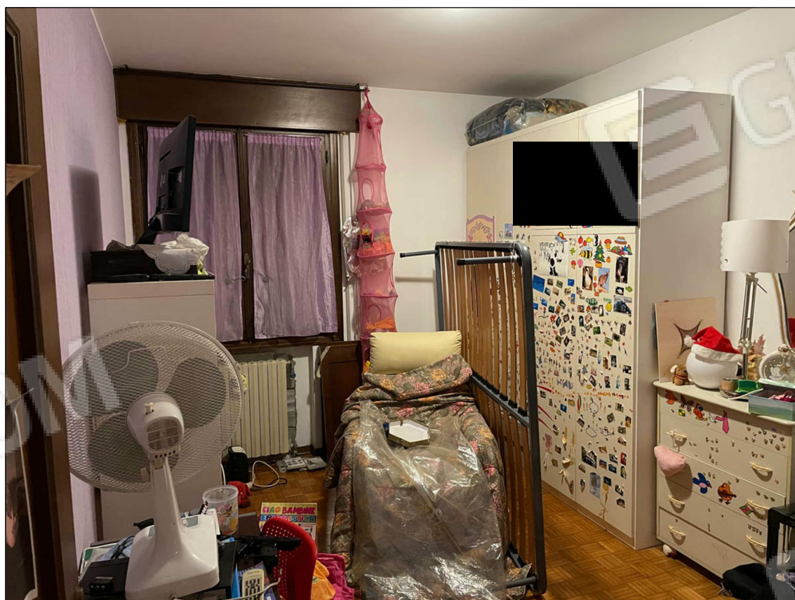
7 - Camera