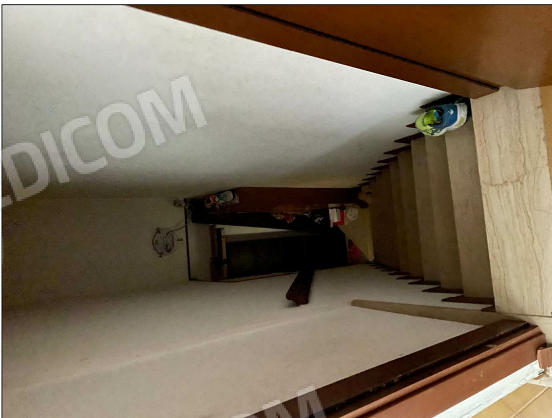
10 - Vano scala interno