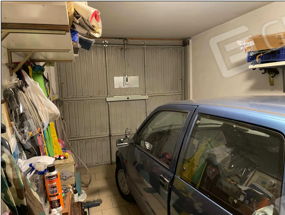
13 - Garage