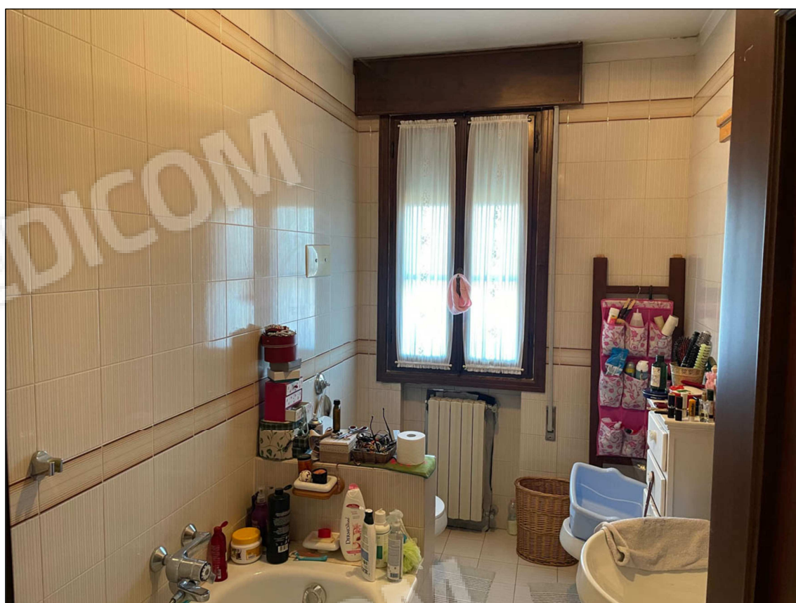
8 - Bagno