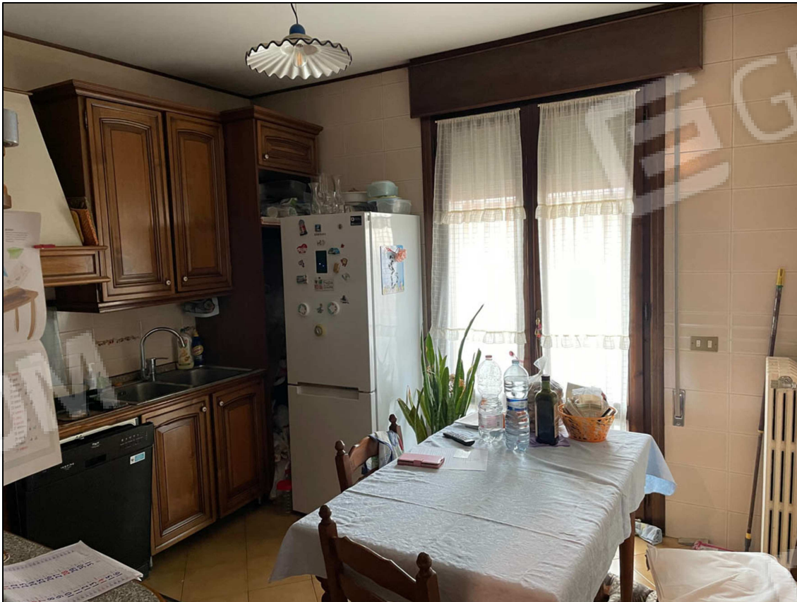
3 - Cucina