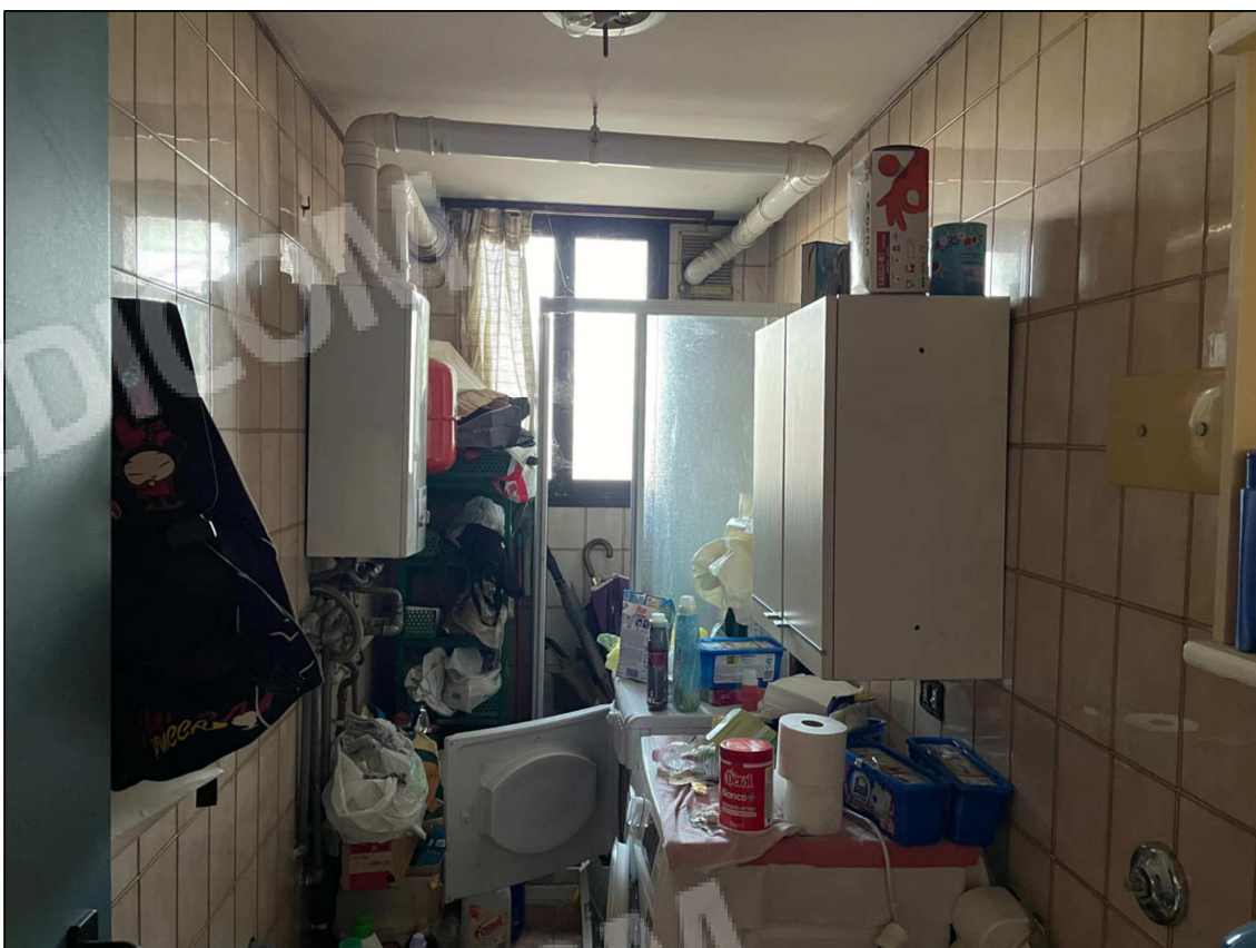
12 - Bagno piano terra