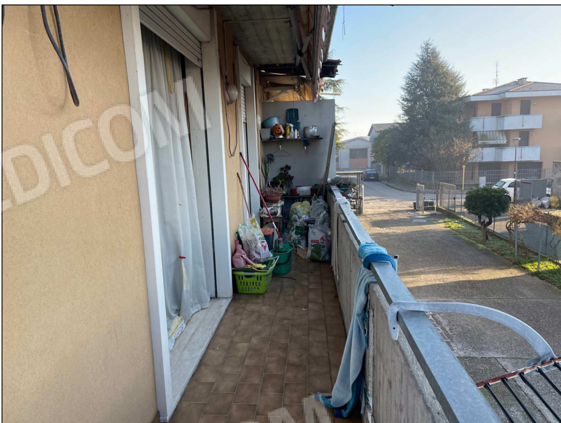
4 - Poggiolo