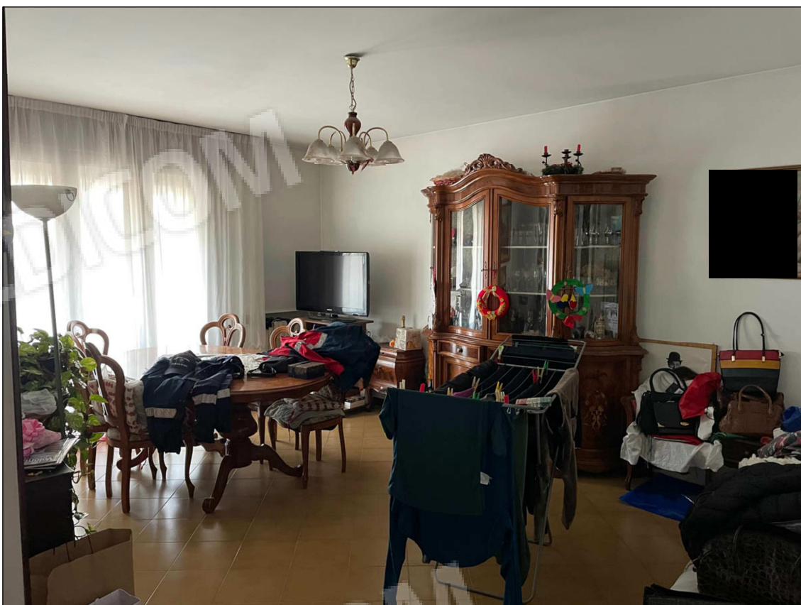
2 - Soggiorno