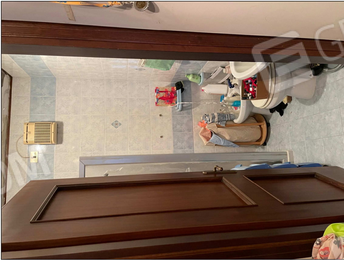
9 - Bagno