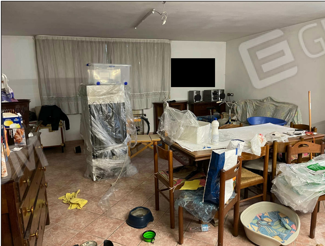
11 - Cantina