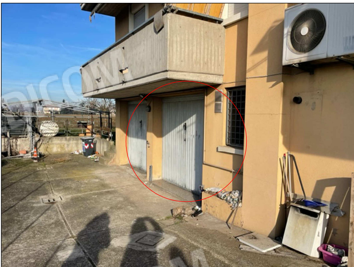
14 - Garage visto dall'esterno