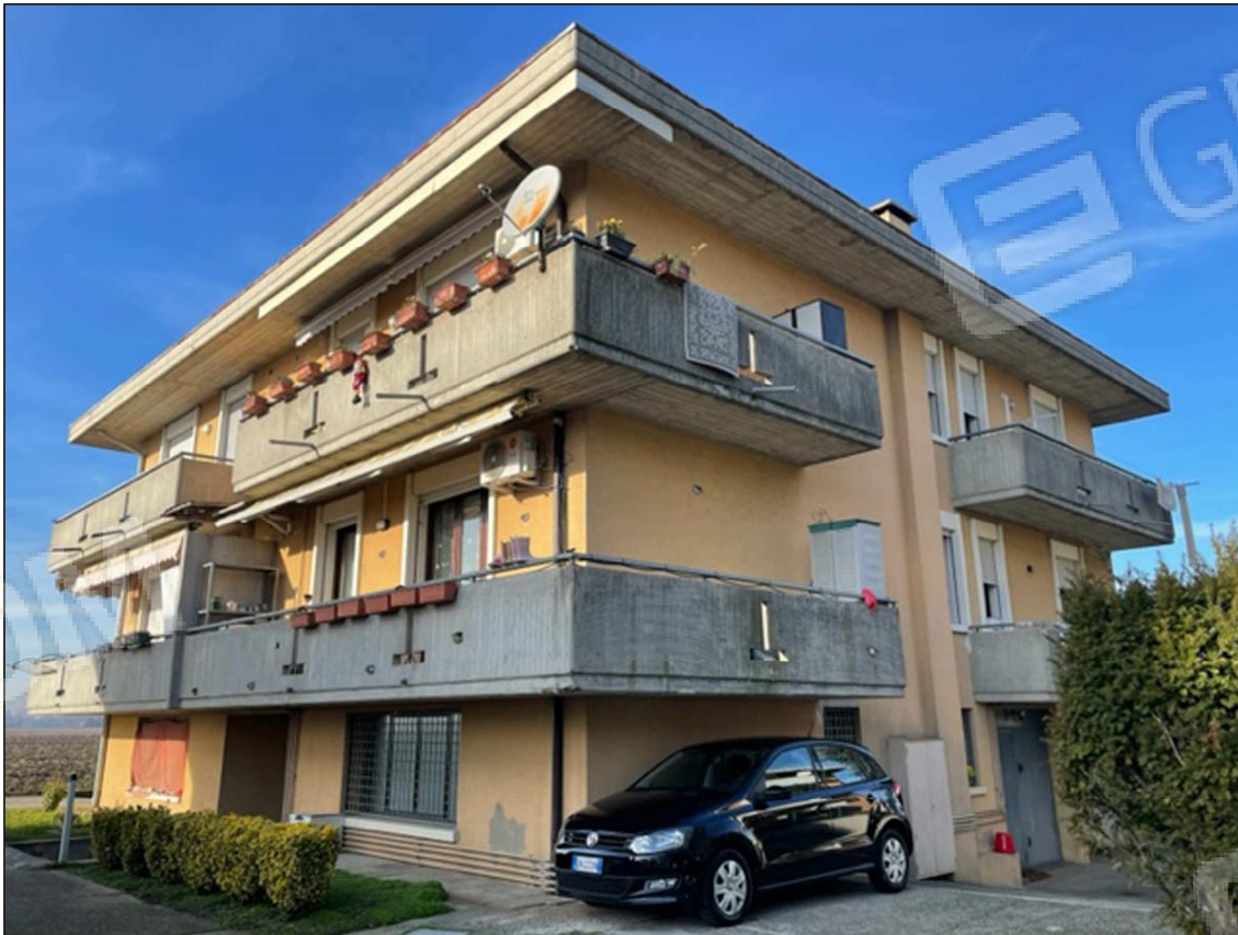
1 - Vista del condominio da via San Francesco