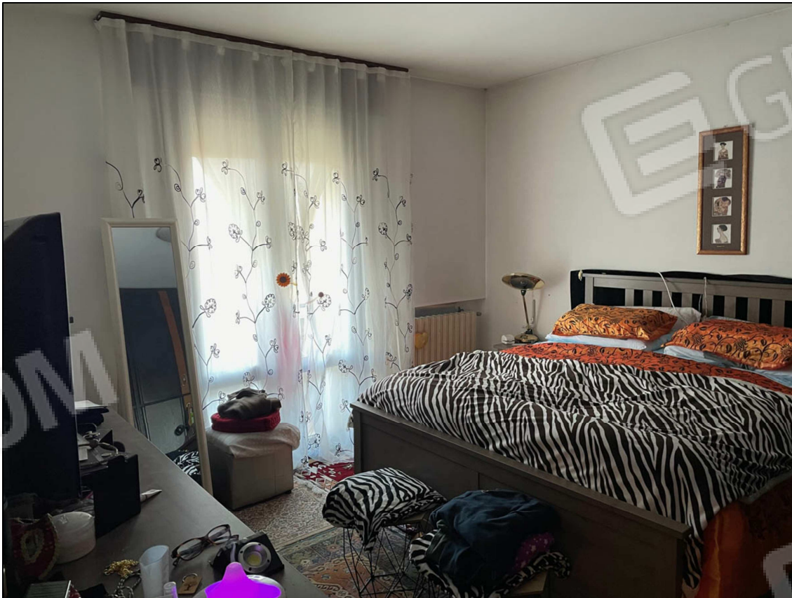
5 - Camera