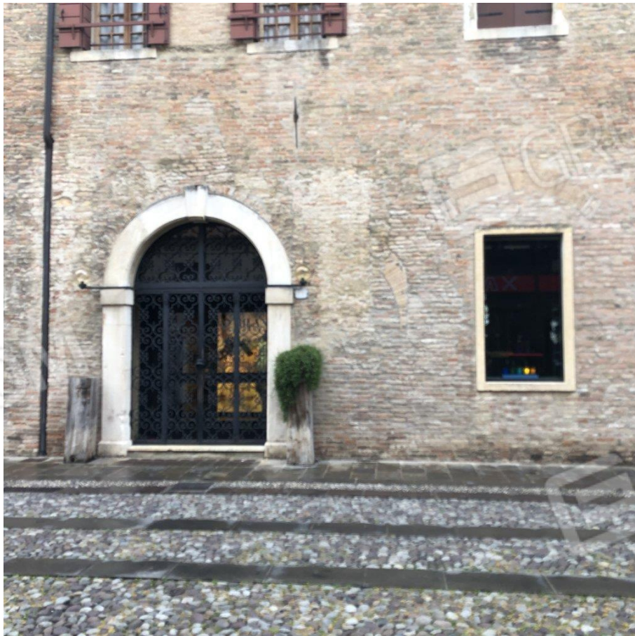
foto n. 4 – particolare facciata nord con accesso al negozio (la finestra è di altra u.i.)