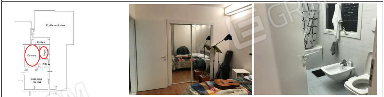
Foto 4-5 PT: camera e bagno

Foto 2-3 PT: soggiorno con angolo cottura