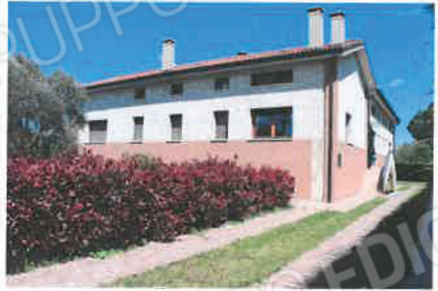
2 –Prospetto principale e laterale con scala accesso al P1