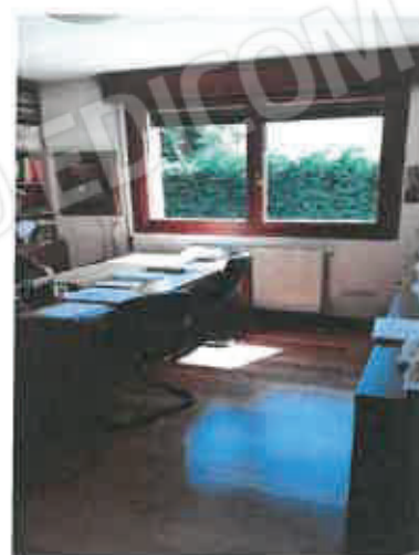
8 – Camera