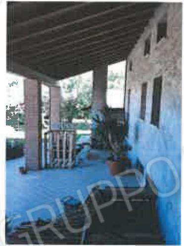
4 – Portico comune alle due abitazioni