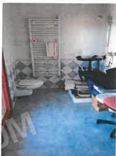
9 – Camera