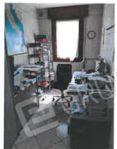
6 – Cucina