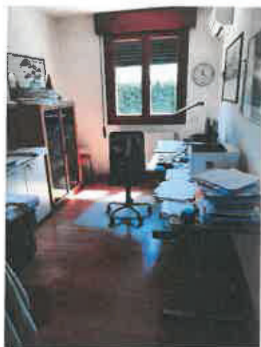
7 – Camera