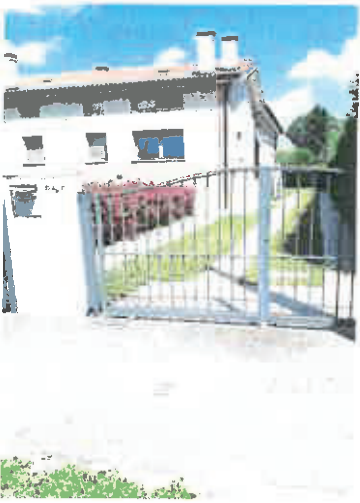
1 – Ingresso via Petrarca 55/c