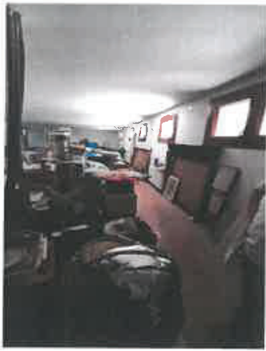
13 – Magazzino