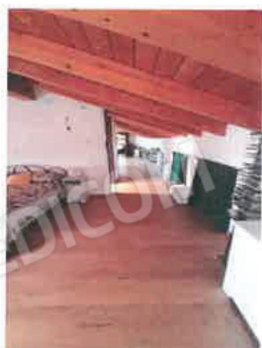
11 – Sottotetto