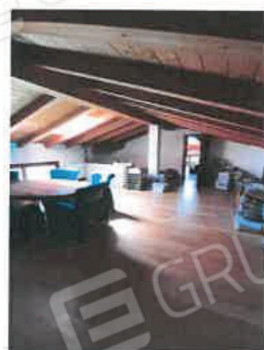
12 – Sottotetto