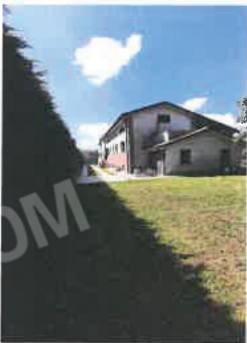
3 –Prospetto posteriore verso il giardino