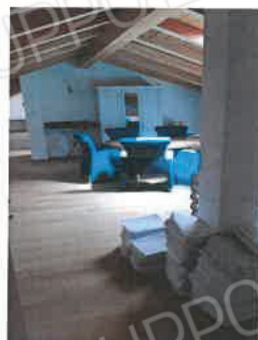
10 – Sottotetto