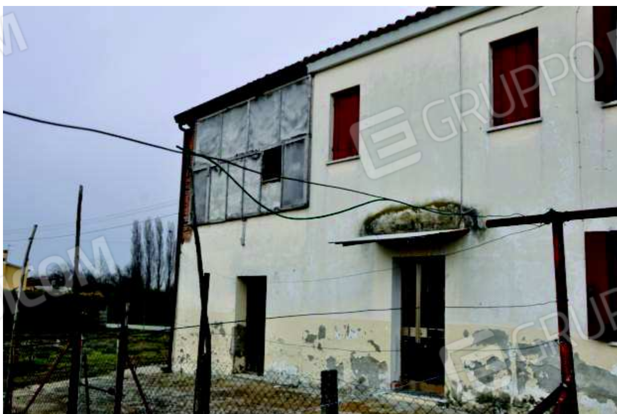
10 Porzione di piano primo, attualmente al grezzo.