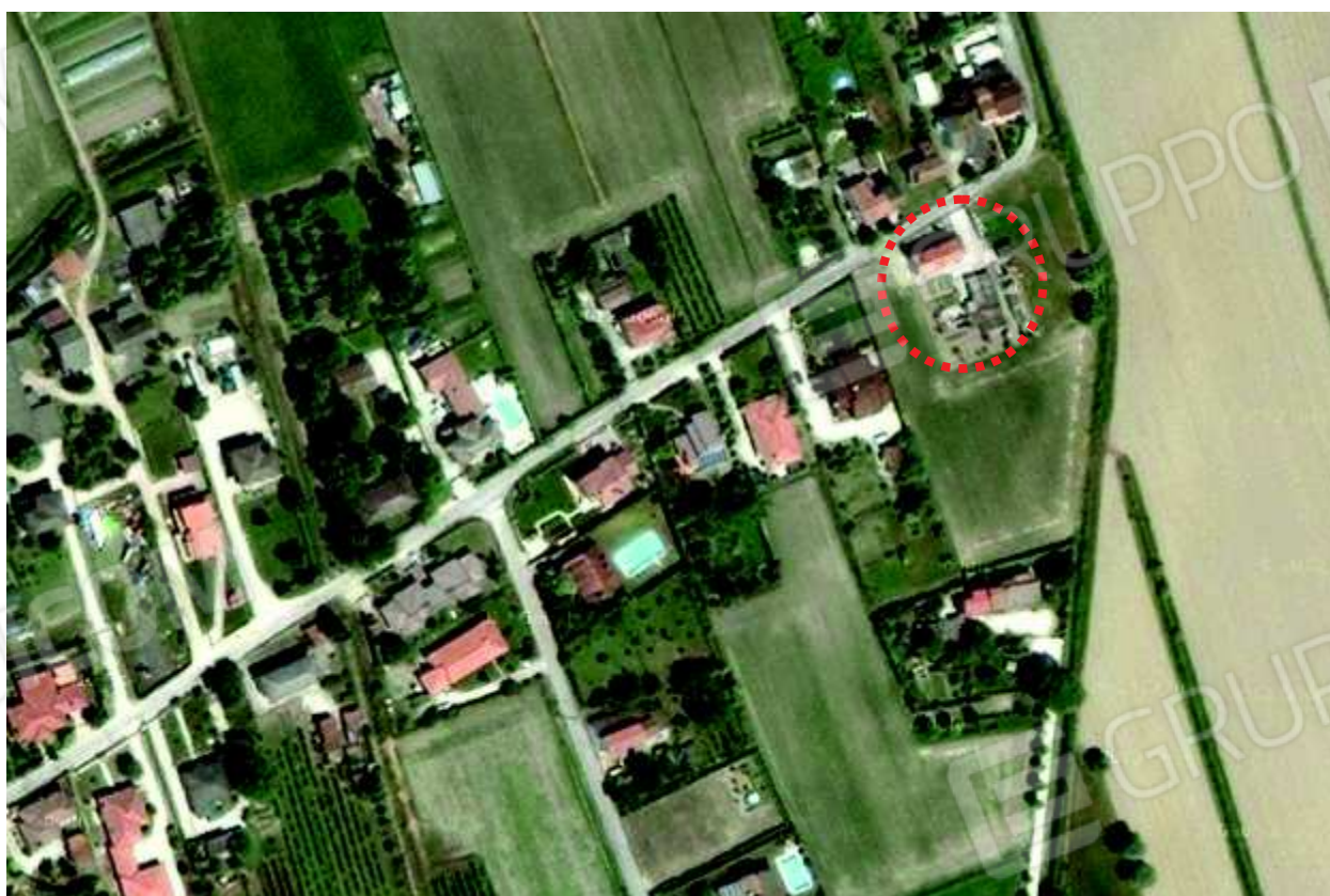
2. Immobile che comprende l'abitazione pignorata.