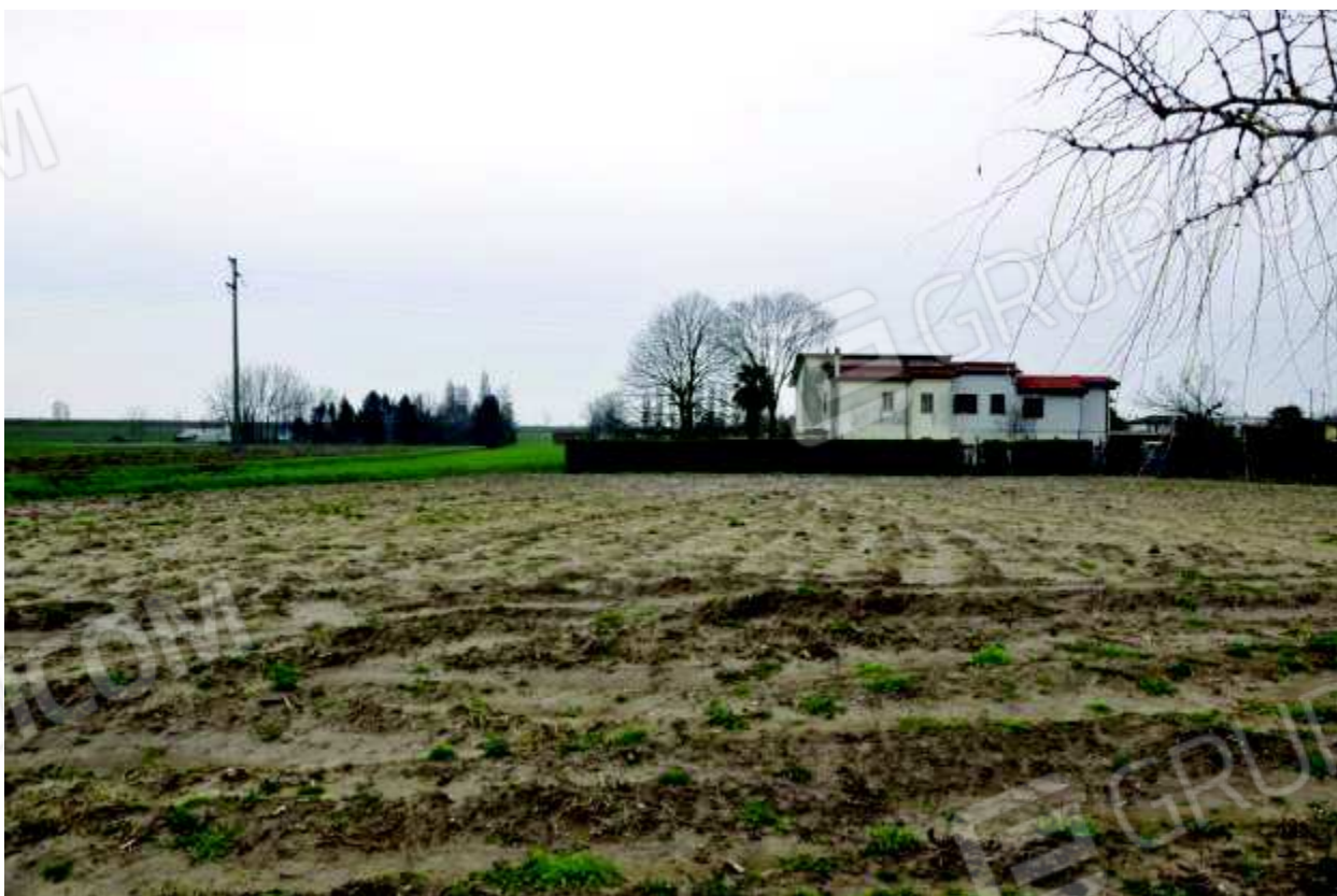
20. Porzione di terreno agricolo (mappale 426).