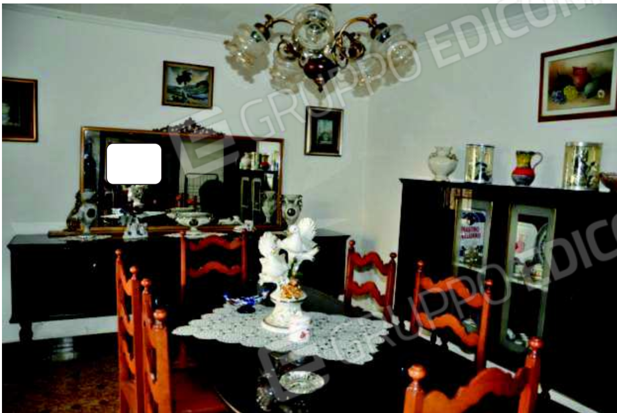
7 Zona salotto.