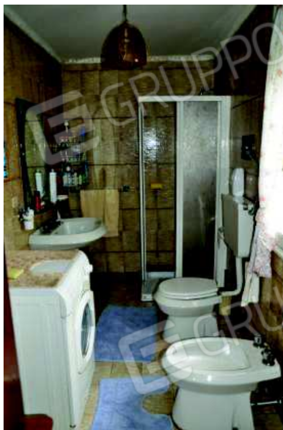
6. Cucina e bagno.