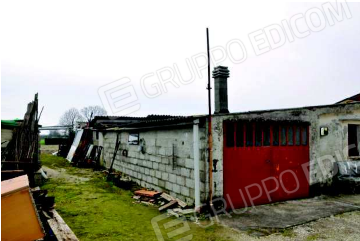
11 Fabbricato lato Nord, antistante la casa destinato ad uso ripostiglio, porcile e pollaio.