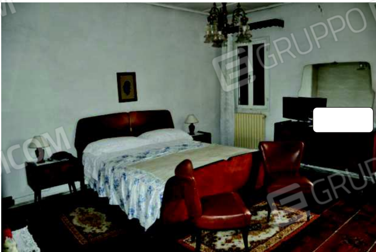
8 Camera da letto.