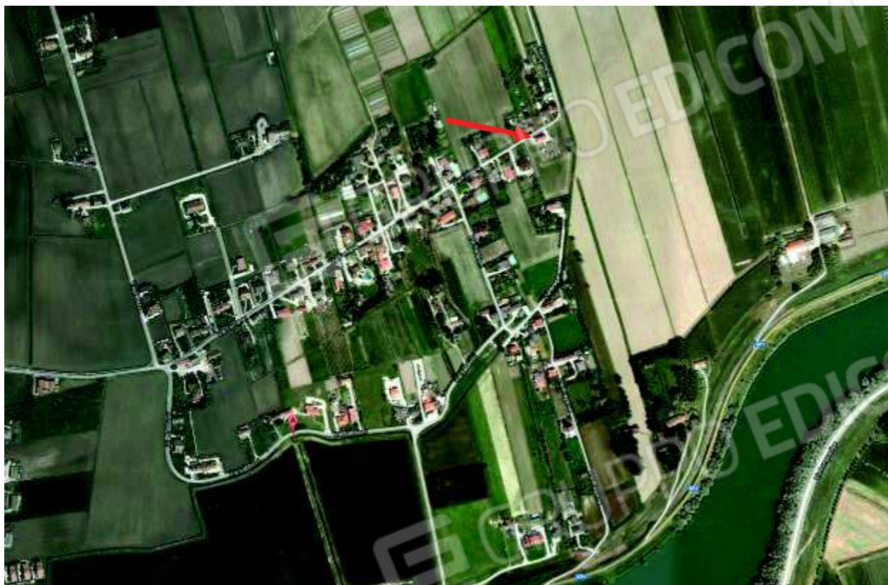
1. Individuazione dell'immobile sul territorio.