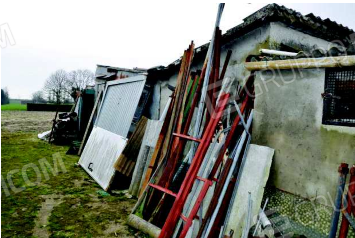
18 Fabbricato lato Est , adibito a deposito materiali.