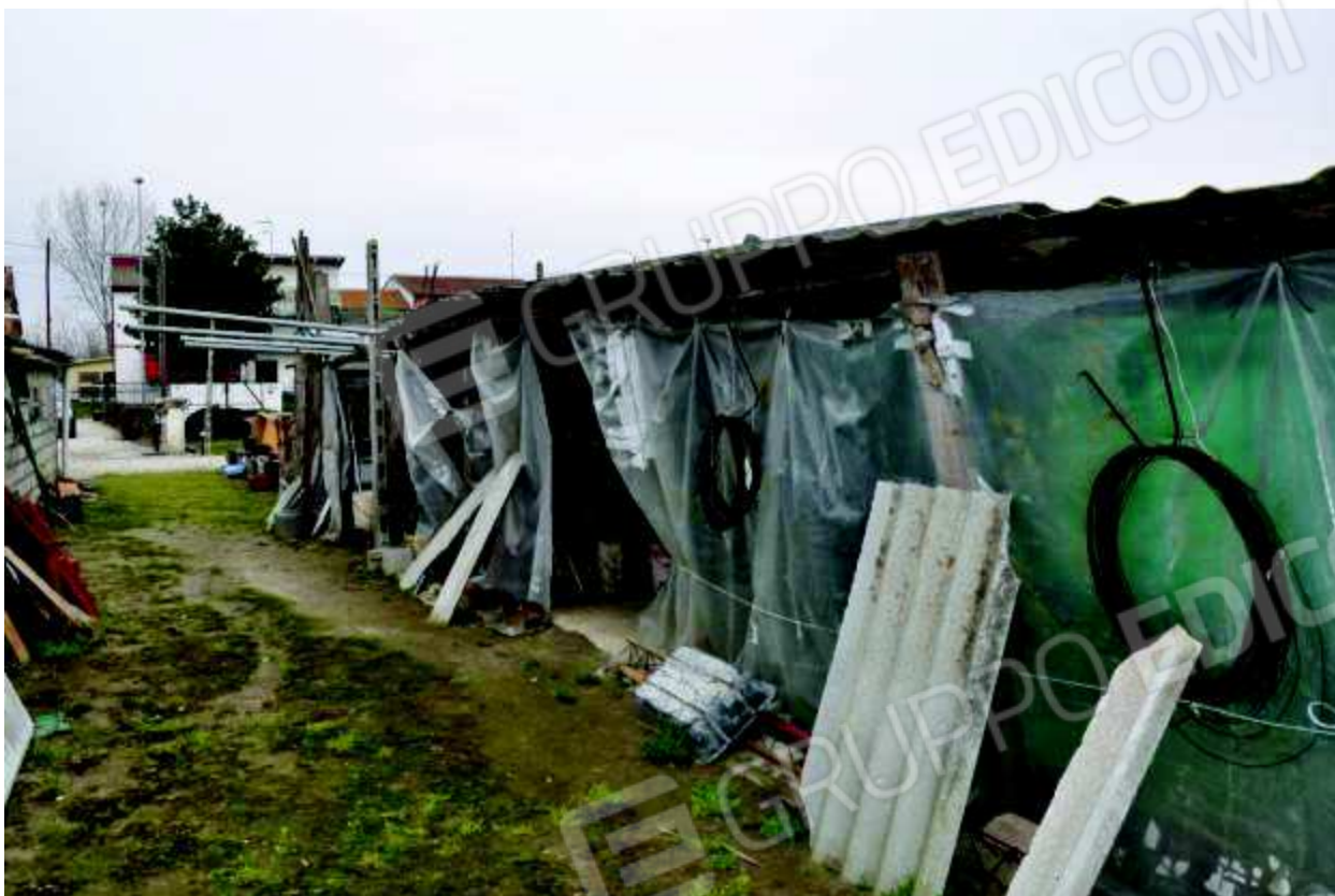
19 Tettoie abusive con tetto in Eternit.