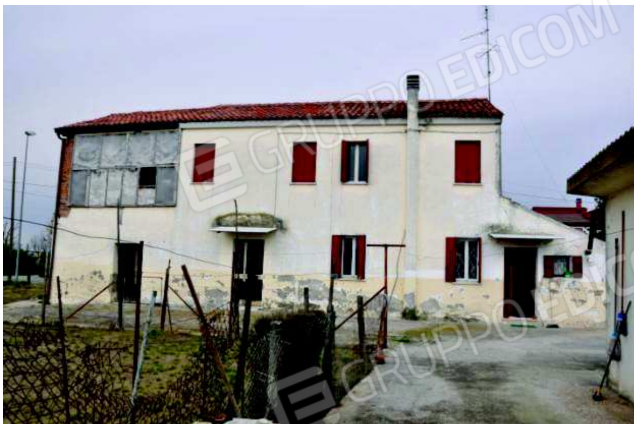
7. Vista dell'immobile lato Sud.