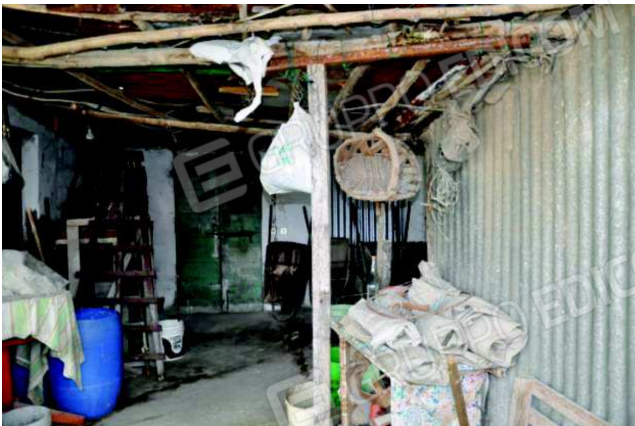
17 Porzione di interno del fabbricato.