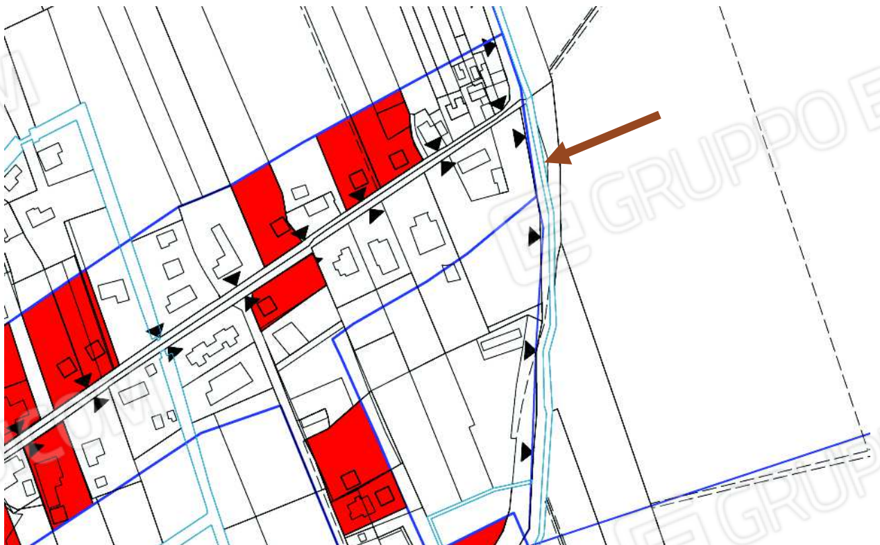
4. Individuazione su PRG tav.13 Zone significative.