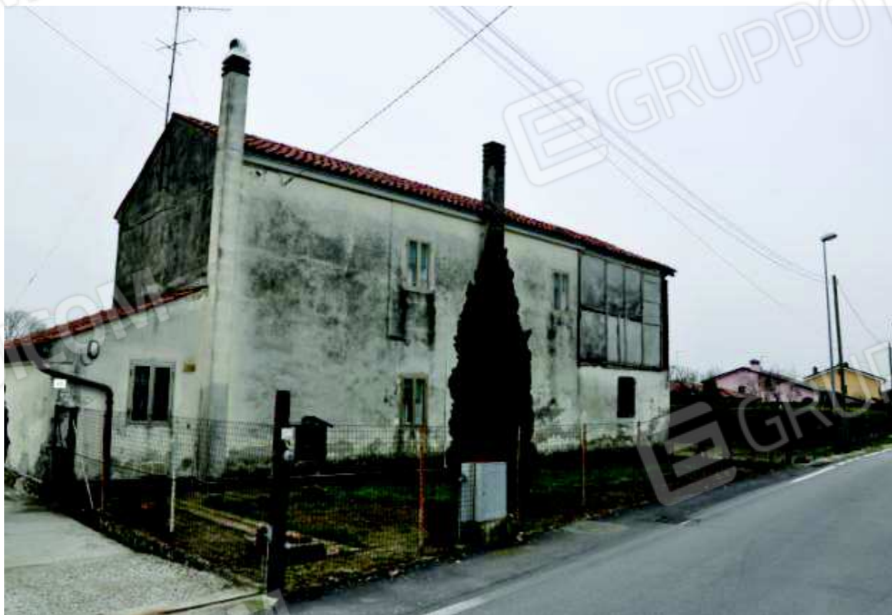
6. Vista dell'immobile lato Nord (Via Bragante).