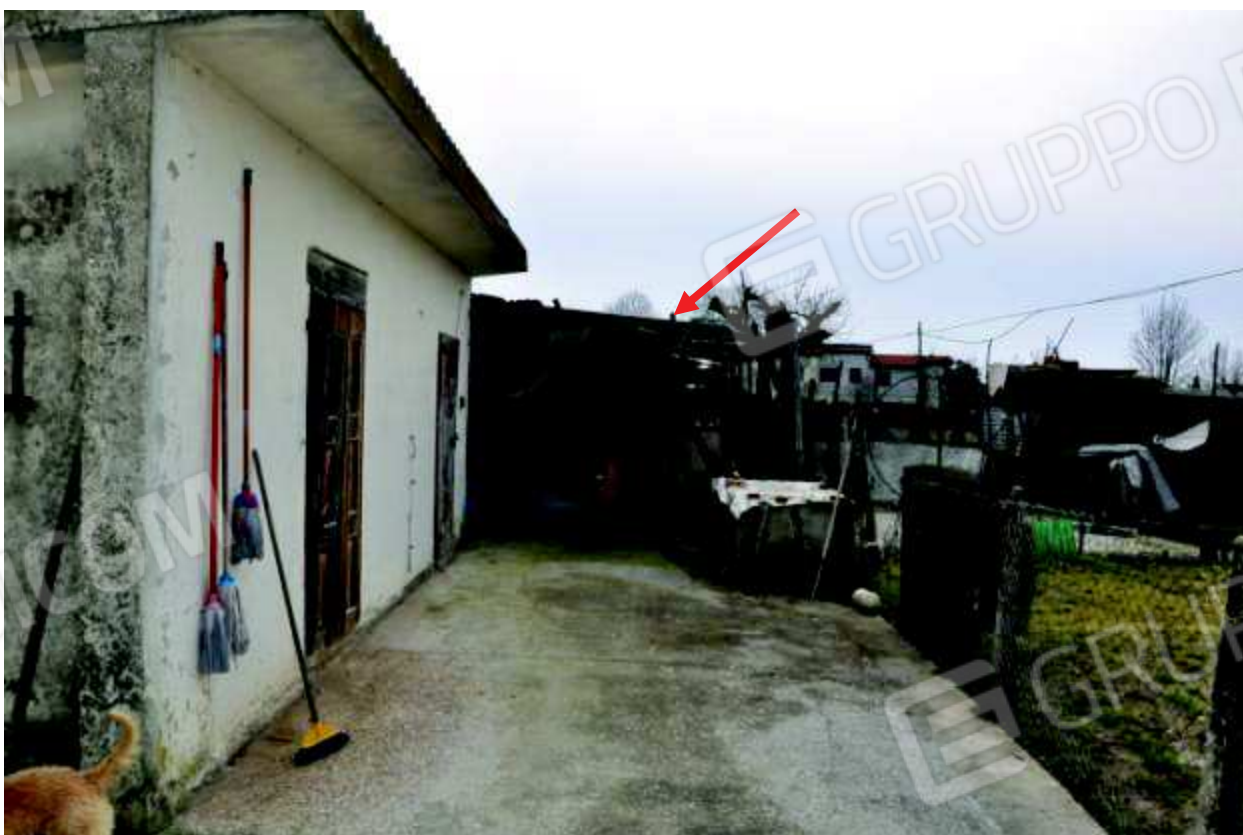
12 Fabbricato lato ovest (in rosso indicata la tettoia abusiva).