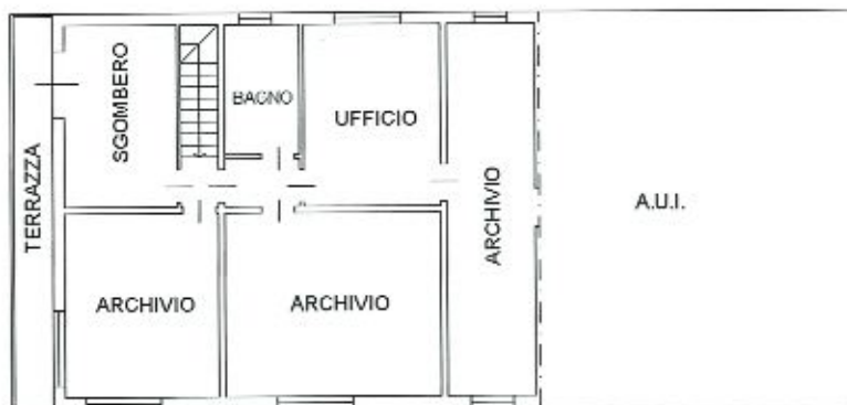
PIANO PRIMO 293