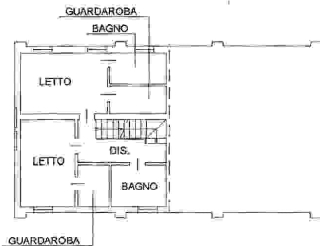
PIANO PRIMO H=2.70m