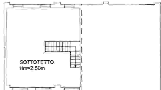
PIANO SECONDO Hm=2.50m