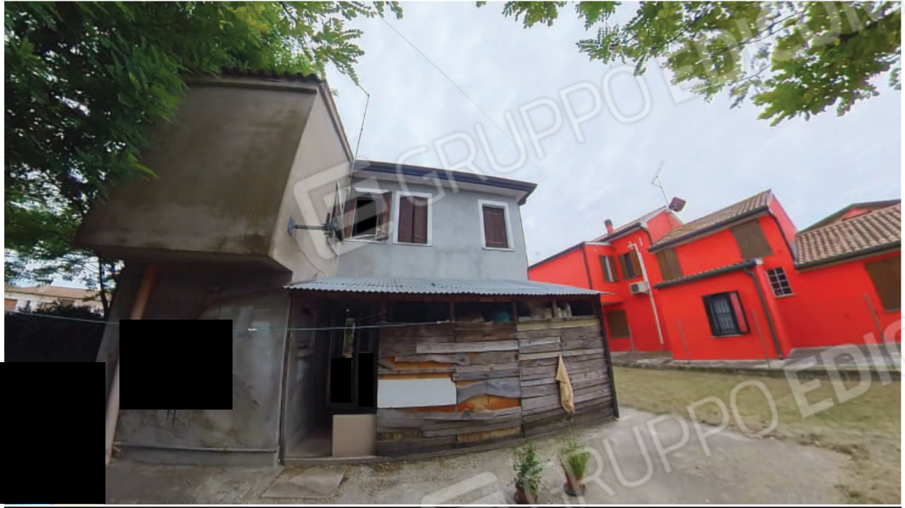
Figura 8 Lato Ovest abitazione