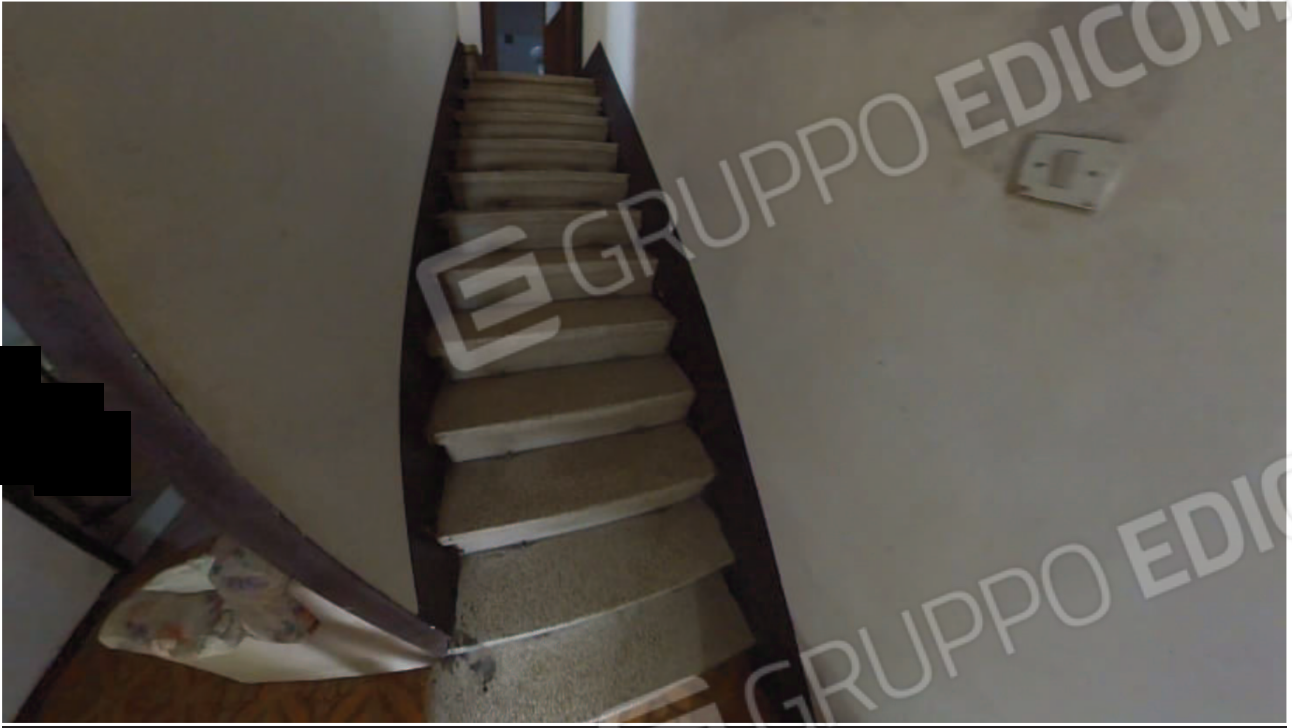
Figura 22 Interni abitazione piano terra