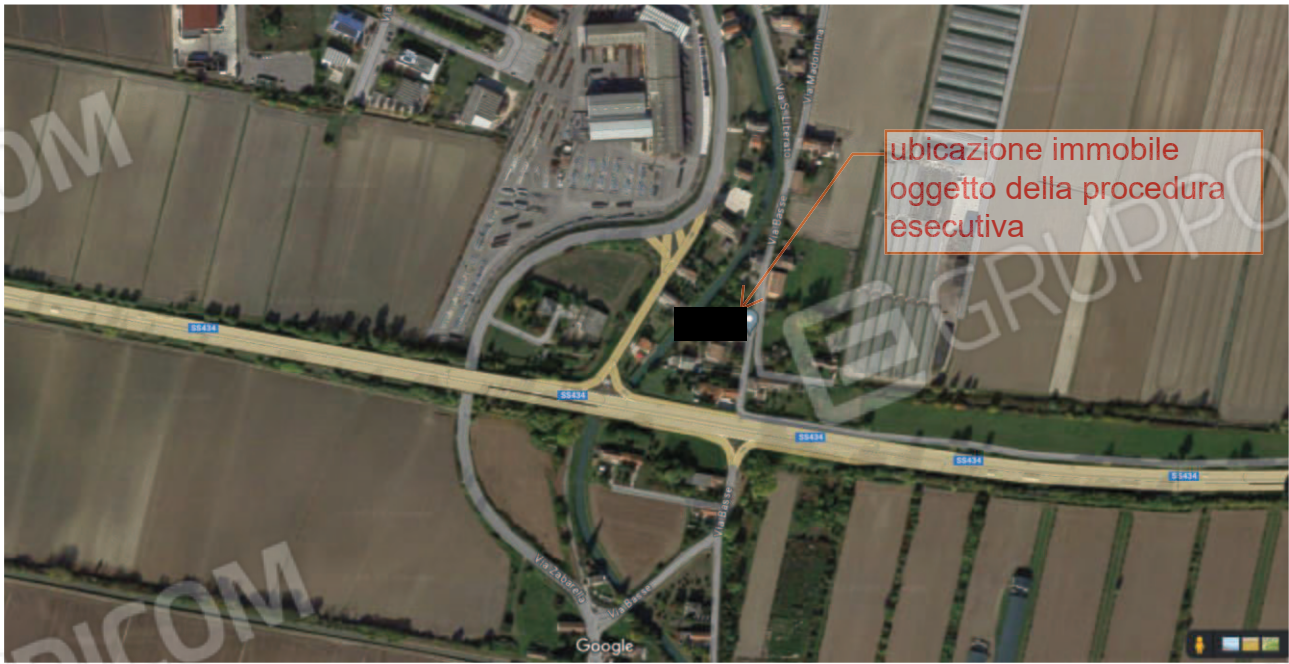
Figura 1 Veduta aerea