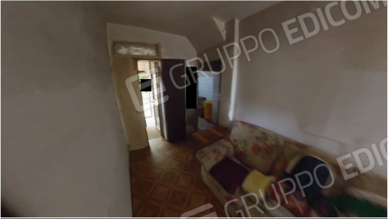
Figura 18 Interni abitazione piano terra