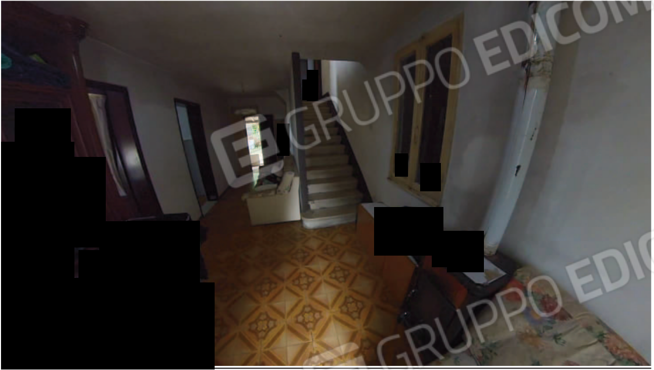
Figura 14 Interni abitazione piano terra