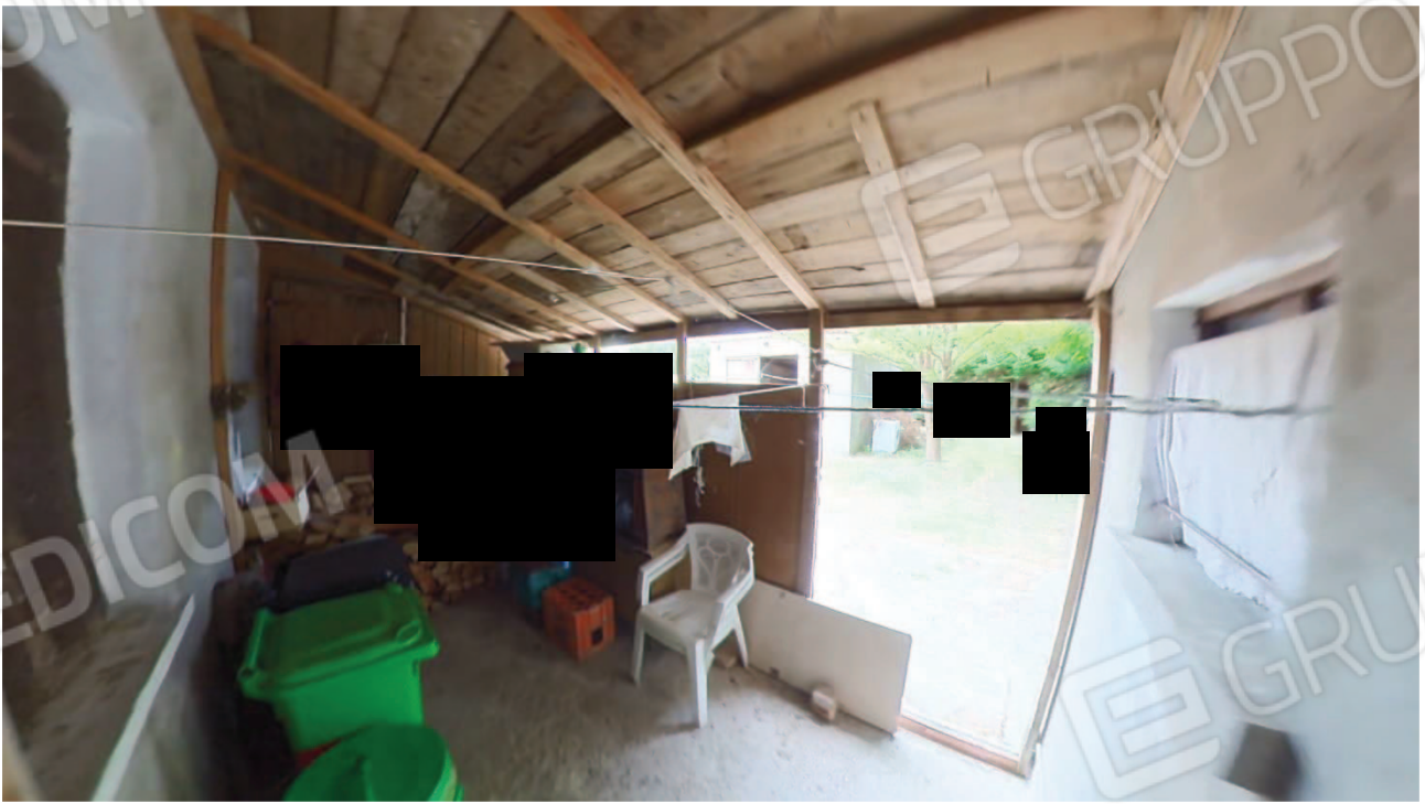
Figura 21 ampliamento abusivo