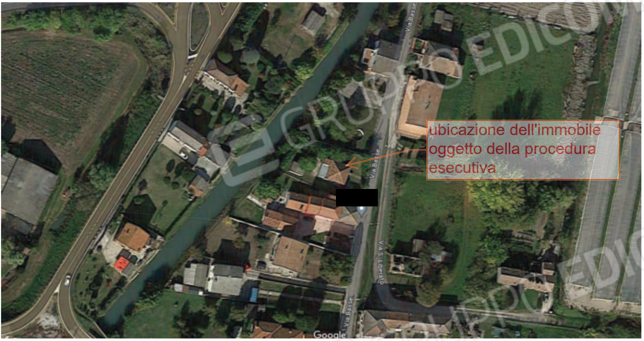
Figura 2 veduta aerea