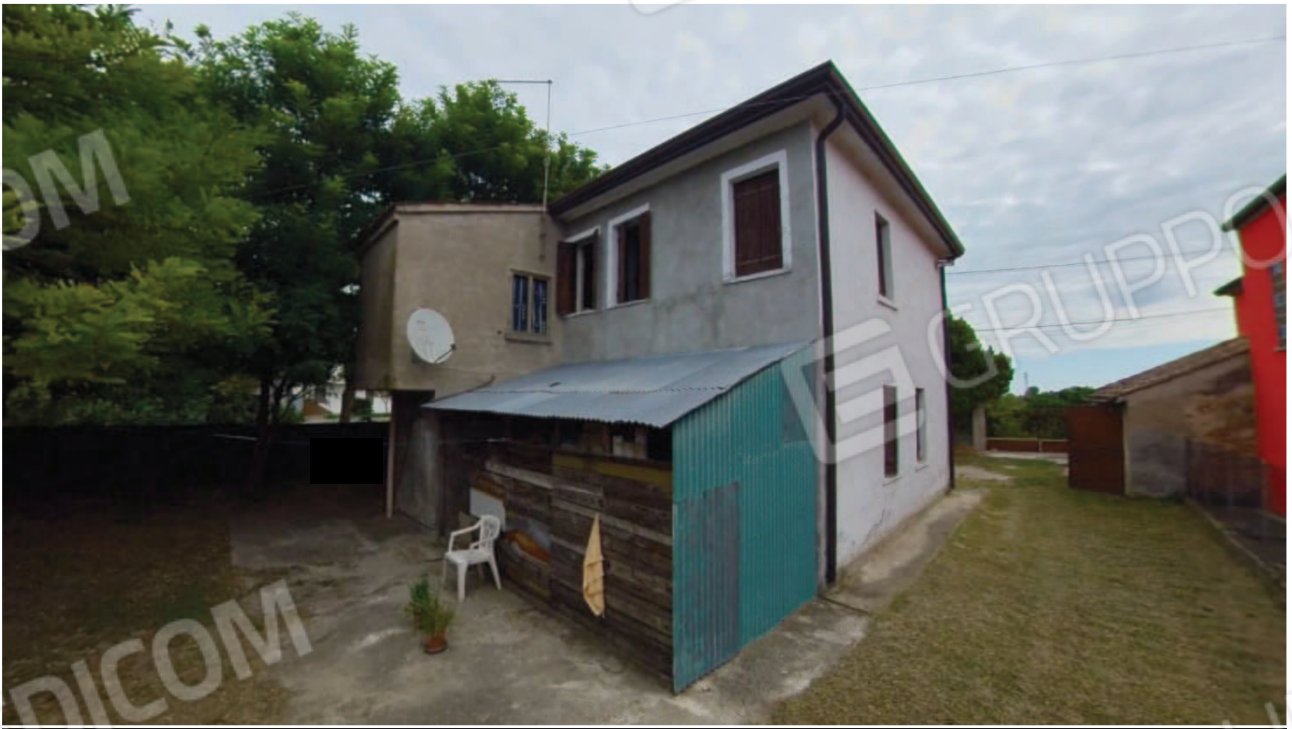
Figura 7 Esterno lati Sud e Ovest abitazione