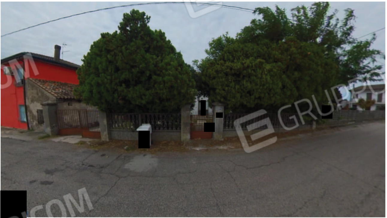
Figura 3 Veduta da Via Basse