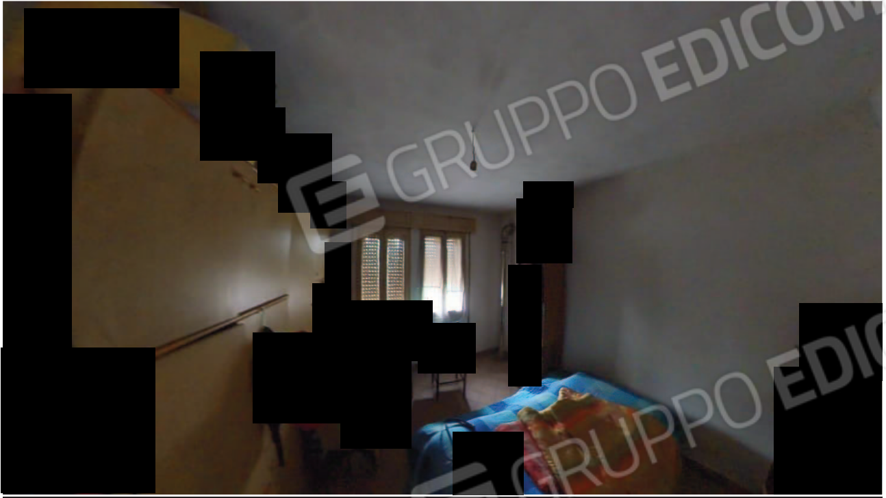
Figura 26 Interni abitazione primo piano