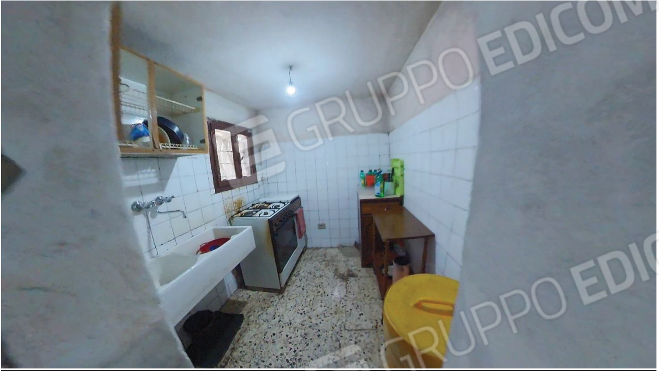
Figura 20 Interni abitazione piano terra