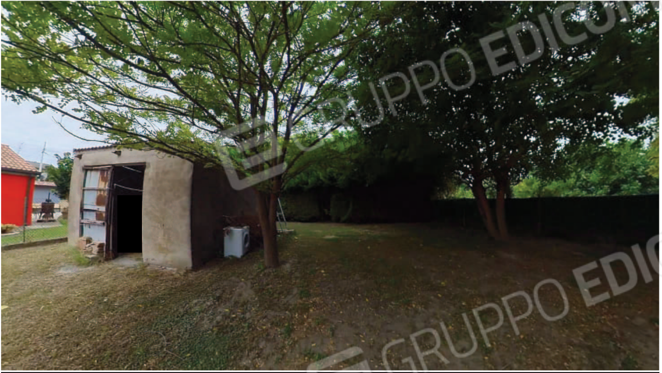
Figura 12 Pertinenza garage