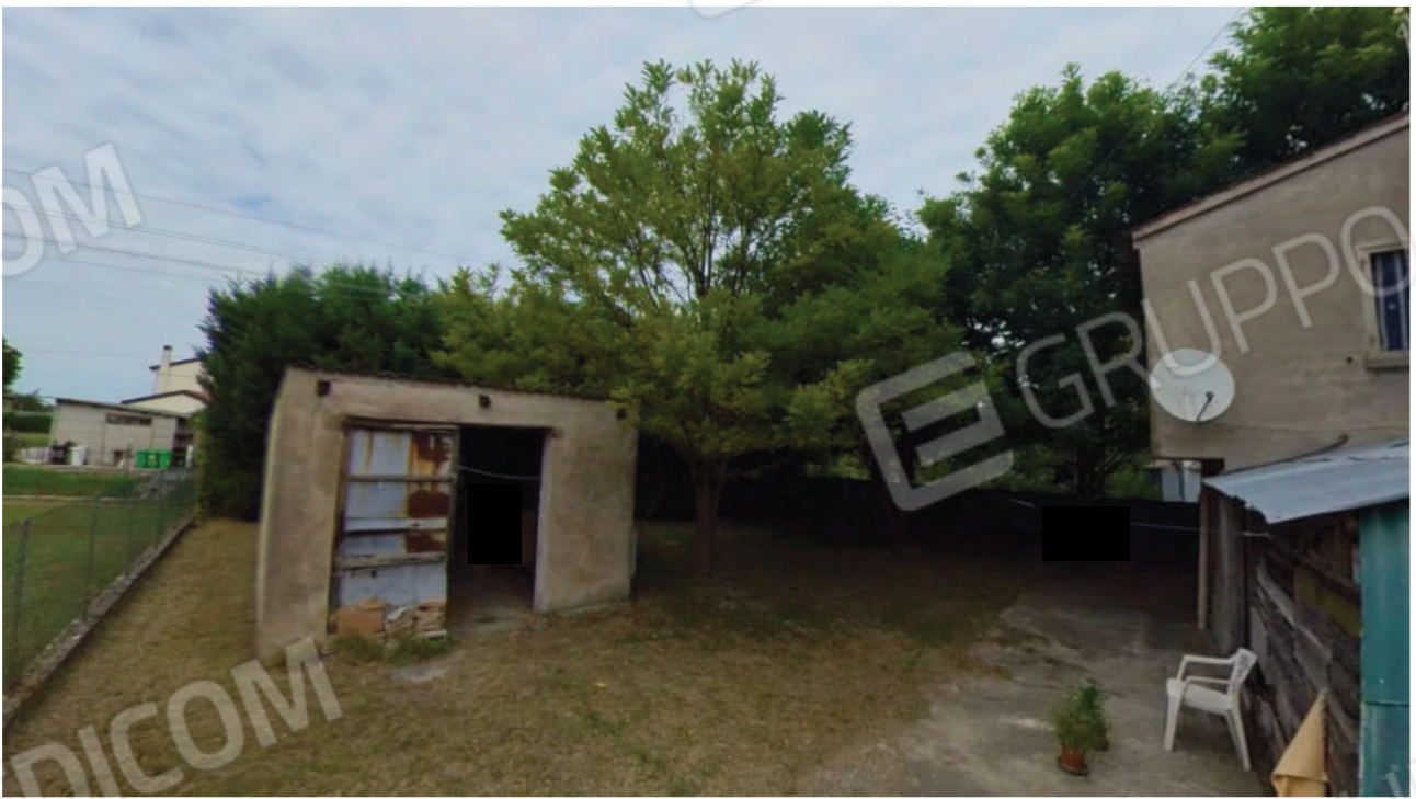
Figura 13 Pertinenza garage