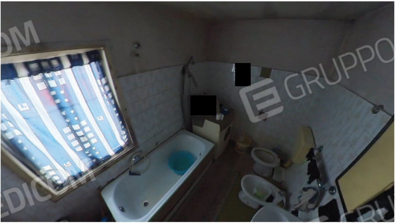
Figura 23 interni primo piano