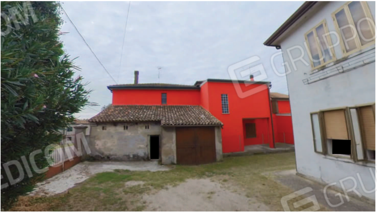
Figura 11 Pertinenza Cantina Garage