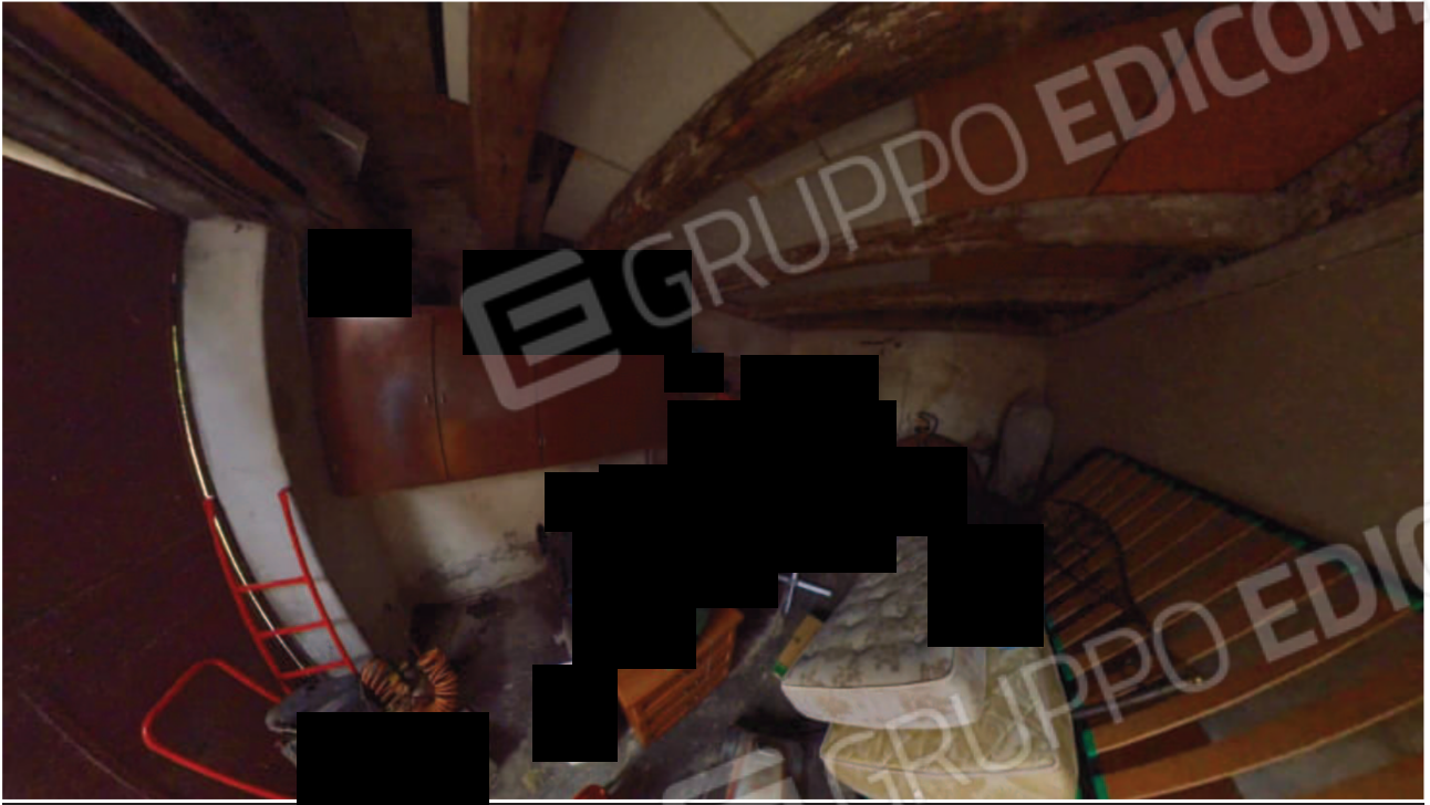
Figura 28 Interno pertinenza mn 90 sub 2