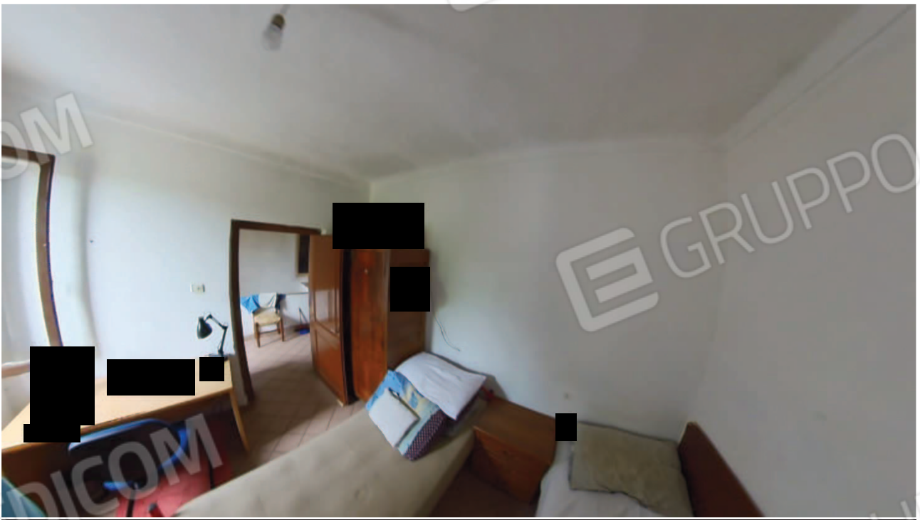
Figura 25 Interni abitazione primo piano