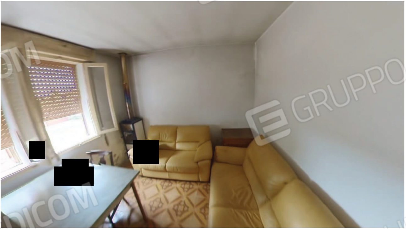
Figura 15 Interni abitazione piano terra