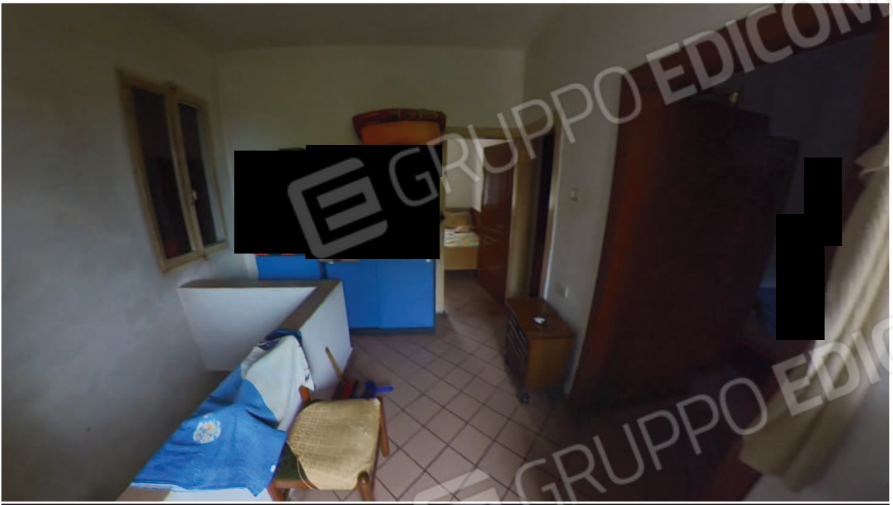
Figura 24 Interni abitazione primo piano