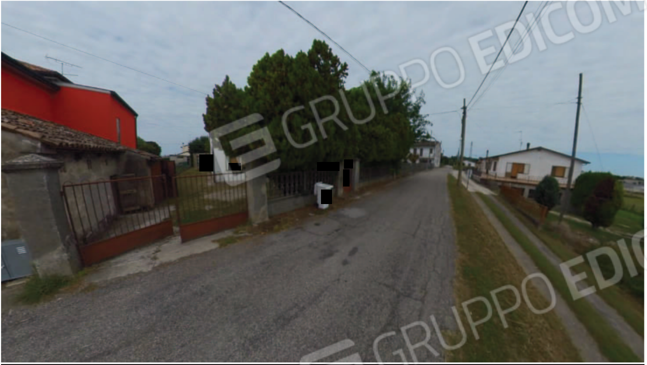
Figura 4 Veduta da Via Basse