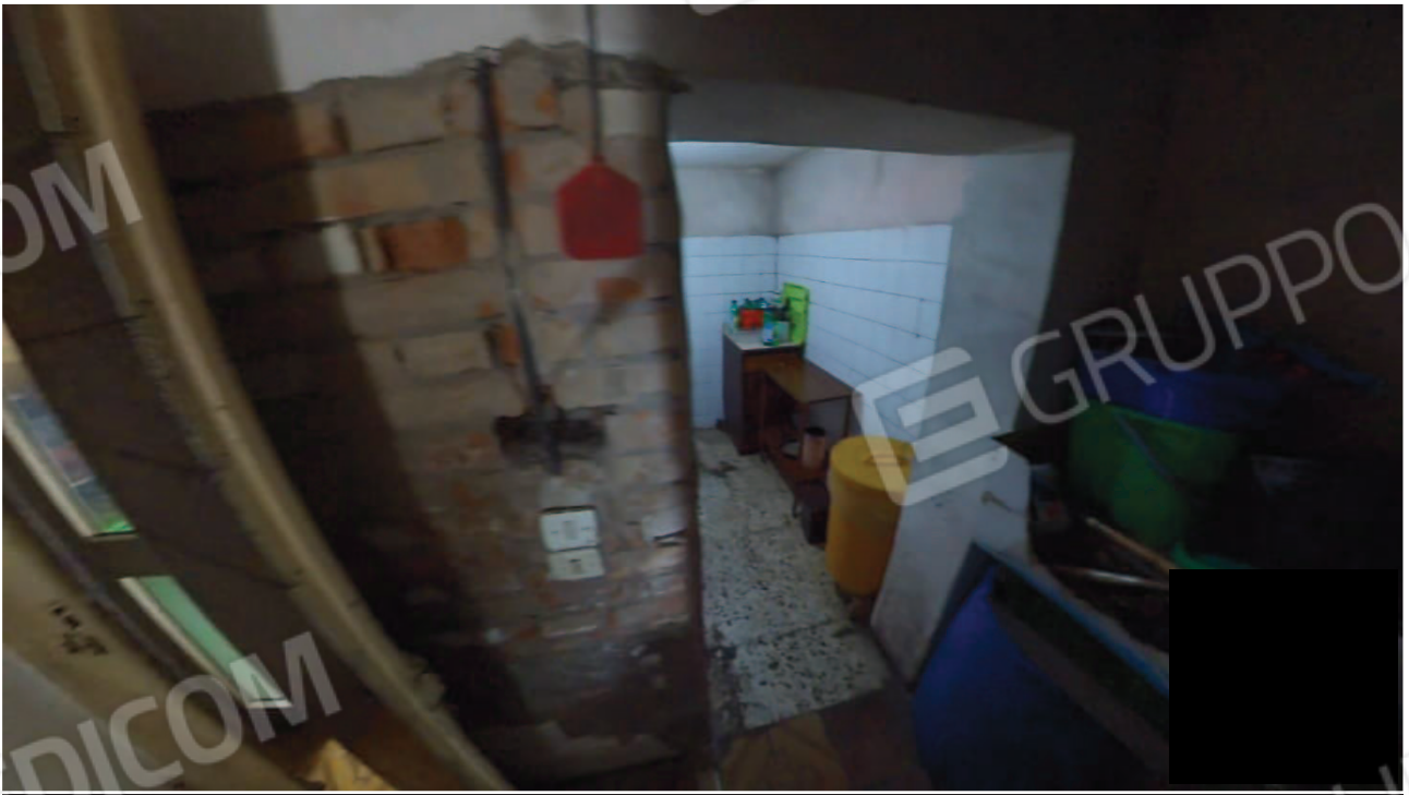
Figura 19 Interni abitazione piano terra