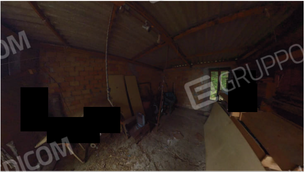
Figura 29 interno pertinenza mn 90 sub 3