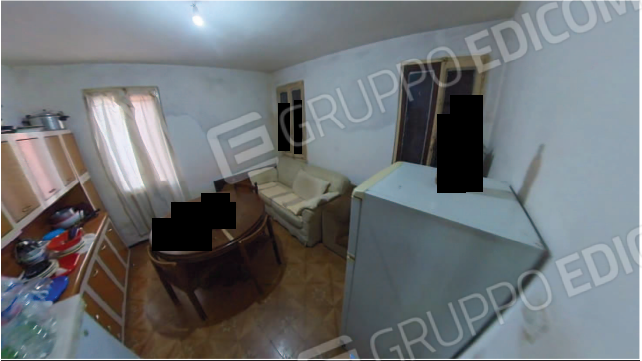
Figura 16 Interni abitazione piano terra