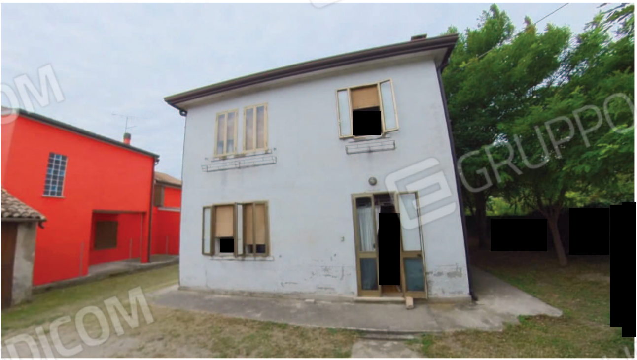
Figura 5 Esterno lato Est