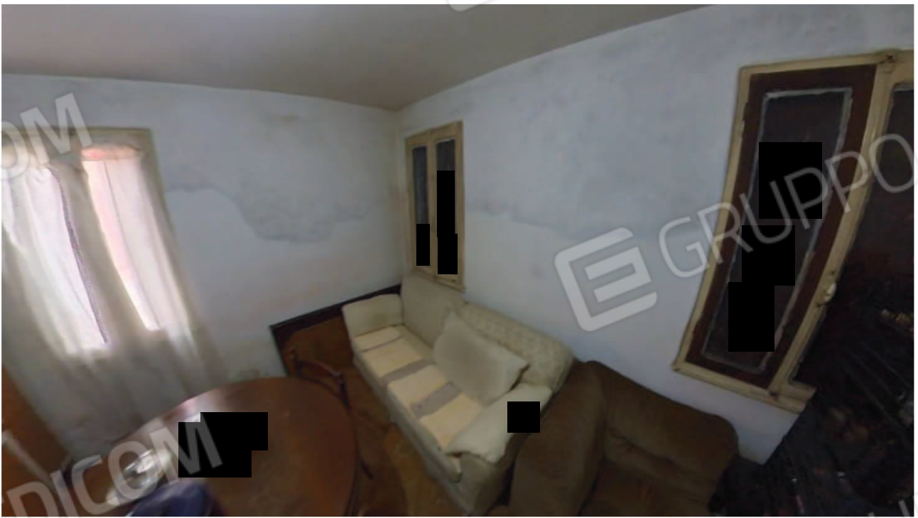
Figura 17 Interni abitazione piano terra