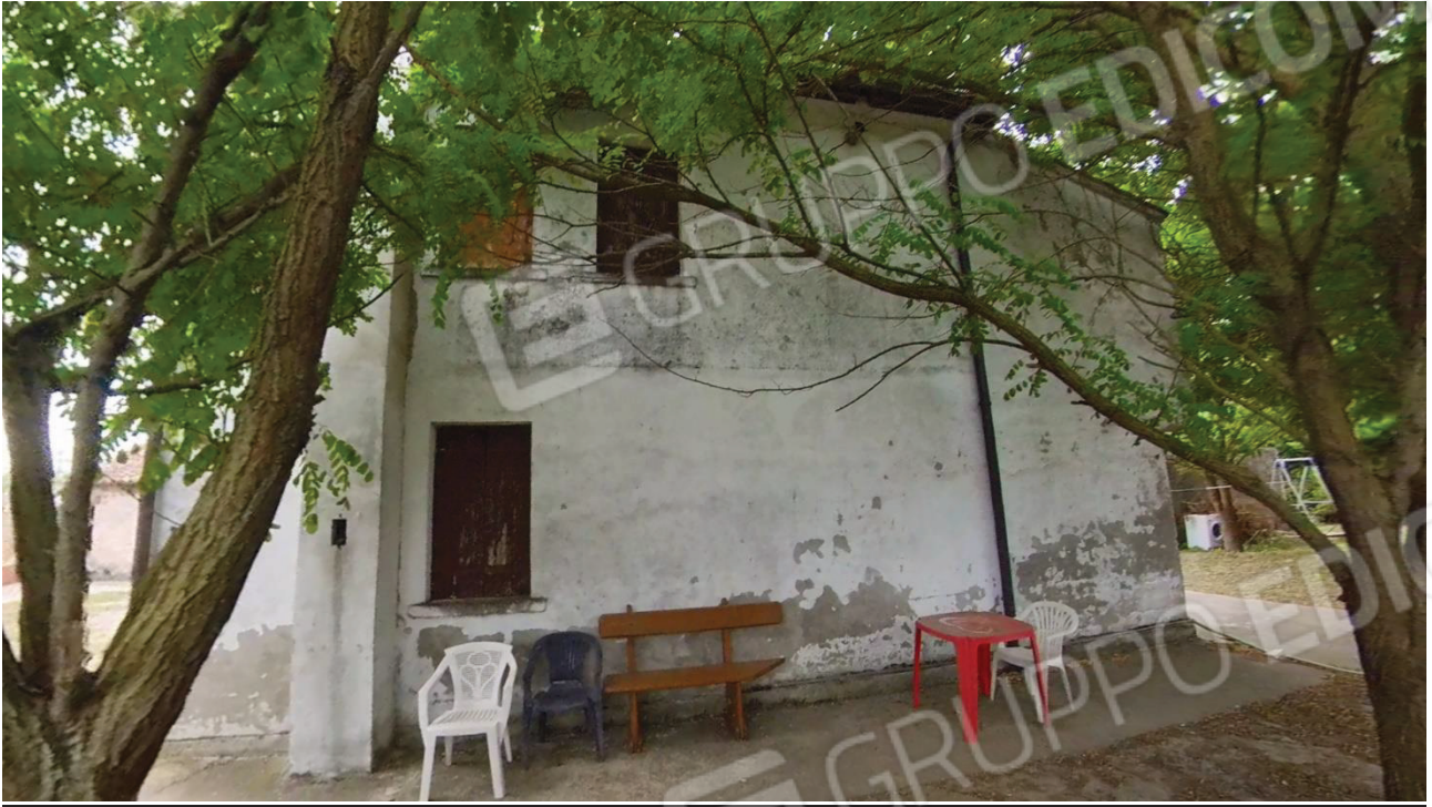
Figura 10 Lato Nord abitazione