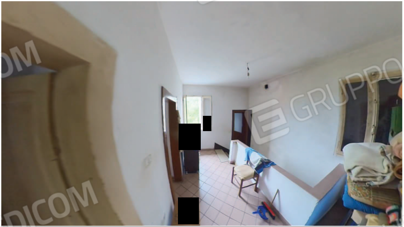
Figura 27 Interni abitazione primo piano