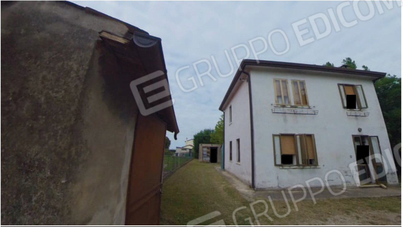
Figura 6 Esterno lato Est